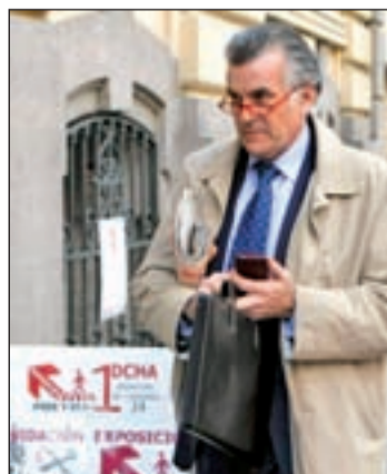
Luis Bárcenas