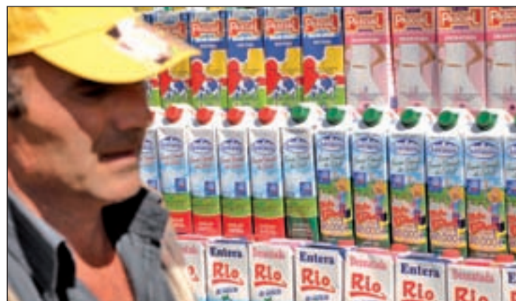
Productores de leche y Medio Ambiente condenados a entenderse

Desde el Ministerio de Medio Ambiente y Medio Rural y Marino se están manteniendo "contactos en profundidad" con la industria y la distribución "para evitar guerras que poco tienen que ver con el sector lácteo".