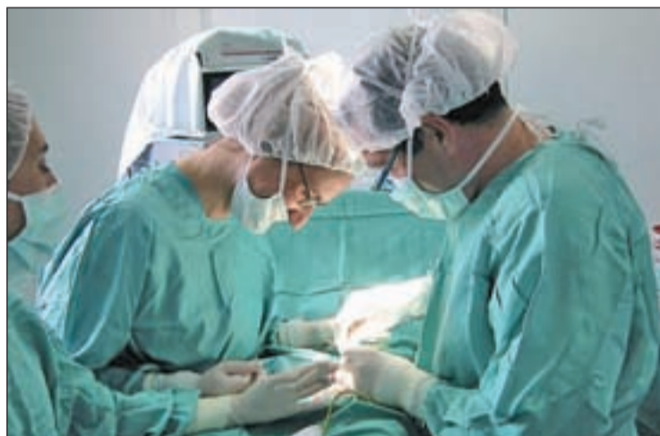
El Gobierno da luz verde a los profesionales médicos estracomunitarios

Por este motivo, “la prevención, tanto primaria como secundaria, debe tener el cien por cien de la importancia para la población”, añadió.