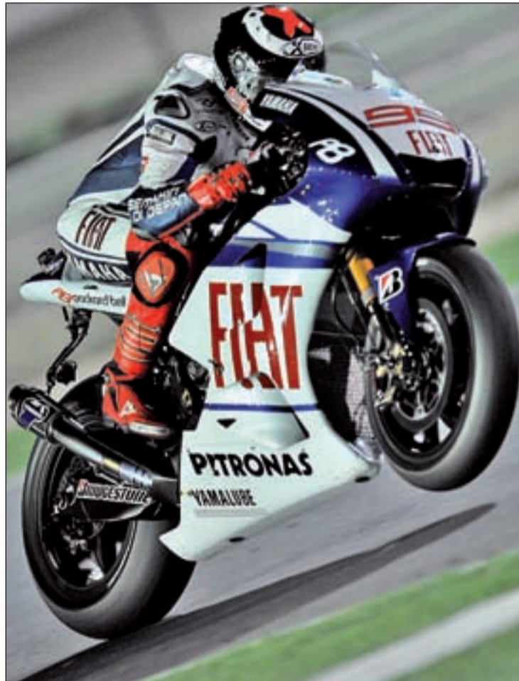
Jorge Lorenzo subió al podio en el circuito de Losail

Además de la lesión, Valentino Rossi es noticia por los rumores que le sitúan en la órbita de Ferrari para la próxima temporada. El presidente de la escudería italiana Luca Di Montezemolo ha hecho público su deseo de contar para el año que viene con tres monoplasas