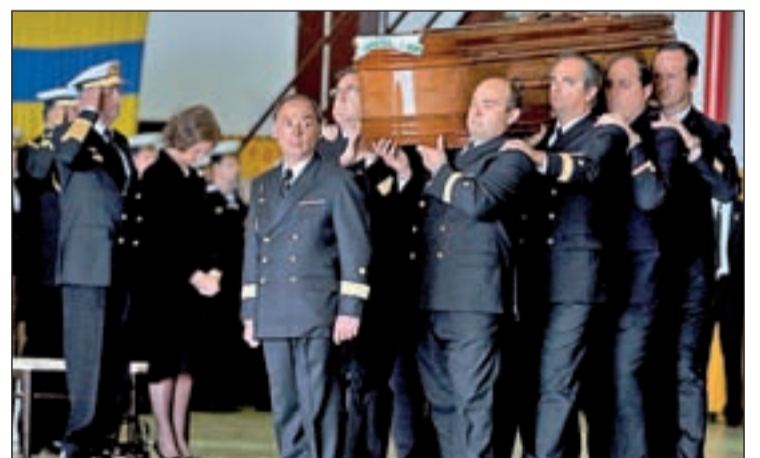
Los reyes, al fondo, en el funeral de los militares en Rota

En total, son más de 100 los fallecidos en este tipo de percances, tanto en territorio nacional como en suelo extranjero, muchos de ellos durante misiones humanitarias. Pero los datos, que al fin y al cabo son vidas, son más significativos si el foco se centra sólo el misionero en el exterior. Desde 1987 hasta este mismo febrero, en te-