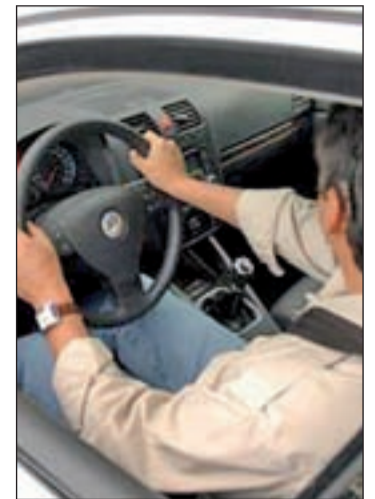
Un conductor al volante

Pero la pérdida de puntos crece y ya son más de 565.000 los conductores a los que tan sólo les queda la mitad de sus puntos. Igualmente, la reincidencia es un hecho. En España, 7.400 conductores han perdido 20 puntos, o lo que es lo mismo,