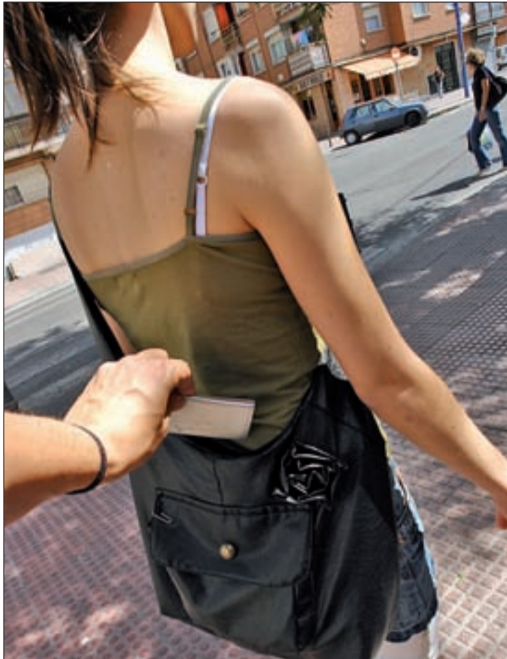
Un hombre roba la cartera a una chica

Otro de los apartados que engloba esta modificación penal será la posibilidad de condenar con prisión la reincidencia por estas faltas. Hasta ahora un delincuente podía acumular decenas o centenares de cargos por hurto y no podía pasar a la cárcel a pesar de su reincidencia ya que la ley no contemplaba estas penas para las faltas. Este cambio ha devuelto a la palestra el hacinamiento de las cárceles, y ante la evidencia del colapso que produciría enviar a estos delincuentes a la prisión los impulsores de estos cam-