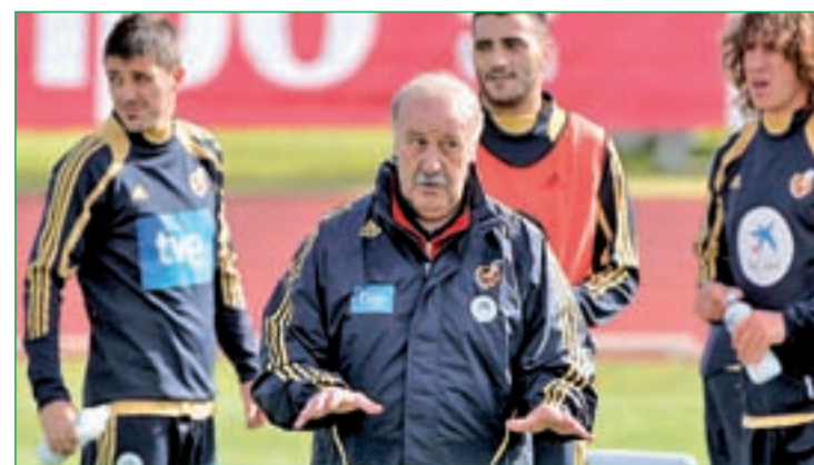
Del Bosque ya prepara intensamente el Mundial

aparecen algunos futbolistas que si bien no han tenido cabida en las últimas convocatorias, continúan en la mente del salmantino. Así, Javi Martínez, Fernando Llorente o el defensa osasunista César Azpilicueta podrían ver recompensada su gran temporada viajando a Sudáfrica en el mes de junio.