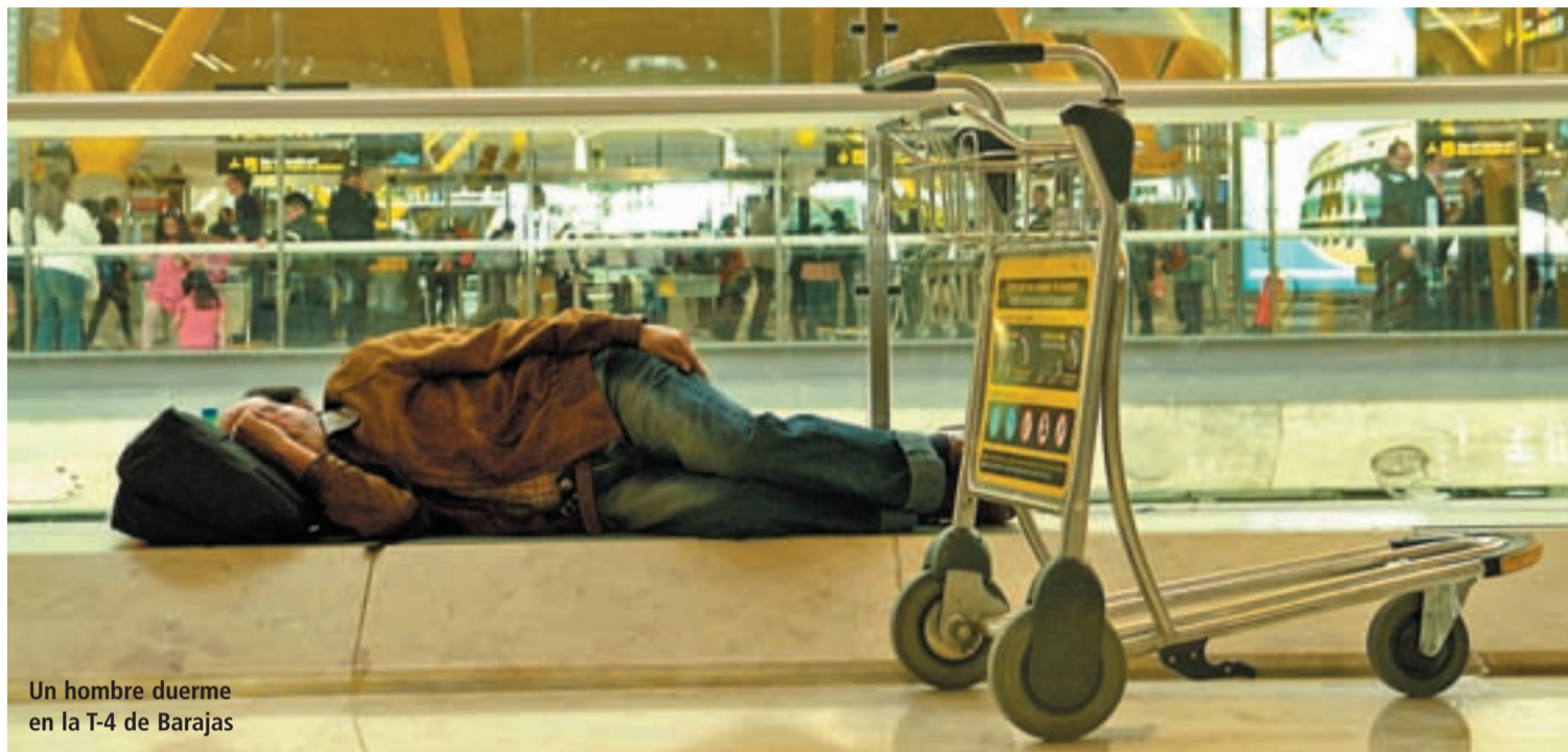
Un hombre duerme en la T-4 de Barajas