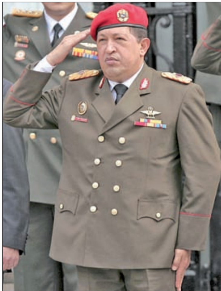
Hugo Chávez saluda al paso de las tropas en el desfile

Los trajes militares contrastaban con el colorido de las vestimentas indígenas procedentes de las diversas regiones de Venezuela. Una celebración masiva bajo el lema 'Independencia y revolución'. Una consigna que Chávez parafraseó en repetidas ocasiones. "Civiles y militares unidos, el pueblo y su fuerza armada, garantizando la independencia venezolana, la independencia de la patria. Más nunca Venezuela será colonia yanqui ni colonia de nadie", expresó Chávez vestido con traje