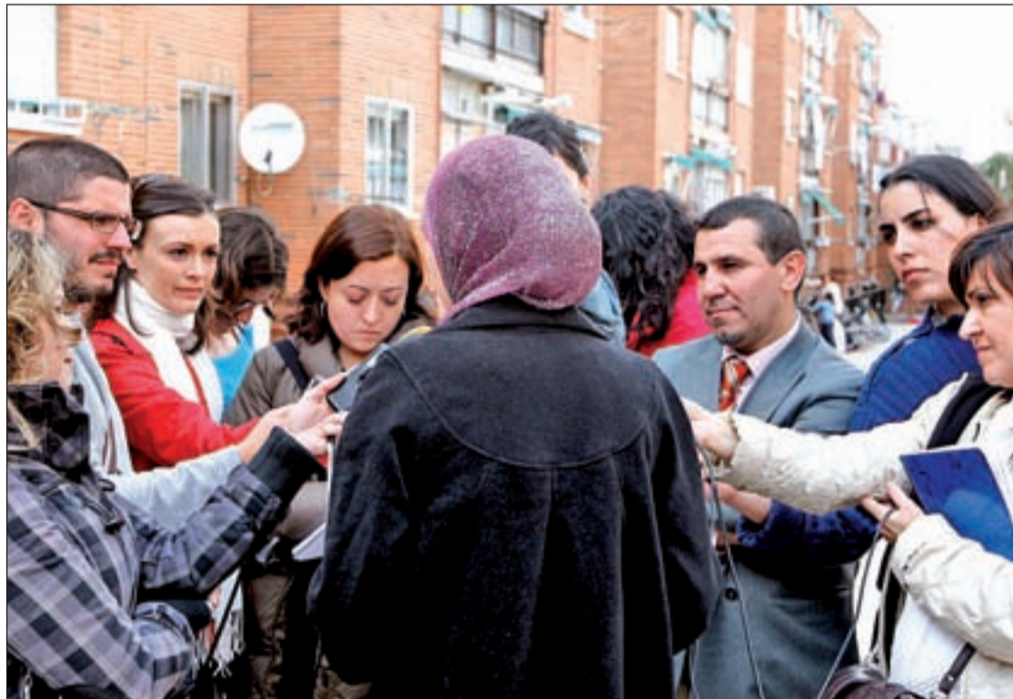
Nawja atiende a los periodistas en la entrada del IES Camilo José Cela de Pozuelo, en Madrid

La consejería del ramo de la Comunidad de Madrid ha confirmado que a petición de la Dirección del IES el traslado a un instituto que sí admita el yihab en el mismo municipio se reali-