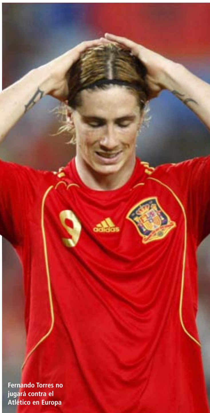
Fernando Torres no jugará contra el Atlético en Europa

Las hipotéticas bajas de estos jugadores mermarían sensiblemente el potencial de un equipo que aparece en todas las quinielas como uno de los favoritos al alzarse con el trofeo de campeón del mundo. Una de las señas de identidad de la selección, el juego de toque, podría verse afectado ya que dos de sus grandes exponentes, Iniesta y Fábregas, estarían ausentes. El jugador del Barcelona lleva un año para olvidar con tres lesiones musculares que le han hecho perderse dieciocho partidos de su equipo en todas las competiciones. Menos preocupante es el estado físico del capitán del Arsenal que cayó lesionado en el partido de ida de