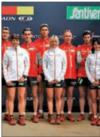
Integrantes del equipo