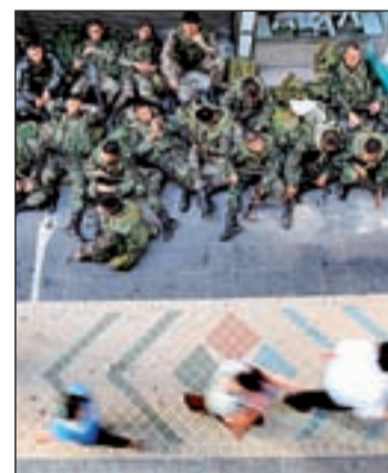
Soldados en el centro financiero

na. Este nuevo giro ha alertado a los mercados de todo el mundo ya que este país es una de las principales economías asiáticas. Desde el inicio de las protestas han muerto veinte personas y más de 500 han resultado heridas en enfrentamientos entre manifestantes y el Ejército.