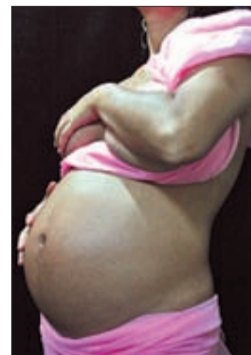
Protéjase durante el embarazo

"Las hormonas de los ovarios estrógeno y progesterona aumentan el riesgo de cáncer de mama pero se desconocen los mecanismos celulares que median el proceso". Subrayan que las hormonas dirigen un aumento en el número de células madre mamarias, mientras