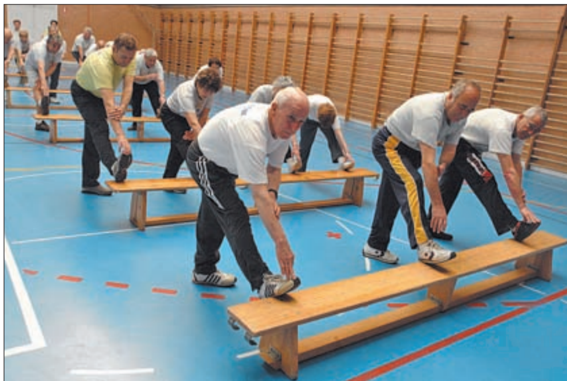
La lectura, ir al cine, escuchar música y la actividad física, buenas terapias contra el Parkinson

LOS EXPERTOS OBSERVAN MEJORÍAS EN LOS ASPECTOS COGNITIVOS TRAS LA GIMNASIA