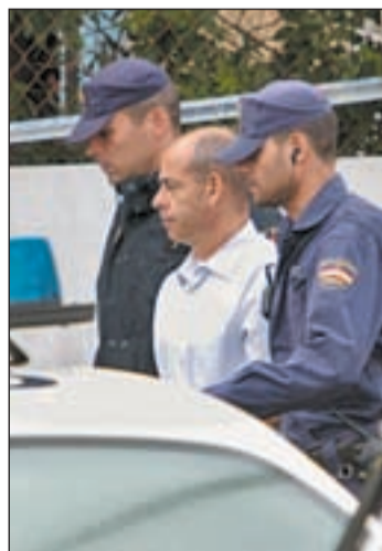
El principal imputado del caso