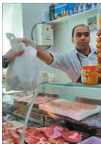
Carne 'halal'