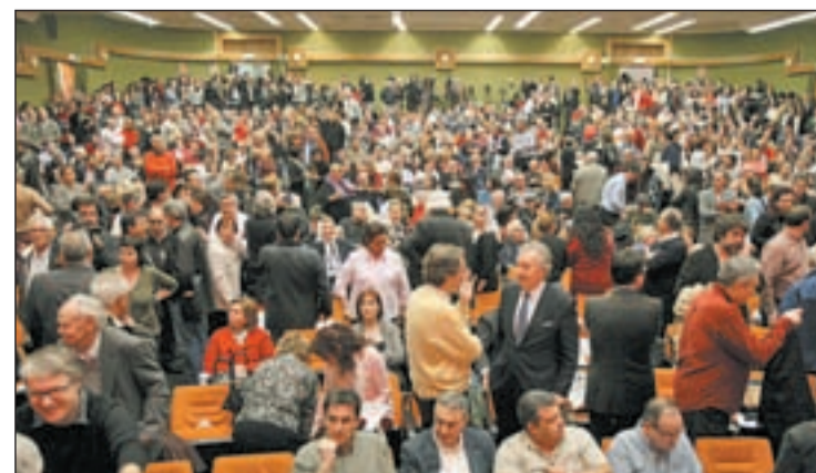
Miles de personas reunidas esta semana en apoyo a Garzón