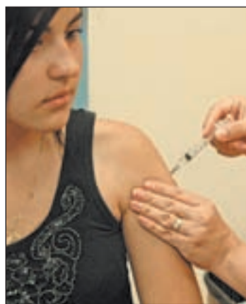
La vacuna contra el VPH

Dexeus explicó que hay 150 tipos de virus, la mayoría de los cuales son "transitorios", lo que significa que son eliminados por el mismo sistema inmunitario del hombre.