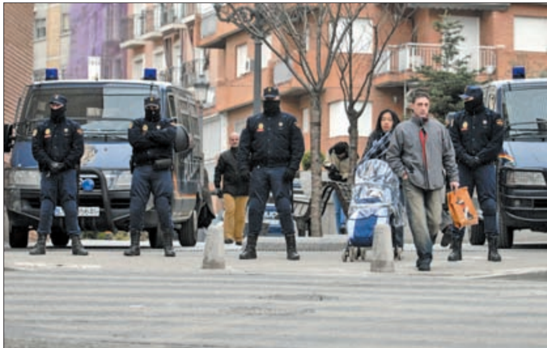
Foto de archivo de la presencia policial en Alcorcón, Madrid, en sus disturbios de 2007