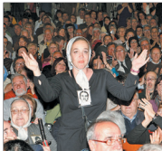
Acto de apoyo a Garzón en la Complutense de Madrid

Miles de personas han acudido a lo largo de esta semana su apoyo a Baltasar Garzón, tras conocer que el Supremo le juzgará por un delito de prevaricación ligado a su investigación de los crímenes del franquismo. Políticos, intelectuales, artistas, estudiantes, académicos, sindicalistas, representantes de las abuelas de la plaza de Mayo, se reunieron el pasado martes en la Universidad Complutense de Madrid para expresar su "indignación" por este proceso judicial que califican de "caza de brujas". No obstante, las duras palabras vertidas en este foro, como las del ex fiscal anticorrupción Carlos Jiménez Villarejo, quien señaló que los magistrados del Supremo, al haber formado parte del Tribu-