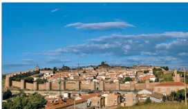
Ávila fue declarada Ciudad Patrimonio de la Humanidad el 8 de diciembre de 1982.

Entre las actividades programadas a lo largo del año, que culminarán el 4 de diciembre con tres actos institucionales, público y cultural, figuran una exposición "magnífica" que llevará por título "Testigos de la historia" en los Vestibulos.