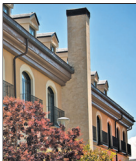
Exterior y detalle del interior del Hotel Fontecruz.

En relación a los servicios de catering, cada vez más se opta por esta posibilidad en celebraciones que se llevan a cabo en fincas al aire libre, para lo que hay que tener en cuenta la climatología prevista para la fecha del enlace, con el fin de no chafar con frío o lluvia la celebración.