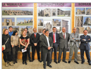
Entidades implicadas en la mesa de contratación del turismo religioso.

Esta organización, que aglutina en la actualidad a entre "40 y 50" establecimientos hoteleros de la capital y la provincia, también ha pedido mejoras en la señalización para facilitar el acceso de los visitantes a hote-