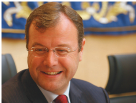
El consejero de Fomento, Antonio Sívila, compareció en las Cortes el pasado lunes 12 de abril.

Dadas las condiciones orográficas y geográficas de esta Comunidad Autónoma, acometer cualquier tipo de actuación de despliegue de infraestructuras de telecomunicaciones exige un enorme esfuerzo, tanto en inversión