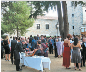
Jardín interior del Parador de Ávila.

En el Hotel Palacio de Los Velados se proponen convertir sus sueños en realidad. De esta manera, ponen a disposición de los conyugados un marco ideal para amarrar de cuerno que han dado lugar a legendarias leyendas, con acceso directo por la entra-