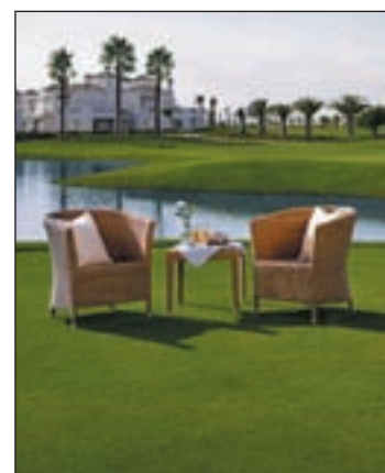
Parque de Polaris en Murcia

gó un mes más para convencer a los acreedores. Mientras la entidad está liquidando parte de sus sociedades acopiando capital y negocia con los bancos Caja Murcia, Banco Popular, Caja de Ahorros de Mediterráneo y algunas entidades extranjeras, su viabilidad.