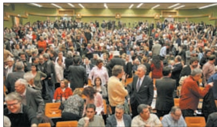
Miles de personas reunidas esta semana en apoyo a Garzón