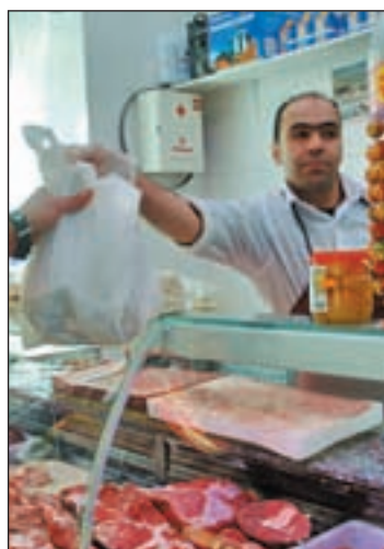
Carne 'halal'