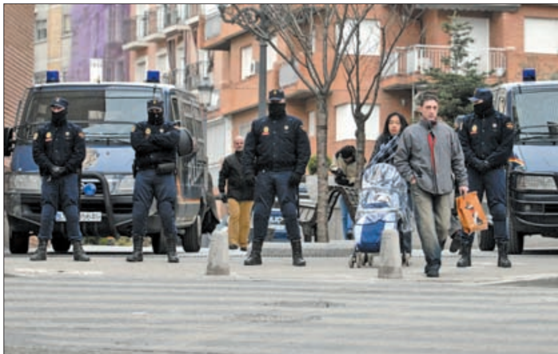
Foto de archivo de la presencia policial en Alcorcón, Madrid, en sus disturbios de 2007

Y es que el del Cabanyal es el último ejemplo de un tema de permanente actualidad. Por ejemplo, a lo largo del año 2008 fueron presentadas 371 denuncias por parte de ciudadanos a agentes policiales por abuso violento de la autoridad.