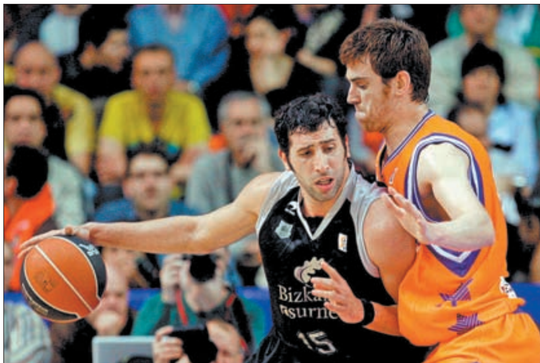
Valencia y Bilbao ya se vieron las caras en la última jornada de la Liga ACB

TORNEO CONTINENTAL LOS CUATRO MEJORES EQUIPOS SE CITAN EN EL BUESA ARENA