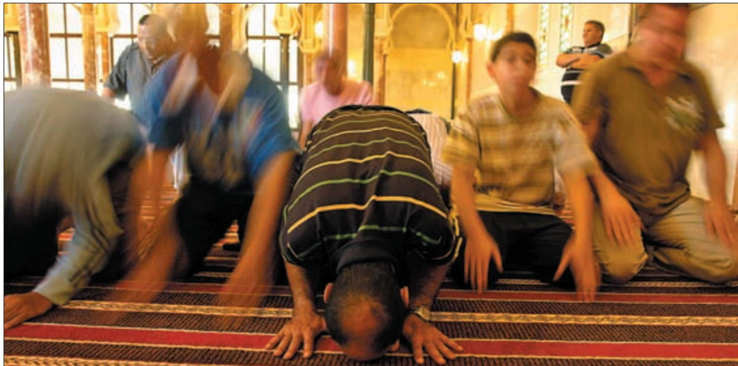
Un grupo de mulsulmanes ora en una de las mezquitas ubicadas en nuestro país

BARÓMETRO DE LA COMUNIDAD MUSULMANA QUE RESIDE EN ESPAÑA