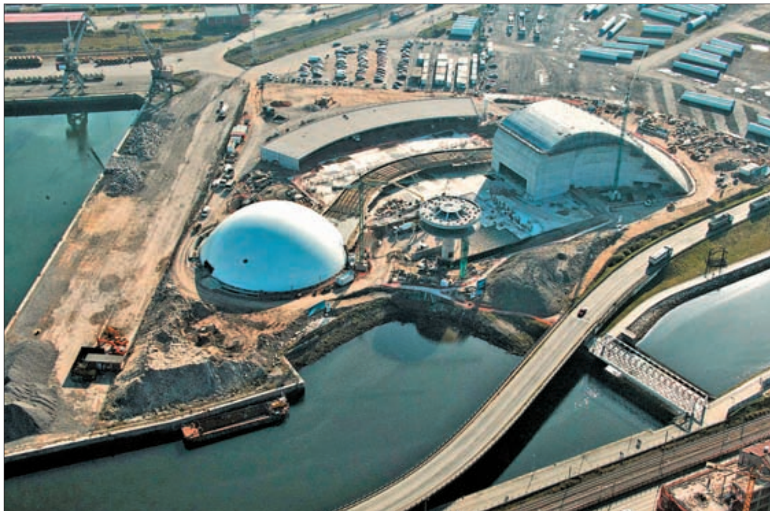
Imagen aérea del avance de las obras del centro Niemeyer de Avilés

Cuenta atrás para la apertura del centro • Editan un sello conmemorativo con este referente cultural • Su agenda está repleta de personalidades Pág. 4