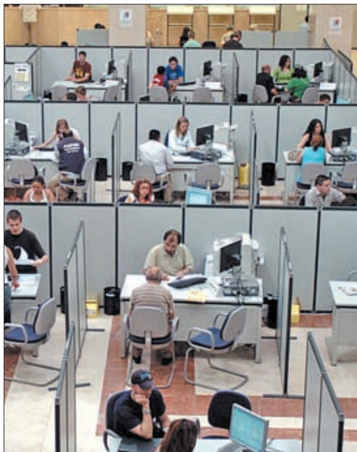
Una oficina de Hacienda donde los funcionarios atienden al personal

Con ello el Gobierno ha planificado un ahorro de costes de personal del 4 por ciento en estos años, a partir de la combinación de reducción de incorporaciones y la moderación de los salarios, que en este año subieron el 0,3 por ciento y algo