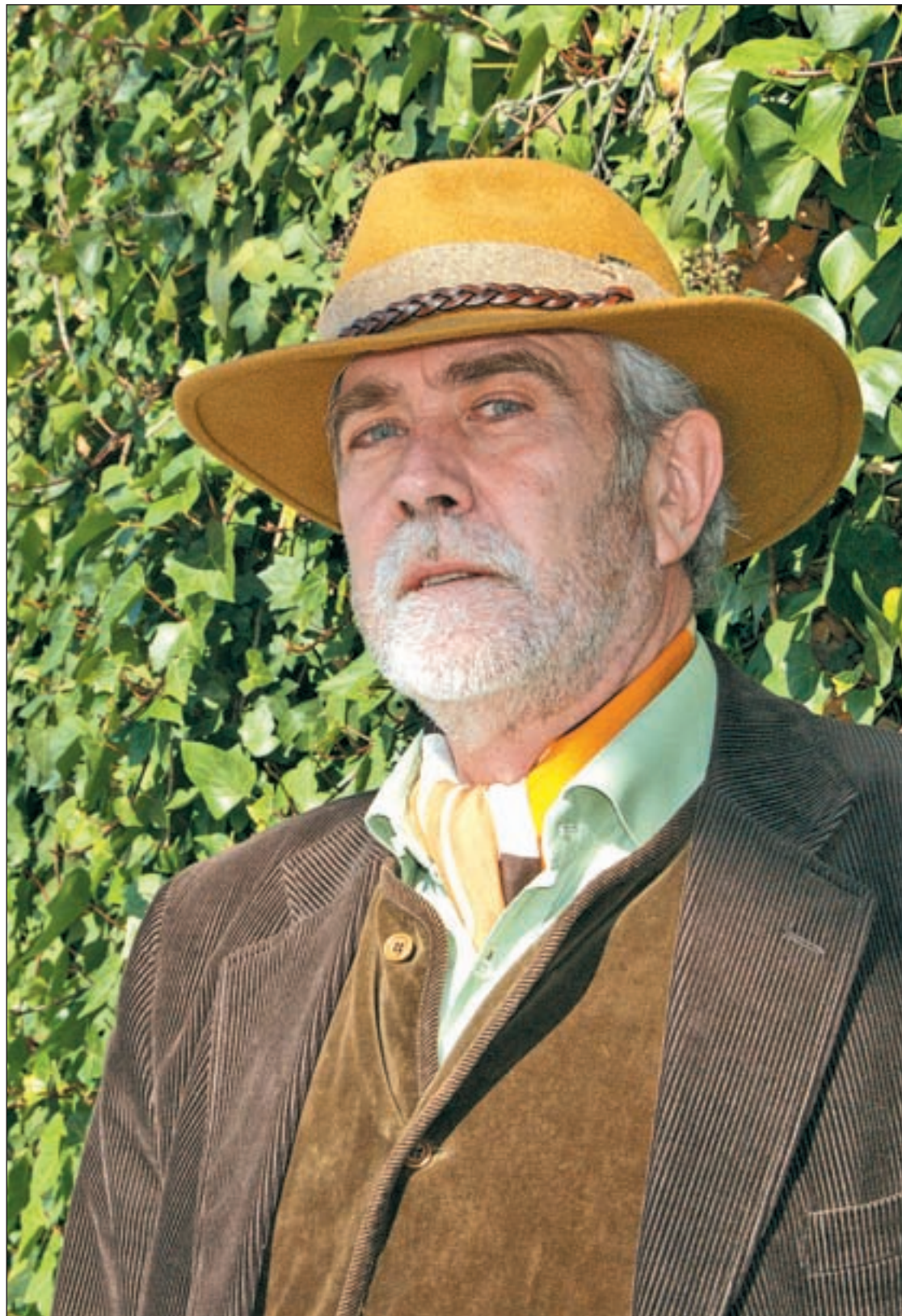
El periodista y escritor Antonio Pérez Henares, ataviado con el inseparable sombrero que suele caracterizarle

Como periodista, ha pasado de dirigir el periódico Mundo Obrero y trabajar en la SER a escribir en medios como La Razón o Periodista Digital, pero no considera haber dado un giro conservador: “Milité en el Partido Comunista y estuve en la clandestinidad. Ahora me hacen gracia los antifranquistas, parece que había muchos. Alguna gente de la izquierda ha