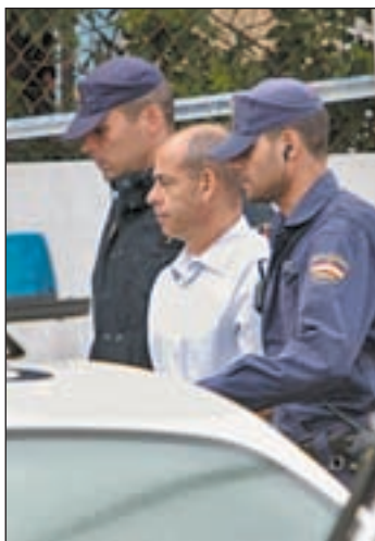
El principal imputado del caso