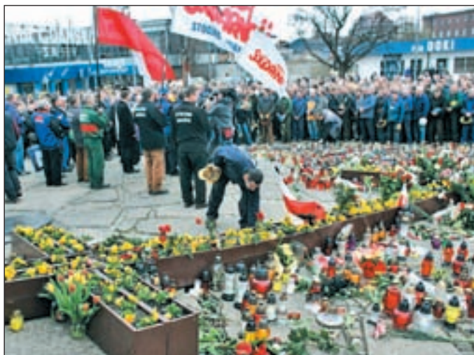
Homenaje a las 97 víctimas mortales del Tupolev-154