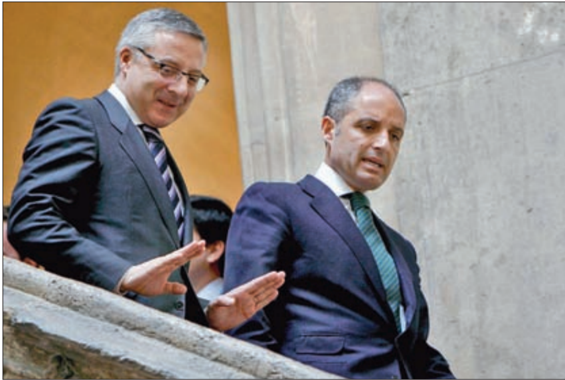
José Blanco y el presidente Camps tras ratificar el proyecto de modernización de esta red

La Comunitat quiere poner fin a los dolores y aflicciones de espalda de los estudiantes. La receta: aliviar el peso de su mochila. Bajo esta consigna, la Conselleria de Educación fraccionará los libros por fascículos o trimestres con objeto de que los colegiales sólo transporten en sus mochilas el volumen que corresponda al periodo académico que estén estudiando. Esta iniciativa ha agradado a todos los implicados. Padres, madres, alumnos y la asociación nacional de editoriales de libros de texto han dado su visto bueno. Los problemas de espalda en adolescentes tienen los días contados.