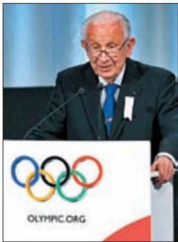
El ex presidente del COI