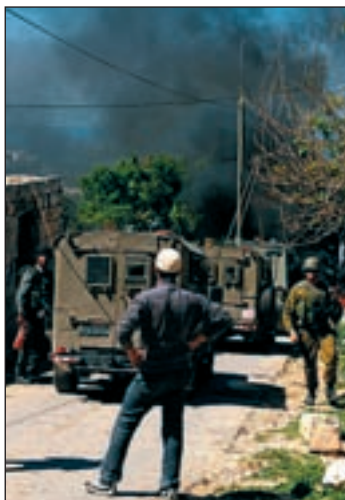
Tanques israelíes en Jerusalén

Éste es el tono de Netanyahu en su actual visita a EE UU. Un viaje donde se ha entrevistado con la secretaria de Estado, Hillary Clinton, y el mismísimo Obama. Cara a cara parece que ambos líderes han reducido la tensión. “Para el presidente Ba-