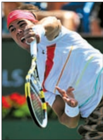
El manacorí cayó ante Ljubicic