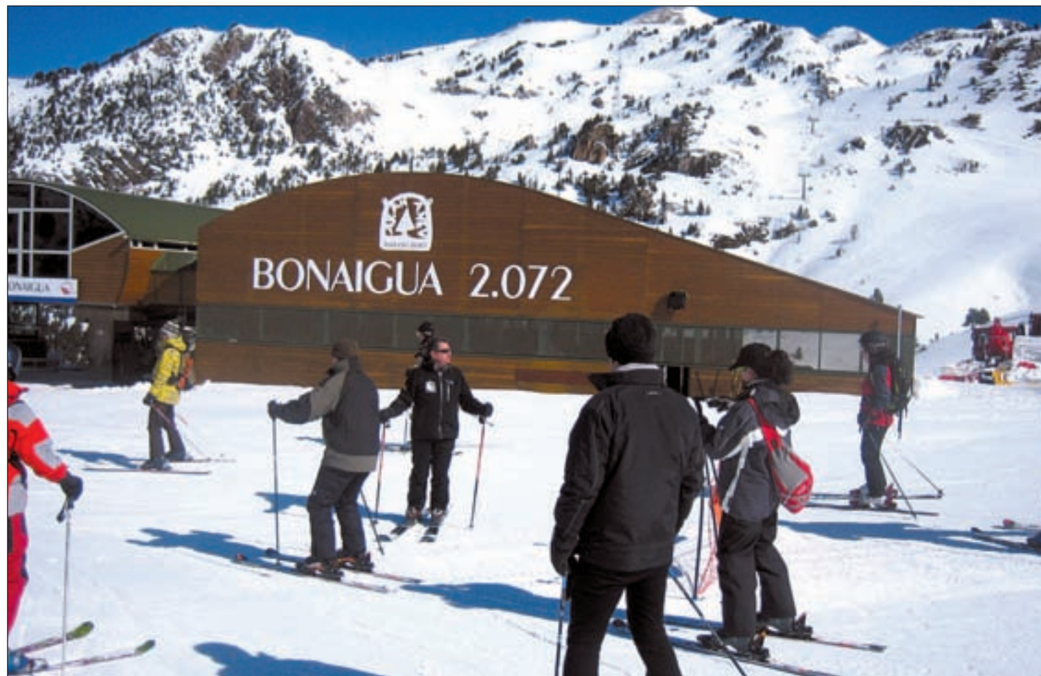
Los esquiadores cuentan cada vez con más posibilidades de acercarse a Baqueira Beret

LOS AMANTES DE LA NIEVE PUEDEN VOLAR A ANDORRA LA VELLA EN POCO MÁS DE DOS HORAS