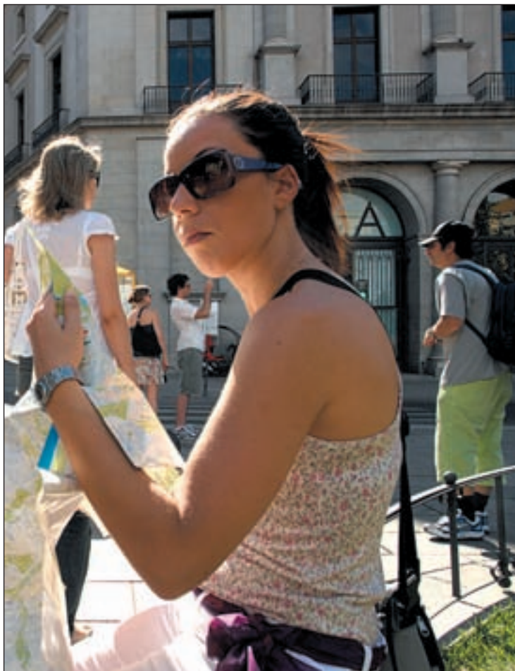
Una turista consulta un mapa en una plaza de Madrid

El principal factor al que el estudio achaca la caída en las cifras de febrero son las adversas condiciones climatológicas que se produjeron tanto en España como en los países emisores. Esta circunstancia provocó cancelaciones de vuelos, cortes en las carreteras de acceso a España y anulaciones de reservas, contribuyendo de forma definitiva a que el sector no levante cabeza. Pero no se puede achacar esta crisis únicamente a la lluvia. Las cifras del turismo ya eran malas. La encuesta FRONTUR del año anterior mostraba un retroceso del 8'7% respecto a 2008. En comparación con el 1'5% actual, el porcentaje de