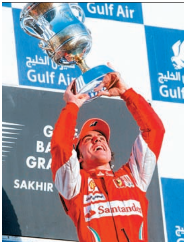
Alonso celebra su primera victoria con Ferrari

El trazado de Albert Park dará una nueva oportunidad a una serie de pilotos cuyo rendimiento en Bahrein estuvo por debajo de lo esperado. Schuma-