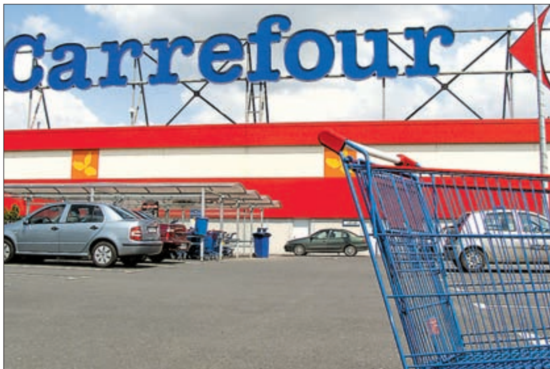
El grupo francés Carrefour quiere ser el nuevo ING en España y otros países del resto de Europa

Sánchez Llibre, de CiU, explicó que el acuerdo con el PSOE fija un período transitorio para que las administraciones públicas reduzcan su límite de plazo, con una escala de 55 días para este año, 50 para 2011, 40 para 2012 y 30 días desde el uno de enero de 2013. En el caso de las empresas privadas, y exceptuando el sector de la alimentación para productos frescos y perecederos -que quedarán obligados a pagar en 30 días en todos los casos, sin poder ampliarse- el período transitorio también se extiende hasta 2013, de forma que desde la entrada en vigor de la ley y a lo largo de 2011 el plazo será de 85 días, de 75 en 2012 y de 60 días ya a partir del siguiente año. Para ello se modificará la Ley de Contratos del Sector Público.