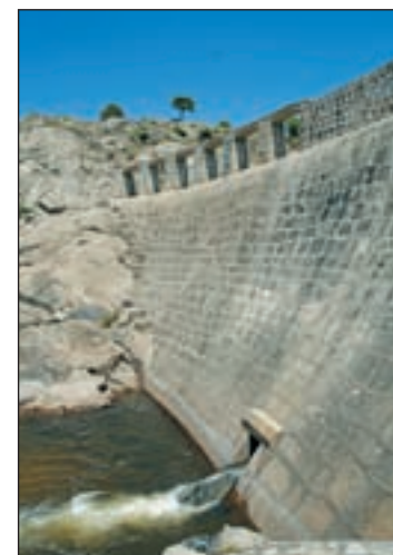
Presa de un embalse

La actual búsqueda de políticas de ahorro no se aplica sólo al dinero, ahora también al agua. El Gobierno y Cruz Roja Española han realizado una campaña de sensibilización para fomentar el ahorro doméstico de agua y energía y concienciar a la sociedad en la "responsabilidad" en la gestión de este recurso. Coincidiendo con la conmemoración del Día Mundial del Agua, Marta Morén, la directora general del Agua del Ministerio de Medio Ambiente, y Medio Rural y Marino, subrayó la "importancia" de la sensibilización ciudadana y las buenas prácticas en el uso de la energía y del preciado líquido dentro de la estrategia 'Moviéndonos por el agua'. Ésta incluye la distribución de perlizadores de bolsas para cisternas o bombillas de bajo consumo, y pondrá especial esfuerzo en llegar