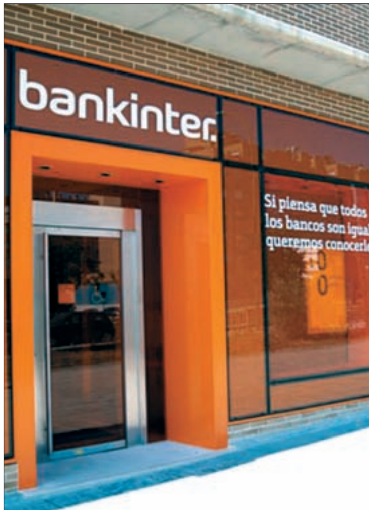
Segunda condena contra Bankinter por los clip hipotecarios

La cuestión se complica aún más cuando quienes contrataron el producto quieren anularlo y la entidad financiera les sorprende con una penalización de hasta 15.000 euros para personas físicas y tres veces más si se trata de pymes o autónomos. Situación que la mayo-