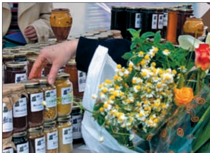
Nuestro organismo es receptivo a todo tipo de medicamentos