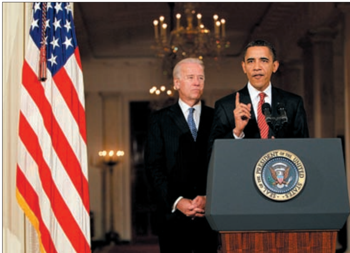
Barack Obama junto al vicepresidente Joseph Biden anuncia su victoria en el Congreso

Sin embargo, el proyecto íntegro y original de Obama no ha salido adelante. Para obtener el respaldo a su propuesta Obama tuvo que comprometerse con un grupo de congresis-