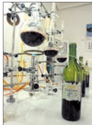
Consumir vino, bueno para la salud

Esta medida, anunciada por el Ministerio de Medio Ambiente y Medio Rural y Marino, se suma a la actual iniciativa con-