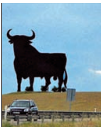
Uno de los toros de Osborne

los veinte toros de Osborne que hay en la región. La medida afectará al toro de Fuengirola, el de Vélez-Málaga y el Toro de Casabermeja, en Málaga, el Toro de las Cabezas de San Juan, el de La Campana, el de Lora de Estepa o el de El Castillo de las Guardas.