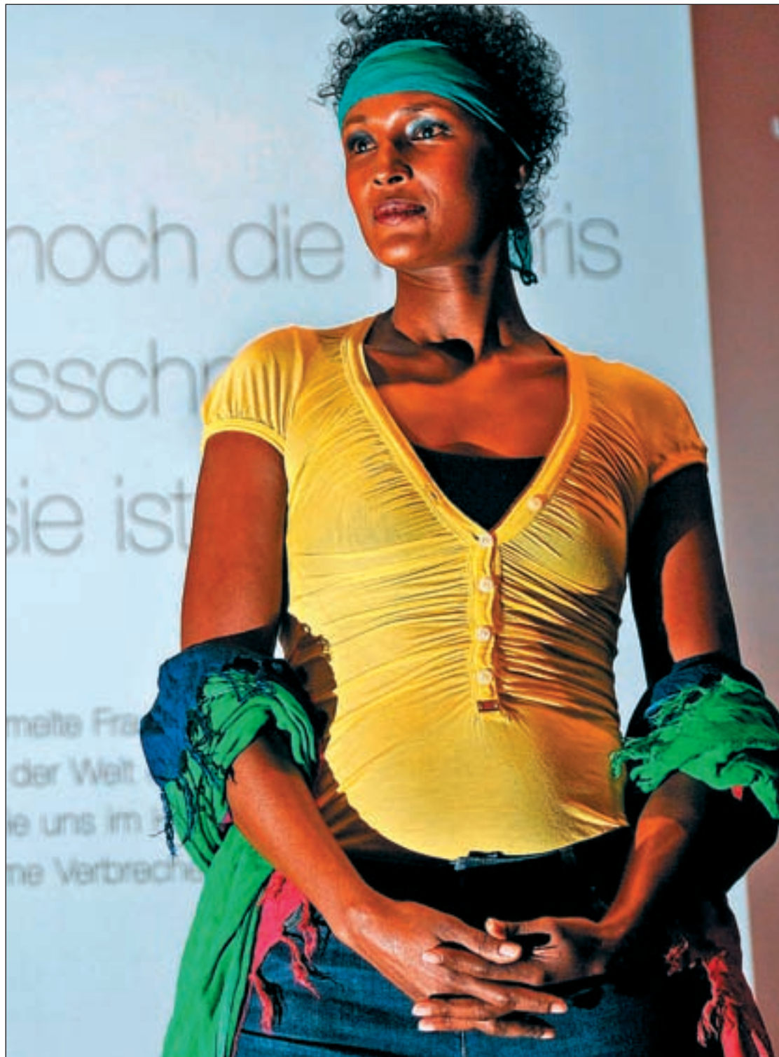
Waris Dirie, ex top model y hoy activista contra la mutilación genital femenina