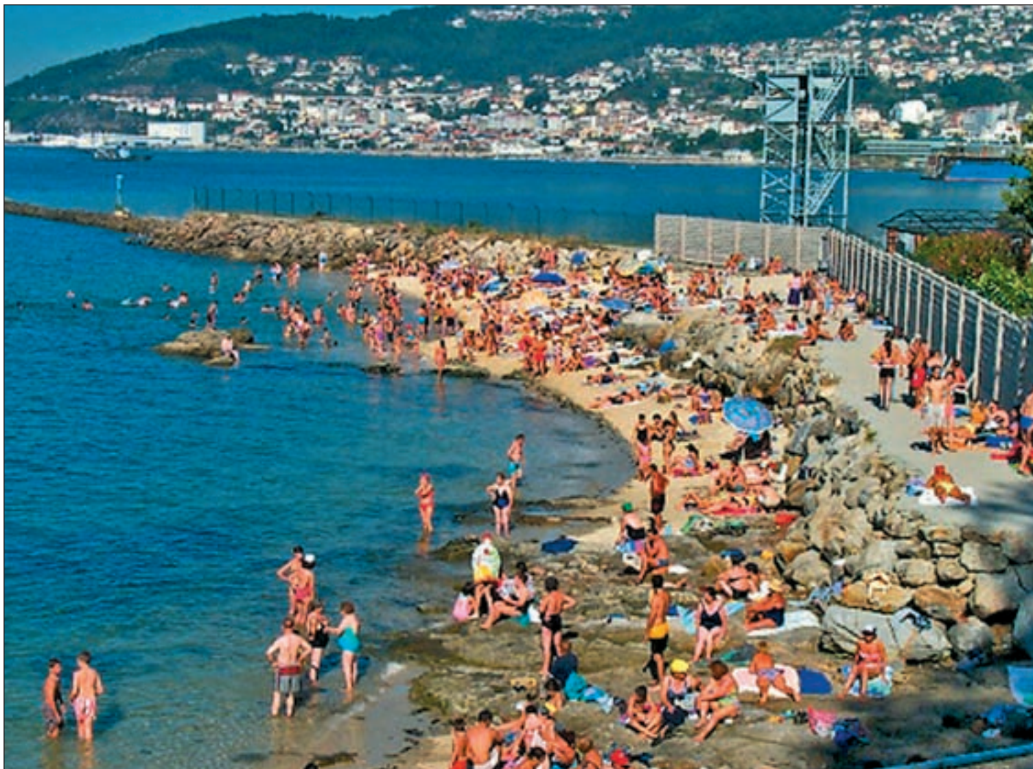
Playa de A Punta de Vigo, que quedará comunicada con la playa de Ríos por un paseo

El Ayuntamiento ha anunciado varias obras de mejora • Invertirán dos millones y medio de euros en acabar con el deterioro de la zona del Progreso • La nave de rederos del puerto será zona de ocio Pág. 4