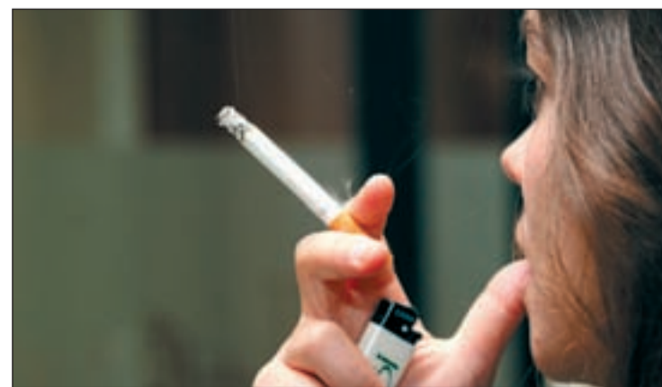
El tabaquismo, un mal endémico que afecta a la mayoría de personas

res políticos que hagan su cumplimiento. “Cuando pierden sensibilidad ética, sabiendo lo que saben de los efectos del tabaco para fumadores pasivos, no es aceptable moralmente que les obliguen a fumar por razones políticas. Es fundamental separar éstas de las sanitarias”.