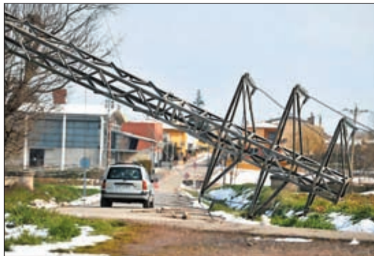
Una de las torres eléctricas caídas en Gerona a causa del temporal

Ante tal circunstancia, un total de 101 municipios de Gerona se han adherido a un manifiesto conjunto para criticar la "opacidad" de las compañías eléctricas, ya que en su opinión gestionaron mal el caos provocado por el temporal, con información imprecisa y poco creíble, además de analizar la actuación de la Generalitat, que en su opinión no estableció los protocolos de Protección Civil necesarios ante una avería de