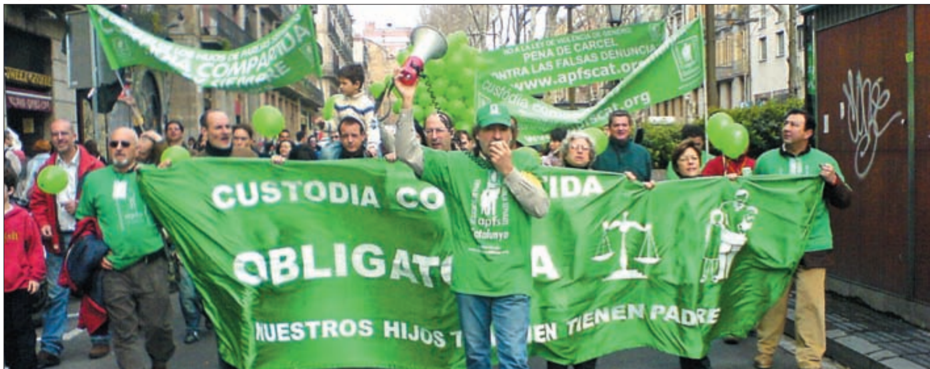
Manifestación en Barcelona de padres separados que reclaman la custodia compartida por Ley APFS

CUSTODIA COMPARTIDA LA REIVINDICACIÓN DE MILES DE PADRES SEPARADOS