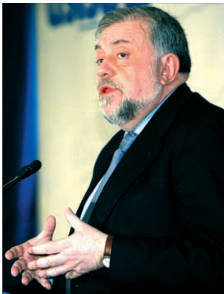
Octavio Granados, secretario de Estado de Seguridad Social

En España hay al menos cuatro millones de personas que tienen contratado un plan de pensiones privado, además de los funcionarios. Es decir, un 28 por ciento de los españoles