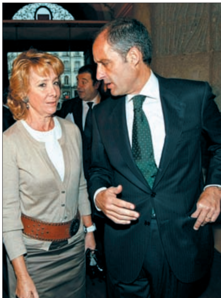
Esperanza Aguirre y Francisco Camps

Mientras el Estado intenta reducir gastos y equilibrar sus presupuestos, las CC AA no han hecho lo mismo, más allá de recortes puntuales, recortes de los que siempre culpan a la ci-