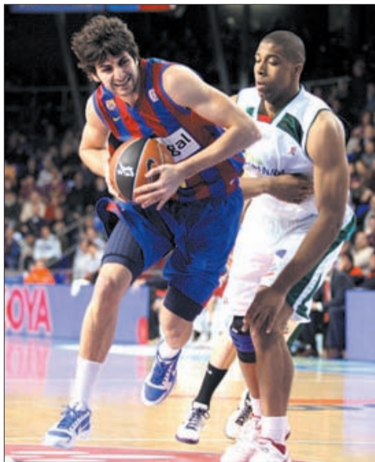
El Barça se clasificó con brillantez