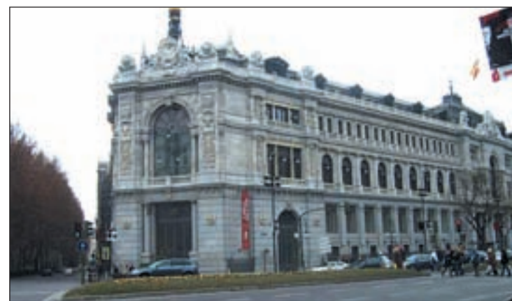
El Banco de España, pendiente de la calificación de la deuda española

con nota 'Aaa' para anclar las expectativas fiscales, mediante la comunicación de programas detallados de consolidación o la introducción de normas formales, será “fundamental” para evitar los riesgos vinculados al aplazamiento de la consolidación fiscal.