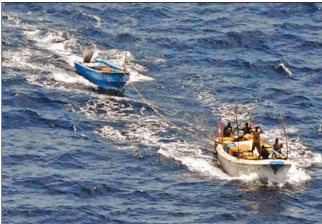
Fotografía facilitada por el Ministerio de Defensa de presuntos piratas somalíes a bordo de un esquife

LA MINISTRA EXPLICA QUE EL FIN DE LOS MONZONES HACE PROLIFERAR LA PIRATERÍA