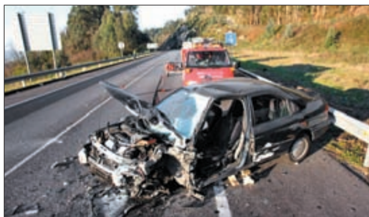
Imagen de un accidente de tráfico en Pontevedra

ron “por primera vez” de estar a la cabeza como causa de muerte en el país. En este sentido, comentó que eso se debió a que “había bajado mucho” la siniestralidad viaria. También apuntó que en el periodo 2003-2008 se pasó de una media de 11 muertos al día a 5,2.