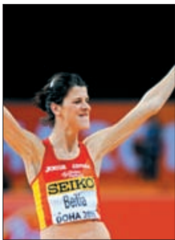
Beitia subió al podio