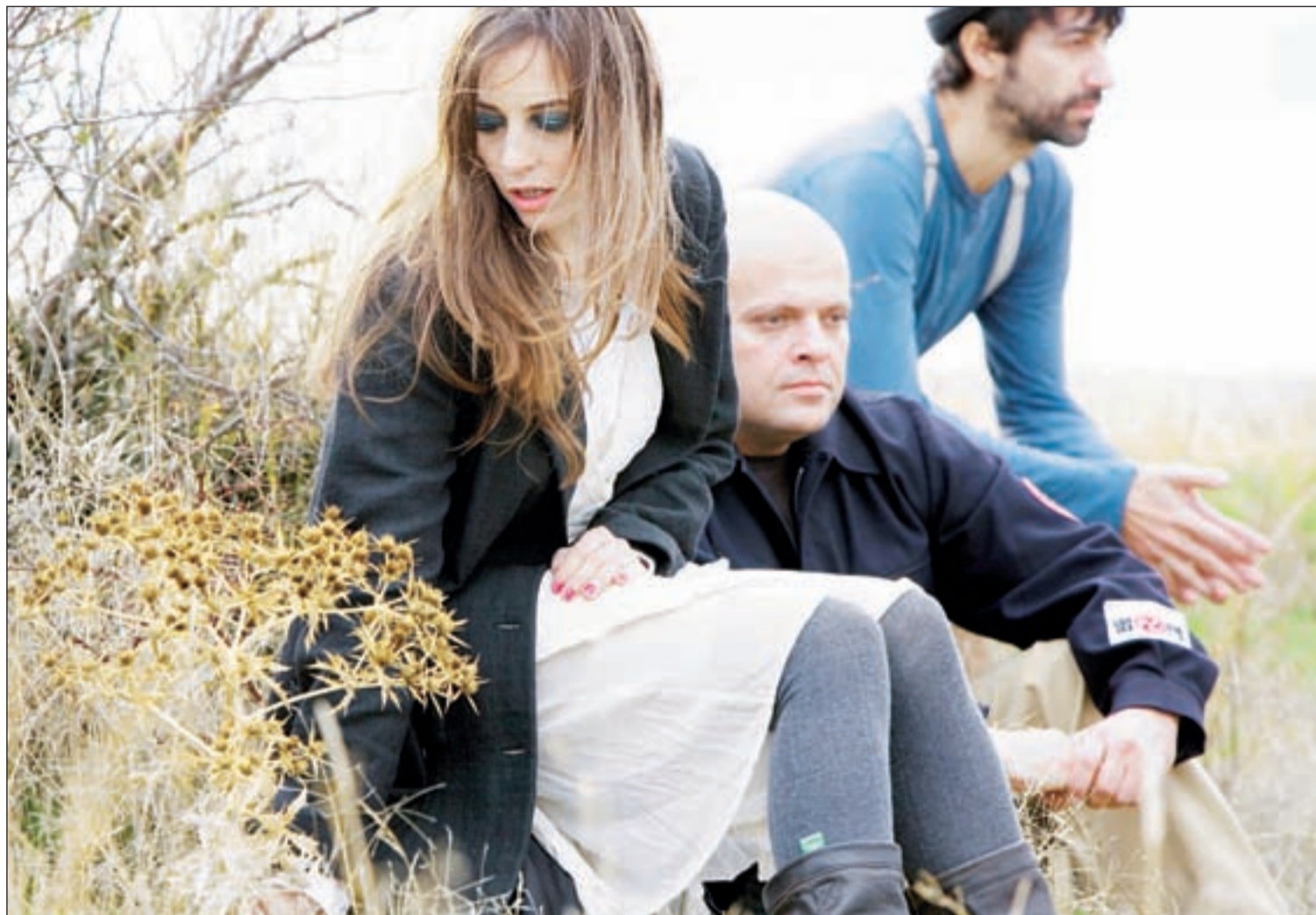
Aunque parezcan distantes, los componentes de Marlango se comportan como una familia