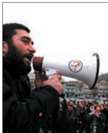
Protestas ante la cadena de TV

rra con Rusia y el asesinato del presidente Saakashvili. El miedo a otro enfrentamiento armado sacó a centenares de personas a la calle y los servicios de emergencia tuvieron que atender múltiples casos de infartos. Las protestas se han sucedido ante el edificio de la cadena.