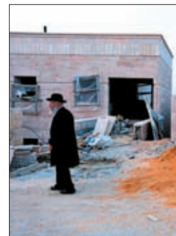
Obras en territorios ocupados

No ha gustado nada en Washington que a la vez que se iniciaban las conversaciones de paz entre Palestina e Israel, Benjamin Netanyahu, primer ministro israelí, anunciara la expansión de la colonia ultraortodoxa de Ramat Shlomo, en la Jerusalén ocupada. Esta coincidencia ha abierto una brecha, por primera vez desde hace 35 años, entre el país judío y su socio norteamericano. Personalidades claves de la Administración de Obama han manifestado públicamente su malestar y desacuerdo con la actuaciones del equipo de gobierno de Netanyahu. David Axelrod, principal consejero del presidente de EE UU, ha calificado la actitud