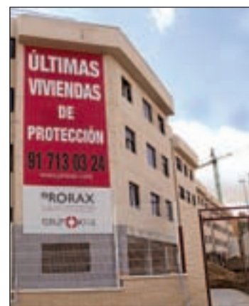
El sector del ladrillo se calma

variación interanual de febrero de 2009 a febrero de 2010), el precio de la vivienda registra un descenso del 6,4 por ciento. Con esta caída se completan 28 meses consecutivos (desde noviembre del año 2007) con bajadas en el valor de tasación de la vivienda.