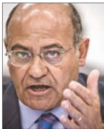
Díaz Ferrán, presidente de CEOE

jor de los casos" no superaría el (SMI), según José de la Cavadra relaciones públicas de CEOE. Una propuesta que se desvincula con la del otro contrato llevado a Mesa del Diálogo Social, el indefinido con indemnización por despido de veinte o veintidós días.