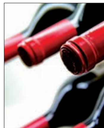
Mucho vino y poco consumo

de vino tanto en bares como restaurantes ha llevado a una situación de bajos precios. Así, el vino de mesa se ha situado entorno a 1,70 euros hectogramo, lo que supone precios para la uva de 0,13 a 0'15 céntimos por kilo, cuando sólo cogerla cuesta casi a 0,80 euros.