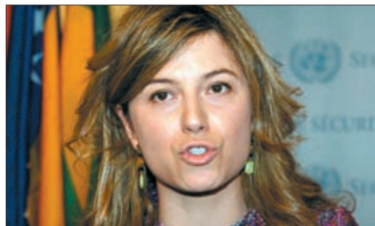
Bibiana Aído durante su intervención en Nueva York

res. Por otro lado, entre sus resoluciones previstas para este año están acabar con la mutilación genital femenina o la situación de las mujeres refugiadas por conflictos bélicos. A la sesión de la CSW también ha asistido la ministra de Igualdad, Bibiana Aído, quien ha reivindicado el papel de Europa como "referente en derechos".