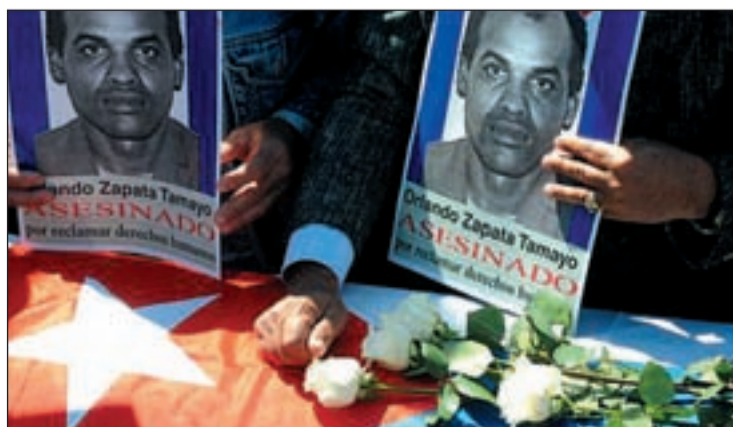
Flores para denunciar la muerte de Orlando Zapata

La muerte del disidente cubano Orlando Zapata tras una huelga de hambre de 85 días ha provocado un aluvión de reacciones. A la protesta de dos mil exiliados cubanos en Miami y en otros puntos del Planeta se ha sumado la huelga de hambre de otros seis disidentes.