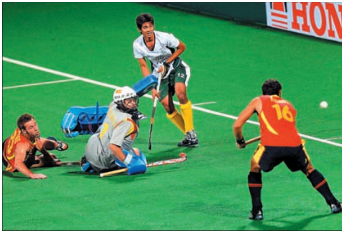
Pakistán derrotó a España en la segunda jornada

HOCKEY HIERBA INGLATERRA Y AUSTRALIA, PRINCIPALES RIVALES EN EL GRUPO B