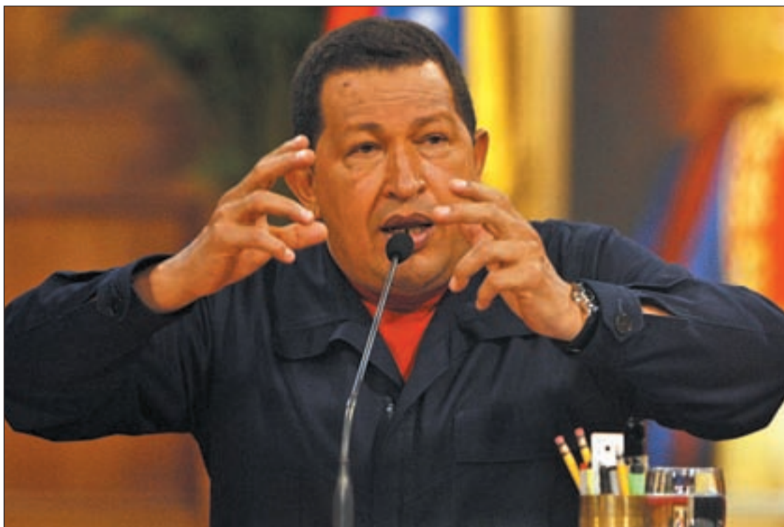
Hugo Chávez durante uno de sus habituales discursos

EL PRESIDENTE DE VENEZUELA NIEGA QUE HAYA COLABORADO CON ETA Y LAS FARC