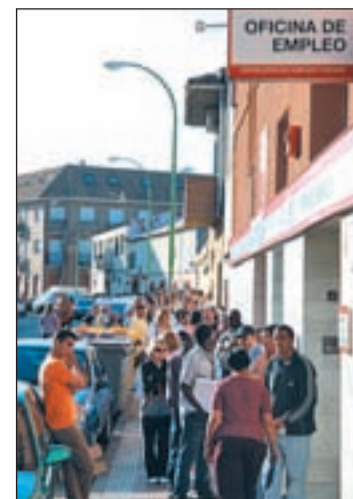
Colas en el antiguo INEM

El drama del paro sigue creciendo. En febrero se sumaron a la lista negra del Empleo un total de 82.132 personas que elevan ya la cifra de parados hasta los 4.130.625 ciudadanos que buscan un trabajo. El número de desempleados en el segundo mes del año supone un aumento del 2,03 por ciento respecto al mes de enero y se sitúa en el nivel más alto de toda la serie histórica comparable, que arranca en 1996. En todo caso, el aumento en el mes de febrero fue inferior al registrado en el mismo mes de 2009, cuando las listas de las oficinas públicas de empleo sumaron 154.058 parados más. En los últimos datos conocidos, el sector servicios supuso el 55 por ciento del incremento total. El Ministerio de Trabajo informó que, de los parados de los últimos doce meses, 344.695 son