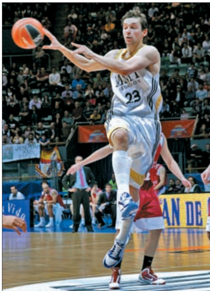
Lull atraviesa un gran momento de forma

Este domingo, los del Ramiro de Maeztu tienen una complicada cita ante el Caja Labo-