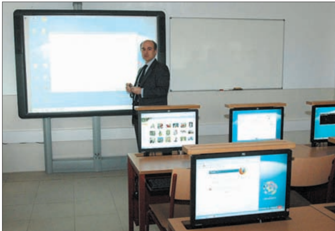
Una de las aulas de innovación tecnológica de la Comunidad

El proyecto no ha tenido una buena acogida entre los padres