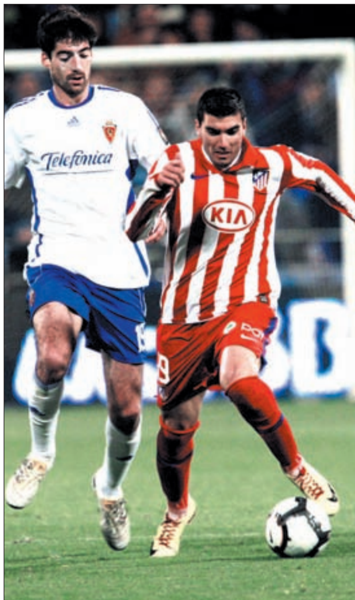
El extremo del Atlético fue expulsado en La Romareda

Para la cita del próximo lunes, el técnico madrileño no podrá contar con los sanciona-