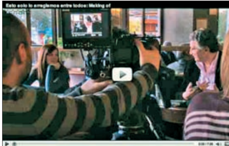
Rodaje de la campaña 'Esto lo arreglamos entre todos'

Desde hace días la campaña 'Esto lo arreglamos entre todos' está presente en prensa escrita y en las parrillas publicitarias de todas las televisiones, incluida TVE. No obstante, la presión del PP ha obligado a retirar la emisión de esta campaña de la Fundación Confianza del Ente, ya que alegan que el nuevo régimen que prohíbe la publicidad en la cadena pública también afecta a estos spots institucionales por ser una 'campaña comercial'. RTVE ha desmentido que se incumpla su regla-