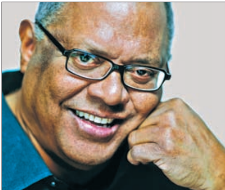
El músico Pablo Milanés, en una imagen promocional de ‘Regalo’

P ablo Milanés deja el calor de su querida Cuba para sumergirse en el frente polar que conge-la España. Uno de los pilares de la Nueva Trova Cubana nos trae su disco ‘Regalo’ y canciones de toda la vida que homenajean al amor, a la vida y a las ideas. Pablo hace una excepción dentro de su apretada agenda para atender a GENTE, a días del viaje que traería su música a nuestro país. Él lo conoce muy bien, y cree que no es tan diferente del mundo latino: “Hay un vínculo que podría ser mayor, España podría introducir la cultura latinoamericana en Europa, sobre todo ahora con la presidencia de la Unión Europea. Y en lo cultural, independientemente de