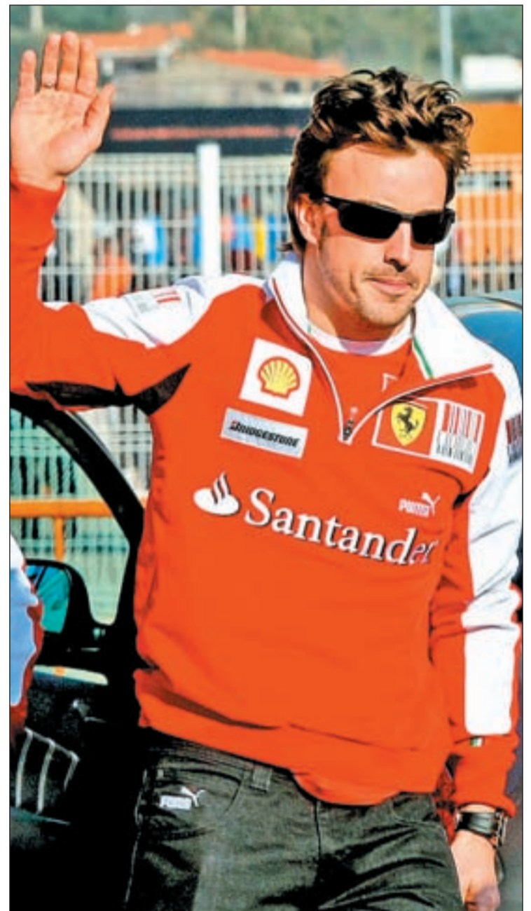
El asturiano centrará muchas miradas

Parecida es la situación de De la Rosa quien ha pasado de