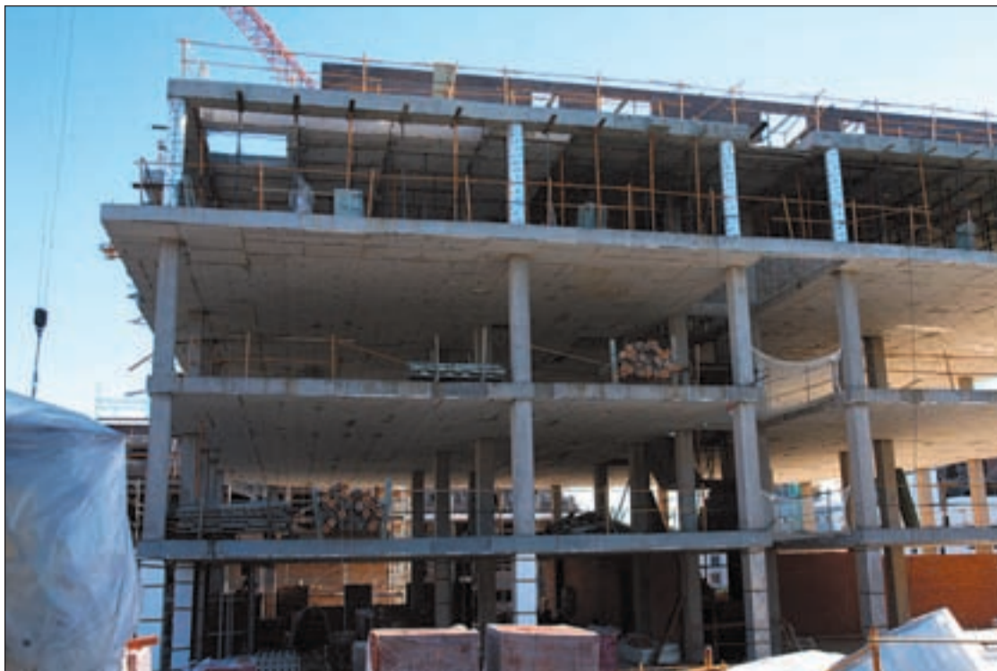
El sector del ladrillo lleva meses esperando la reacción de los compradores para adquirir las viviendas

“No estamos planteando un rival para el FMI, pero necesitamos una institución para garantizar el equilibrio interno de la eurozona que tenga a su disposición tanto la experiencia del FMI como mecanismos de intervención comparables”. Tanto Bruselas como París y Berlín han rechazado que Grecia acuda al FMI en busca de ayuda e insisten que será la eurozona la que busque las soluciones.