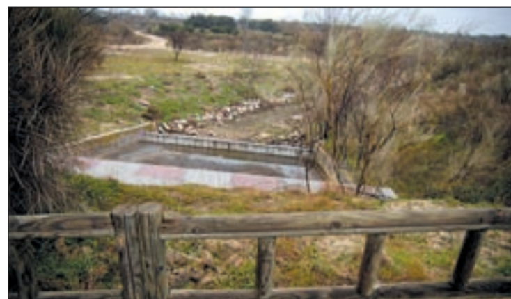
Imagen de archivo del Parque de las Presillas

te asciende a 2.886.000 euros. Las obras se centran en el saneamiento y encauzamiento del arroyo Butarque con la creación de un gran lago de dos hectáreas. Asimismo, se creará un paseo que rodeará la totalidad del lago con plantaciones arbóreas y arbustivas.