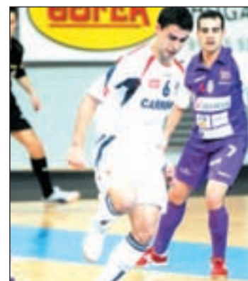
Jaison se quedó sin marcar

Por su parte, el Carnicer Torrejón logró acceder a la octava posición tras vencer por un gol al Gestesa Guadalajara. Los torrejoneros juegan esta semana en la pista del Playas de Castellón, decimotercero.