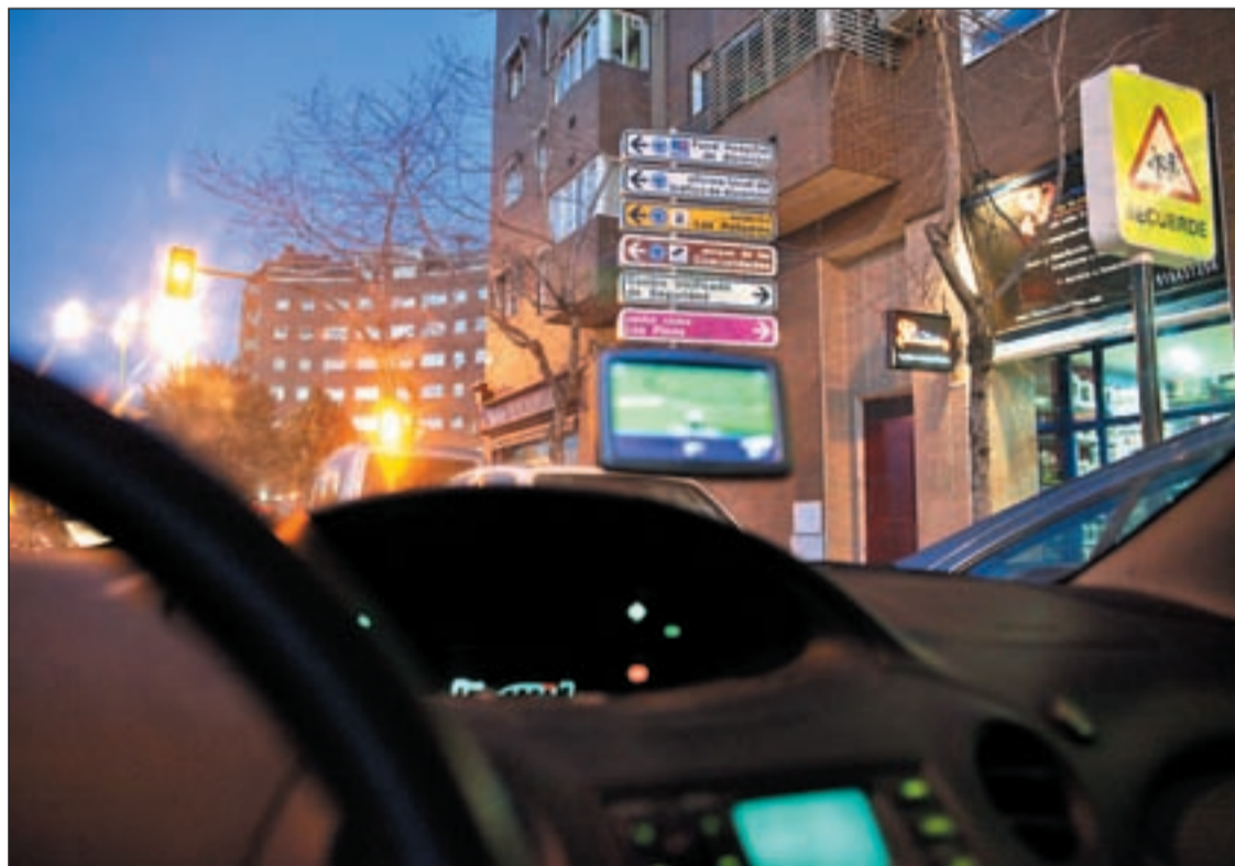
Un conductor, en su camino desde el Ensanche a la carretera de Extremadura

Adjudicado el proyecto para abrir un acceso en el barrio • Los conductores del Ensanche ahorrarán quince minutos para llegar a una vía principal Pág. 5