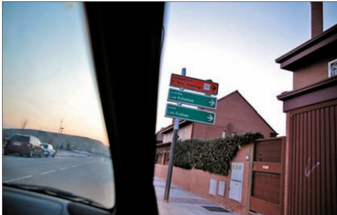
Un conductor se dispone a salir del Ensanche Sur