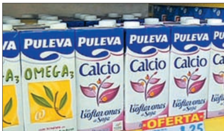
Puleva, último grupo español lácteo, para la francesa Lactalis

CC OO ha mostrado su deseo de que el grupo francés mantenga el proyecto de la firma Puleva, que marcó Ebro, después de que hayan alcanzado un principio de acuerdo.