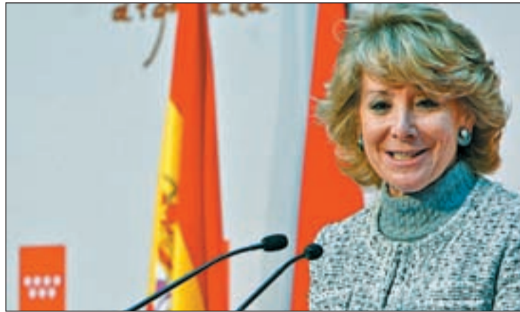
Esperanza Aguirre participa en un acto

Las reacciones a la rebelión de la presidenta no se hicieron esperar. El secretario general del PSM, Tomás Gómez, calificó a Aguirre de "antisistema" y coincidió con la ministra de Econo-