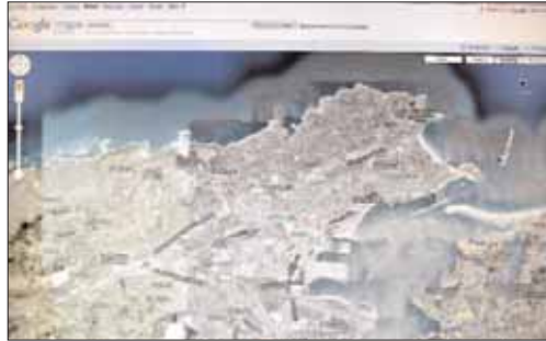
La apuesta por las nuevas tecnologías quiere impulsar el turismo en la ciudad.