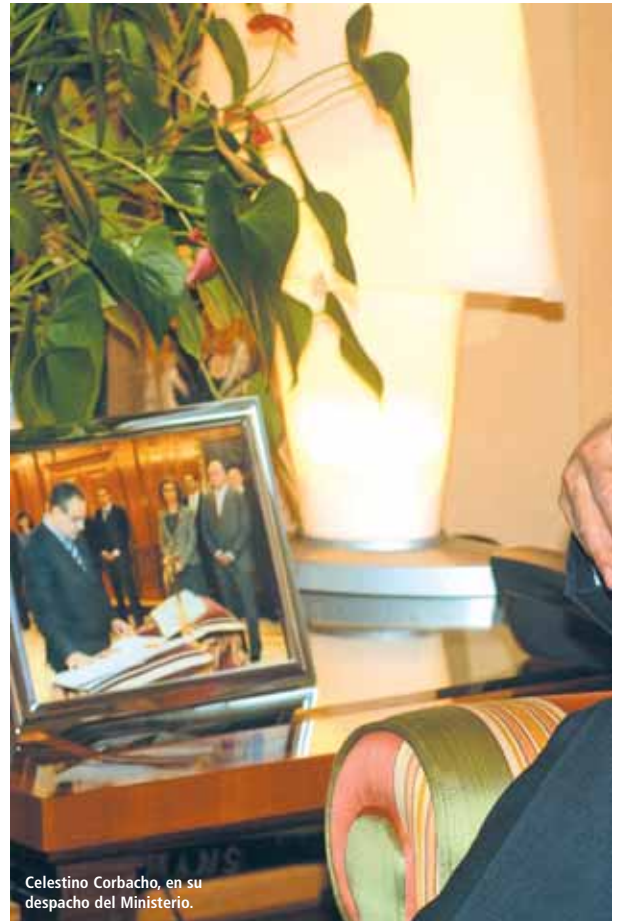
Celestino Corbacho, en su despacho del Ministerio.

En el contexto de crisis económica, las cuentas de la Seguridad Social siguen teniendo superávit, y de hecho ha sido superior al que nosotros mismos preveíamos a principios de 2009. Es un balance que, desde luego, no pueden hacer muchas instituciones ni muchas empresas. Es una buena noticia que da seguridad a todas las personas que cobran pensiones de jubilación, viudedad, orfandad... La previsión es que 2010 se cierre también con más ingresos que gastos, de manera que las cuentas están sa-