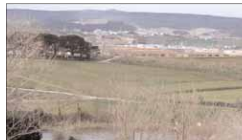
Imagen de la Finca de La Remonta, tomada desde el Parque de La Vaca.