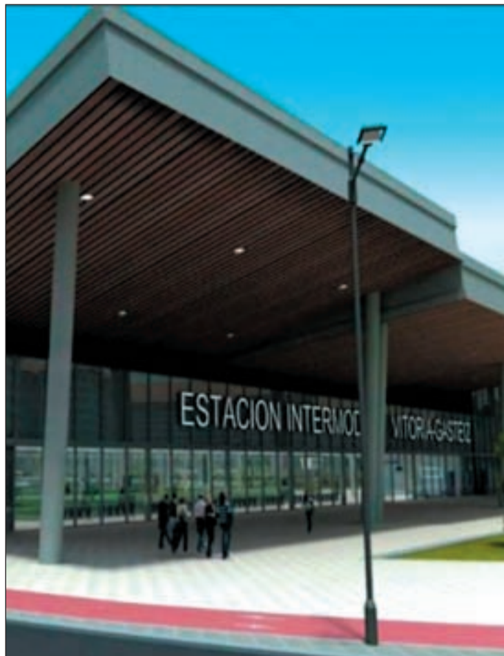
Infografía de la nueva estación intermodal de transportes

La mejoras a la accesibilidad han continuado con la finalización de las obras en el polideportivo de Landazuri, cuyas actividades se reinician esta misma semana. La renovación del edificio, que ha supuesto una inver-