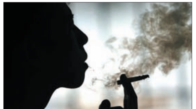
El endurecimiento de la Ley antitabaco es beneficioso para la salud

La incidencia global prevista del cáncer en mujeres españolas el año 2015 es de 85.108 mientras que en los hombres será de 51.853 casos más con 136.961 el total del cáncer en varones.