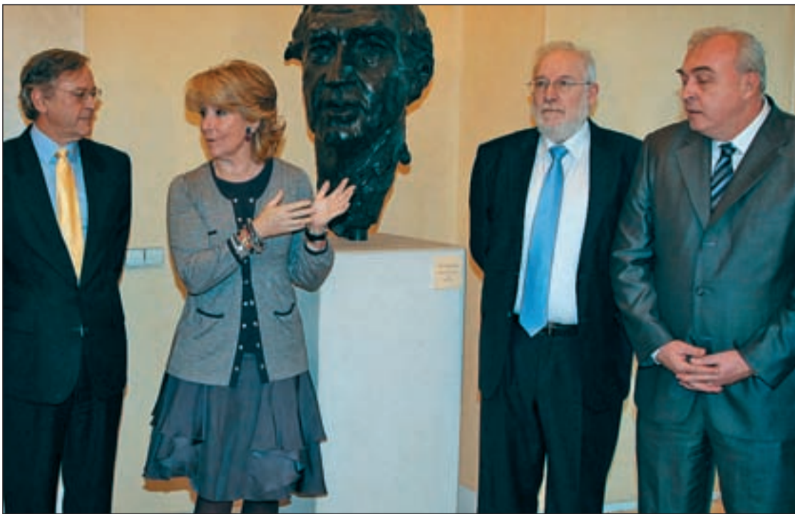
La presidenta de la Comunidad, Esperanza Aguirre, se reunió con los rectores de las universidades

LA PRIMERA ENTREGA SE REALIZARÁ A LO LARGO DE 2010