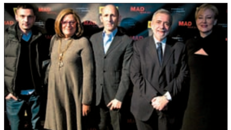
El consejero de Economía, Antonio Beteta, durante su visita

tienen a su disposición en la Administración regional para apoyarlas en los procesos de internacionalización. El consejero recordó la política económica madrileña, basada en bajadas de impuestos, supresión de trabas burocráticas y austeridad en la gestión pública.