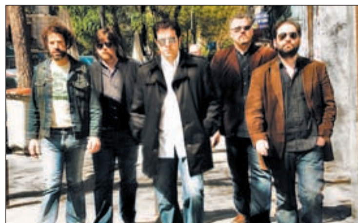
Los Madison llevan siete años caminando en la Música P.PRADERA

El nuevo trabajo discográfico de Los Madison saldrá a la venta en las tiendas el 16 de febrero, aunque ya pueden comprarlo en su web ( www.losmadison.com ). La gira en la que presentarán el ál-