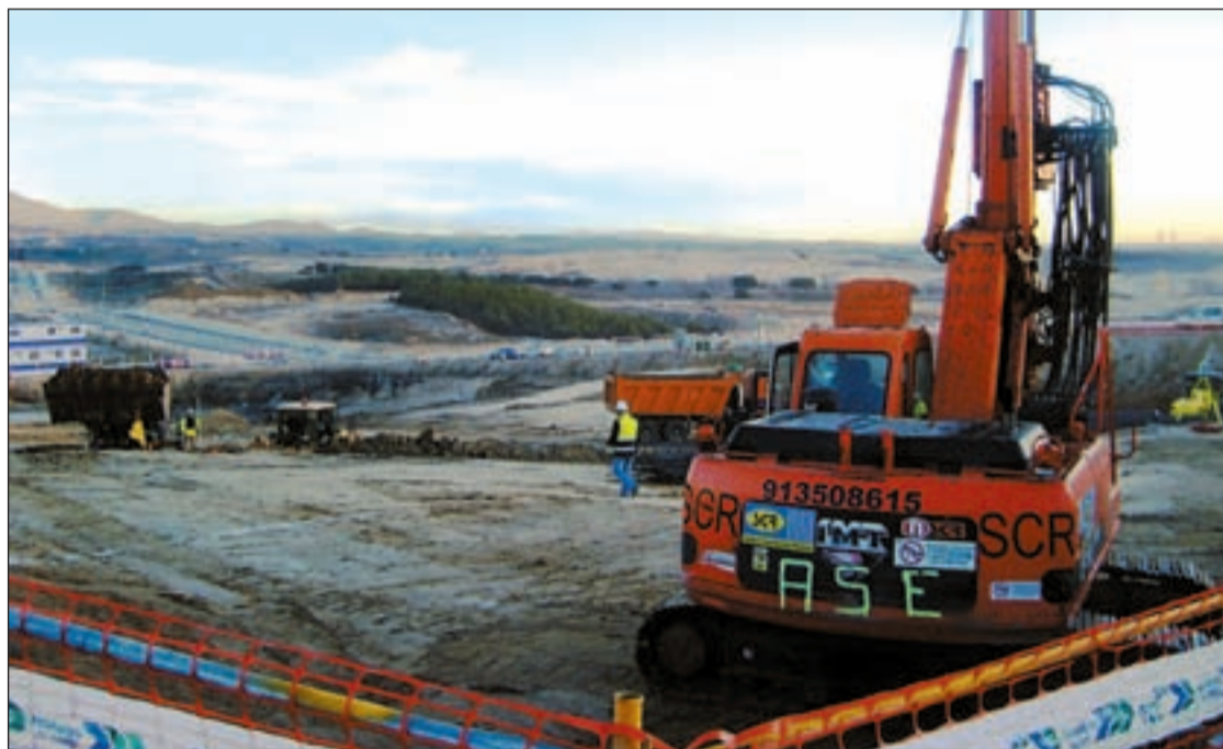
Situación actual de las Mil Viviendas para jóvenes que están construyendo en Tres Cantos

Tal y como dice textualmente la resolución judicial, “el suministro está garantizado por la Empresa Pública responsable y