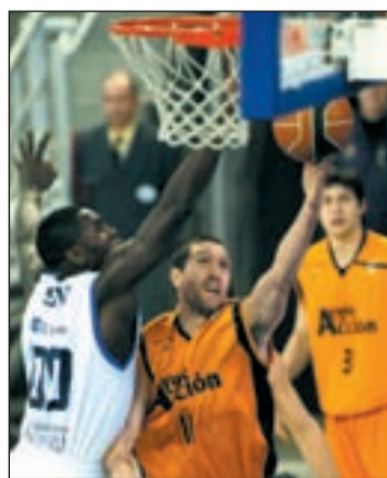
El 'Fuenla' no puede fallar

Madrid les eche una mano venciendo en Vistalegre al penúltimo clasificado, el Bizkia Bilbao Basket. Por su parte, el Asefa Estudiantes juega por segunda semana consecutiva como visitante. Los colegiales tienen un duro examen ante el líder de la liga, el Regal Barcelona.