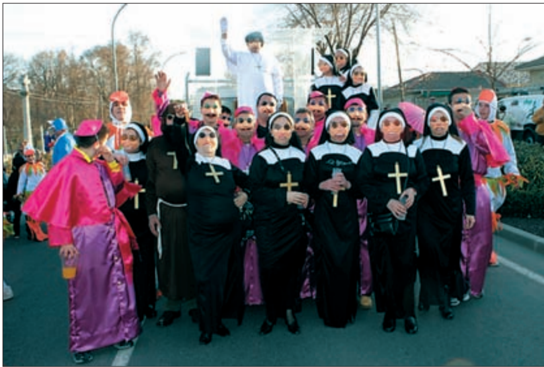
En Colmenar Viejo celebraron el Carnaval del año pasado con gran sorna y enorme algarabía

EN TRES CANTOS LO CELEBRAN TODO EL FIN DE SEMANA