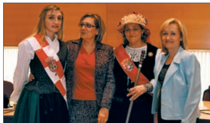
Las concejalas de Cultura y Salud con dos mujeres durante la fiesta

ción local del mes de febrero. La nueva alcaldesa calificó esta experiencia como una de las más importantes y positivas de su vida y expresó que su deseo es que el Centro Integral de Mayores sea en breve una realidad. La última palabra la tiene el verdadero alcalde.