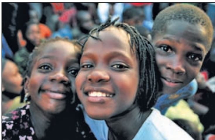
Tres niños sonríen en mitad del caos de Puerto Príncipe