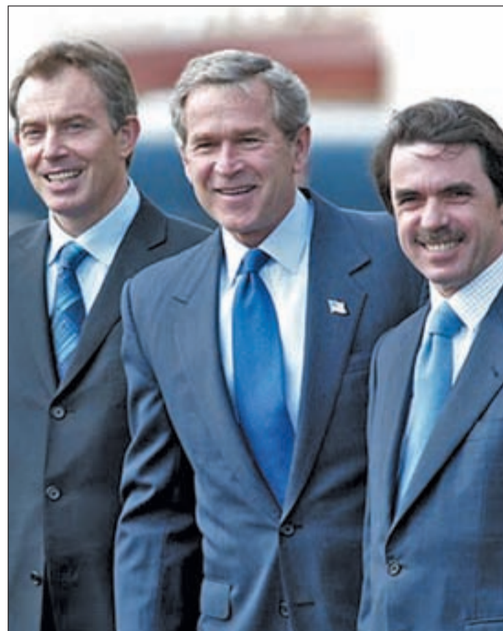
Blair, Bush y Aznar durante la cumbre de las Azores

Anterior incluso a dicho documento de junio, 'The Independent' cita otro texto de marzo de 2001 firmado por John Sawyers que evidencia la premeditación de Londres y Washington. El entonces asesor de polí-