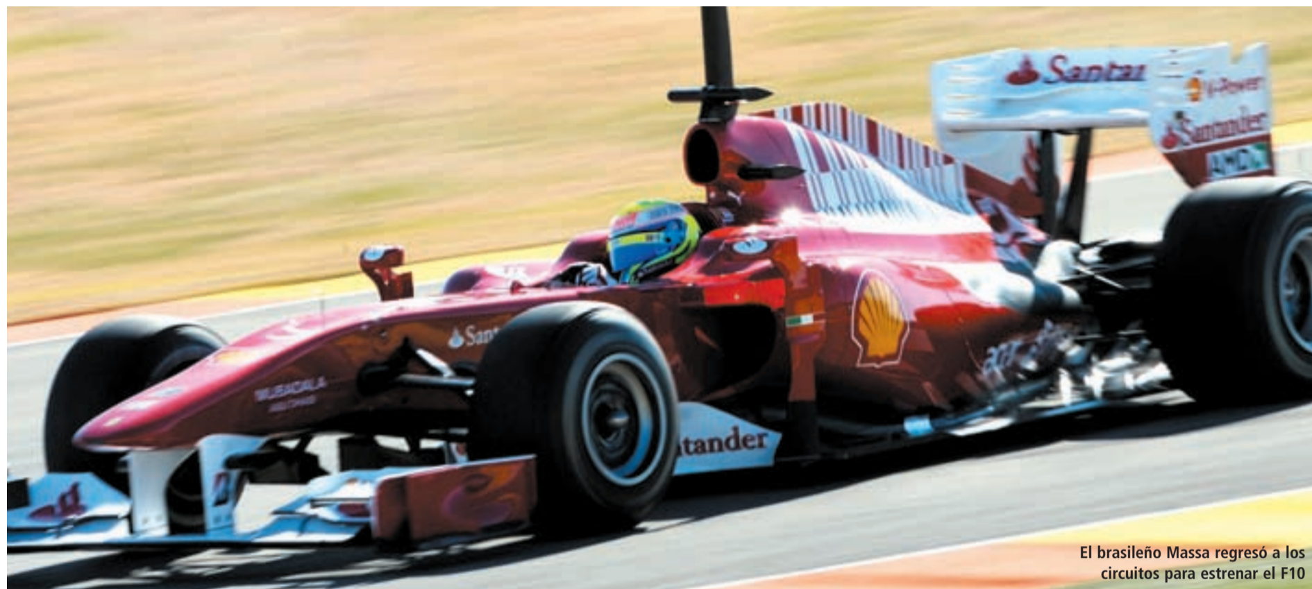
El brasileño Massa regresó a los circuitos para estrenar el F10

FÓRMULA 1 COMIENZA LA CUENTA ATRÁS PARA EL COMIENZO DE UNA NUEVA EDICIÓN DEL MUNDIAL