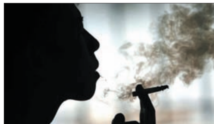
El endurecimiento de la Ley antitabaco es beneficioso para la salud

La incidencia global prevista del cáncer en mujeres españolas el año 2015 es de 85.108 mientras que en los hombres será de 51.853 casos más con 136.961 el total del cáncer en varones.