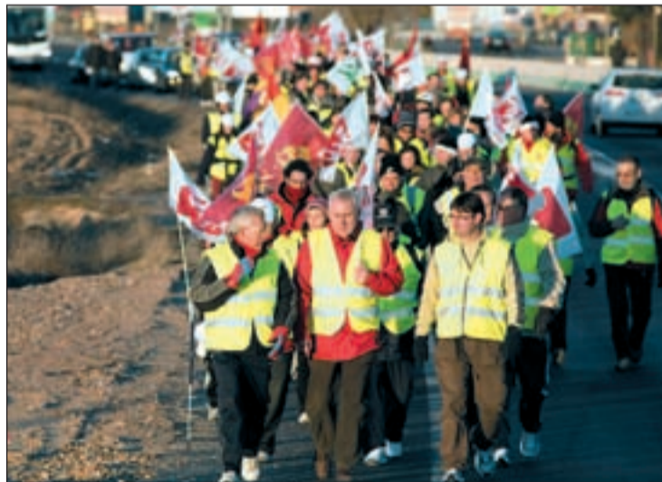
Cayo Lara, líder de IU encabezó la marcha contra la corrupción

Una de las medidas concretas, encaminadas a la transparencia en la gestión municipal, será la publicación en internet del patrimonio tanto de concejales como de los alcaldes para que los vecinos lo consulten de una manera fácil y rápida. El mismo sistema será el que se imponga en licencias de obras, convenios, contratos y modificaciones de los planes de ordena-