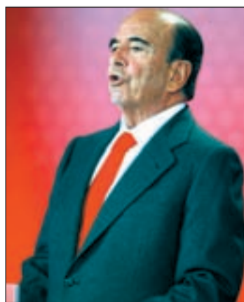
Botín, presidente del Santander

con la Escudería Ferrari de ese país. El siguiente país será Alemania, seguido el Reino Unido, un mercado conocido tras su adquisición de Abbey National, en 2004. También esta prevista su llegada a otros países de Latinoamérica donde opera ya la entidad bancaria.