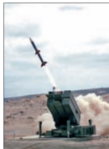
Misil patriot norteamericano

Las relaciones bilaterales entre las dos superpotencias, Estados Unidos y China, se resquebrajan progresivamente ante los últimos acontecimientos. A las múltiples tensiones entre estos dos países se suma un nuevo frente abierto, la venta de armamento de EE UU a Taiwán por valor de 6.400 millones de dólares. La reacción de China no se ha hecho esperar. El Gobierno de Beijing ha suspendido sin fecha los contactos militares entre los dos países y ha amenazado con imponer sanciones a