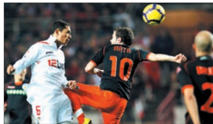
La Liga se jugará en lunes doce años después

La LFP será la encargada de fijar el horario de dichos encuentros, tal y como hace con el resto de enfrentamientos de cada jornada, tras contactar con los operadores de televisión.