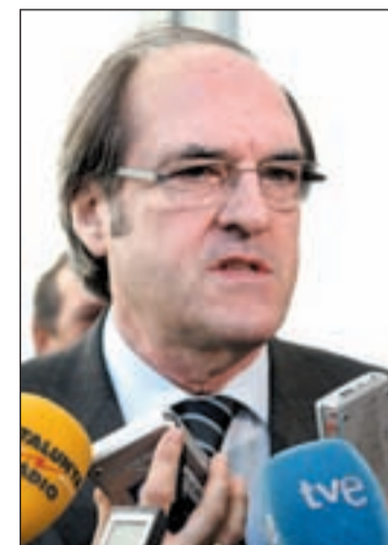
Gabilondo, ministro de Educación

Las políticas lingüísticas vuelven a protagonizar otro debate político. Esta semana era el ministro de Educación, Ángel Gabilondo, quien salía al paso para reivindicar esa incuestionable defensa del castellano, aunque no "combatiendo con otras lenguas cooficiales; aún menos en el ámbito autonómico, donde es indispensable" señalaba. Ángel Gabilondo hizo una llamada al consenso y no dramatizar sobre la cuestión lingüística. Desde el absoluto respeto para las competencias de las Autonomías, el ministro de Educación apostó por hacer una convivencia de lenguas y garantizar, en todo caso, el conocimiento y el buen uso de todas ellas. Ángel Gabilondo señaló que el tema no es un problema prioritario, pero sí importante dentro de la reforma del sistema educativo que estos días han hecho públicas en el primer bo-