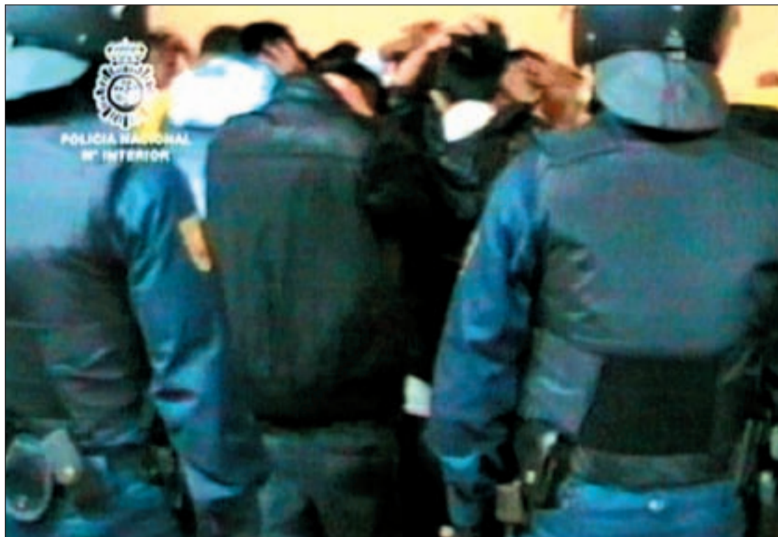
Agentes de la Policía Nacional detienen a algunos miembros de Latin King

El grupo Latin King tiene estructura jerárquica y rígida. En el vértice superior, se encuentra el jefe o Inca Supremo , que está al cargo de varios capítulos. Al jefe del capítulo le llaman Inca o Primera Corona , y sus opiniones prevalecen sobre todas las demás. El lugarteniente es denominado Cacique o Segunda Corona . Le sigue el jefe de guerra o Tercera Corona , sobre quien recae las responsabilidades de control de las agresiones. El cuarto es el que se ocupa de controlar la situación económica del Capítulo , además de encargarse de recolectar fondos. Por último, el maestro, Quinta Corona , responsable del adoctrinamiento de los integrantes del Capítulo respectivo, en el conoci-