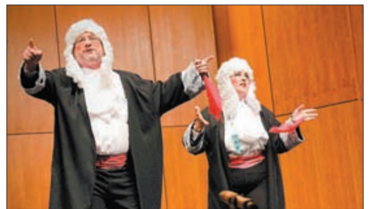
Un momento de la actuación de 'Los Picapleitos'