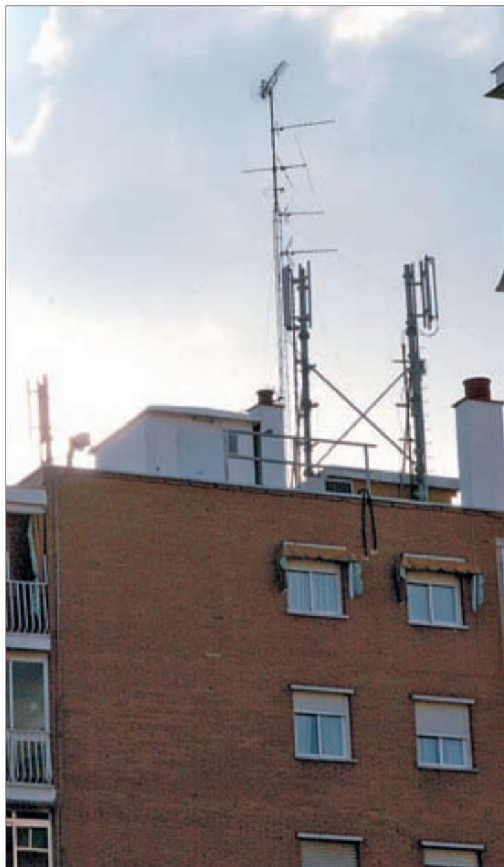
Una antena en la azotea de un edificio