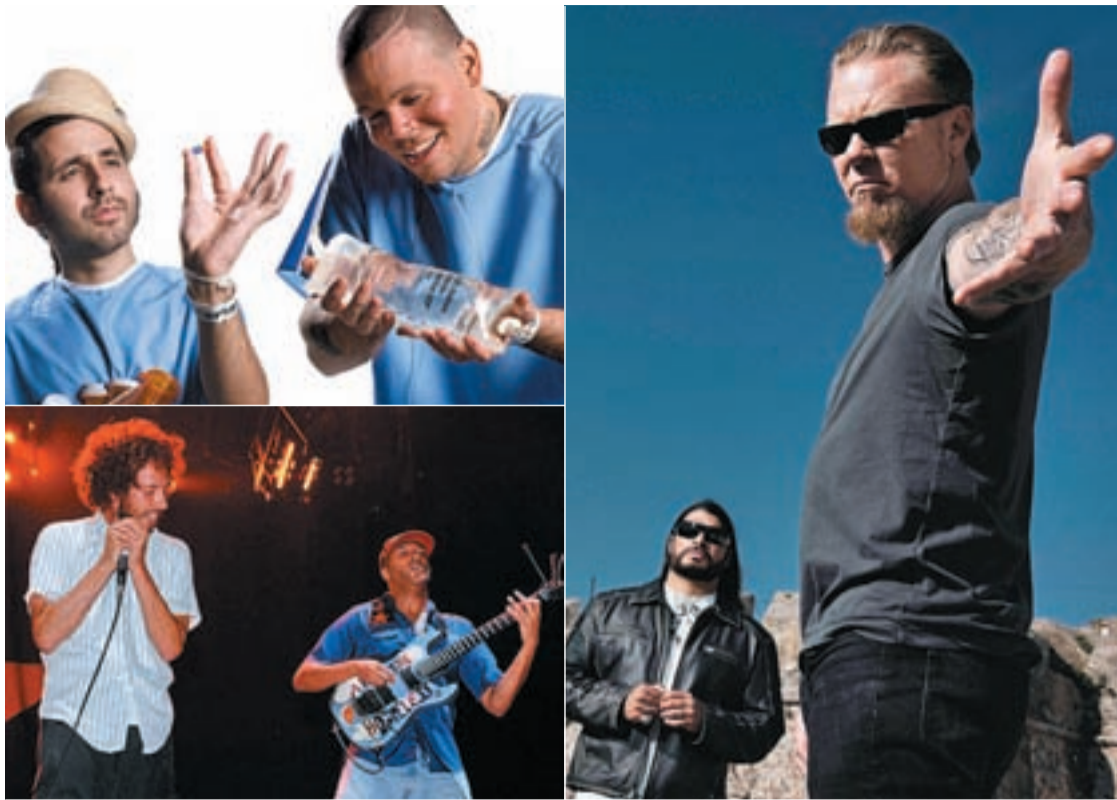
ENCABEZA EL 14 DE JUNIO El heavy metal de Metallica abanderará el cartel el último día del macro festival musical de Rock in Rio. Calle 13 pondrá los sonidos caribeños en la Ciudad del Rock. El grupo californiano Rage Against The Machine hará historia con su actuación el próximo once de junio en Arganda del Rey.

ROCK IN RIO SIGUE CONFIRMANDO ARTISTAS PARA CONFORMAR EL CARTEL