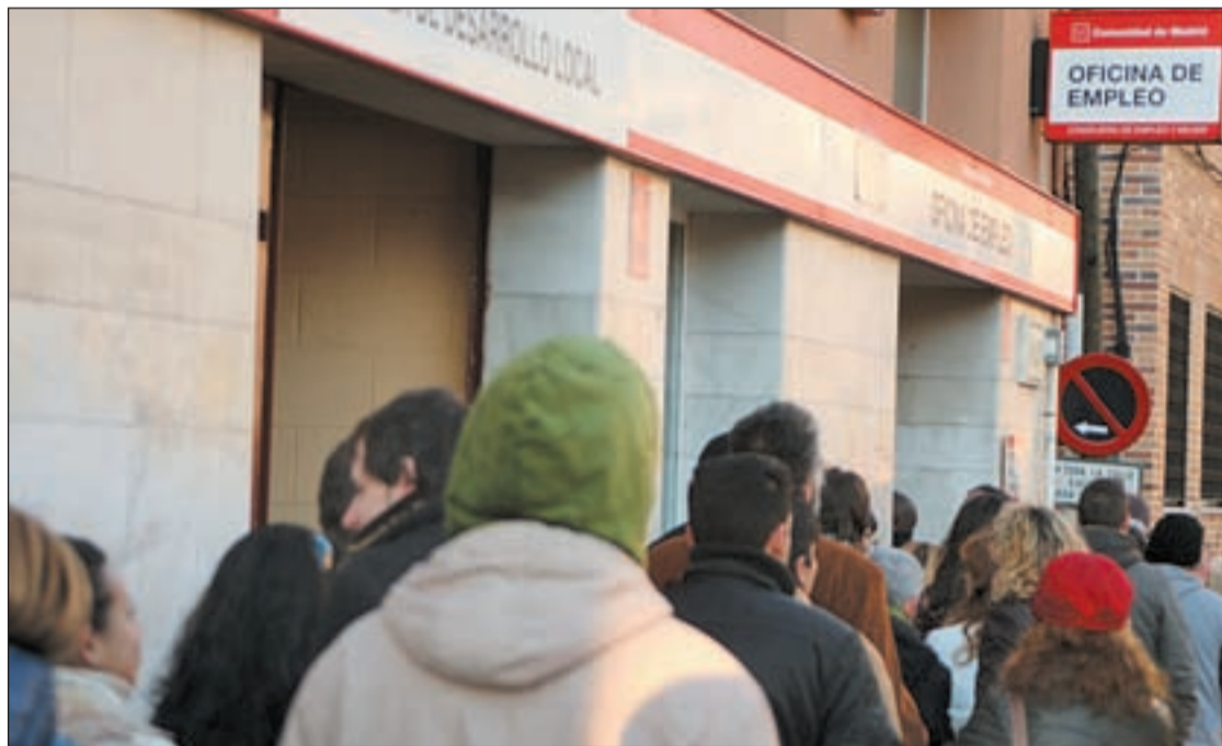
Gente haciendo cola en una oficina del INEM de la región de Madrid

Comisiones Obreras ha realizado un estudio con indicadores sociolaborales en base al acuerdo alcanzado en el Consejo local para el Desarrollo Económico del municipio. El objetivo es dar a conocer la situación real de la ciudad para aplicar políticas y medidas acordes con las necesidades de la población argandeña.