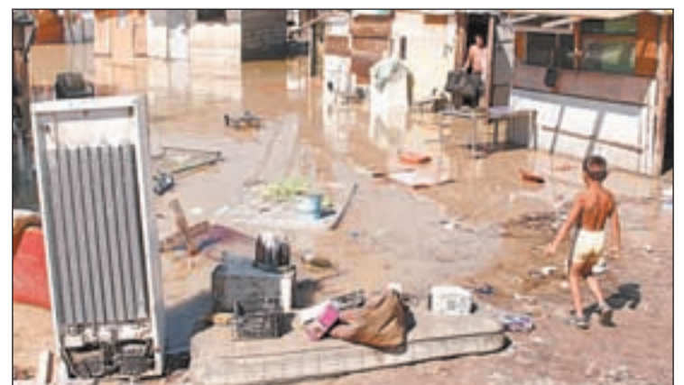
La vía pecuaria encharcada en septiembre de 2008

criticó al Consistorio de Rivas por demoler a principios de mes un camino de asfalto machacado pagado por ellos y que era utilizado por los más pequeños para acudir a la escuela. Las lluvias y el paso de camiones habían inhabilitado el sendero.