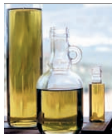
El aceite de oliva ayuda a la salud

La acreditación mediante la norma ISO 9001 permite a los centros sanitarios introducir mejoras significativas en su funcionamiento en beneficio de la atención que se presta a los pacientes. El Hospital 12 Octubre trabaja desde el año 2005 en la acreditación de servicios y unidades conforme a esta normativa.