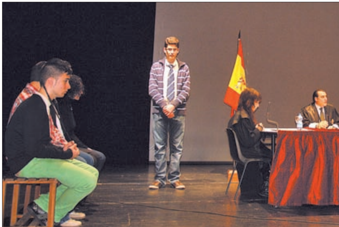
Un momento del simulacro del juicio en el Monserrat Caballé AYTO. ARGANDA

ARGANDA LOS ALUMNOS ESCENIFICARON UN PROCESO JUDICIAL