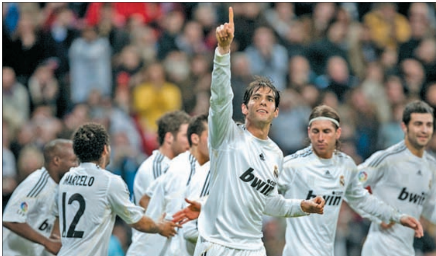
El brasileño Kaká ya marcó ante el Tenerife en el partido de la primera vuelta jugado en el Santiago Bernabéu

LOS MADRIDISTAS QUIEREN HACER LOS DEBERES EN LIGA ANTES DE MIRAR A LA CHAMPIONS