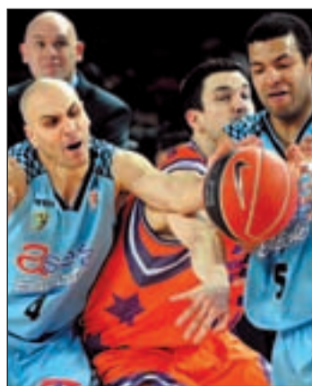
El Valencia ganó al 'Estu'

ambos se han tomado la próxima jornada de la ACB como la mejor forma de regresar a la senda del triunfo. Los blancos viajan a Alicante para jugar contra el Meridiano, mientras que los colegiales reciben al Valladolid. Por su parte, el Fuenlabrada viaja a Valencia.