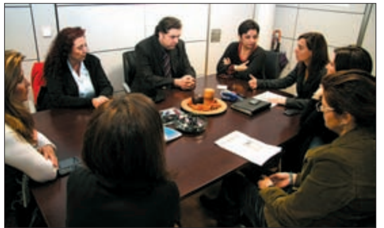
Reunión entre representantes de la ONCE y del Ayuntamiento

Es un grave problema que ahora está en los tribunales y habrá que esperar el veredicto judicial. Después tendremos que buscar la fórmula para que esos cooperativistas puedan acceder a una vivienda.