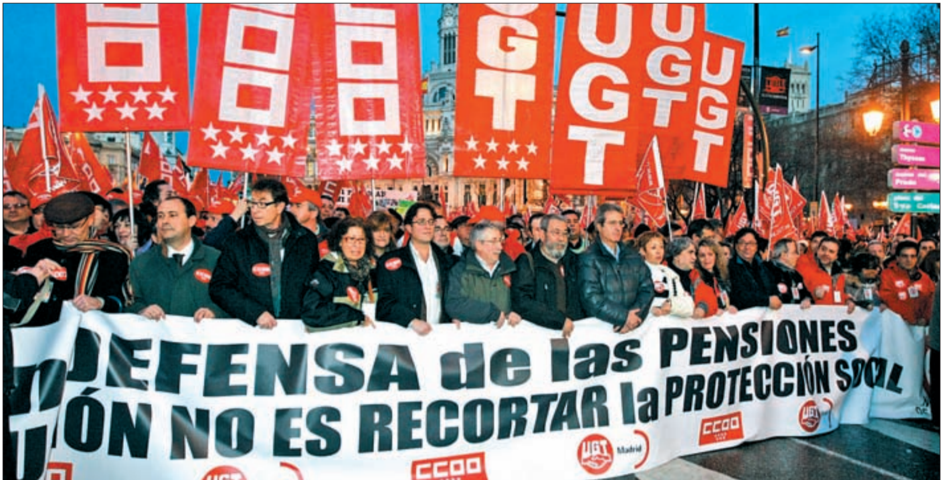
Los secretarios generales de Comisiones Obreras y UGT, Ignacio Fernández Toxo y Cándido Méndez, junto a los líderes sindicales madrileños

PROTESTA CONTRA LA PROPUESTA DE ALARGAR LA EDAD DE JUBILACIÓN