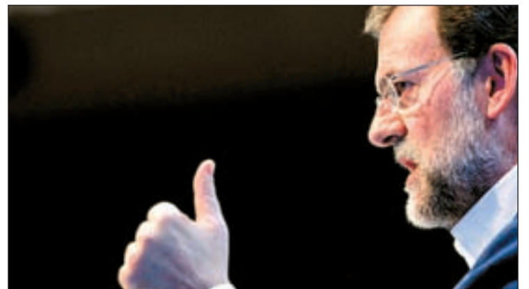
Mariano Rajoy, presidente del Partido Popular

opinión es que "si el Gobierno, de verdad, quisiera un pacto, tendría que proponer un pacto de Estado a fondo, que proponga un Gobierno de concertación", pues "lo demás serían pactos puntuales". Aguirre dijo que su punto de vista es que los pactos, por sí mismos, no significan nada.