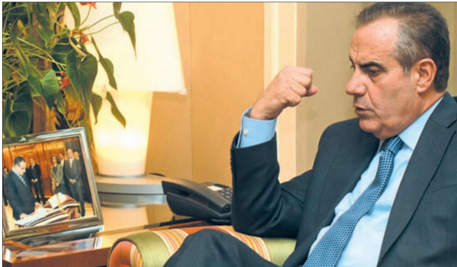
Celestino Corbacho, ministro de Trabajo, durante la entrevista concedida a GENTE.