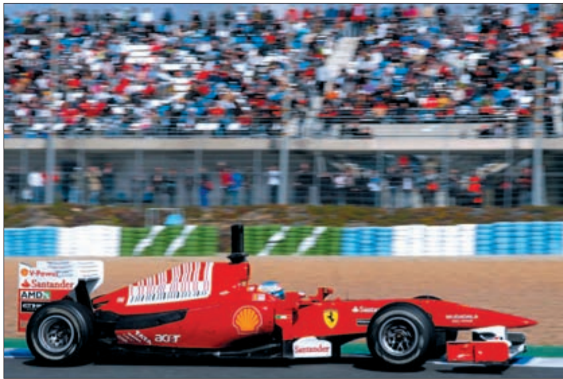
El piloto asturiano continúa mejorando las prestaciones de su bólido

FÓRMULA 1 CUENTA ATRÁS PARA EL COMIENZO DEL CAMPEONATO DEL MUNDO