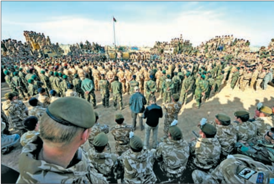
Tropas de la OTAN que participan en la Operación Moshtarak en la sureña provincia de Helmand

DETIENEN EL NÚMERO DOS DE LOS TALIBÁN EN LA CIUDAD PAKISTANÍ DE KARACHI