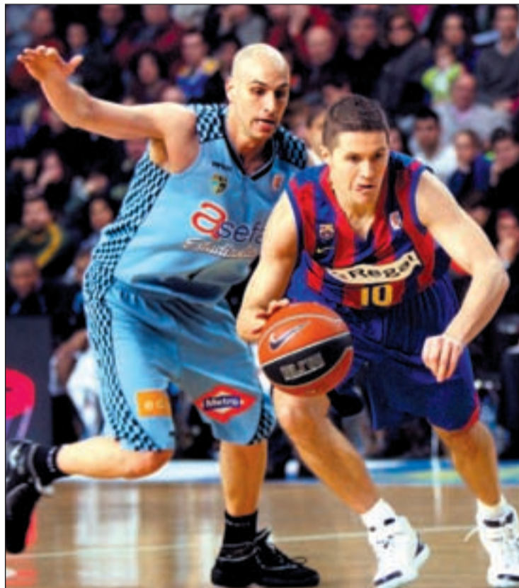
Barça y Estudiantes, dos 'clásicos' que buscarán el título