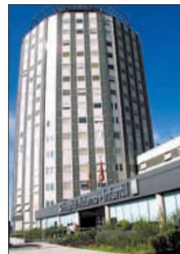
Hospital La Paz de Madrid

Después probaron este sistema en un estudio publicado en 'Clinical Pharmacology & Therapeutics', donde, con un procedimiento semiautomático, re-