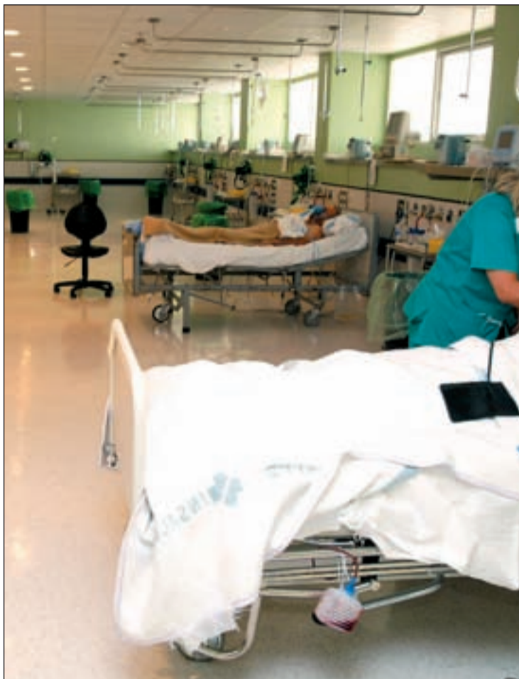
El 12 Octubre acapara premios por su buen hacer con los pacientes

Esta certificación, entregada por la Asociación Española de Normalización y Certificación - AENOR-, organismo responsable del desarrollo y difusión de las normas técnicas en España, propicia la mejora continua en la organización y facilita conseguir objetivos en áreas estraté-