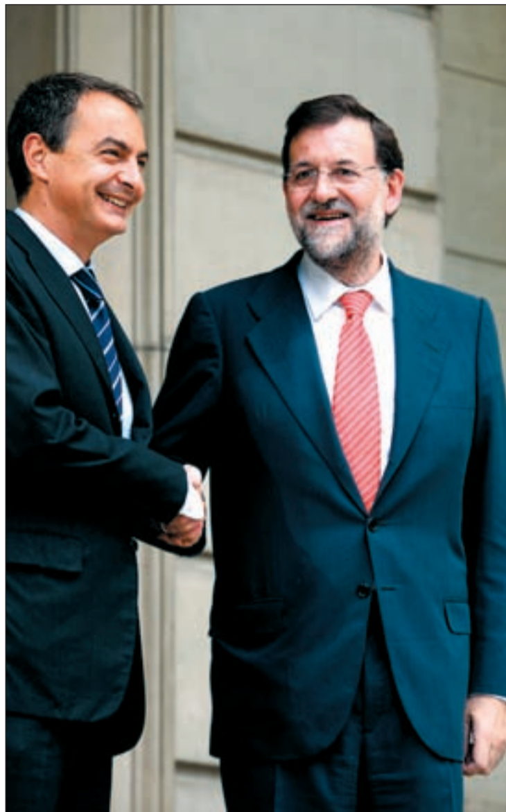
Los encontronazos entre Zapatero y Rajoy son abiertamente patentes

Rodríguez Zapatero habló del Plan de Austeridad , con el que pretenden ahorrar al menos cincuenta mil millones y rebajar el déficit público al tres por ciento en el 2013, en un debate que cobró mayor fuerza cuando varios