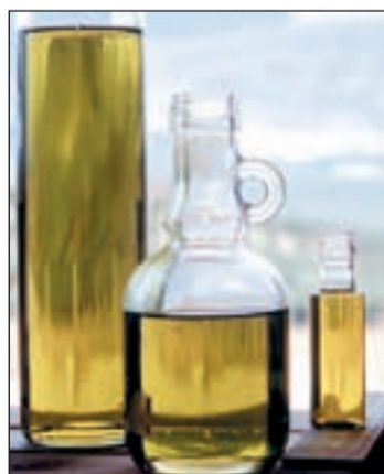
El aceite de oliva ayuda a la salud

Los estudios "demuestran que hay una correlación inversa entre el consumo de aceite de oliva y la incidencia de cáncer de mama", aunque por ahora se desconoce cual es el compuesto que lo produce.