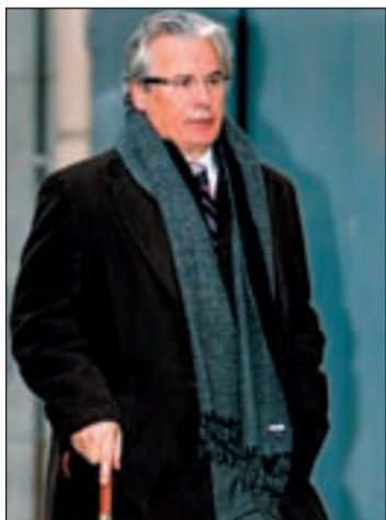
El juez Garzón

El juez Garzón tendrá diez días para presentar alegaciones. Así lo ha decidido el Consejo Judicial del Poder Judicial, las comisiones del Ente ha decidido por unanimidad escuchar al magistrado "por razones constitucionales y para que no se produzca indefensión". Según fuentes del CGPJ esta es la primera vez que se concede esta medida, ya que también es la primera vez que un juez cuya suspensión se estaba dilucidando la ha solicitado. De esta manera los vocales que determinarán la posible