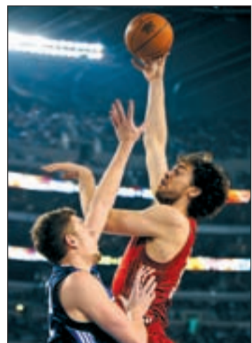
Gasol, en el All-star

Por su parte, los también internacionales españoles Rudy Fernández (Portland Trail Blazers) y Juan Carlos Navarro (Regal FC Barcelona) terminaron en el puesto sexto y séptimo, respectivamente. El buen momento del baloncesto español quedó patente ya que el base Ricky Rubio fue elegido por tercera vez de forma consecutiva como el mejor jugador joven.