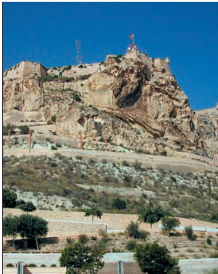
Aspecto actual del Monte Benacantil de Alicante

Por otro lado, estas obras, que se enmarcan dentro del plan de especial de protección del entorno del castillo de Santa Bárbara supondrán la remodelación de los paseos peatonales, así como la ubicación de nuevo mobiliario urbano, es decir bancos y papeleras, que aporten confortabilidad a los ciudadanos que disfruten del nuevo parque. Igualmente se velará por la conservación de esta renovación con medidas como el tratamiento de los muros de hormigón para que no