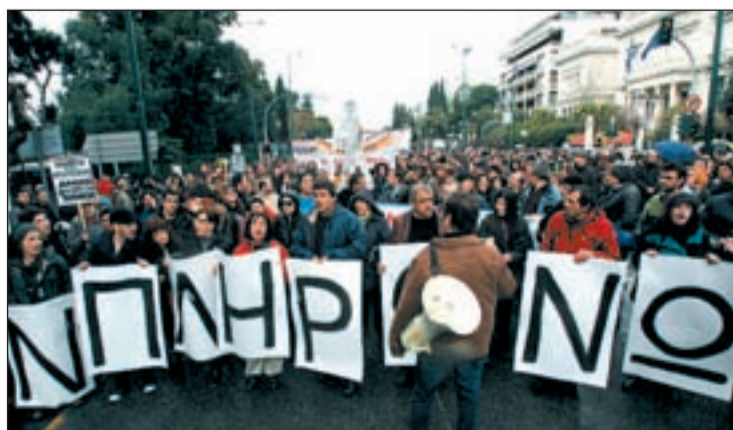
Servidores públicos marchan en Atenas contra las medidas del Gobierno

E. B./ Recorte de empleo, bajada de salarios, supresión de pagas extras y el aumento del IVA al 19% son las medidas antipopulares que Grecia aplicará para salir de la crisis. Sus principales valedores son Alemania y Francia, bajo el paraguas de la UE. El fin, evitar la caída del euro.