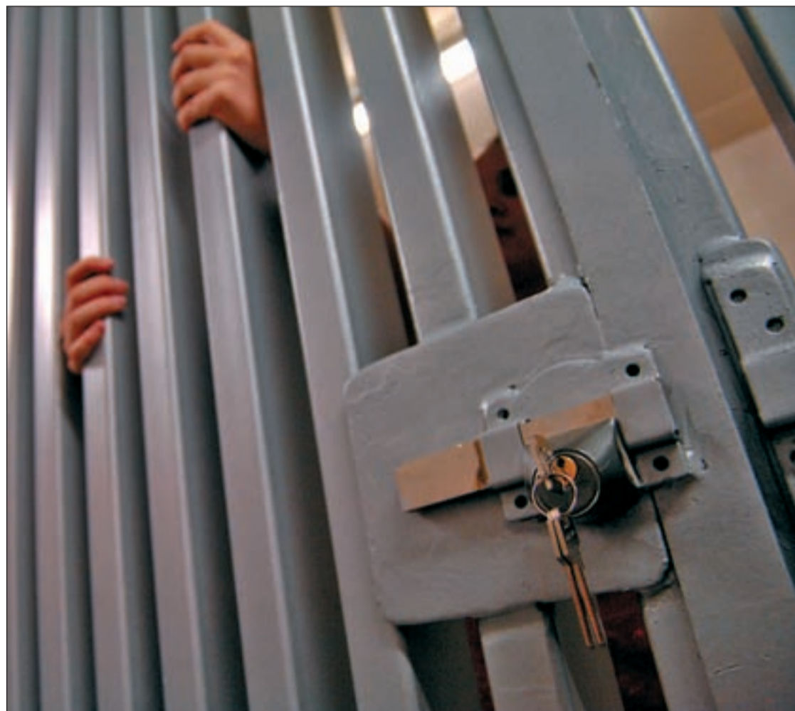
Las rejas de las puertas carcelarias encierran a muchos inocentes

Errores judiciales han condenado a muchos inocentes a quemar su vida tras los muros de las prisiones. Son años robados que nunca recuperarán