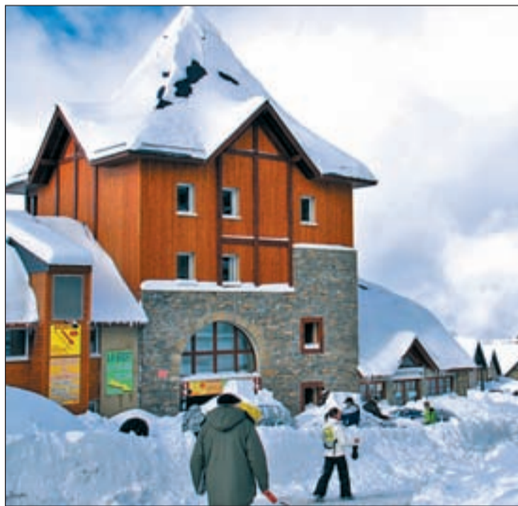
Los alojamientos familiares están muy demandados en Luz-Ardiden

El nivel de esquí que ofrecen las siete estaciones hace que los amantes del deporte blanco dispongan de trescientos treinta kilómetros en descenso, 229 pistas, 116 remontes y 677 cañones de nieve. Uno de los aspectos más atrayentes para los españoles hacia el sur de Francia son los precios y su relación con la calidad, aspectos que favorecen la