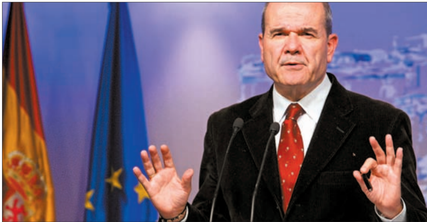
Manuel Chaves, ministro de Ordenación Territorial, durante su presentación de las nuevas ayudas estatales

EL FONDO ESTATAL DE FINANCIACIÓN LOCAL DISTRIBUIRÁ CINCO MIL MILLONES DE EUROS