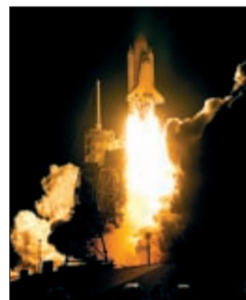
El despegue del Endeavour

tres paseos espaciales. El montaje del centro de investigación, ubicado en la órbita terrestre, es un proyecto de 100.000 millones de dólares, donde han participado 16 naciones desde 1998. Tan sólo quedan ya cuatro misiones más para culminar este logro de la ingeniería.