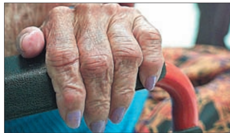
Los avances en las fracturas óseas son cada vez más frecuentes

Las cervezas empleadas tenían entre 6,4 miligramos el litro y 56,5 miligramos cada litro de silicio. Al ser dos cervezas el equivalente a medio litro, una persona puede obtener treinta miligramos del silicio nutriente, beneficioso para la salud, con sólo ingerir esta cantidad cada día.