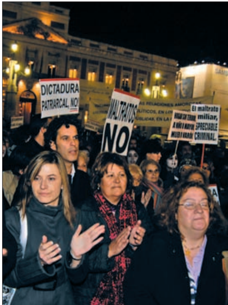
Aído en una concentración por las víctimas de Violencia de Género