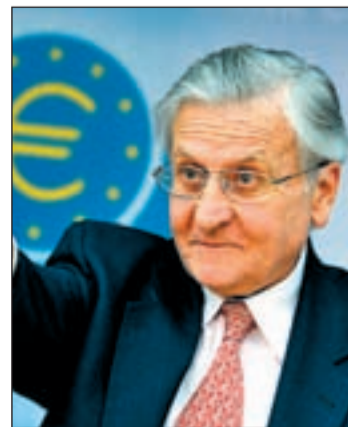
Jean Claude Trichet

tos, tras las dificultades de la deuda griega y le podrían obligar a intervenir en una improbable operación rescate. Mientras, las explicaciones en Inglaterra apenas han bajado el sobrecoste de la deuda española, que se elevó hasta el 4,15 por ciento, frente al 3,15 alemán.