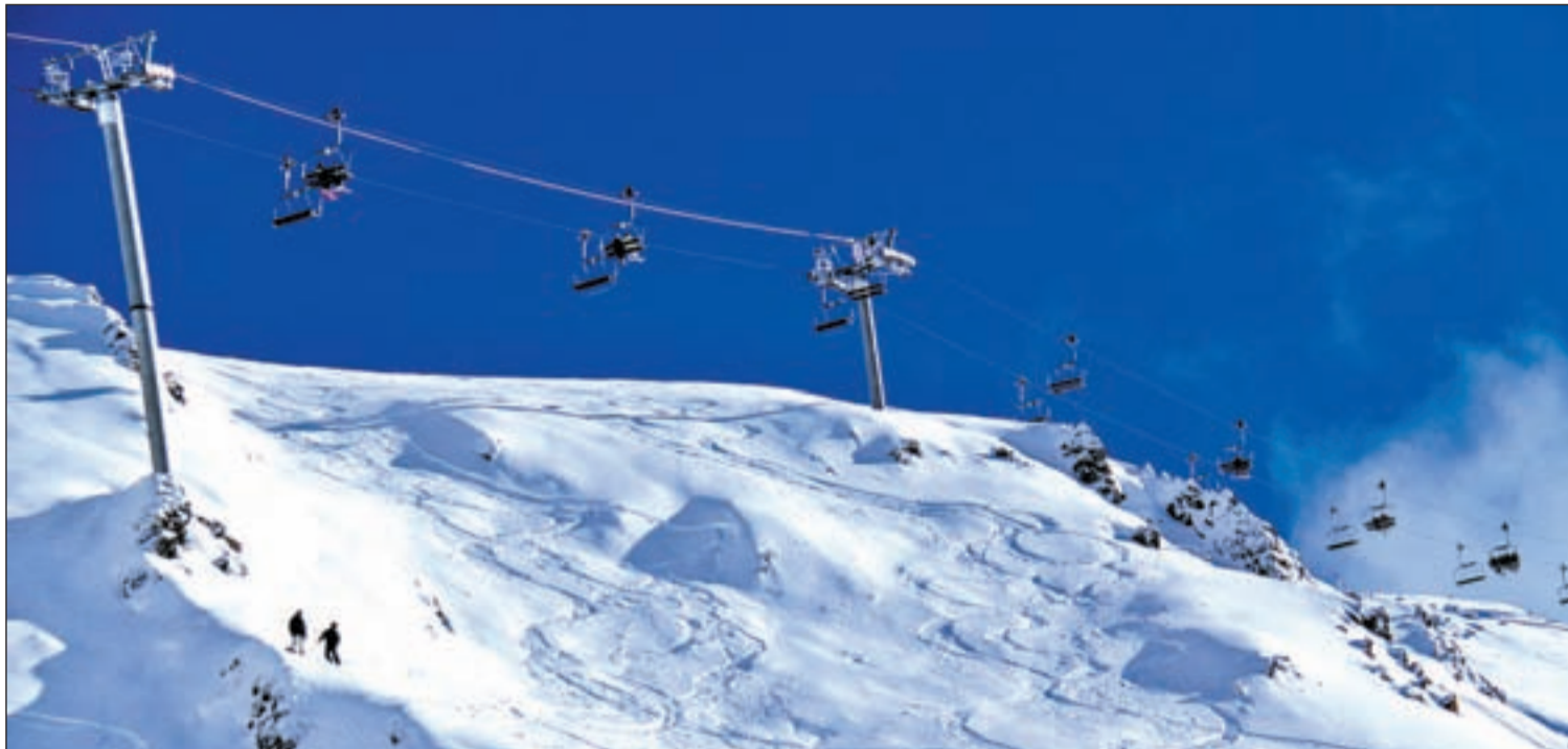
Vista de una de las doscientas veintinueve pistas de las que dispone N'PY

REPORTAJE CULTURA, OCIO Y DEPORTE, UNIDOS EN EL SUR DE FRANCIA