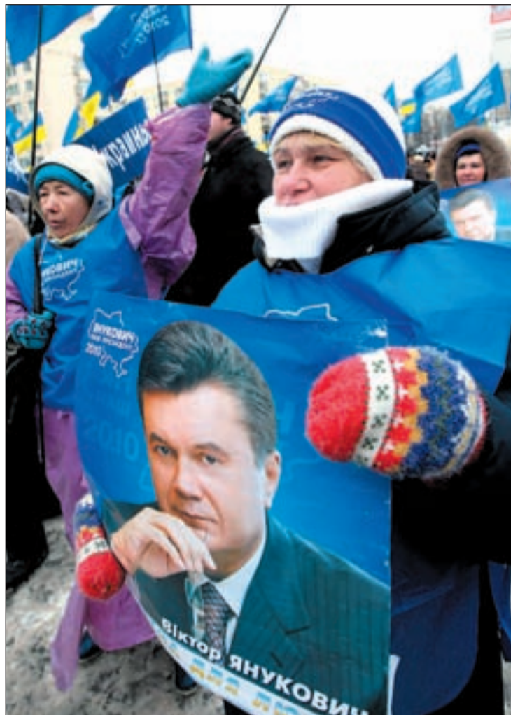
Partidarios de Yanukovich defienden su victoria electoral

El programa de Yanukovich y su ligero viraje frente al Kremlin y hacia Bruselas ha sorprendido a la comunidad internacional. El presidente electo quiere suscribir en primer lugar un acuerdo de libre comercio con la UE que sirva de tram-