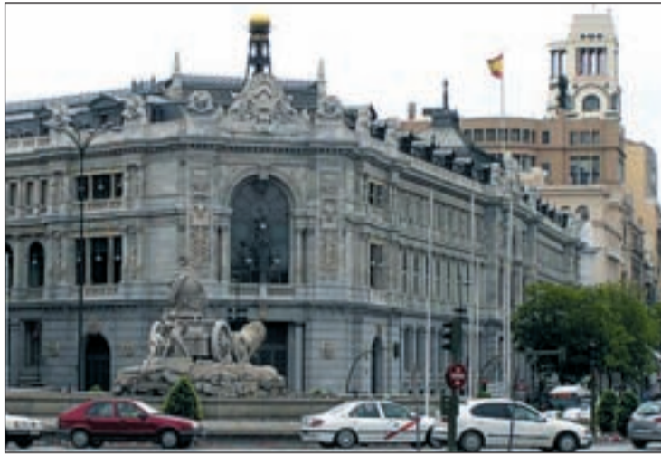
El Gobierno aprieta para cumplir la promesa de reducir el déficit

En el Ministerio de Hacienda dicen que la previsión de bonos, obligaciones y otros instrumentos financieros no sobrepasarán los 97.000 millones; es decir, en torno a los sesenta y dos mil mi-