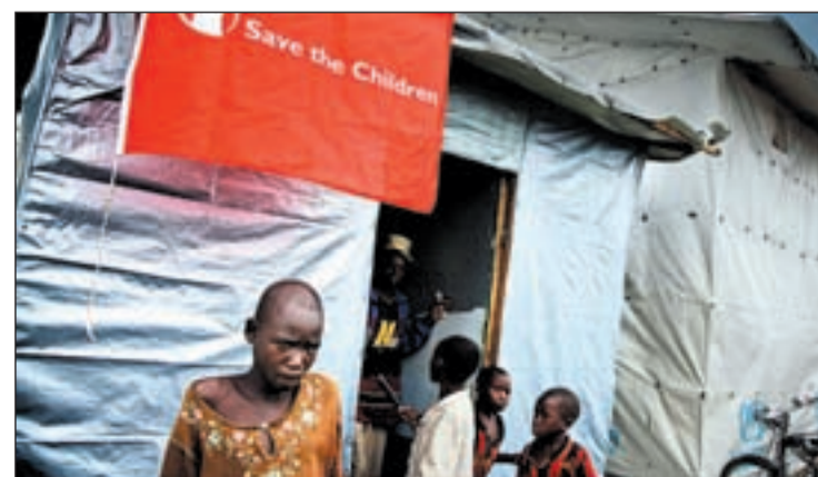
Uno de los proyectos de Save The Children en África