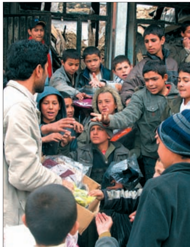
Civiles y desplazados reciben provisiones de auxilio de una ONG

Los misiles no son el único enemigo de los ciudadanos afganos. Los atentados, como el que tuvo lugar en Helmand y que acabó con la vida de al menos otros siete civiles, incrementan el riesgo. Según ha informado la OTAN, el suelo de la región sureña está minado lo que po-