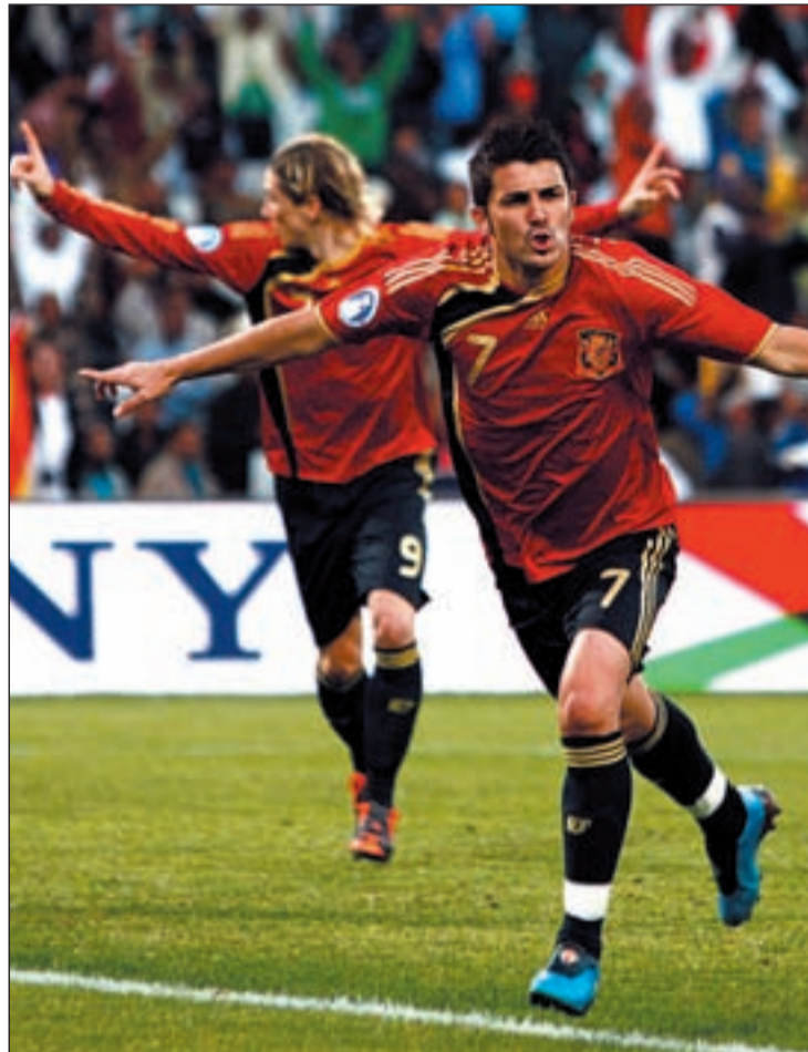
Villa es uno de los fijos para Vicente Del Bosque

En cambio, otros como Jesús Navas que debutó recientemente como internacional absoluto intenta convencer definitivamente a Del Bosque. En idéntica situación se encuentran otros jugadores como Pablo