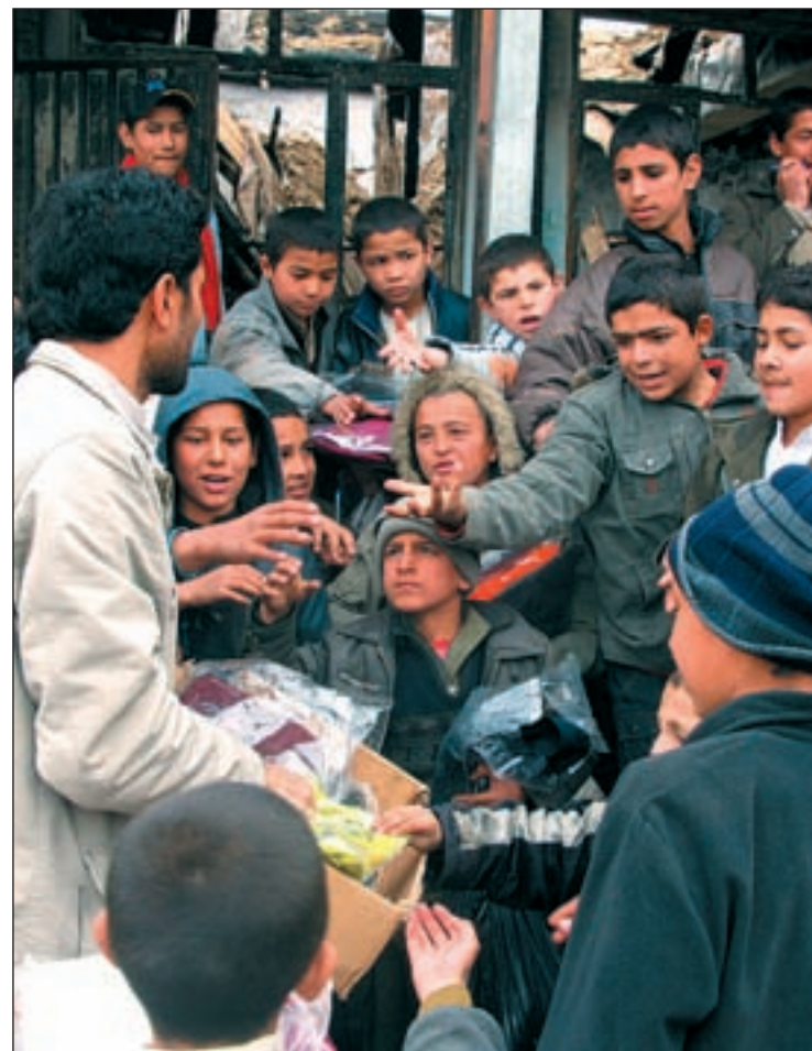
Civiles y desplazados reciben provisiones de auxilio de una ONG

Los misiles no son el único enemigo de los ciudadanos afganos. Los atentados, como el que tuvo lugar en Helmand y que acabó con la vida de al menos otros siete civiles, incrementan el riesgo. Según ha informado la OTAN, el suelo de la región sureña está minado lo que po-