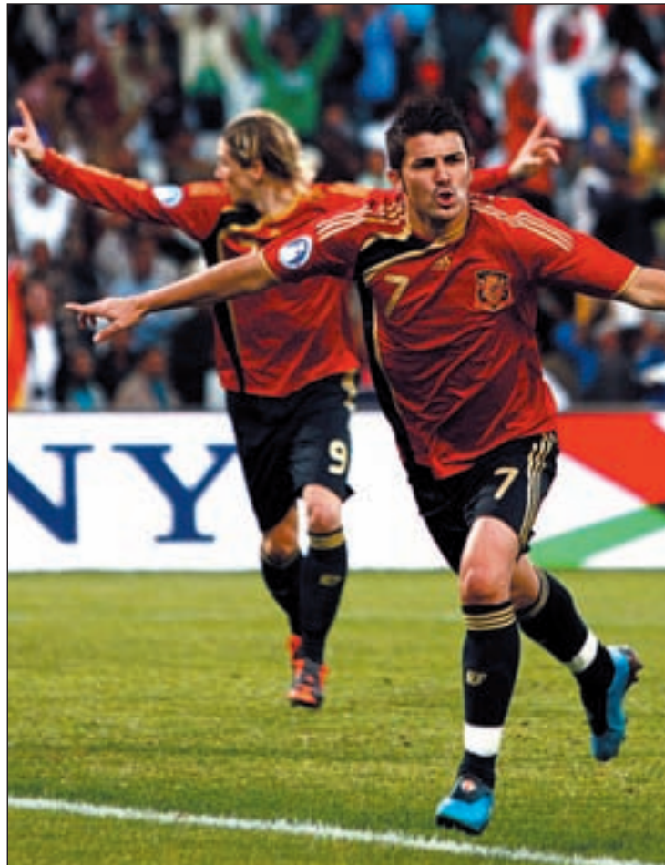
Villa es uno de los fijos para Vicente Del Bosque

En cambio, otros como Jesús Navas que debutó recientemente como internacional absoluto intenta convencer definitivamente a Del Bosque. En idéntica situación se encuentran otros jugadores como Pablo