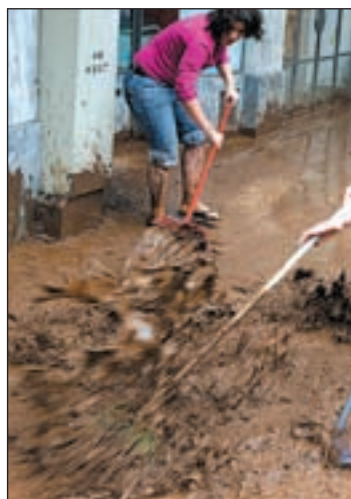
Achicando fango en Madeira

El Gobierno regional de la isla de Madeira ha indicado que no prevé declarar el estado de zona catastrófica en la zona, después del temporal de lluvia que comenzó la madrugada del viernes al sábado y que hasta el momento ha dejado 42 muertos y cuatro desaparecidos. Las autoridades locales han reconocido que las deficiencias en la comunicación llevaron a algunos responsables a hablar de hasta 250 desaparecidos.