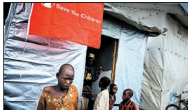
Uno de los proyectos de Save The Children en África