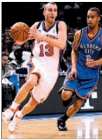
El base canario el día de su debut