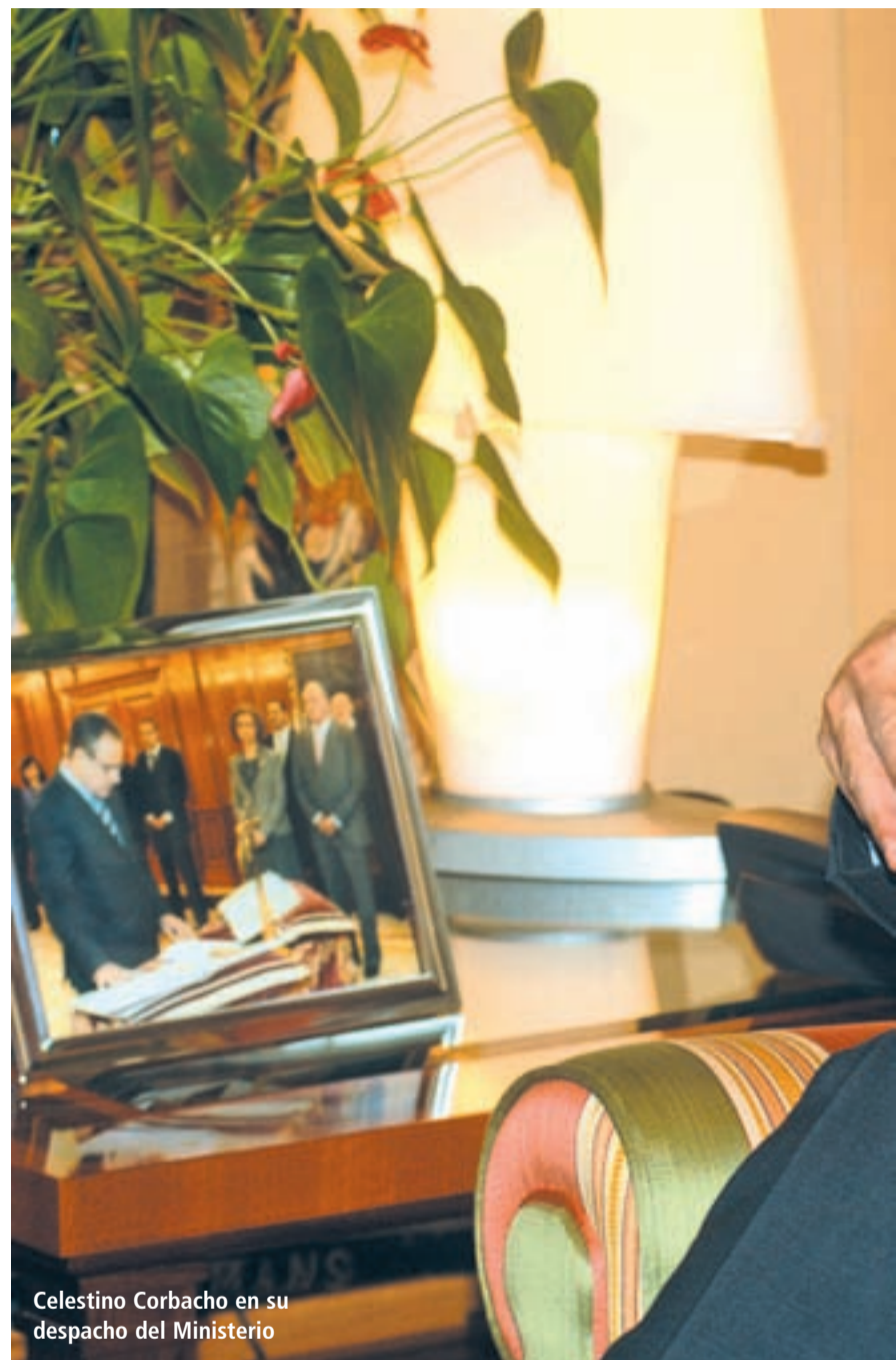
Celestino Corbacho en su despacho del Ministerio

En el contexto de crisis económica, las cuentas de la Seguridad Social siguen teniendo superávit, y de hecho ha sido superior al que nosotros mismos preveíamos a principios de 2009. Es un balance que, desde luego, no pueden hacer muchas instituciones ni muchas empresas. Es una buena noticia que da seguridad a todas las personas que cobran pensiones de jubilación, viudedad, orfandad... La previsión es que 2010 se cierre también con más ingresos que gastos, de manera que las cuentas están saneadas.