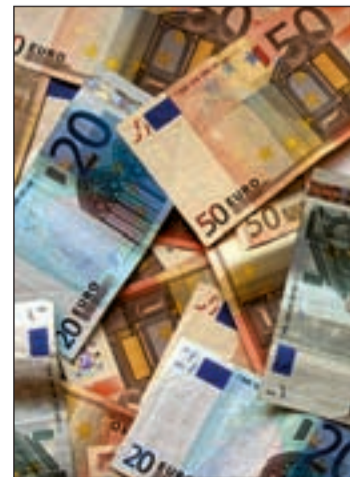
El dinero fluye sin control

El informe de Gestha, elaborado sobre los últimos diez años, alerta de que el crecimiento del fraude fiscal y la caí-