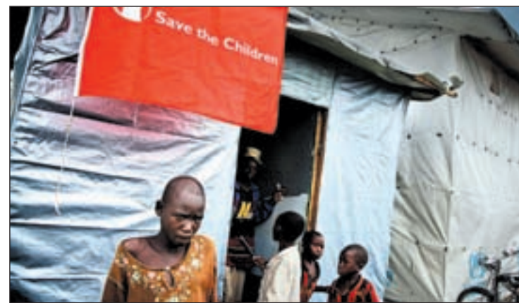
Uno de los proyectos de Save The Children en África