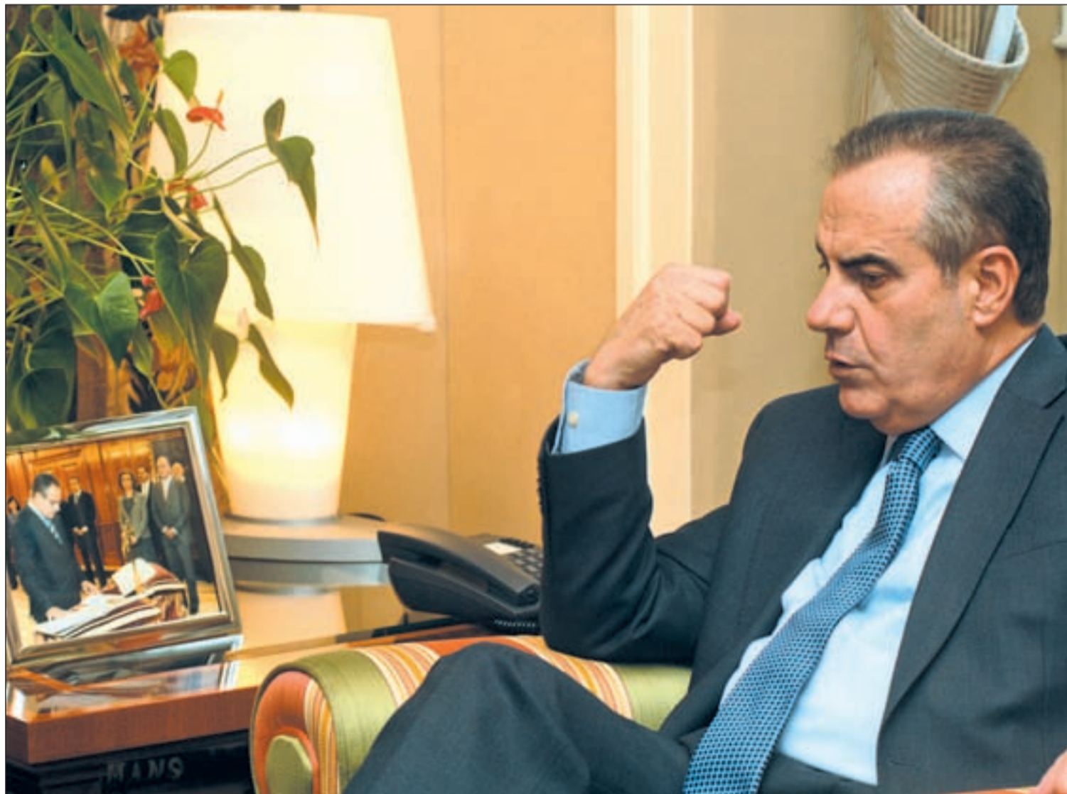
Celestino Corbacho, ministro de Trabajo, durante la entrevista concedida a GENTE

Celestino Corbacho asegura en una entrevista a GENTE que la medida, si se aplica por Decreto Ley, podría ser efectiva antes del verano • El ministro insiste: “La confianza y el crédito son la solución” Págs. 2, 10 y 11