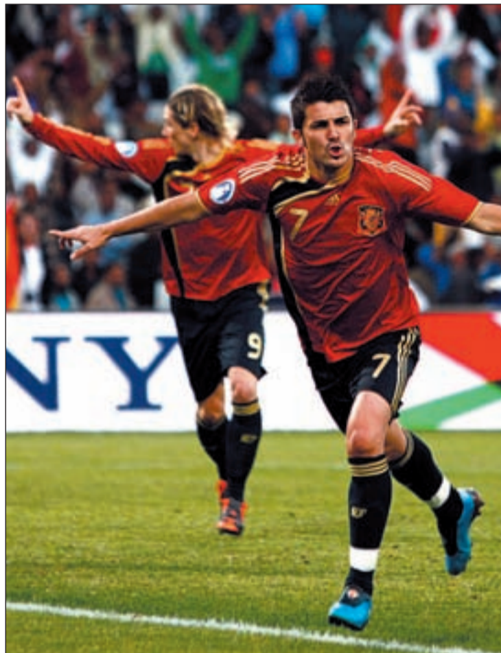
Villa es uno de los fijos para Vicente Del Bosque