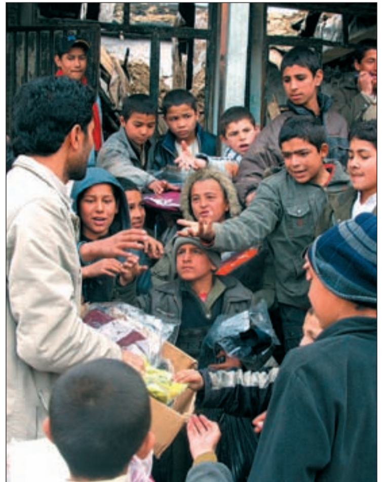
Civiles y desplazados reciben provisiones de auxilio de una ONG

Los misiles no son el único enemigo de los ciudadanos afganos. Los atentados, como el que tuvo lugar en Helmand y que acabó con la vida de al menos otros siete civiles, incrementan el riesgo. Según ha informado la OTAN, el suelo de la región sureña está minado lo que po-