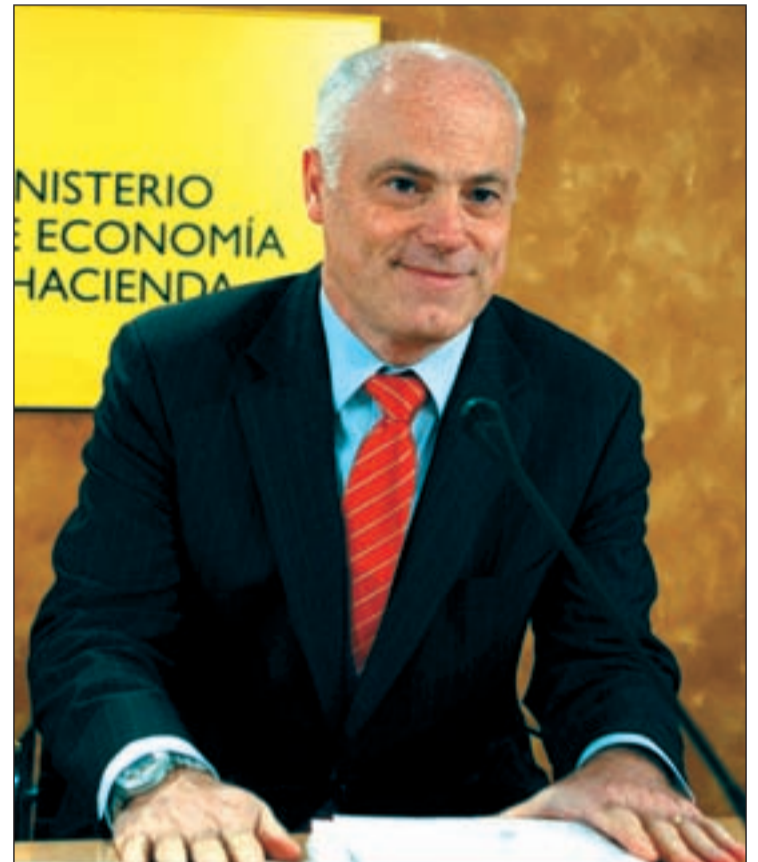
José Manuel Campa, defensor en el exterior de nuestra economía

En relación a la creación de empleo, el gobernador del Banco de España, Miguel Ángel Fernández Ordóñez, no fijó fecha, pero se mostró más contundente al afirmar que en España la reforma laboral es "imprescindible" para crear empleo y cumplir el Pacto de Estabilidad Presupuestario, reactivar la economía y que el PIB vuelva a