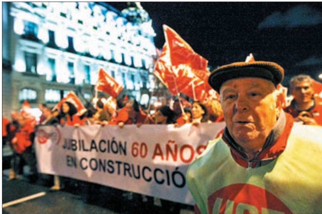
A pesar de la lluvia, Madrid se movilizó contra el aumento de la edad de jubilación a 67 años

Frente a la tesis del Gobierno, tanto UGT como CC OO defienden en las manifestaciones la mejora de la figura de la jubi-