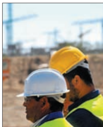
Desatascos para el pago a Pymes

El texto de CiU elimina la posibilidad de que las partes pacten ampliar los plazos de cobros sin pagar intereses en compensación, no pudiendo superarse los dos meses en el caso de cualquier operación.