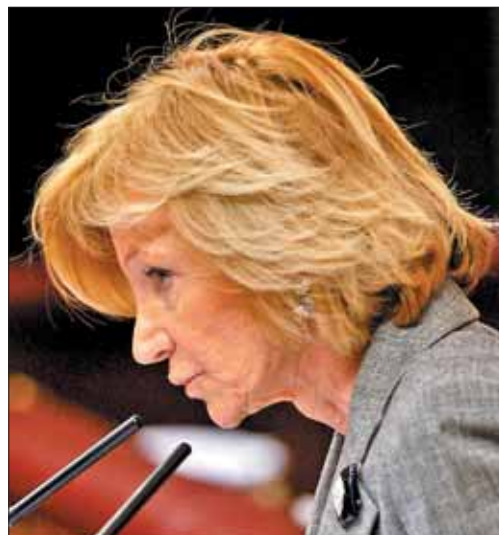
La vicepresidenta y ministra de Economía, Elena Salgado

Salgado está manteniendo estos días una ronda de reuniones con sus colegas europeos para trasladar la estrategia de la presidencia española de la UE para salir de la crisis económica. Una iniciativa que se ha visto alterada por la situación climática. La ministra tuvo que aplazar el viaje previsto a París para reunirse con su homóloga francesa, Christine Lagarde, ante el fuerte temporal de nieve en España. Por el mismo motivo también retrasó la reunión que iba a mantener con el secretario del Tesoro de Reino Unido, Alistair