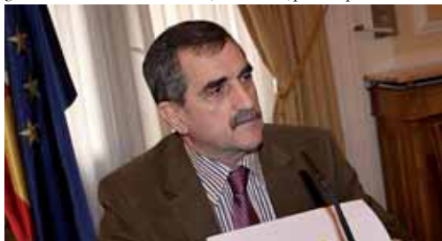
Un momento de la rueda de prensa ofrecida por Raúl Ruiz Cortés.

Una de las novedades de este fondo consiste en que los ayuntamientos recibirán el 85% del presupuesto concedido en el momento en el que la petición sea aprobada. El 15% restante se entregará cuando se justifique la finalización de la obra. Al Ayuntamiento de la capital le corresponden casi 9 millones de euros que le permitirán desarrollar 34 proyectos de inversión.