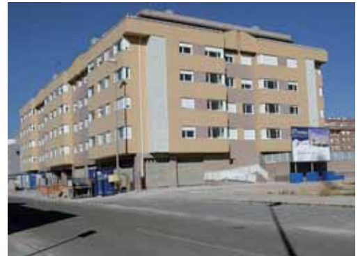
En la imagen, uno de los bloques ilegales ubicados en el Sector 8.

Por último, el coordinador de IU señaló que el alcalde le ha pedido mantener un nuevo encuentro para intentar buscar una so-