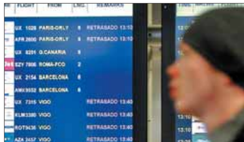
Imagen del Aeropuerto de Barajas

que las tasas de navegación se reducirán un 15% en dos años, de acuerdo con el nuevo decreto ley aprobado, lo que supondrá un ahorro de 120 millones de euros. Fomento pretende reducir la tarifa de vuelo desde los 82 euros de media actuales hasta los 78 euros en 2011.