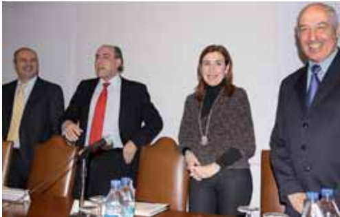
Momentos antes de la jornada ofrecida en el Complejo Castilla.

La directora general de Turismo declaró a su vez que el Ejecutivo Regional tiene programado un "extenso abanico de posibilidades culturales como conciertos y actividades que tendrán como escenarios los Bienes de Interés más importantes del Camino. El mejor modo de darlas a conocer es a través de los albergues".