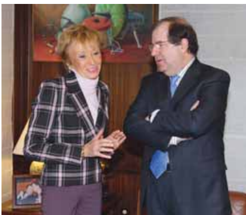
María Teresa Fernández de la Vega y Juan Vicente Herrera en Presidencia.

Vicente del Bosque ha obtenido el Premio Castilla y León del Deporte, en su edición correspondiente a 2009. El Jurado ha acordado, por unanimidad, conceder este galardón a Vicente del Bosque por su brillante trayectoria e historial deportivo como futbolista y entrenador del Real Madrid y de la Selección Española, con un excelente balance de resultados que le han llevado a ser elegido recientemente Mejor Seleccionador del Mundo.