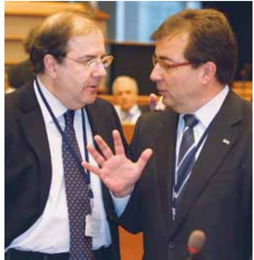
Juan Vicente Herrera y Guillermo Fernández Vara conversan en Bruselas.

El PSCyL, mediante un comunicado de prensa, expresó su felicitación al presidente de la Junta: "es ahora cuando Herrera puede demostrar que también está implicado en el trabajo europeo a favor de nuestros intereses. Desde el PSCyL le pedimos que desde su nuevo cargo busque consensos para conseguir garantizar el mantenimiento de la PAC más allá del 2014, o los beneficios para Castilla y León en el debate del futuro de las políticas de cohesión".