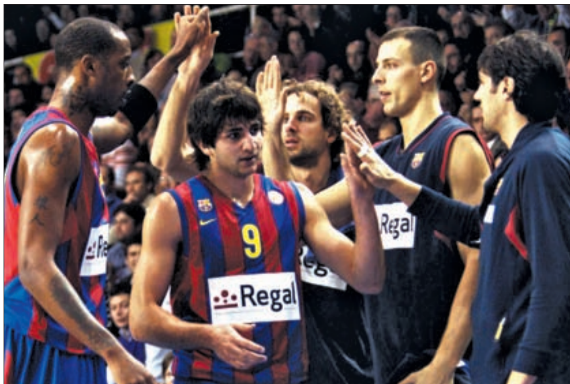
Ricky Rubio se ha convertido en una de las piezas clave del Regal Barcelona

LA SEMANA PRÓXIMA EMPIEZA LA NUEVA FASE DE LA EUROLIGA