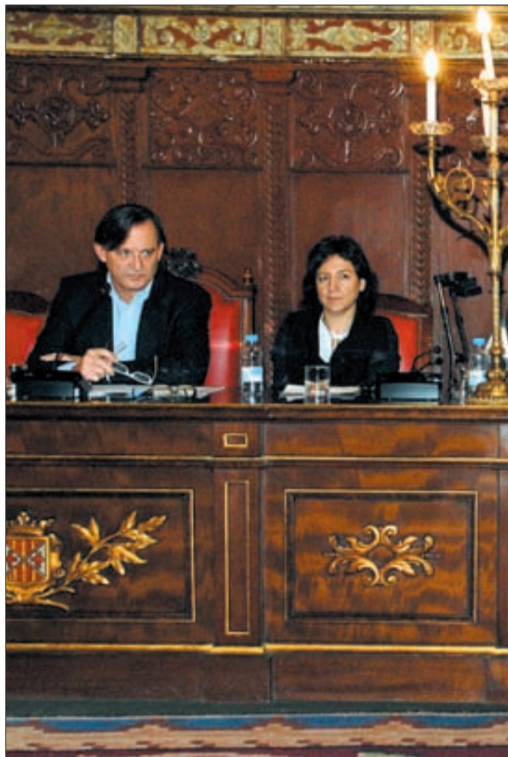
El alcalde de Vic, Josep María Vila d'Abadal

ción y ha criticado duramente la actitud del consistorio torrejonero, apelando a que el padrón debe emarcarse en la legislación del Estado. Curiosamente, la normativa nacional que obliga a la inscripción en el registro de vecinos fue promovida en el año 1997 por Mariano Rajoy, quien en ese momento era ministro de Administraciones Públicas durante el