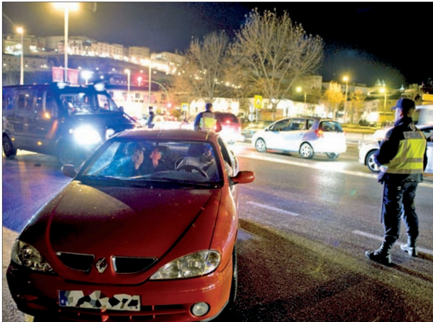
Control policial en uno de los accesos a la ciudad de Toledo con motivo del Consejo Informal de Ministros de Interior y Justicia de la UE

Reunión informal de los responsables de Justicia, Interior e Inmigración • El delegado del Gobierno ha pedido perdón a los ciudadanos por las posibles molestias causadas por el gran despliegue policial Pág. 4