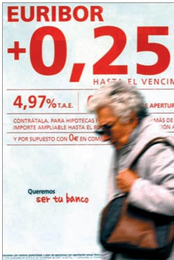
Por fin, buena noticia para comprar casa, pues concederán más hipotecas

es que para conceder el crédito, dicen los portavoces bancarios, seguirán mirando con lupa la solvencia del cliente que, por norma, debe disponer de buen patrimonio, trabajar con nómina y una antigüedad en su empresa nunca inferior a tres o cuatro años. En cuanto a tipos de interés medio prestados, éstos están situados en el 4,09 por cien, con un descenso del 26,7 por ciento