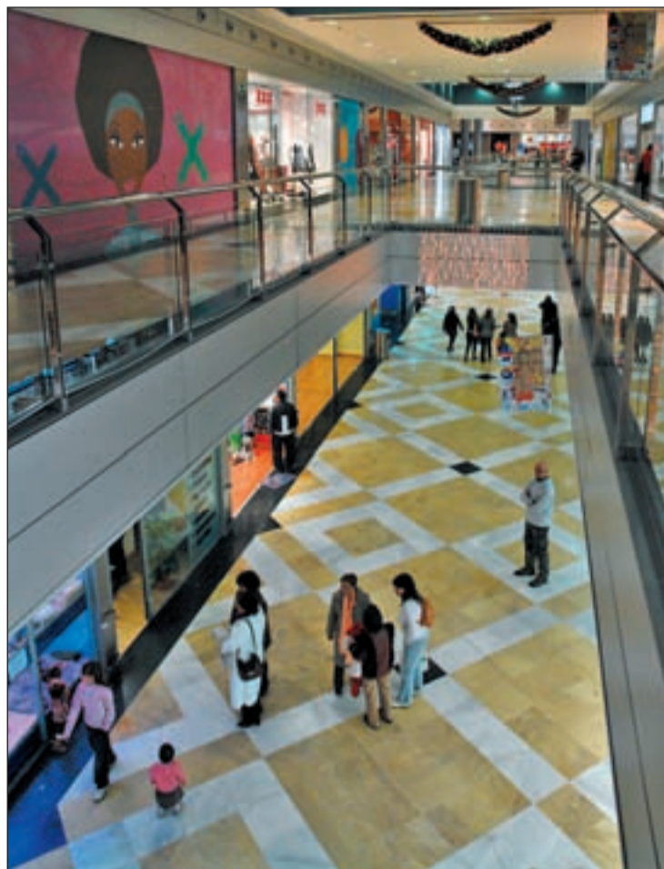
La creación de más empresas síntoma de mejora económica

En cuanto a los efectos de comercio devueltos por impago ascendieron a 701 millones de euros durante el mes de noviembre, cifra inferior en un