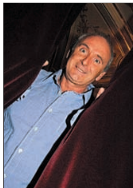
El humorista en el teatro

Lo que tiene claro es que quiere experimentar, romper con su pasado de 'reportero del Crónicas'. "He querido dejar atrás esa etapa. Es normal que a la gente le marcara, fueron ocho años en antena con mucha audiencia, muy buenos años. Me divertí mucho". Admite que la gente aún le identifica con el "reportero machacón" que le dio la fama y que no se quedó con ganas de entrevistar a nadie: "Iba a las fiestas de famosos o a la calle a preguntar a desconocidos, pero con el mismo estilo; y siempre preferí a la gente anónima ".