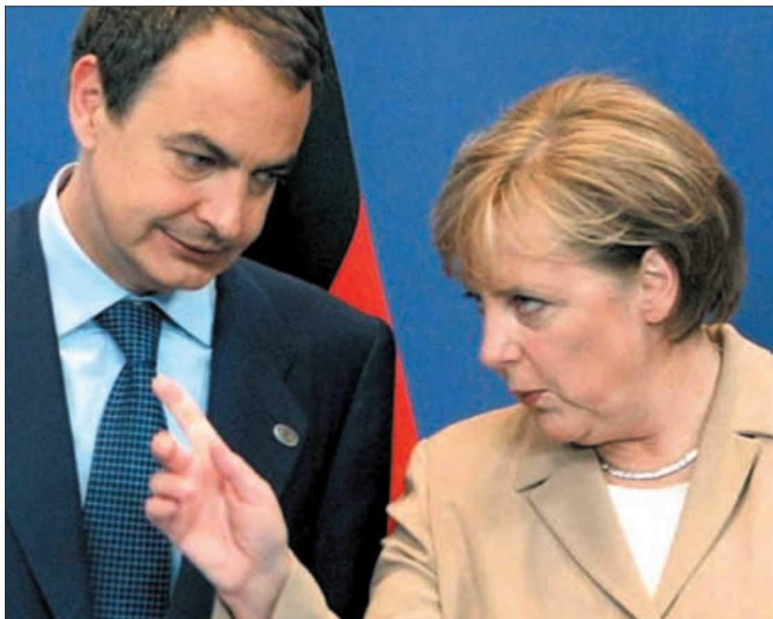
José Luis Rodríguez Zapatero y Angela Merkel, en animada y significativa conversación

No lo va a tener fácil el líder socialista. Ni en España ni fuera. Como muestra, el clásico botón. Un día después de la sonora reacción del Bernabéu, la canciller alemana, Angela Merkel, ratificaba las palabras de su ministro de Economía, Rainer Brüderle, y advertía de que imponer sanciones a los países europeos que no cumplan los objetivos nacionales contemplados en la estrategia UE-2020 “carecía de sentido”. Bastaron estas palabras de Merkel para que el Partido Popular, con Ma-