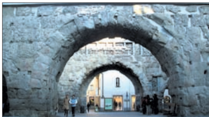
El centro de la región mantiene vestigios del pasado GENTE

Thuile, Cervino o Pico San Bernardo son las mejores y los precios son asequibles. Las pistas son espaciosas, anchas, seguras y con varias posibilidades. Los