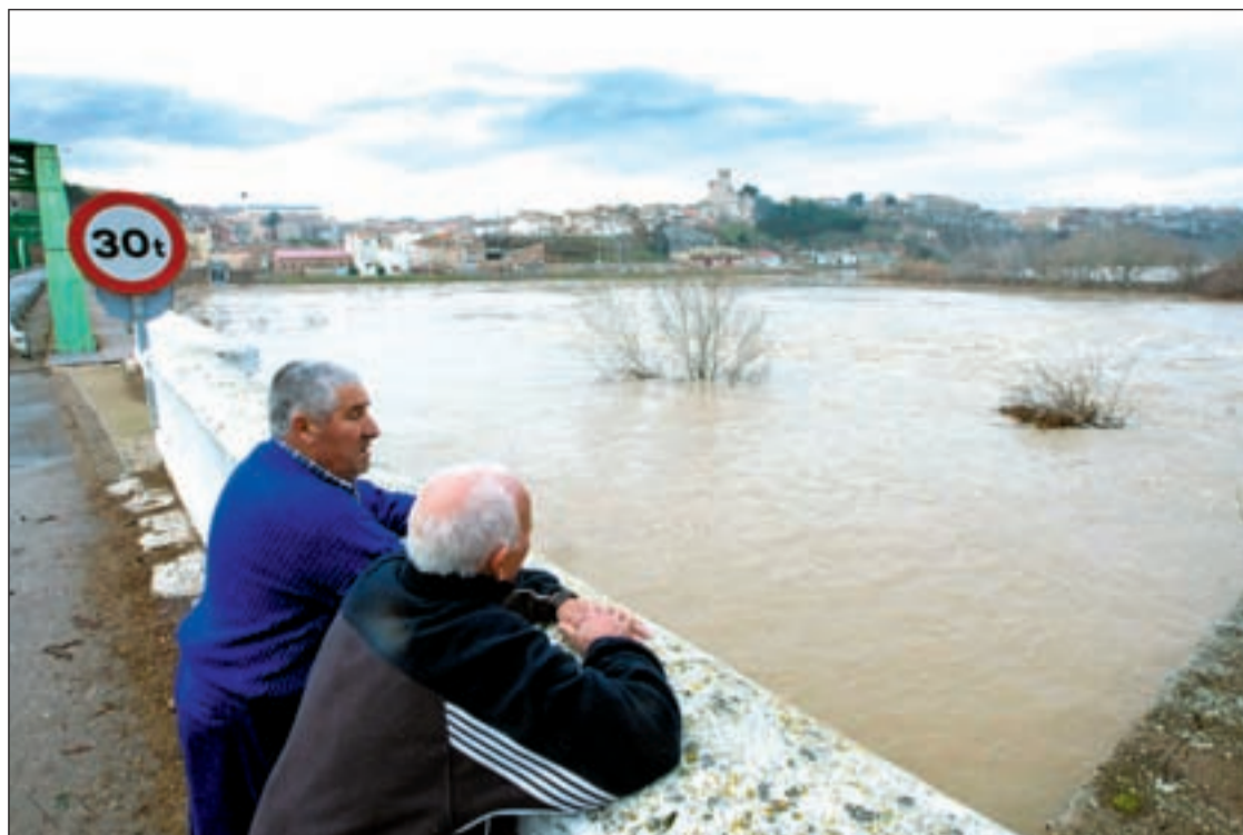
Dos hombres observan el Ebro casi desbordado a su paso por la localidad zaragozana de Gallur

DEBIDO A LAS FUERTES LLUVIAS Y AL DESHIELO DE LAS NEVADAS