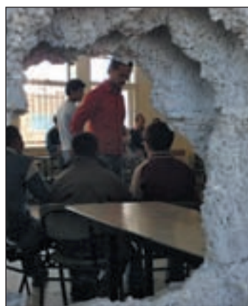
Una escuela tras los bombardeos

muchas instalaciones civiles han sido destrozadas, como la central eléctrica que ha estado funcionando a un 62 por cien de su capacidad. La reconstrucción de la zona es una tarea muy costosa porque Israel ha mantenido el bloqueo y sólo permite el paso de los insumos básicos.