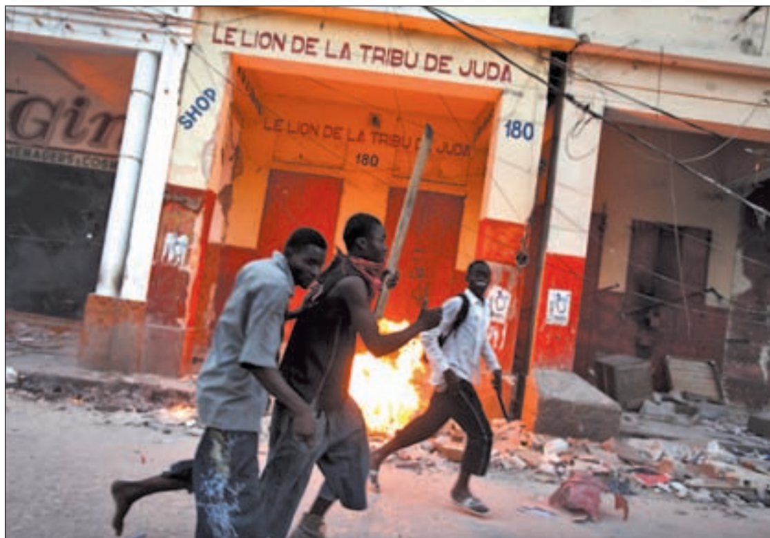
Algunos haitianos recurren a la violencia para garantizar su supervivencia ante la falta de asistencia

Los veintiocho tripulantes del Maran Centaurus , superpetrolero griego, han sido liberados por los piratas somalíes tras pagar fuerte rescate, estimado entre cinco y siete millones de dólares. El suculento rescate ha sido un motivo de enfrentamiento entre dos grupos rivales de esos piratas. El 29 de noviembre, el buque-tanque fue abordado junto a las Islas Seychelles. La ONU y la autoridad somalí han coincidido en que precisan medidas para el desarrollo del país, entre ellas el pago de licencias de pescas por parte de las flotas internacionales para acabar con la miseria y con el problema de la piratería desde Somalia.