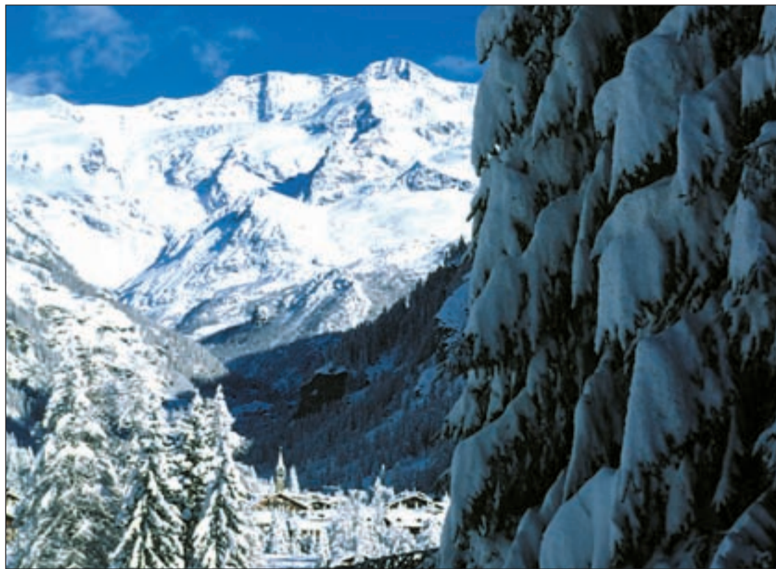
Vista de una de las cumbres de la región italiana

Para los amantes de la nieve el Valle d'Aosta ofrece posibilidades de todo tipo, para los principiantes y para los más arriesgados. Las prestaciones de las estaciones de Courmayeur, La