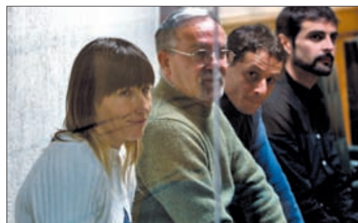
Cuatro de los miembros del GRAPO durante el juicio