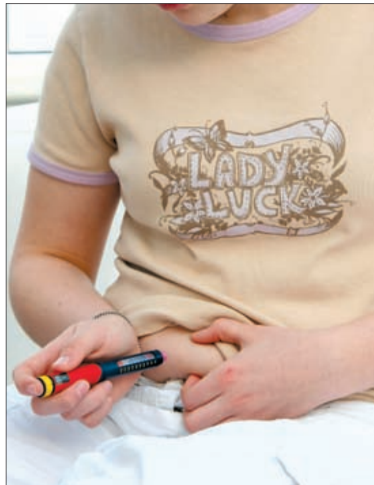
Nuevos avances descubren las causas de por qué deviene la diabetes

La mayoría de variantes afecta a la secreción de insulina por los islotes pancreáticos. Sólo dos potencian la resistencia a la insulina. "Que indica que la arquitectura genética de los dos fenotipos (secreción e insulino-resistencia) es diferente, y que