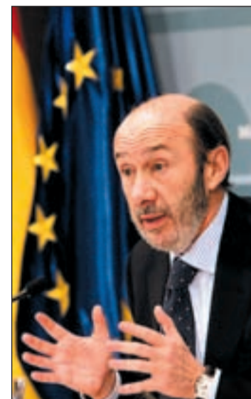
Alfredo Pérez Rubalcaba

Rubalcaba, quien admitió no ser partidario de comentar los comunicados de la banda terrorista, puntualizó no obstante, que el documento de la banda conocido este fin de semana integra una “componente interna importante”, lo que, a su juicio, evidencia que hay “una permanente llamada a la unidad” y, por lo tanto, “algún temor de que esa unidad esté en riesgo”. En el documento publicado en el periódico Gara este domingo, pero fechado el 31 de diciembre, cuando todavía no se habían desplegado las últimas