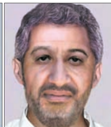
Foto de Osama Bin Laden, de Gaspar Llamazares y el montaje elaborado por el FBI