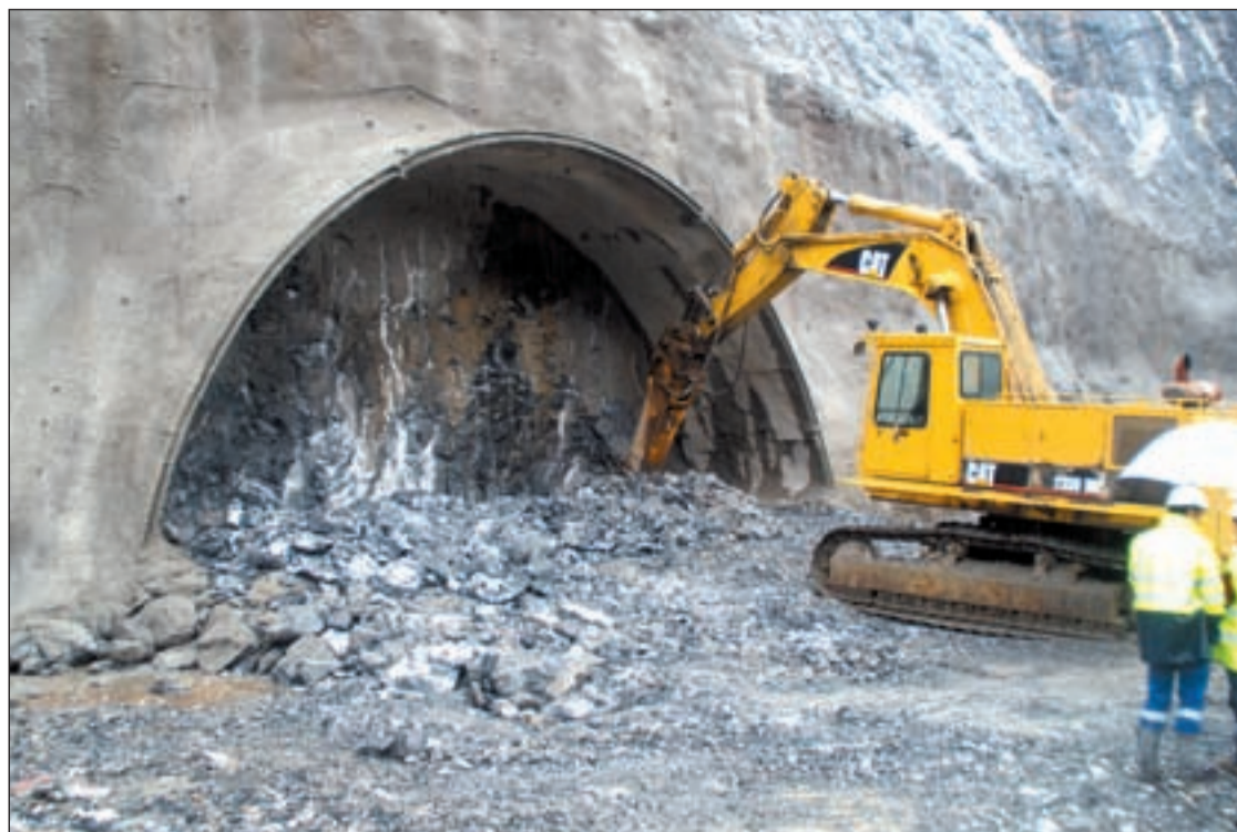
Una grúa excava uno de los túneles para el TAV