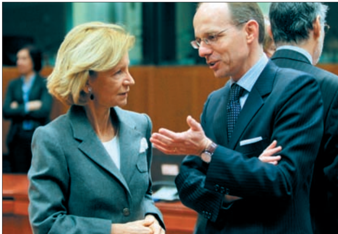
Elena Salgado conversa con Luc Frieden, ministro del Tesoro y Presupuestos de Luxemburgo

El retraso en su aprobación ha empezado a afectar algunos precostes de reestructuración en España, como la fusión de Caixa Manresa con las Cajas de