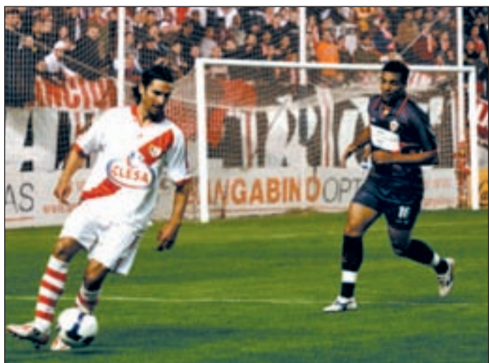
El equipo madrileño no pudo jugar el domingo pasado