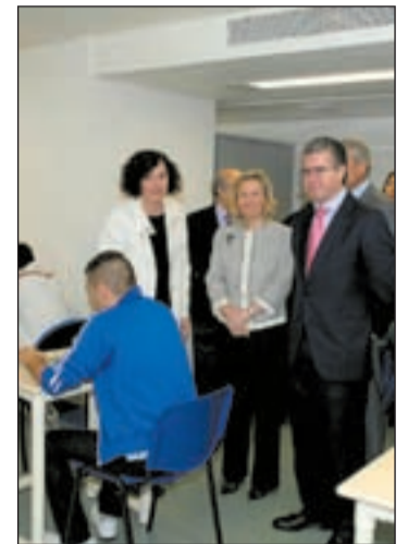
Granados en la inauguración

Francisco Granados, consejero de Presidencia, Justicia e Interior se encargó de inaugurarlo. Ha destacado que el Gobierno de Madrid pretende que los menores tengan la intervención lo más ajustada y más adecuada para sus necesidades individuales y al delito cometido que garantiza el mejor proceso de reeducación y re inserción de esos menores infractores.