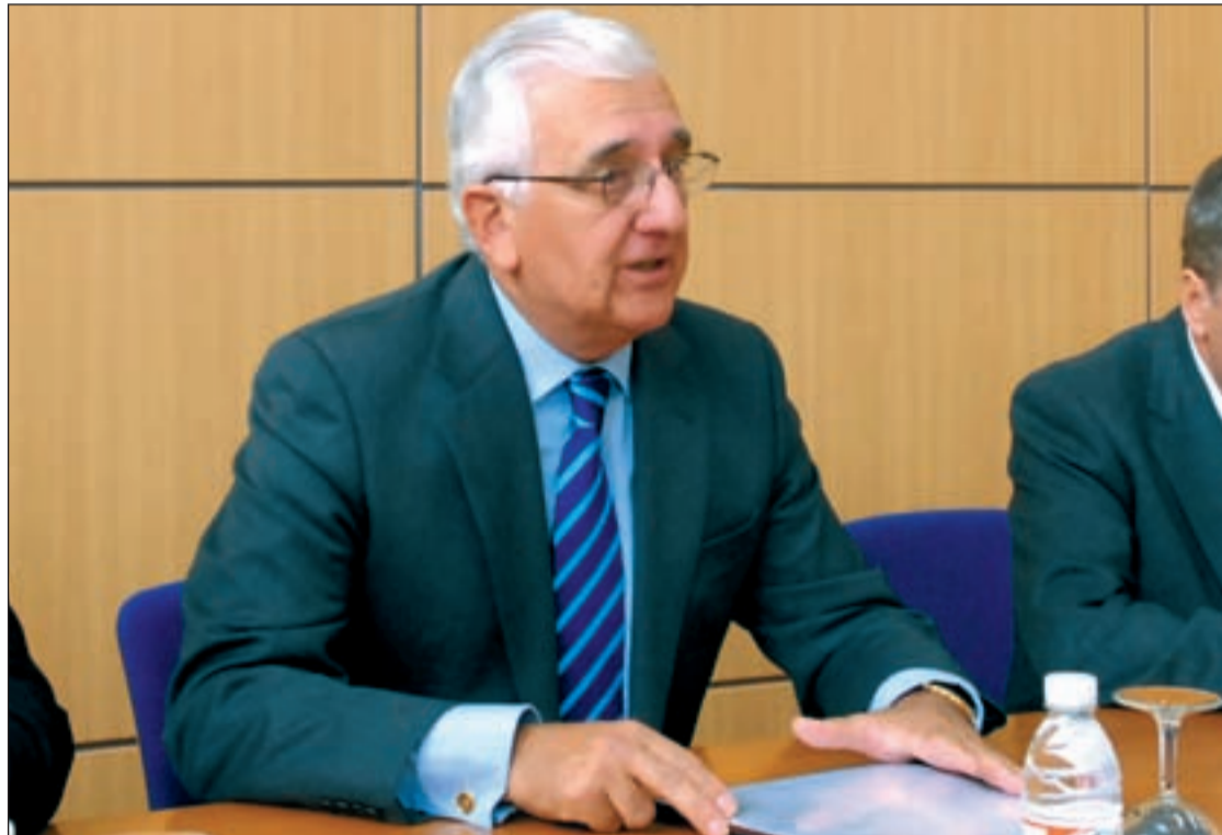
Santiago Herrero, presidente de la patronal andaluza y vicepresidente de la CEOE, tiene muchos apoyos

Los dos protagonistas empresariales podían ser los mejor colocados a la hora del relevo, tras los problemas de Díaz Ferrán, presidente de CEOE aún, quien, con la quiebra de Air Comet , se ha visto forzado a apoyarse en ellos; incluso hablan de otra reunión con los número dos de los sindicatos y el presidente.