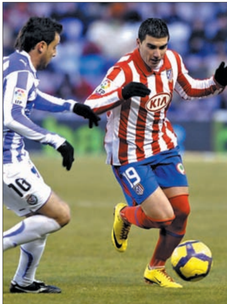
La victoria en Valladolid reforzó la moral rojiblanca

Así, entre críticas, reivindicaciones y fichajes, llega el Atlético al partido de este domingo ante el Sporting. Los gijoneses han mejorado en su faceta defensiva respecto a la temporada anterior, lo que se ha traducido en un ascenso en la tabla. Los