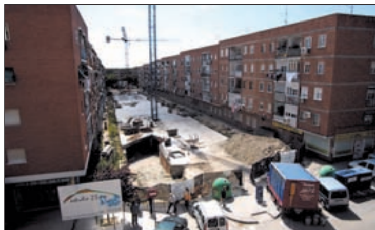
Aparcamiento paralizado en Juan de la Cierva