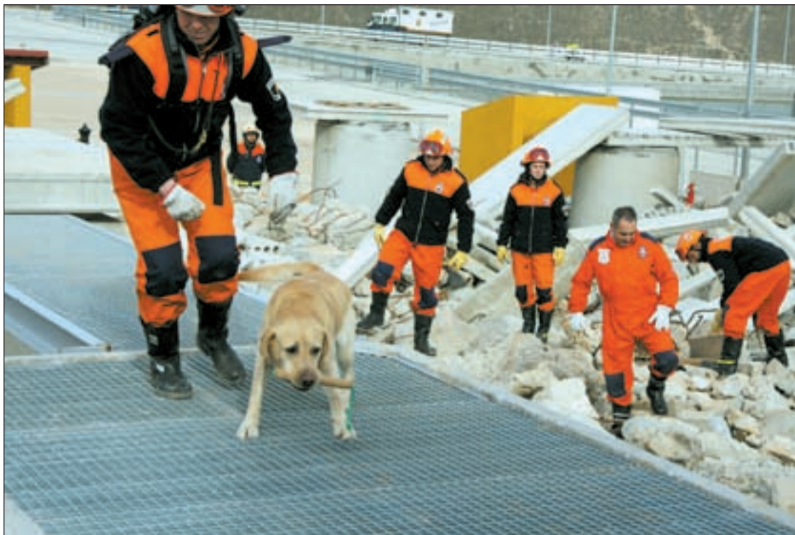
Simulacro de actuación de la Unidad Canina para Protección Civil de Getafe