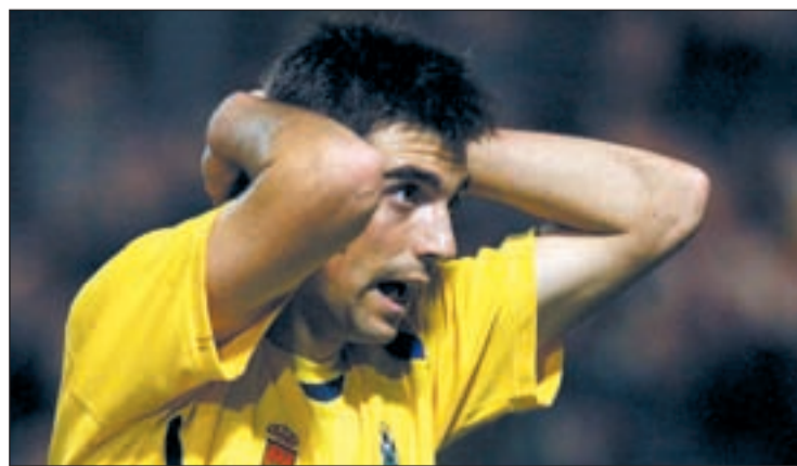
El Alcorcón ha sido la revelación del torneo

Ahora llega el momento de centrarse en el campeonato de Liga donde los alcorconeros son segundos, con un punto menos que el líder. Este domingo visitan al Villanovense.