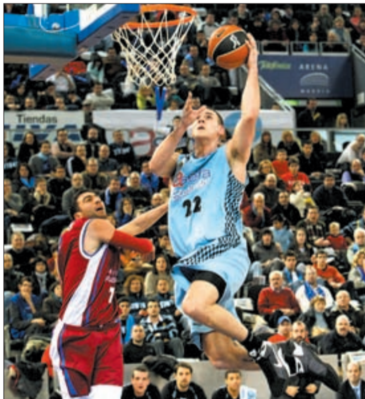
Los colegiales vencieron ampliamente la semana pasada

Los pupilos de Luis Casimiro se aferran a sus buenos resultados como local para seguir instalados en las primeras posiciones. Granada, Bilbao, Real Madrid y Xacobeo pueden dar fe de la transformación que sufre el juego del Estudiantes cuando actúa ante su público. Enfrente estará el Power Electronics Va-