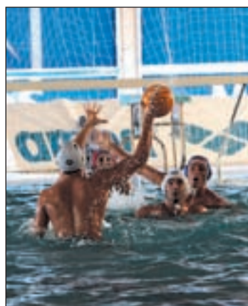
El Alcorcón estará en la Copa

Este fin de semana el conjunto alcorconero recibe al Club Natación Sabadell, que es cuarto en la clasificación. Por su parte, el Real Canoe juega en la piscina del colista de la competición, el CN Martiánez.