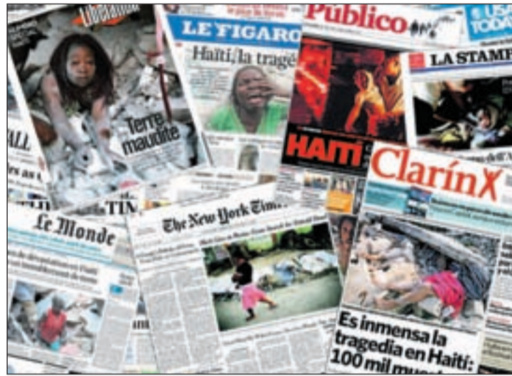
Las portadas de los periódicos de todo el mundo recogieron el suceso

Los medios franceses tampoco se quedaban impasibles ante la tragedia y recogían en sus portadas imágenes desoladoras. Le Monde , bajo el titular, "Escenas devastadoras en Haití después de un temblor de la tierra", recogía la foto de una mujer saliendo de entre los escombros.