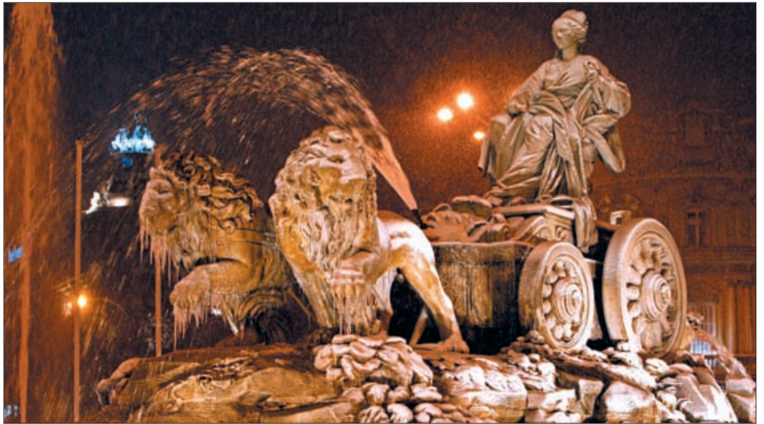
La Cibeles, cubierta de hielo y nieve, la madrugada del domingo, fue la imagen más fotografiada durante esas jornadas