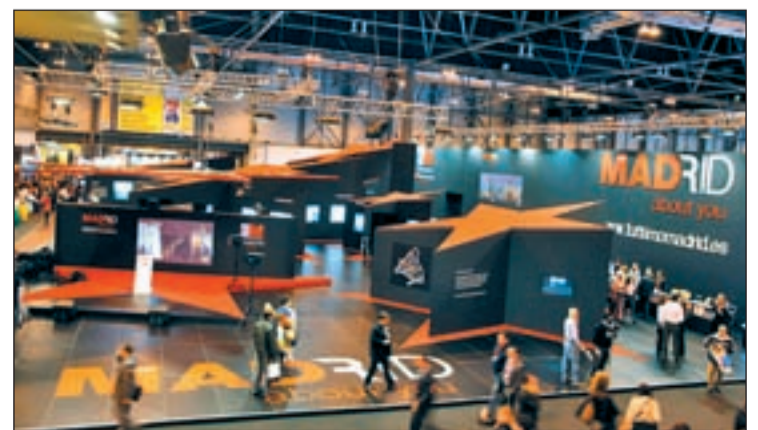
Stand de la Comunidad de Madrid en la edición de Fitur en 2009

que ya había sido prevista. Según indicó, esta reducción en la superficie no es sino uno de los efectos visibles de la crisis que atraviesan la economía y el sector, aunque también responde a una reducción de los gastos de montaje de algunas de las empresas que acuden a la feria.