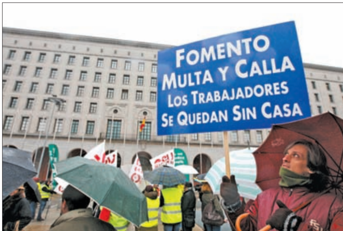
Las denuncias y protestas de afectados y trabajadores de Air Comet se multiplican

La FEFN cree que los hijos deben ser un factor determinante a la hora de establecer la protección económica pública, no sólo en los casos de viudedad, sino para cualquier ciudadano una vez alcanzada la edad de jubilación.