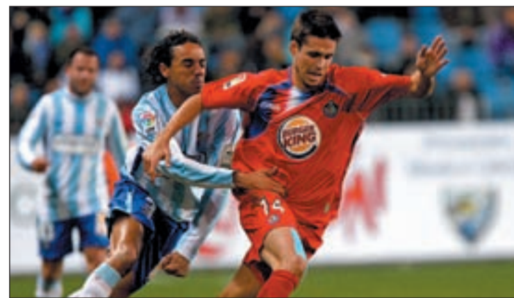
Los jugadores de Míchel buscarán un nuevo triunfo

descenso pero que lleva nada menos que ocho jornadas sin conocer la derrota. El conjunto de Muñiz se ha abonado al empate ya que en ocho de sus encuentros de esta temporada terminó sumando un punto. Miku podría debutar contra el que será su equipo el próximo año.