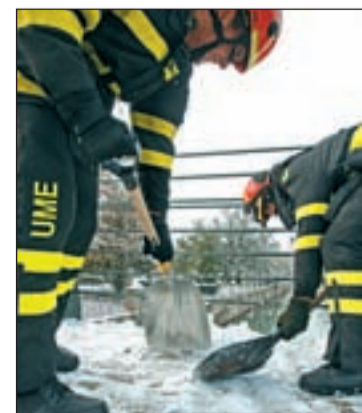
El Ejército actuó con gran eficacia