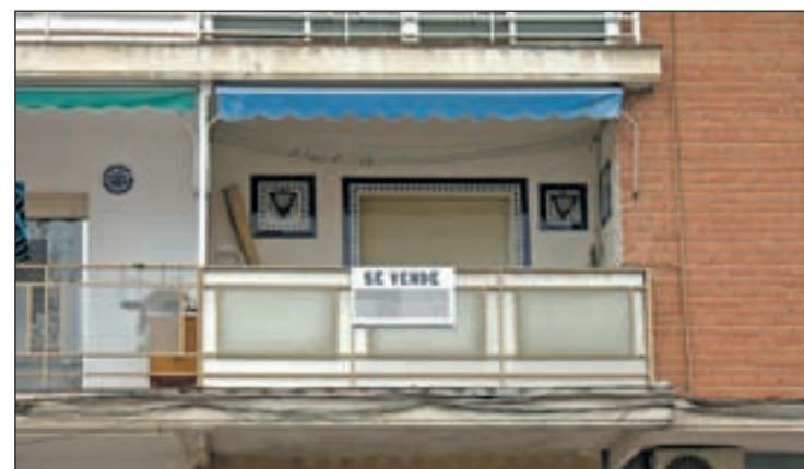
La vivienda se ha abaratado una media del 14,8 por ciento en dos años

de precios siguen siendo más acusados en la costa con una bajada en dicho período del 7,6 por ciento. En las capitales y grandes ciudades el abaratamiento ha sido similar mientras en las áreas metropolitanas la caída ha sido ligeramente superior, hasta el 7,3 por ciento.