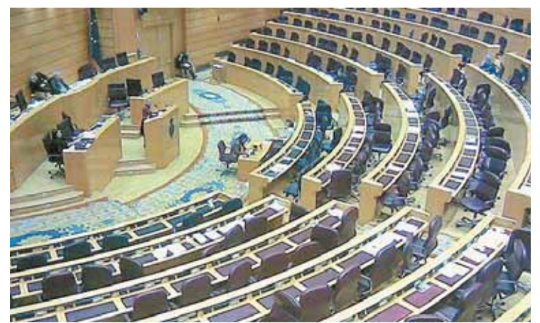
Sesión en la sala de plenos de la Cámara Alta

puesta, que han pedido el voto individual, aseguran que son muchos más los compañeros de escañ que la apoyan. De hecho, explicaron que en su redacción han participado representantes del Senado pertenecientes a todos los grupos, incluidos PSOE y PP.