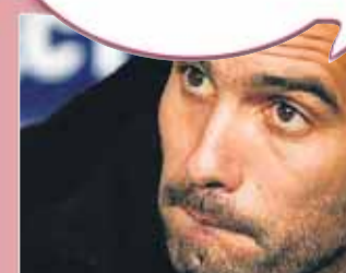
Josep Guardiola, Entrenador del Barcelona

"Tinc la sensació d'haver fallat a l'equip"