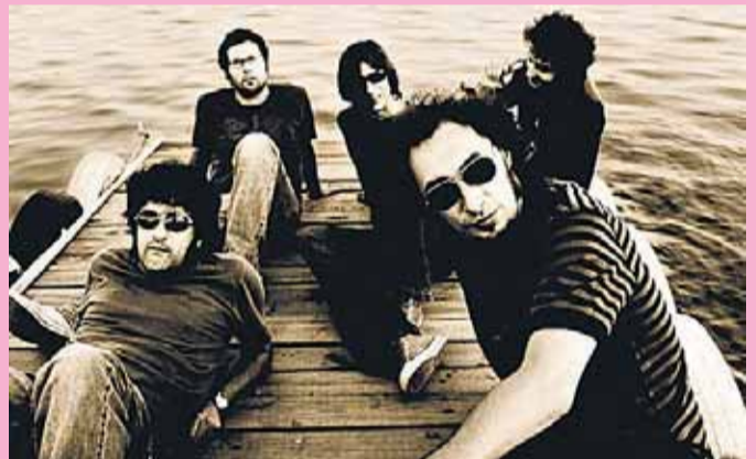
Obrirà el festival el cantaor Parrita i el tancarà Pitingo.