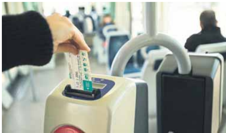
Los desempleados exigen que pique el billete les salga gratis. PABLO LEONI

Es por este motivo que han empezado una campaña de recogida de firmas, todos los lunes en diferentes oficinas del INEM, para conseguir el transporte público gratuito para aquellos trabajadores