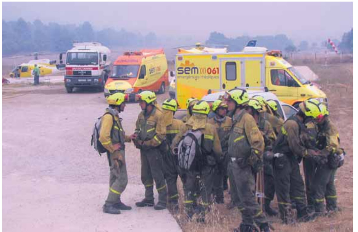
L'incendi d'Horta de Sant Joan, on van morir cinc Bombers, va calcinar centenars d'hectàrees d'espais protegits.

L'eurodiputat d'ERC, Oriol Junqueras, ha presentat una queixa formal al Parlament Europeu per l'exposició d'una Constitució espanyola amb l'àguila, el jou i les fletxes franquistes i el lema 'Una, grande y libre'. El llibre s'exposa de forma permanent en una vitrina de la seva seu a Brussel·les.