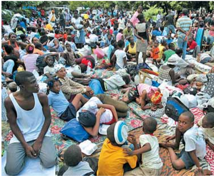
Cientos de personas reunidas en uno de los parques de la ciudad

Después de dormir al raso en parques y descampados, ante el temor a posibles réplicas del terremoto, los ciudadanos esperan con deses-