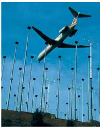
Un avión en su despegue

Según el propio ministro de Fomento, José Blanco, en España hay 713 controladores aéreos que cobran entre 340.000 y 540.000 euros anualmente y algunos de ellos han podido ganar más de 900.000 euros por acumulación de horas extra. Así, Blanco ha anunciado que, para reducir los costes de la navegación aérea, se suprimirán las funciones de estos controladores en al menos una docena de aeropuertos con menos de 50 operaciones diarias pero con "unas mag-