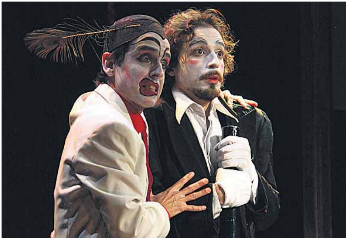
L'obra 'The Black Rider' s'inspira en un conte alemany.