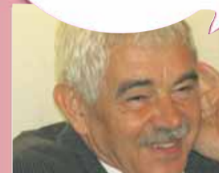
Pasqual Maragall, President de la Generalitat

"És una bestiesa dir això que el govern enganya el Parlament"