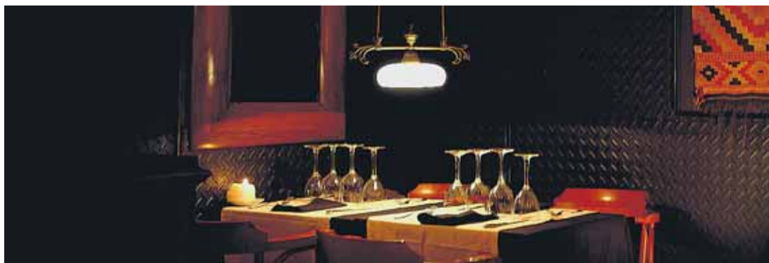
Un espacio romántico y sutil donde todo lo auténtico tiene su lugar.

En definitiva, un restaurante de luz tenue y de colores cálidos, perfecto para pasar una velada tranquila y romántica. Un lugar en el que cada cena se convierte en un ritual en el que participan los cinco sentidos.