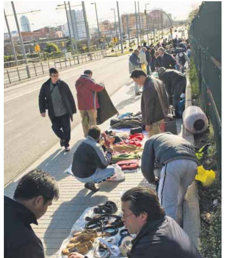
Venedors ambulants a l'avinguda Meridiana.

Aquesta veïna recorda que el barri porta patint la problemàtica des de l'any 1992, però "després de moltes reunions amb l'Ajuntament, no hem aconseguit gairebé res", protesta. "És cert que des que hem penjat les pancartes la situació està més controlada perquè ha augmentat la vigilància policial, però nosaltres el que volem és que desaparegui per complet la venda il·legal",