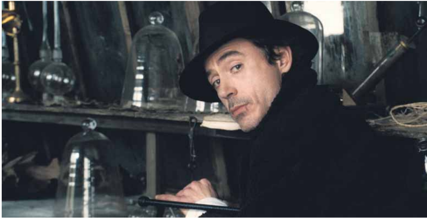
Los actores Robert Downey Jr. y Jude Law encarnan a Sherlock Holmes y Watson respectivamente.