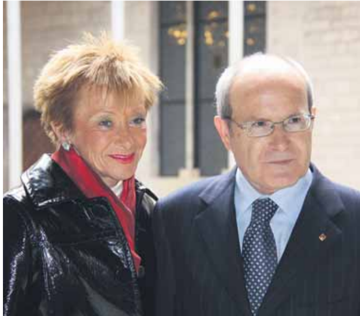
De la Vega, al palau de la Generalitat acompanyada de Montilla.

De la Vega ho va dir des de Barcelona en la presentació dels actes que es faran a Catalunya al voltant de la presidència espanyola de la Unió Europea (UE). La vicepresidenta espanyola va fer referència a la iniciativa de l'Ajuntament de Vic