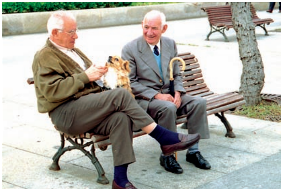
Los prejubilados reclaman el cobro íntegro de sus pensiones a los negociadores del Pacto de Toledo

Aunque en 2009, sólo Caja Castilla la Mancha, intervenida por el Banco de España, admitió pérdidas, otras lo han evitado, cargándolas contra sus patrimonios; en el presente ejercicio, va a ser difícil seguir esas prácticas, señalan las propias cajas, quienes aseguran que será en el año 2010 cuando tengan que aflorar todos sus números rojos. Lo que va a significar que la banca dispondrá de ventaja y que empezará a ganar cuota de mercado en la adquisición de redes y activos de las mismas.