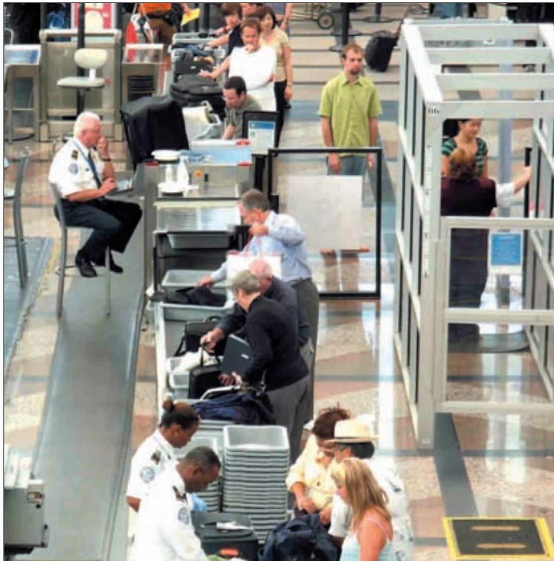
Los pasajeros se someten a los registros y controles en aeropuerto estadounidense

El miedo al terrorismo, especialmente el fundamentalista islámico, está detrás de la obsesión por la seguridad. Los atentados del 11-S en 2001 y el intento de explotar un avión en un vuelo procedente de Londres en agosto de 2006 han sido los detonantes del aumento de las medidas de seguridad en los aeródromos. Ejemplo de ello la normativa europea que limitaba el transporte de líquidos en las aeronaves. Y parece que este efecto dominó tras nuevas amenazas quiere repetirse ahora, tras desactivar el intento de atentado del nigeriano Umar Farouk Abdulmutallab en el vuelo de Detroit el día de Na-