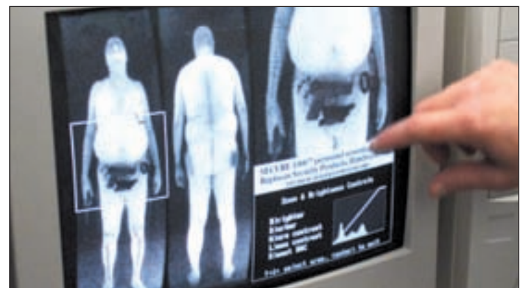
Imagen de una pantalla de los nuevos escáneres corporales de EE UU

preocupa y mucho. Del mismo modo azafatas y pilotos han transmitido su inquietud respecto a la acumulación de radiaciones que podría perjudicar a la Salud de quienes vuelan a diario. Ahora los responsables estatales tendrán la última palabra y los viajeros tendremos que pasar por el 'nuevo arco'.