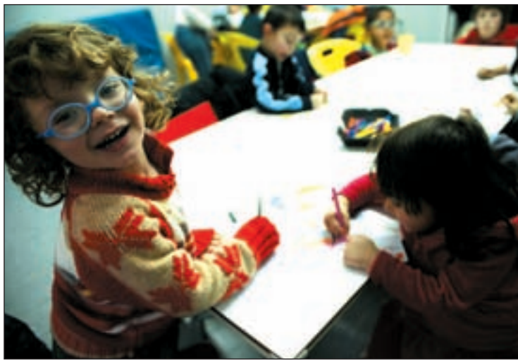
El quince por ciento de problemas oculares está en los niños