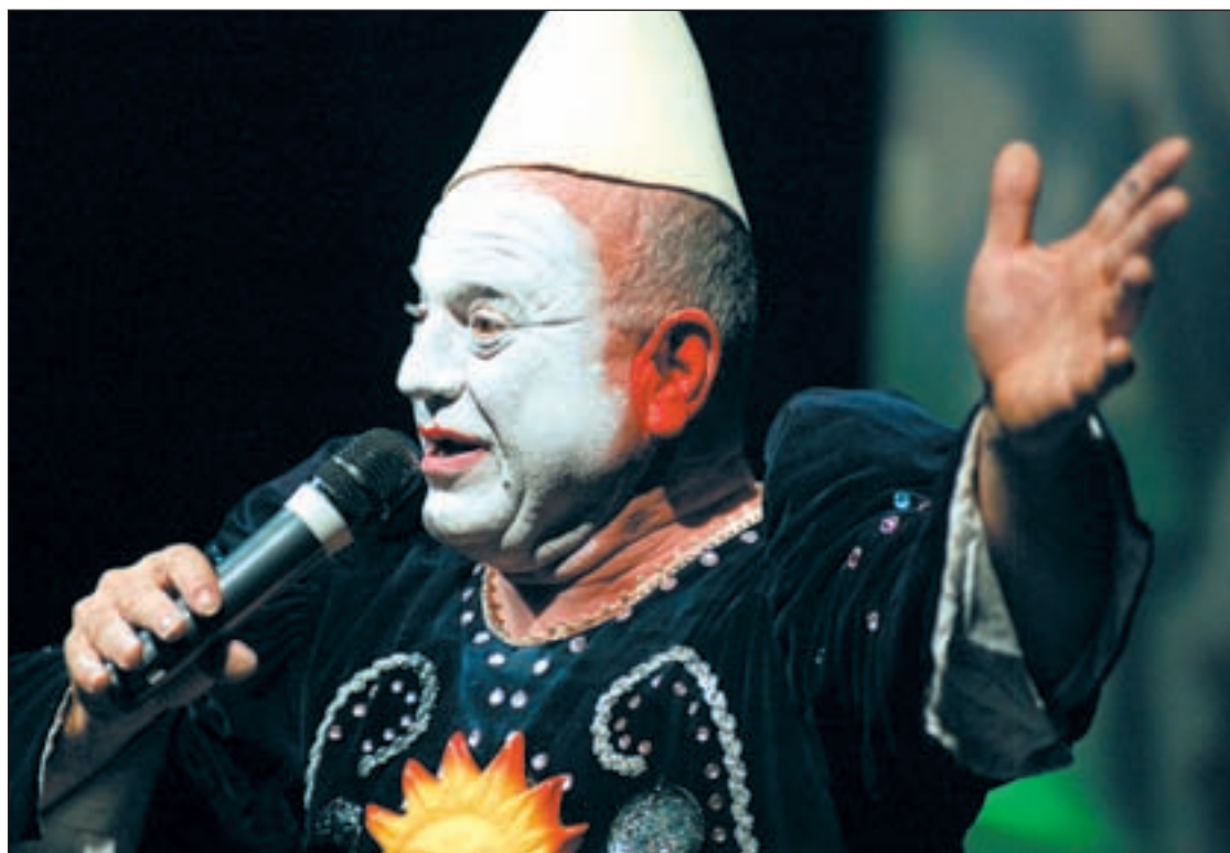
La función es una llamada a la revolución del pato amarillo, a la 'patología'

Leo Bassi piensa que “hoy en día la gente necesita de nuevos