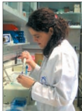
La leucemia linfática a examen

La utilización combinada de quimioterapia y anticuerpos monoclonales, conocida como inmunoterapia, podría significar un cambio en la práctica clínica contra la leucemia linfática crónica (LLC) y su tratamiento, tras demostrarse que mejoraría la supervivencia global de estos enfermos. Es ésta la principal lección de la VII edición del encuentro Conclusiones del LI Congreso Anual de la Sociedad Americana de Hematología que han celebrado en Madrid esta misma semana.