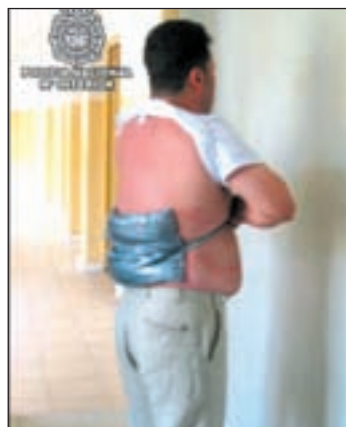
Sistema para ocultar la droga

voltorios con droga que transportaba en su estómago. En la operación han sido detenidas 14 personas. Para el traslado de la droga utilizaban maletas con doble fondo, la ingerían o era adosada al cuerpo, simulando embarazos o, incluso, aprovechando ese estado.