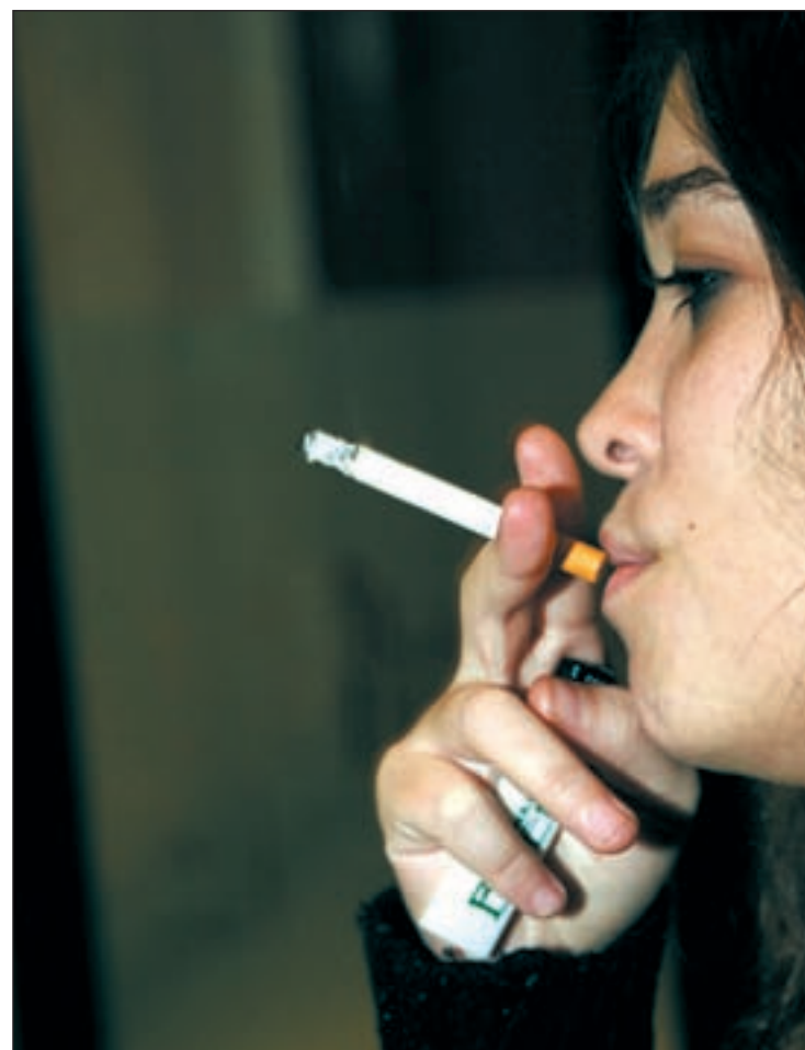
El hábito de fumar se generaliza más en la mujer que en el hombre

En este sentido, la encuesta europea sobre Salud Pública realizada en diciembre pasado, revela que de las 2.304.514 personas españolas que tienen alguna de esas enfermedades respiratorias crónicas, 1.247.574 son hombres, y 1.056.940, mujeres, cifras que sirven de base a esa tesis de los neumólogos españoles. Además, en la misma encuesta aseguran que casi diez millones de mayores de dieciséis años (9.953.857), una cuarta parte de la población española, fuma a diario, y que millón y medio lo hace de manera ocasional (1.538.530) a pesar de las reiteradas advertencias de la SEPAR sobre la estrecha