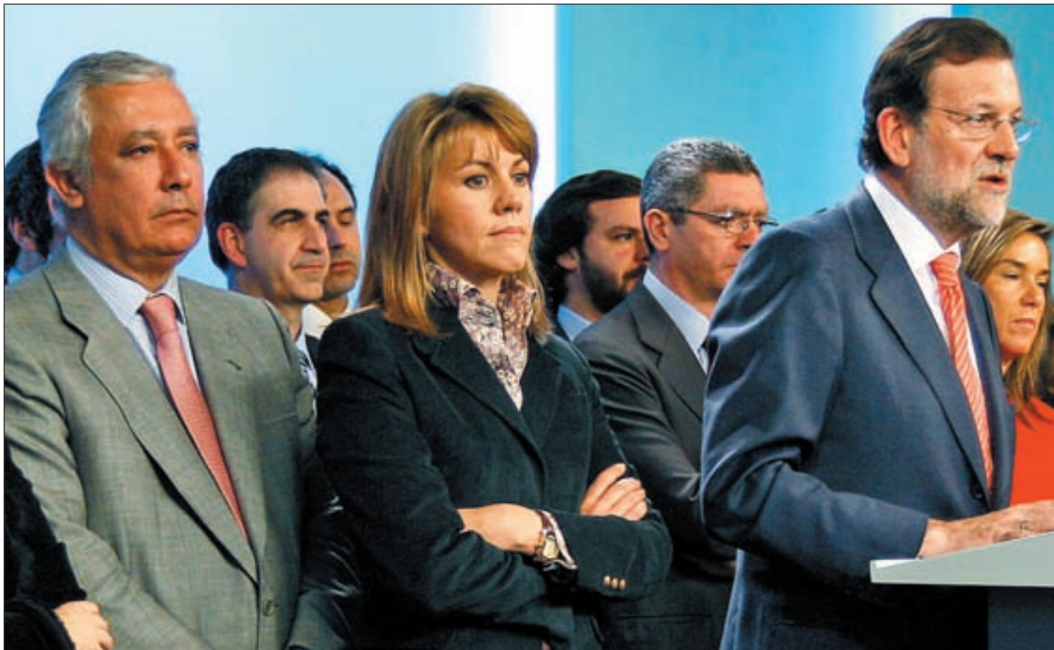
Mariano Rajoy trata de limar las diferencias entre Javier Arenas y María Dolores de Cospedal