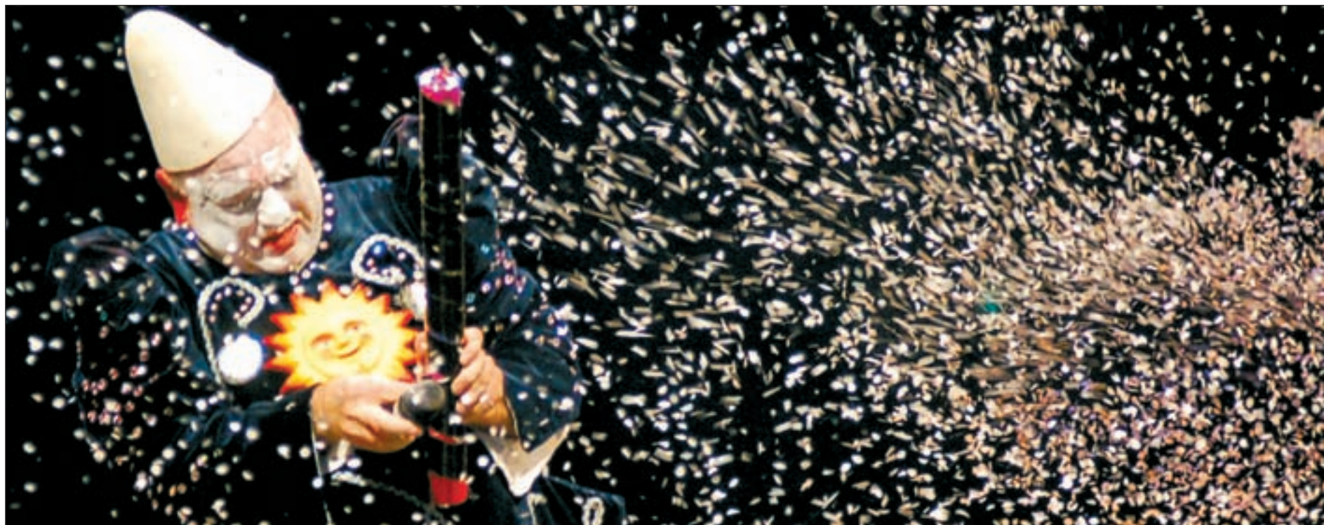
Leo Bassi y su pequeño homenaje al tradicional payaso blanco del circo durante su espectáculo