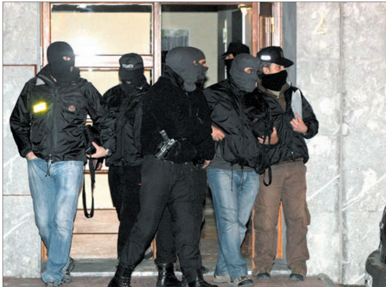
Varios ertzainas salen del domicilio de uno de los terroristas detenidos en la localidad de Gizaburoaga tras efectuar el registro

Cinco detenidos de los grupos legales de ETA en operaciones policiales en Bizkaia y Guipuzkoa • Ares asegura que los miembros de la banda están relacionados además con los ataques al TAV Pág. 4