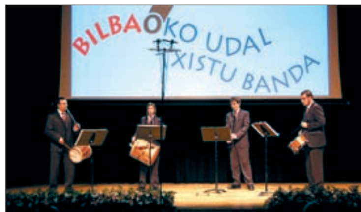
La Banda de Txistularis bilbaina en un concierto en el Euskalduna