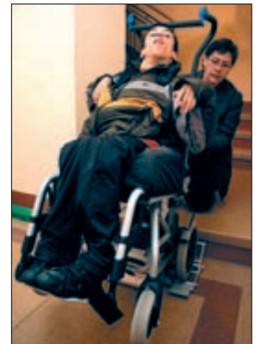
Un menor dependiente

Un paso más para que las ayudas que la Ley de Dependencia reconoce como derechos lleguen a quienes las necesitan. El Gobierno y las Comunidades Autónomas se han comprometido a dictaminar dichas prestaciones de dependencia en un plazo máximo de seis meses, que será de treinta días en el caso de niños menores de 3 años, entre la fecha de entrada de la solicitud y el reconocimiento de este derecho. Así lo anunció este lunes por la mañana la ministra de Sanidad y Política Social, Trinidad Jiménez, tras la reunión del Consejo Territorial de Dependencia, en el que se alcanzó este acuerdo entre su departamento y todas las comunidades autónomas. Una medida que paliará los retrasos que sufren estas familias y que se constata en que tres de cada cinco dependientes recibieron