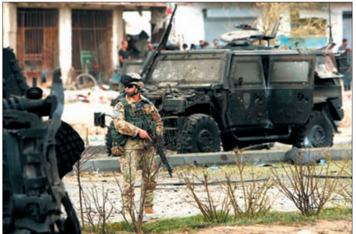
Un soldado de los aliados patrullando en capital del país

ban cuando el presidente estadounidense está enfrentándose ahora a la mayor crisis de gobernabilidad tras perder la mayoría de sesenta escaños que tenían los Demócratas, después de que hayan elegido a Scott Brown del Partido Republicano para nuevo senador por Massachusetts.