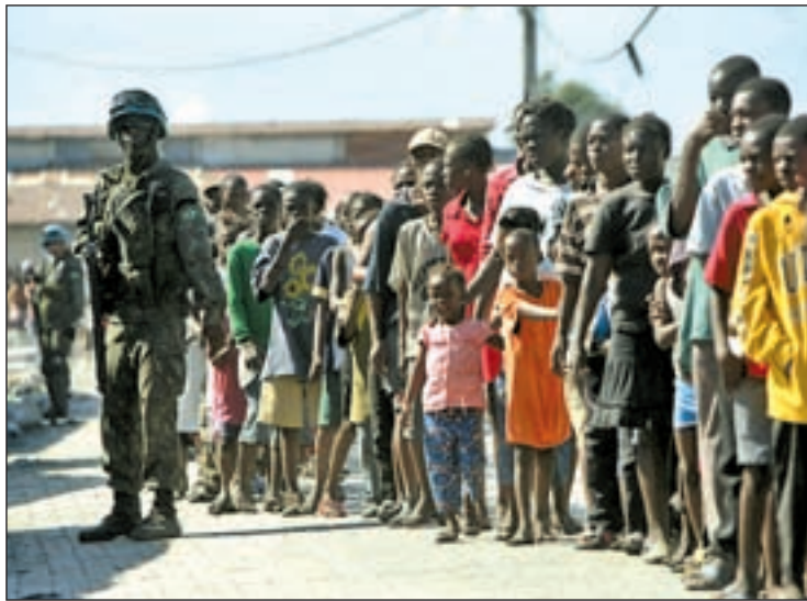
Cientos de haitianos esperan que repartan la ayuda internacional

te punto, y la reconstrucción del país, estimada en diez años al menos, integraban la agenda de la Cumbre Internacional celebrada en Montreal. La gestión de la ayuda por Estados Unidos fue criticada por cada representante, debido a su carácter militar, pero EE UU puso su misión bajo control de la ONU. En Haití sigue la lucha por sobrevivir. Los riesgos, incremento de muertes de mujeres embarazadas y el tráfico de los huérfanos por mafias aumentan. Los haitianos quieren solidaridad, pero más organizada.