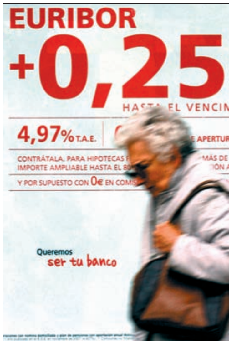
Por fin, buena noticia para comprar casa, pues concederán más hipotecas

es que para conceder el crédito, dicen los portavoces bancarios, seguirán mirando con lupa la solvencia del cliente que, por norma, debe disponer de buen patrimonio, trabajar con nómina y una antigüedad en su empresa nunca inferior a tres o cuatro años. En cuanto a tipos de interés medio prestados, éstos están situados en el 4,09 por cien, con un descenso del 26,7 por ciento