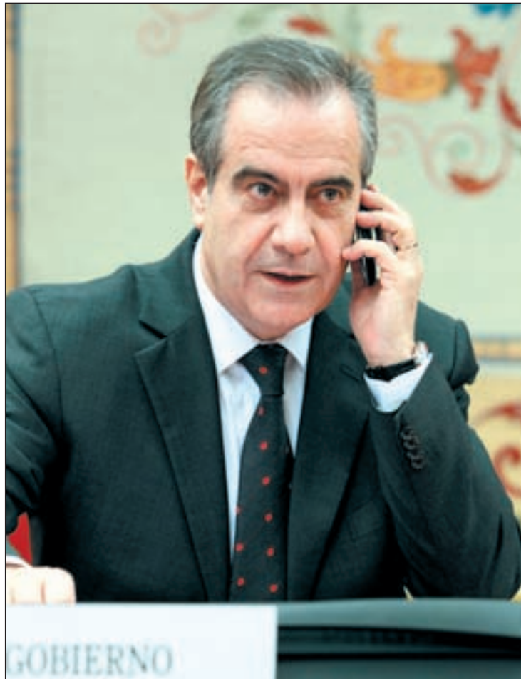
Celestino Corbacho, ministro de Trabajo

España sigue en el epicentro político de Europa. Después de acoger Toledo y Sevilla los primeros encuentros de ministros de la Unión que tendrán lugar en nuestro país, ahora son los responsables ministeriales españoles los que viajan a Bruselas para protagonizar la agenda de la Eurocámara. Hasta doce de ellos presentarán a sus colegas las principales líneas de acción que marcarán el discurso de España durante el semestre de su Presidencia de la UE. A estas presentaciones oficiales sólo faltarán Manuel Chaves, vicepresidente tercero y ministro de Política Territorial, la ministra de Defensa, Carme Chacón, y la ministra de Vivienda, Beatriz Corredor. No estará tampoco el ministro de Exteriores, Miguel Ángel Moratinos, cuya presentación ante las comisiones parlamentarias de Desarrollo y de Exteriores está prevista para el 4 de febrero.