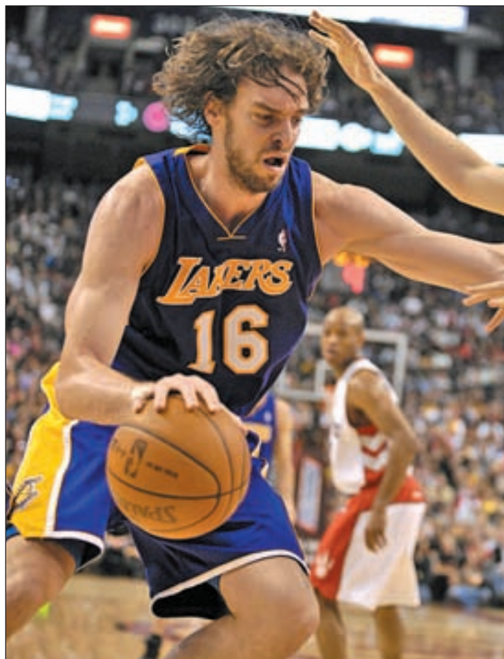
Pau Gasol, uno de los jugadores más destacados de la NBA

En el plano estrictamente deportivo, Pau Gasol ha superado los problemas físicos que le mantuvieron alejado de las pistas durante varias semanas. Con él en la pista, el conjunto de Phil Jackson ha visto mejoradas