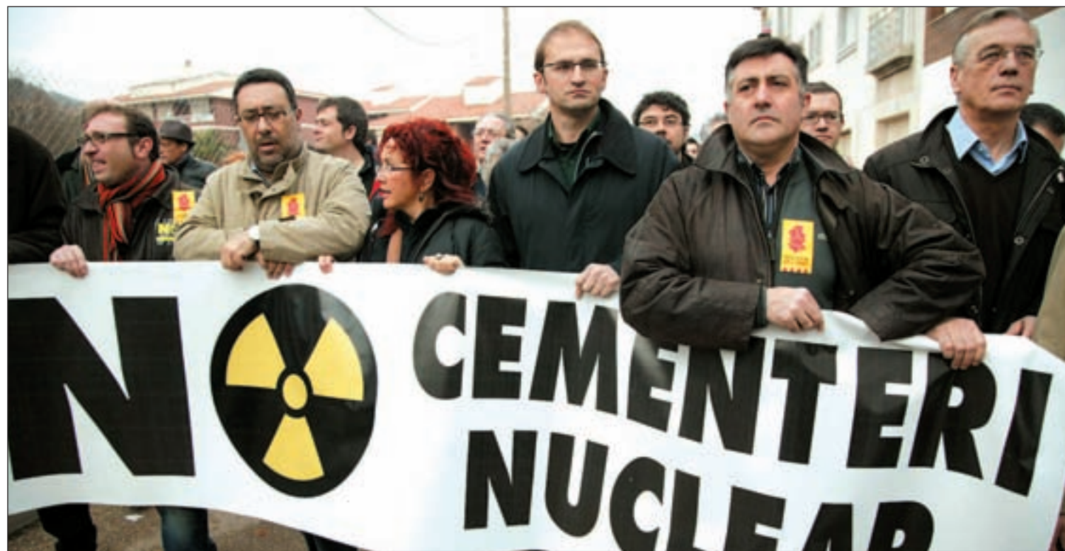
Asistentes a la manifestación contra la decisión del ayuntamiento de Ascó (Tarragona) de optar a acoger un almacén de residuos nucleares

LA POLÉMICA NUCLEAR REACCIONES CONTRA LA DECISIÓN MUNICIPAL DE ACOGER ESTOS RESIDUOS