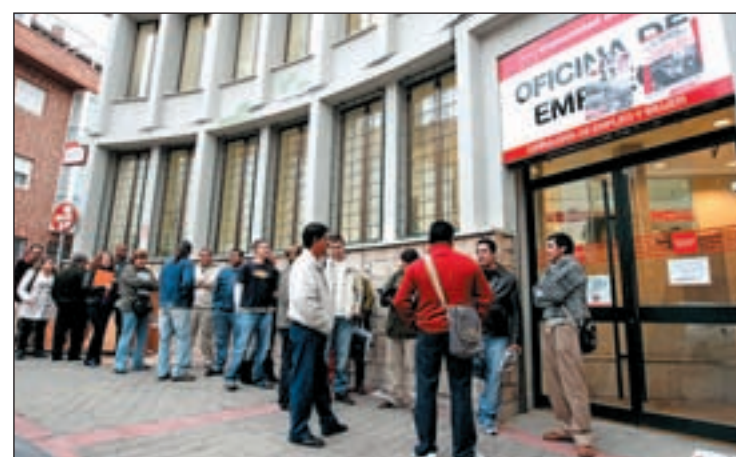
Varios informes contemplan una lenta salida de la crisis en Europa

El viernes conoceremos los datos de la EPA del cuarto trimestre del 2009, que apuntan a una cifra de desempleo del periodo de unos 150.000 desempleados más; con datos del tercer trimestre, las cifras de paro está situada en el 17,9 por cien, la más al-