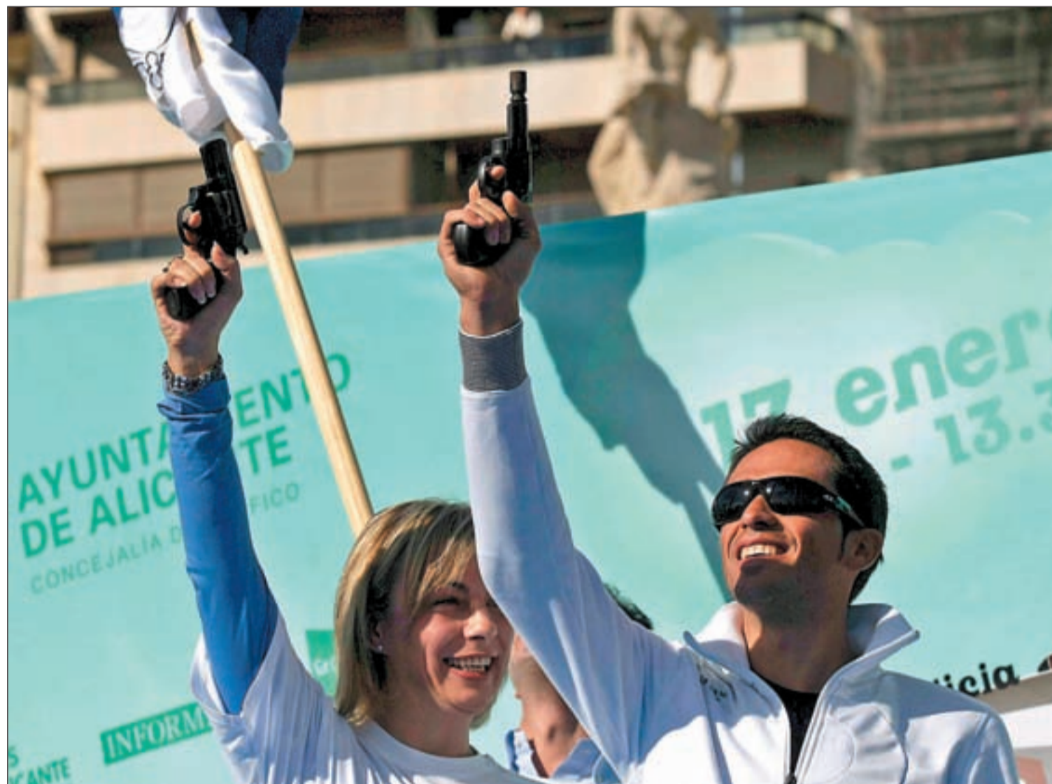
Sonia Castedo, alcaldesa de Alicante, y el ciclista Alberto Contador dan el 'pistoletazo' para la inauguración oficial de la ciclovia

El circuito de ocho kilómetros, único en Europa, estará cerrado al tráfico todos los domingos por la mañana • Habrá zonas habilitadas para triciclos infantiles, de reparación y alquiler de bicicletas Pág. 4