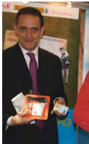
Vadillo junto a un DNIe.

En Valladolid se han expedidos, hasta el momento, 165.520 DNI electrónicos.