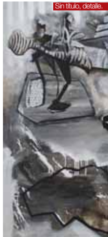
Sin título, detalle.