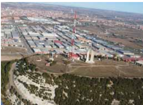
Repetidor de televisión situado en el Cerro de San Cristóbal.

Con el apagón previsto, según el subdelegado del Gobierno, 129 municipios se sumarán a otros 45 que ya acceden exclusivamente a la televisión digital ya que, recordó, "el 99 por ciento de los afectados conoce lo que sucederá a partir