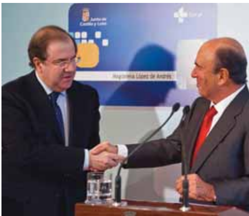
Juan Vicente Herrera y Emilio Botín durante la firma del convenio.

El presidente de la Junta recibió en la sede del Gobierno al Grupo de Rescate de la Consejería de Interior y Justicia, del que forman parte los siete bomberos profesionales que han participado durante siete días en misiones de rescate en Puerto Príncipe, que se vio seriamente afectada por el terremoto del pasado día 12 de enero. En la recepción, Juan Vicente Herrera mostró su satisfacción por el trabajo realizado por los bomberos de Castilla y León.