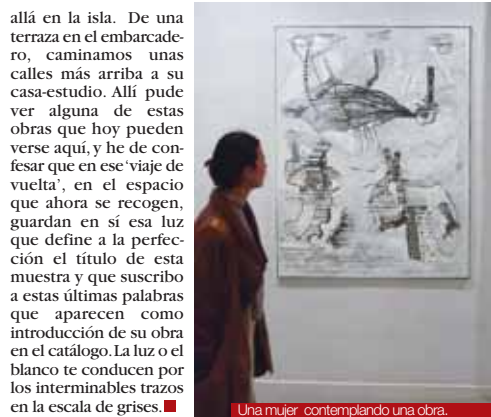
Una mujer contemplando una obra.

"Aunque yo no lo crea, hay un placer superior a contemplar la obra de Gregorio Antón en su estudio mallorquín. Es tener el privilegio de verla en esta sala, de nuevo en su tierra. Y con ustedes. Porque mientras la moneda de la vida sigue girando en el aire, el artista sabe que el billete de ida también nos sirve para la vuelta".