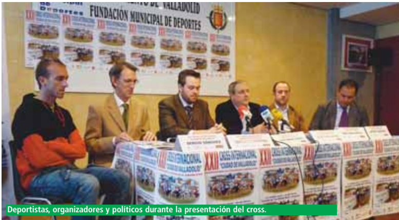
Deportistas, organizadores y políticos durante la presentación del cross.