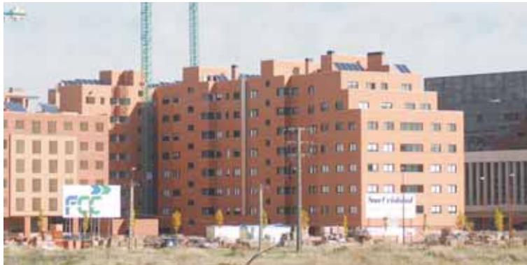
Comprar una casa en estos momentos cuesta lo mismo que en 2006.

Comprar en estos momentos una vivienda en Valladolid cuesta igual que en enero de 2006. El precio del metro cuadrado en la capital, según los datos oficiales que publica el Ministerio de Vivienda, en el cuarto trimestre del año pasado se situó en 1.532 euros, mientras que en el primer trimestre de 2006 estaba en 1.534, es decir, una cantidad prácticamente idéntica. Hay que tener en cuenta que la evolución del precio de la vivienda ha sido fuertemente alcista hasta mediados del año 2008, cuando la crisis inmobiliaria empezó a tirar para abajo de los precios. En 2009 la tendencia ha seguido y el precio de la vivienda cayó en la provincia en el último año un 4,1%, según certificó el Ministerio del ramo. Es cierto que en el último trimestre se produjo una revalorización importante con respecto a los meses anteriores, pero no ha sido suficiente para compensar la gran caída de cotizaciones de un producto de pri-