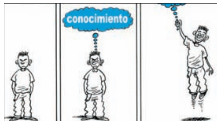
Viñeta de Gallego & Rey

aportar una llamada a la reflexión. El pasado 29 de noviembre finalizó una de sus últimas actividades, la XVI Muestra Internacional de Humor Gráfico, cuya exposición, 'La letra con humor entra', estuvo dedicada al segundo de los Objetivos del Milenio: logra la enseñanza básica universal” para el 2015.