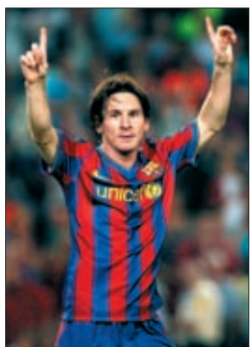
Messi en el último partido de Liga

El astro de Rosario ha confirmado los pronósticos, logrando el respaldo de 96 miembros del jurado, que le han valido cuatrocientos setenta y tres puntos de cuatrocientos ochenta posibles. Ningún futbolista había logrado nunca tanta ventaja respecto al segundo clasificado, ya que Messi obtuvo más del doble del respaldo que Cristiano Ronaldo (233 puntos) y quedó muy por delante de su compañero Xavi (170 puntos). Sólo Inglaterra, con Gerrard y Rooney, igualaron los representantes de España, Iniesta quedó en una destacada cuarta posición, en el 'top ten', con 149 puntos. A la tercera fue la vencida para el astro argentino, pues tras dos años en el podio se ha hecho ya con el Balón de Oro .