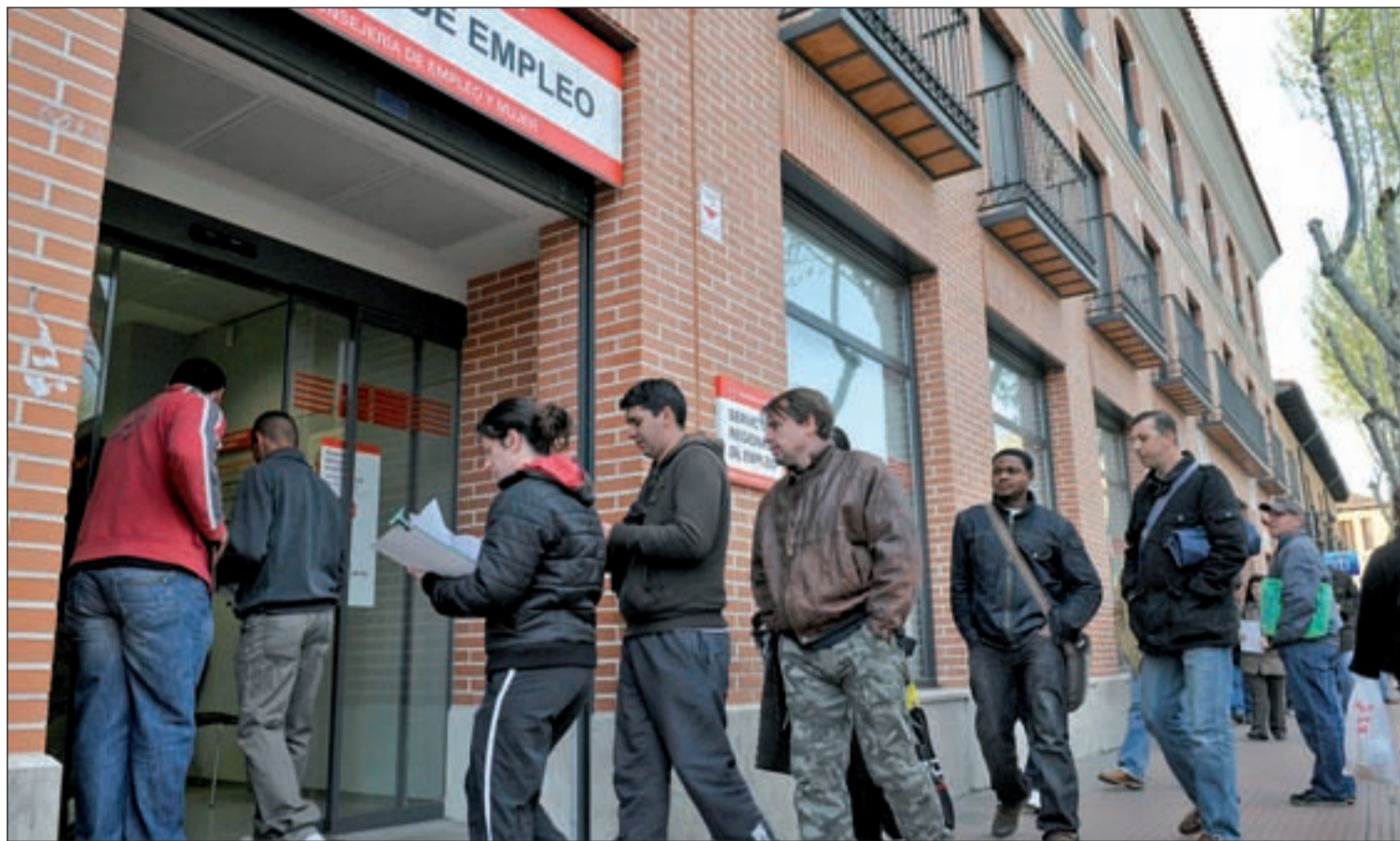
Las oficinas del INEM no dejan de recibir nuevos parados cada día. Reducir estas colas es el objetivo de la nueva ley

EL GOBIERNO PLANTEA UN NUEVO MARCO PARA IMPULSAR EL MERCADO DE TRABAJO