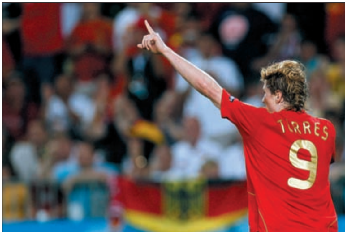
Fernando Torres celebra el gol marcado frente a Alemania en la pasada final de la Eurocopa

TREINTA Y DOS SELECCIONES REPARTIDAS EN OCHO ESFERAS