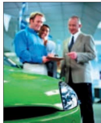
Sube la venta de vehículos

valores. Al acabar el año, los fabricantes calculan que habrán vendido alrededor de 940.000 unidades, el dieciocho por ciento menos que en el año 2008. A destacar también que en el mes de noviembre pasado, han repuntado los Rent a Car hasta el cincuenta por ciento.