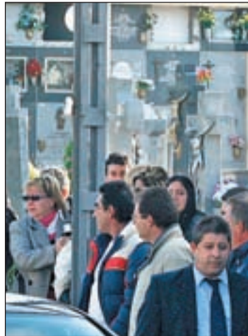
Funeral de la niña en Parla

El debate sigue abierto y la familia no se ha quedado con los brazos cruzados. La defensa del padrasto de la niña fallecida, de tres años, que murió en Tenerife al caerse de un columpio, va a emprender acciones legales contra el médico que denunció falsamente tras atender a la pequeña, afirmando que ésta presentaba síntomas de abusos sexuales y malos tratos. El abogado está elaborando la querrela que presentará para que investiguen el tratamiento mediático del caso y fundamentalmente la