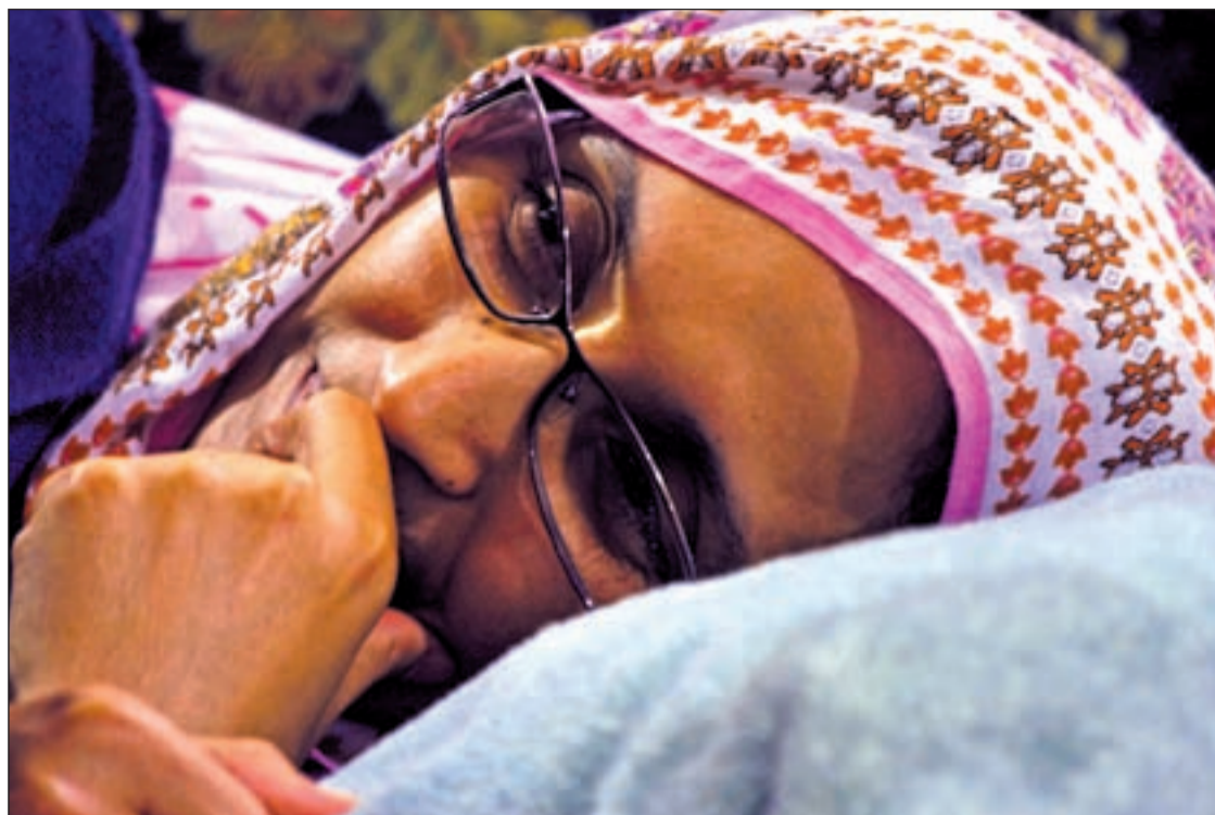
La activista saharui denuncia la complicidad entre España y Marruecos por su deportación ilegal

MULTADA CON CIENTO OCHENTA EUROS POR DESÓRDENES PÚBLICOS