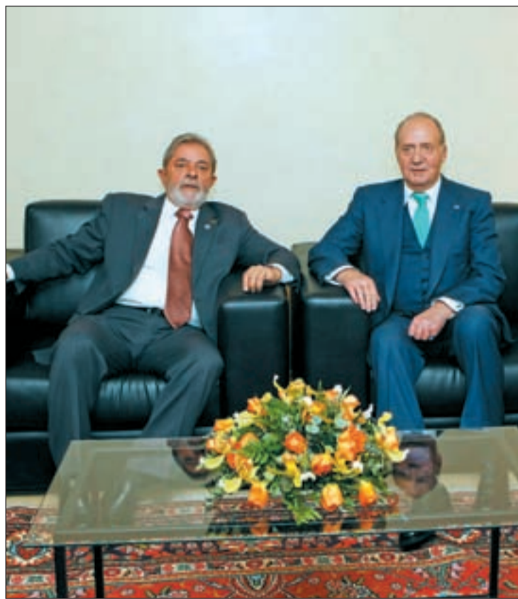
Los Jefes de Estado de Brasil y España en la Cumbre Iberoamericana

sobre su legitimización, iban a ser las protagonistas de la Cumbre. No ha habido mandatario que eludiera el tema. A favor, por ejemplo, el presidente de Costa Rica, Oscar Arias, que participó activamente en el acuerdo fallido tras el golpe en Honduras, ha asegurado que su Gobierno "aspira a reconocer las elecciones si son transparentes, si no hay acusaciones de fraude y si los observadores que han participado nos certifican que pueden aceptarse o deben aceptarse". Asimismo ha instado a sus homólogos a evitar "un Mitch político". En contraposición, el ministro de Exteriores cubano, Bruno Rodríguez, y la presidenta de Chile, Bachelet. Ambos han coincidido