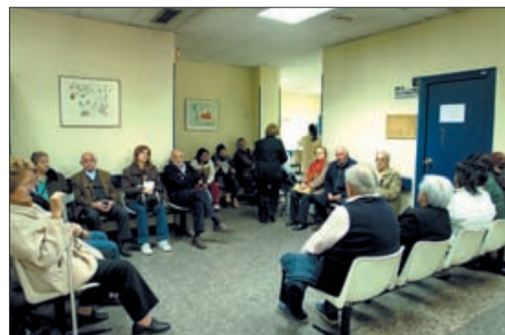
La Gripe A aumenta y las consultas están cada vez más abarrotadas

También el número de muertes por la enfermedad sigue aumentando con el paso de los días. La Organización Mundial de la Salud ha informado que en la última semana se han producido más de mil defunciones, lo que a nivel mundial indica un