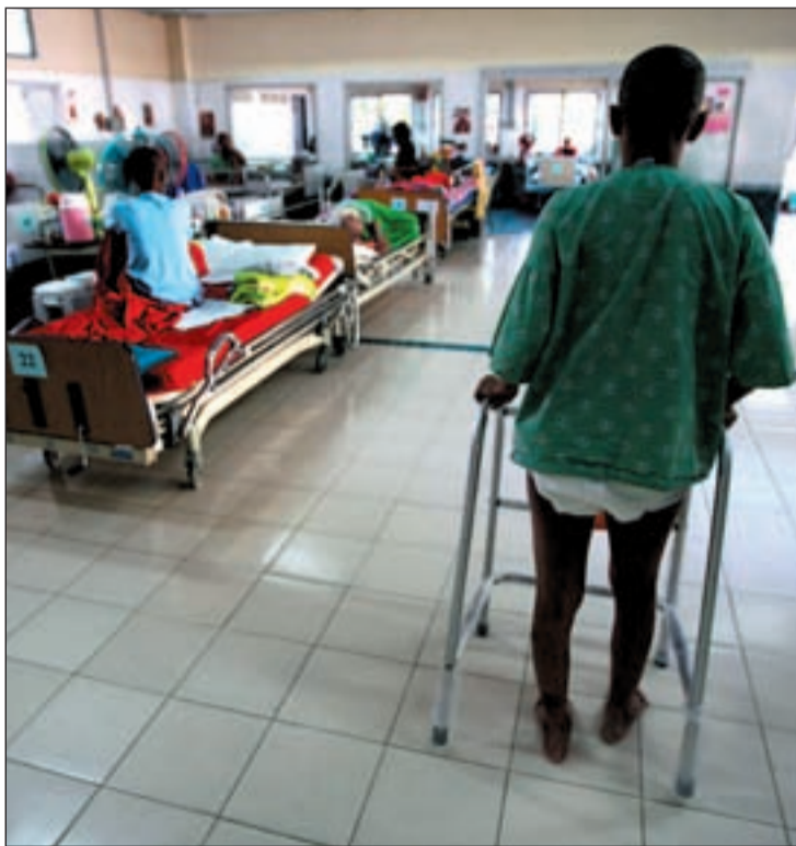
El Sida afecta, al menos, a cuatro millones de personas en el mundo

La OMS ha recomendado a todos los países que "vayan retirando de la circulación de forma progresiva el Stavudine como el primer medicamento usado en los tratamientos contra el sida". La OMS les ha sugerido que los sustituya por "alternativas menos tóxicas" como el Zidovudine o el Tenofovir, que