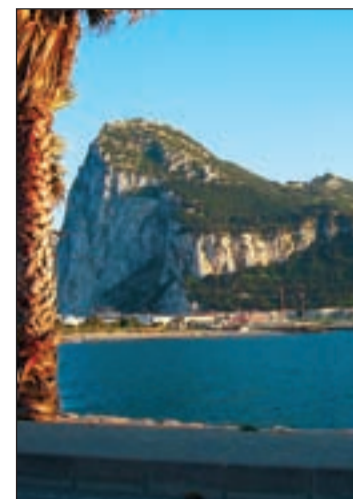
El Peñón de Gibraltar

Marejada en aguas de Gibraltar. El pasado miércoles, el PP llevó al Congreso el conflicto que estos días está causando tensiones y quebraderos de cabeza, y tanto a la Guardia Civil como a la diplomacia española por la titularidad de las aguas que rodean El Peñón , en Gibraltar.