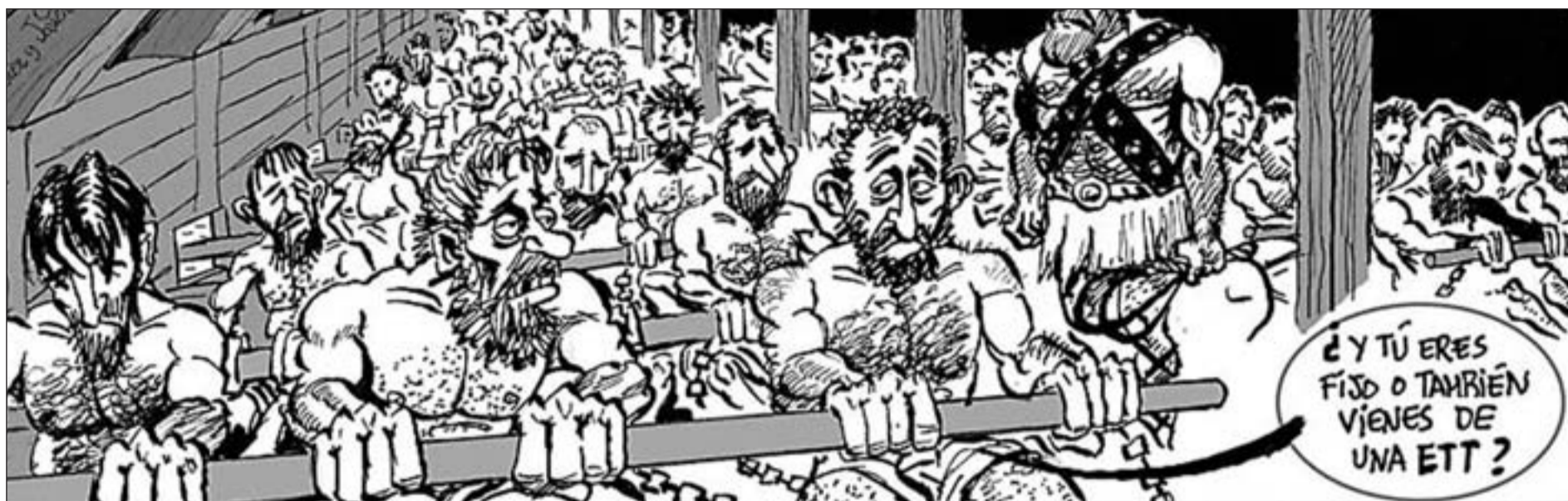
Caricatura cedida a GENTE por el dibujante Asier Sanz, colaborador de la revista satírica 'El Jueves'

REPORTAJE El Humorismo Gráfico en España