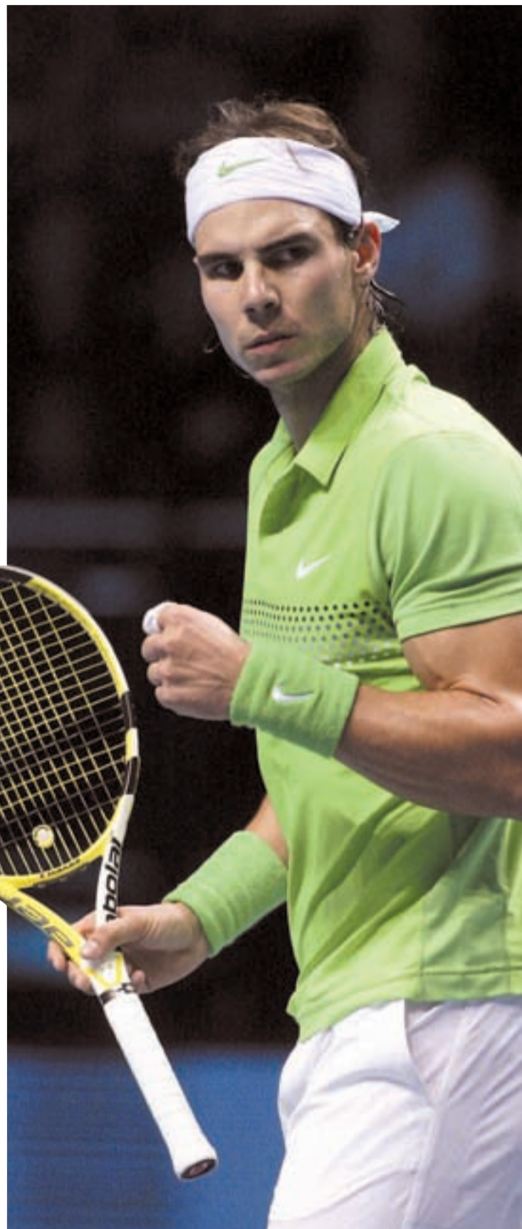
Rafael Nadal espera recuperar su mejor juego

Más allá de los checos, unos jugadores con calidad pero lejos de estar entre los mejores del mundo, Costa y el equipo español deben luchar contra la relajación y el favoritismo. Las apuestas y la mayoría de aficionados creen que la 'Armada' no tendrá problemas para sumar su cuarto entorchado, pero la historia reciente debería ser un motivo de peso para no caer en la complacencia. Sin ir más lejos, el año pasado España llegó a Mar del Plata en unas condiciones similares a las que lo hace ahora la República Checa y acabó ganando la eliminatoria. A todos nos vienen a la mente episodios deportivos en los que con todo a favor acabó sucumbiendo. En la mano de Nadal, Verdasco, Feliciano, Ferrer y Ferrero está que no se repitan.