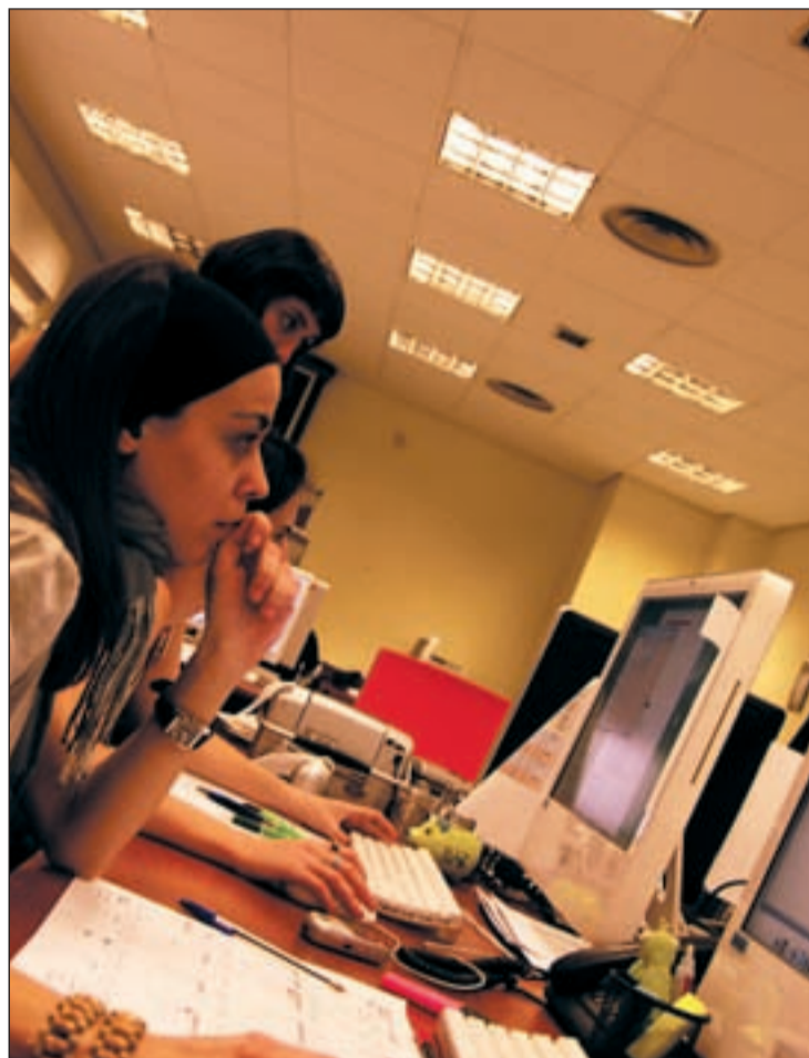
El paro entre jóvenes alcanza a casi el cuarenta por ciento

Mientras, en el Congreso se ha debatido esta semana una iniciativa de CiU para acotar una hoja de ruta con las reformas que deberá aplicar el Gobierno para combatir el paro de los jóvenes, entre las que destacan la "revisión de los contratos