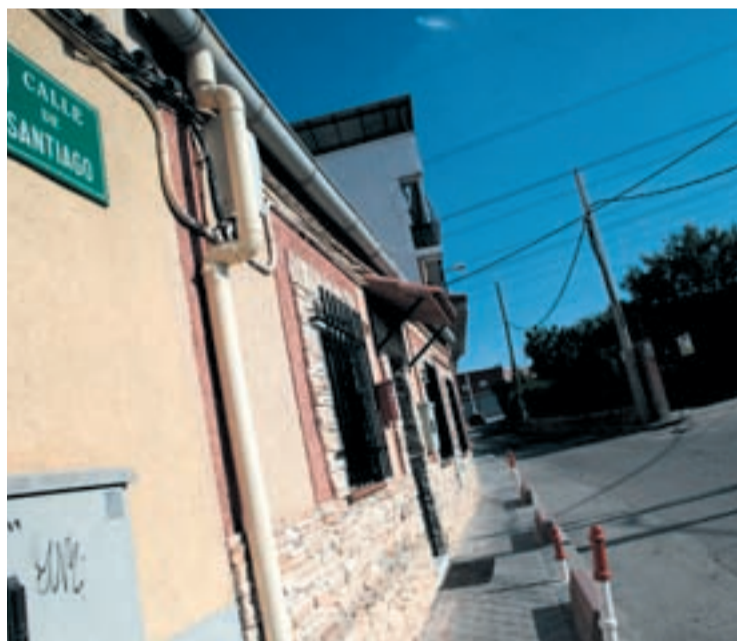
JULIO Y SEPTIEMBRE LA LEY DE LA CAÑADA Tras cuarenta años de existencia al margen de la legalidad, las viviendas de La Cañada Real cruzarían por fin esta línea gracias al polémico Anteproyecto de Ley

Ocho municipios se reúnen en San Fernando por su rechazo a los ruidos de los vuelos de Barajas. La presión vecinal e institucional hace que el PSOE no presente la enmienda a la modificación de la Ley de Navegación aérea. El Ayuntamiento torrejonero instala cuatro sonómetros para controlar los decibelios y San Fernando busca apoyos en el Congreso para frenar la aprobación de la Ley Ómnibus.