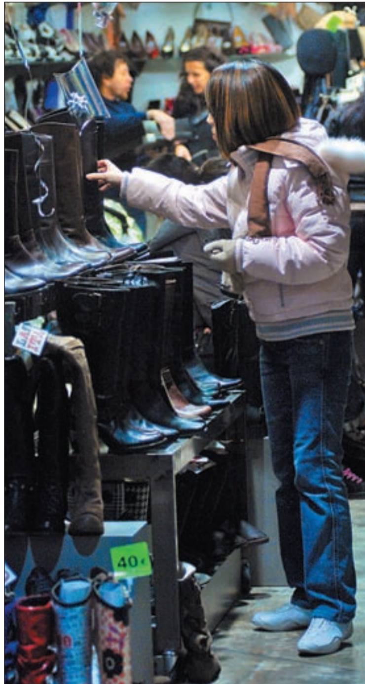
Una compradora en una tienda del centro