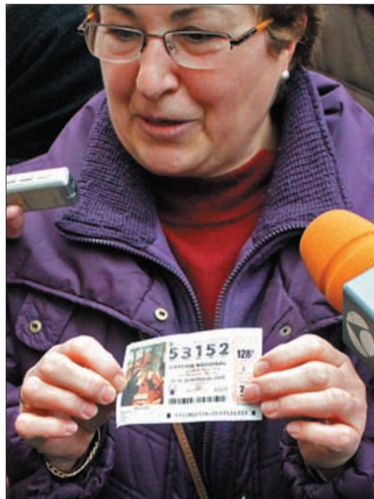
Una agraciada con el segundo premio muestra su décimo