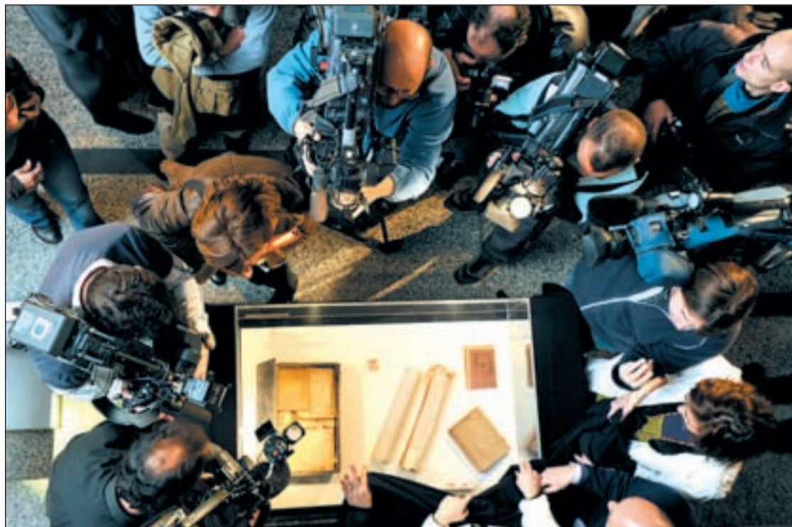
Documentos y manuscritos contenidos por la cápsula del tiempo de la estatua de Cervantes

En su interior han aparecido periódicos como la Gaceta de Madrid, el Diario de Avisos, distintas publicaciones de la época, manuscritos, el estatuto Real para las Cortes del Reino, ilustraciones de la reina Isabel II y cuatro tomos de El Quijote de 1819, entre otros objetos. Todo ello se encontraba aún en perfecto estado de conservación. No obstante, el uso de un componente químico tóxico que impregnaba la mayoría de los papeles, al mismo tiempo que