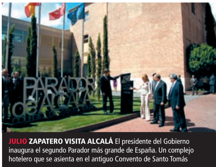
JULIO ZAPATERO VISITA ALCALÁ El presidente del Gobierno inaugura el segundo Parador más grande de España. Un complejo hotelero que se asienta en el antiguo Convento de Santo Tomás

El Corredor del Henares sufre una avalancha de despidos. El ERE de Roca cobra una gran relevancia en la vida social de esta zona. Manifestaciones y bús-