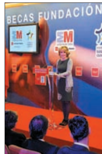
Aguirre entrega las becas

"En total, se han concedido 50 becas, por un importe conjunto de 360.000 euros, para 46 deportistas olímpicos y 4 paralímpicos, de 20 modalidades deportivas diferentes", señaló Esperanza Aguirre, quien añadió que el 42 por ciento de estas becas son para mujeres, "lo que es una prueba más del auge del deporte femenino".