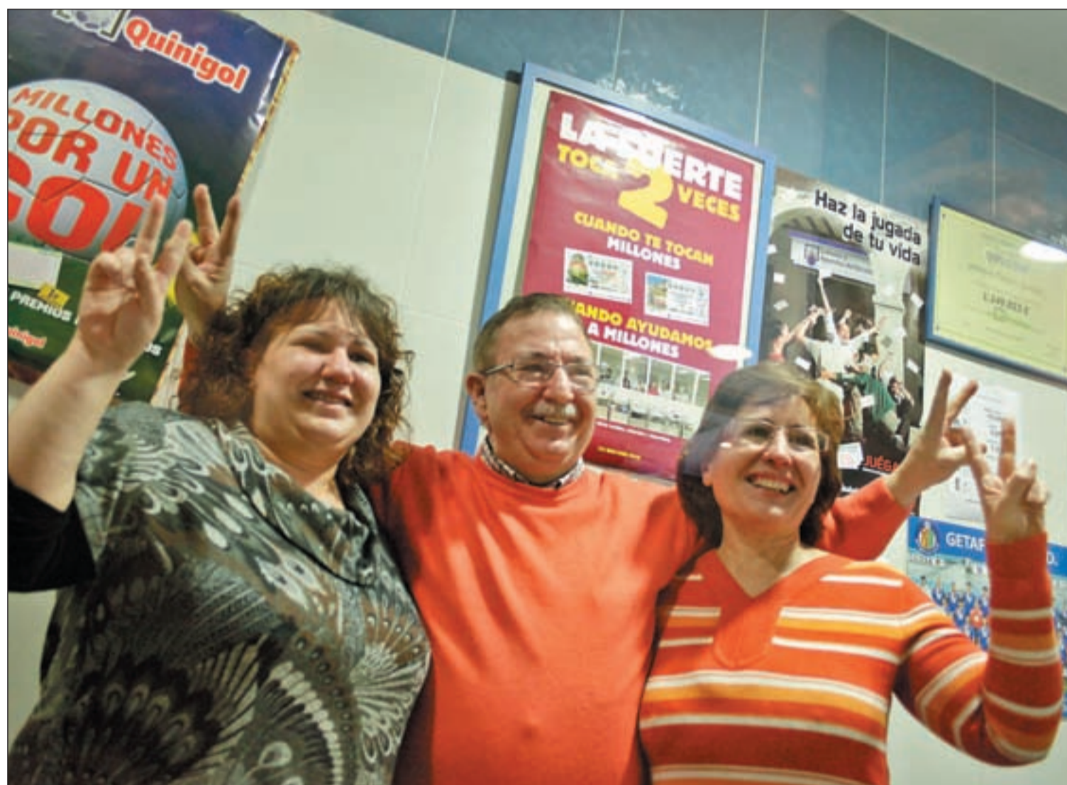
Los dueños de la administración 'El trébol', en Getafe, donde vendieron el segundo premio del Sorteo de la Navidad

Parte del Segundo premio, el 53.152, vendido íntegramente en Getafe, fue repartido por Comisiones Obreras en la capital complutense. La administración 16 vendió uno de los quintos premios Págs. 6, 7, 8 y 9