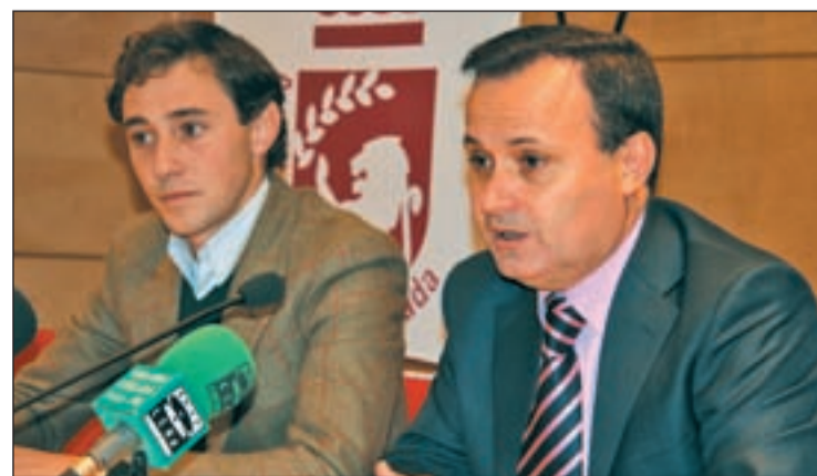
El alcalde de Coslada durante la presentación del evento

Fundi, Talavante o el Mono Burgos. Las entradas cuestan diez euros y la recaudación se destinará a comprar una silla de ruedas eléctrica para el joven. Los que no puedan asistir pero quieran colaborar, podrán hacerlo gracias a una fila cero creada para la ocasión.