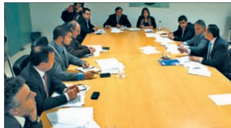
Un momento de la reunión con los representantes de los ayuntamientos

Ley Ómnibus. La presión ciudadana e institucional hizo que en el Senado no se presentase la enmienda. Sin embargo, el Gobierno no cesa en su intento de transformarla. Ante esta situación Setién busca apoyo en todos los Grupos Parlamentarios y ha transmitido su indefensión ante el Defensor del Pueblo.