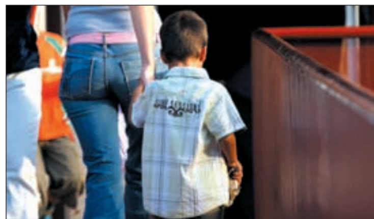
Un niño y su madre a la entrada de un colegio