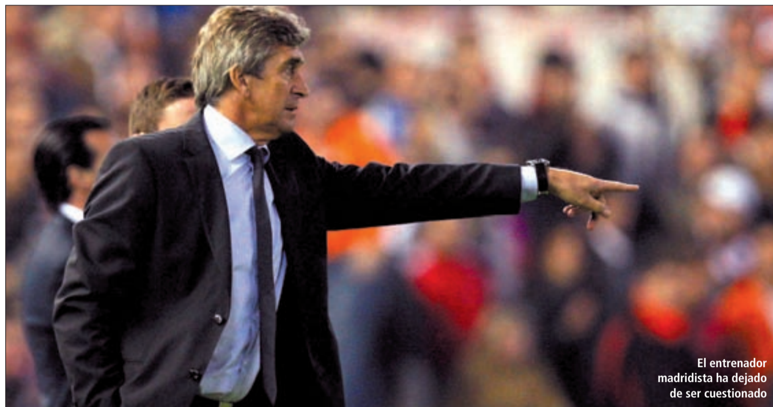
El entrenador madridista ha dejado de ser cuestionado

EL BERNABÉU VOLVIÓ A DISFRUTAR CON EL JUEGO DE SU EQUIPO DESPUÉS DE MUCHOS PARTIDOS