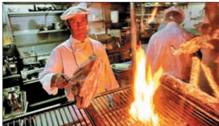
Cocina de un restaurante madrileño

ría (bares, restaurantes y cafeterías) y a servicios complementarios al comercio tales como tintorerías, peluquerías, servicios de belleza o estética, entre otros. Los proyectos dirigidos a potenciar la innovación tecnológica serán los principales beneficiados de estas inversiones.