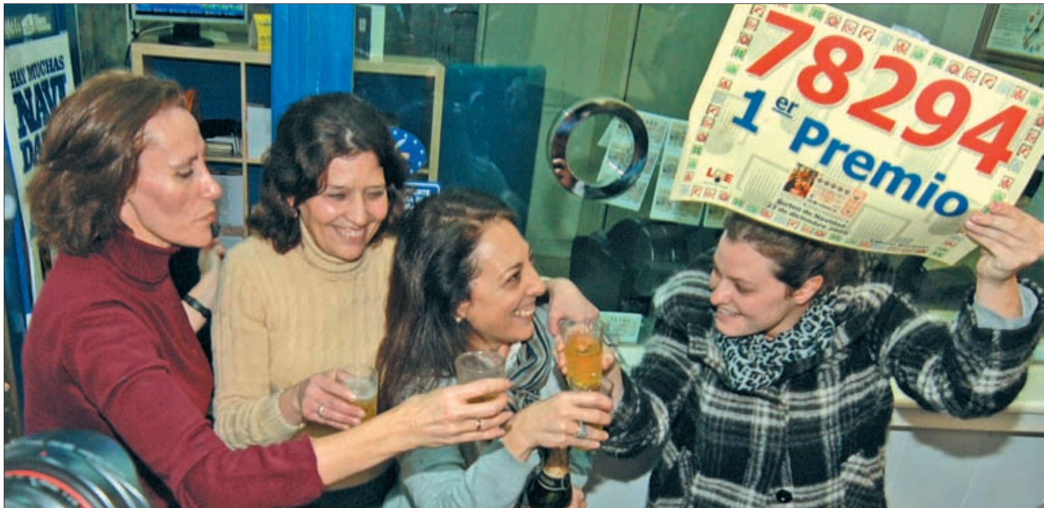
Las loteras de la Administración 146, en el número 201 de la calle Bravo Murillo, celebran haber repartido el premio Gordo de la Lotería Nacional

LA MAYORÍA DEL PREMIO SE LA LLEVAN MÁS DE DOSCIENTOS TRABAJADORES DE VIAJES MARSANS