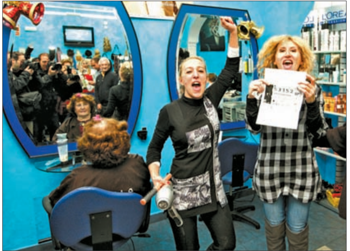
Alegría desbordante en una peluquería de Getafe donde festejan el segundo premio del Sorteo

cumplen. Pero para ello, antes, cada ciudadano de la Comunidad se gastó de media unos 85,83 euros, en nada menos que 2,7 millones de billetes, y cada billete consta de diez décimos. A Madrid le siguen Cataluña y Valencia, en número de billetes vendidos con más de 2,5 y 2 millones de euros, respecti-