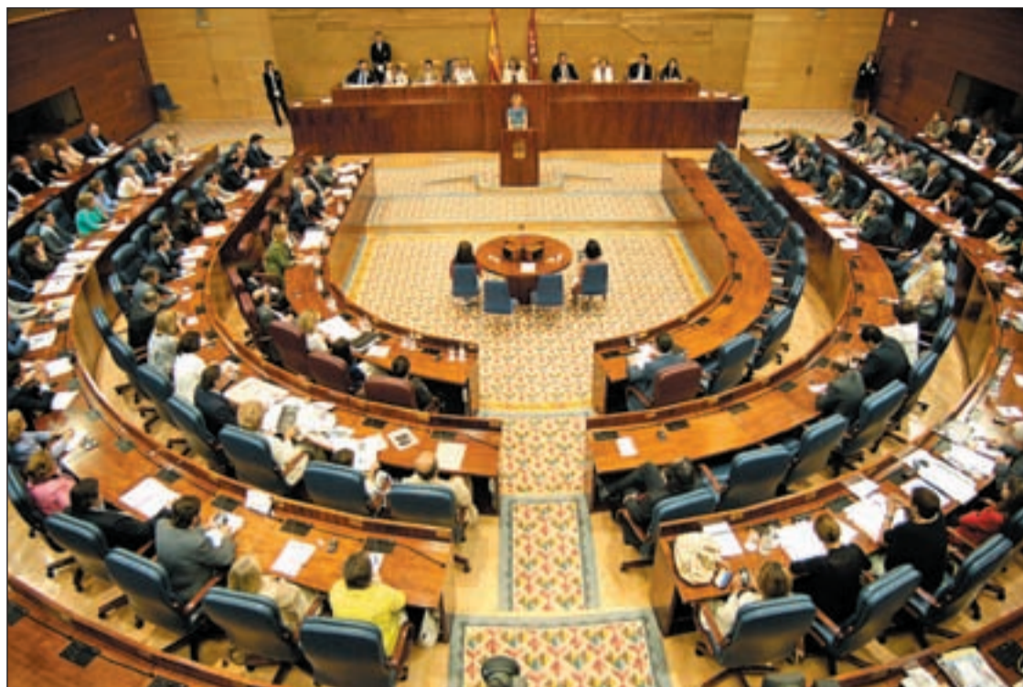
Pleno regional en la Asamblea de Madrid

PSM E IU PRESENTAN 1.800 ENMIENDAS A LAS CUENTAS PRESENTADAS POR BETETA