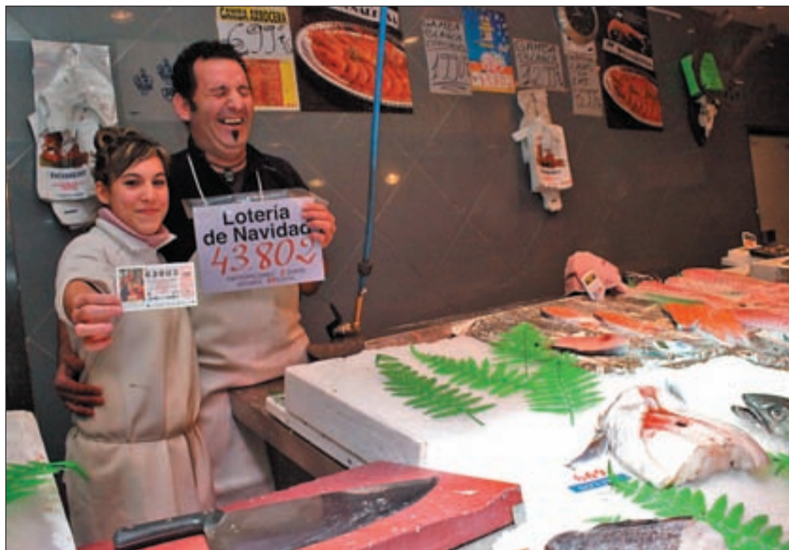
La pescadería J. A. Rodríguez de Alcorcón repartió una serie del 43.802

El resto del dinero se ha repartido entre los vecinos y las empresas de la zona. Juan, con el vaso de sidra aún en la mano, contó que su padre había comprado varios décimos para repartir entre los vecinos. Con los 5.000 euros con los que está premiado su décimo “nos pegaremos una buena cena de Nochebuena”, explicó.