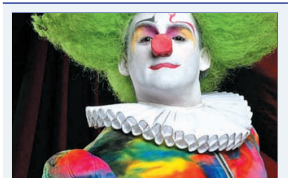
Un payaso de 'Navidades en el Price'

El Centro Dramático Nacional junto con el Centro