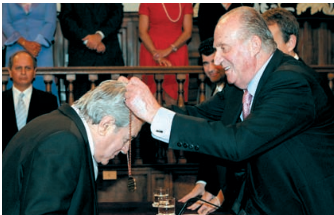
MARZO Y ABRIL LA REALEZA EN LA COMPLUTENSE Don Juan Carlos I visita Alcalá en tres ocasiones. La primera es en marzo para investir como doctores Honoris Causa a los primeros presidentes del Parlamento. En abril, entregó el Premio Derechos Humanos y el premio Cervantes al escritor catalán Juan Marsé

La vuelta al cole o al trabajo comienza con las obras de la carretera M-300 para descongestionar el tráfico de la entrada principal de la ciudad complutense. El tema de La Cañada se retoma por la decisión unilate-