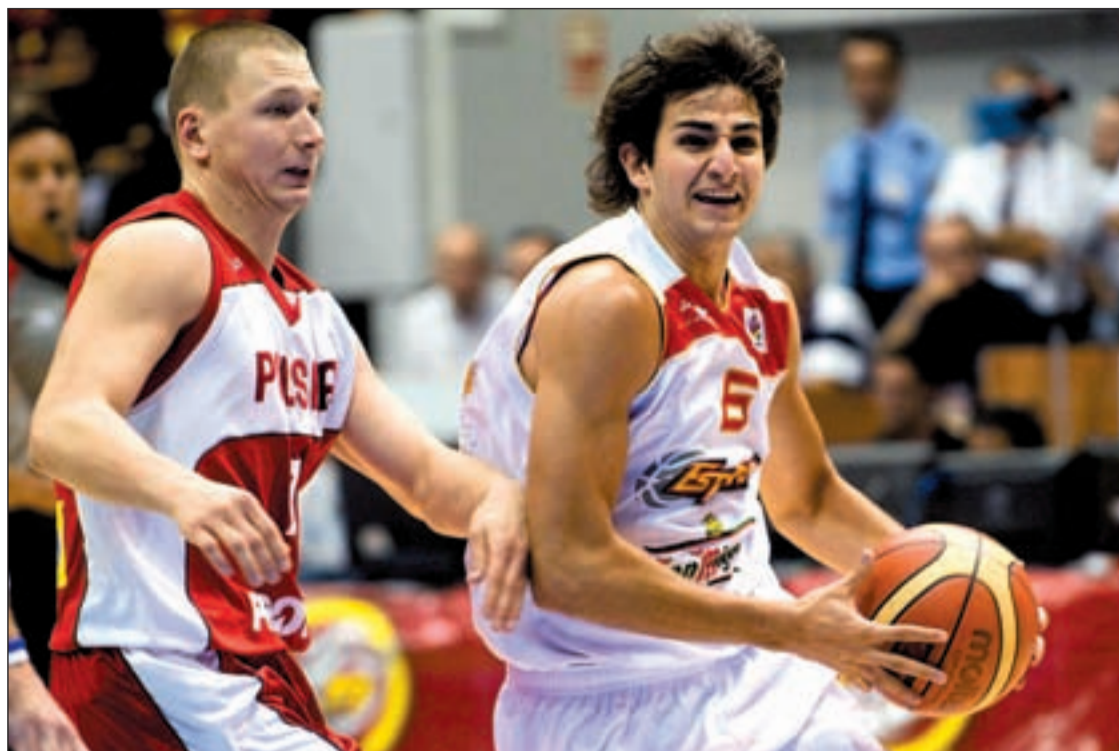
Ricky Rubio en un partido del pasado Eurobasket en Polonia

LA SELECCIÓN CONOCE A SUS RIVALES DEL MUNDIAL EN TURQUÍA