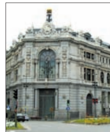
Sede del Banco de España

ciento frente al 3,75 por ciento de los títulos españoles al mismo plazo. Es decir, el diferencial rondaba los 60 puntos básicos. También la agencia Moody's asegura que el índice de paro y el elevado déficit fiscal convierten a España en un país con mucho riesgo financiero.