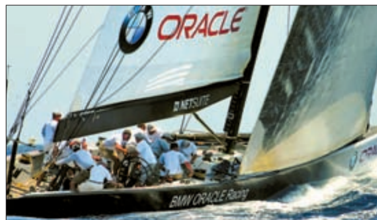
La tripulación del BMW Oracle competirá por el título

Con esta sentencia finaliza el litigio que comenzó el 20 de julio de 2007. La última vista sobre ese particular se produjo el pasado 10 de febrero.