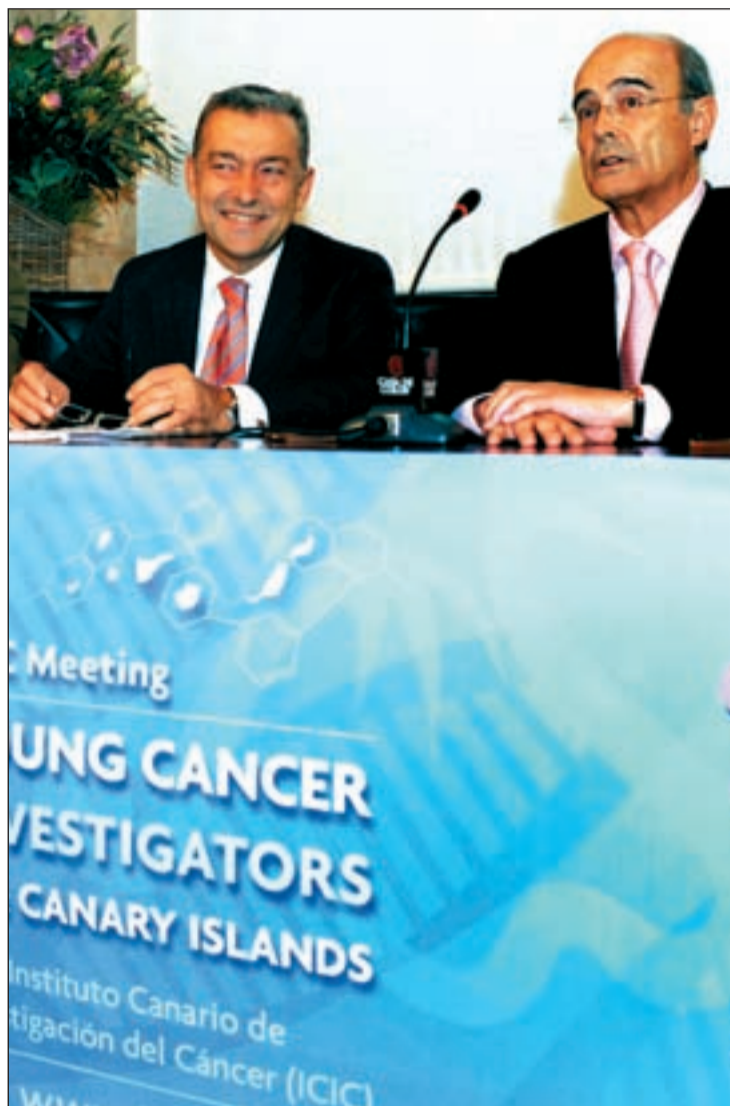
Encuentro de Jóvenes Investigadores de Cáncer celebrado en Canarias

tigadores explican que C-Myc, un gen que ayuda a convertir las células sanas en células tumorales, se encuentra frecuentemente desregularizado en el cáncer. La expresión excesiva de C-Myc suele causar la activación de CDK2 y promueve la progresión del ciclo celular. Los investigadores han descubierto que en el tejido conectivo de ratones que carecen del gen CDK2, la activación de C-Myc conduce al envejecimiento celular.