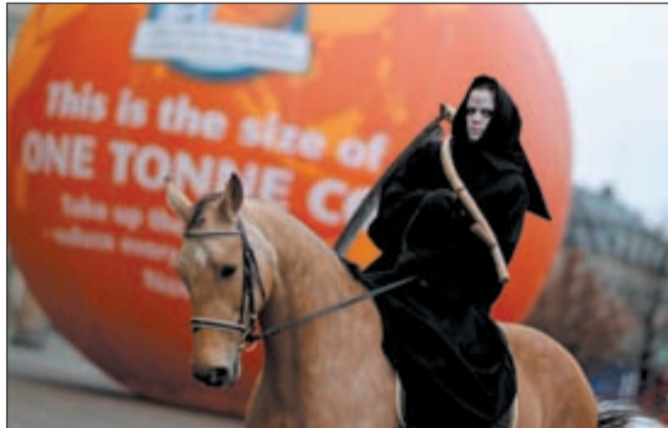
Manifestándose durante de la Cumbre en Copenhague

Esta unánime decisión africana, partidaria de prolongar el Protocolo de Kioto , y adoptando un acuerdo paralelo para los países que no están en él, trastocaba el programa de la Cumbre. Entonces posponen ruedas de prensa, como la prevista por la troika europea donde está España. Para la ONG Oxfam Internacional , los dedelagos africanos se negaron a continuar con las negociaciones a menos que las conver-