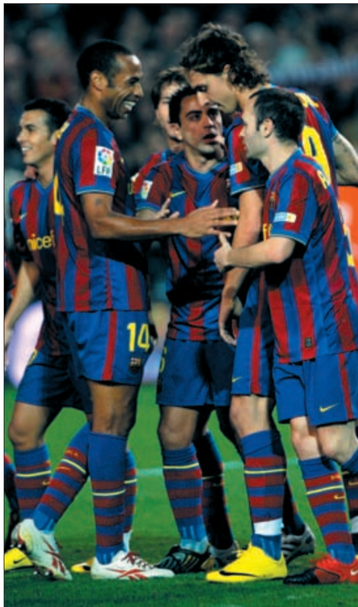
El Barcelona seguirá el sorteo desde Abu Dhabi

Entre los posibles rivales todos los equipos coinciden en pedirle a la diosa fortuna que no los caiga en suerte el Bayern de Munich, un equipo que no vive su mejor momento en la Bundesliga pero que con jugadores de la talla de Ribery, Robben o Muller puede dar un susto a cualquiera como demostró en la última jornada de-