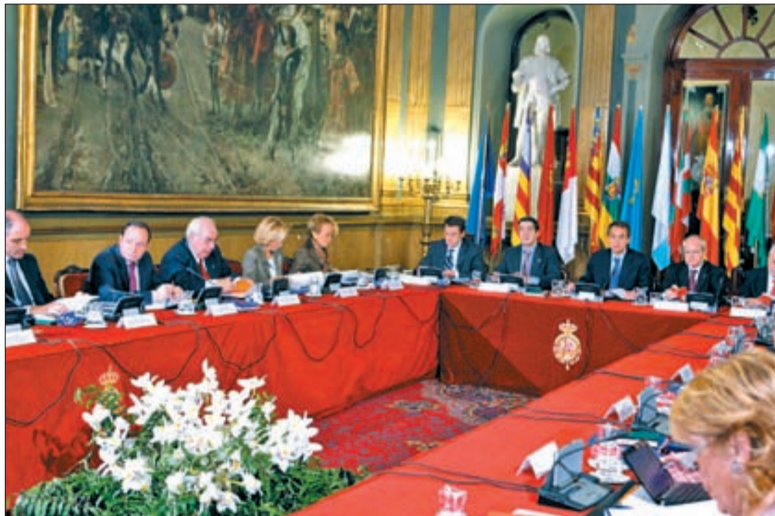
LA FOTO DE LA UNIÓN O DE LAS CRÍTICAS El balance del contenido de la Conferencia es distinto , dependiendo del partido que gobierne cada Comunidad. Para el PP, no ha habido propuestas de calado, y han improvisado un encuentro interno para debatir, mientras que en el PSOE hablan de confianza y de reforzar la unidad

Han estado todos y a todos les pidió su implicación; pero no hubo acuerdos. Los que firmaron son menores . Los presidentes de comunidades autónomas participaron, esta semana, en la que era su IV Conferencia, con el presidente de Gobierno, ministro de Política Territorial y las presencias del Rey y el Príncipe. Ni el marco del Senado ni la formalidad de la cita logran que unos y otros consensúen medidas propuestas por el Ejecutivo a las Presidencias autonómicas. Zapatero quiso lograr un acuerdo del empleo para marzo, quiso que las comunidades autónomas se comprometieran a reducir al tres por ciento el déficit en sus arcas, buscó impulsar la industria, fijando una estrategia común para la próxima década que propicie los sectores de automoción, aeroespacial, Biotecnología y tecnologías sanitarias, pero sin lograr la reacción que buscaba. En el PP, por su parte, quieren medidas concretas que, dicen, no incluía el documento gubernamental; quiso hablar del agua y los trasvases, pero tampoco obtuvo el eco pretendido. Así, unos y otros hacían su fatal balance de la Conferencia, acusándose mutuamente del fracaso de la reunión, que se tradujo