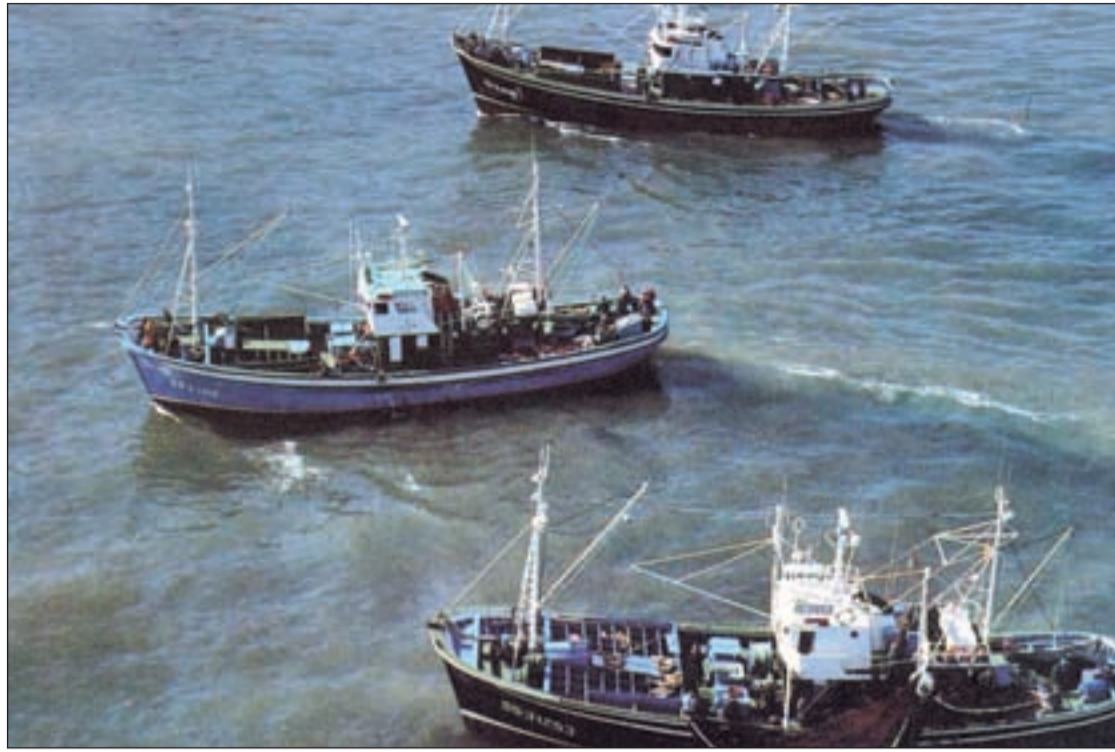
Barcos pesqueros faenando en un caladero

También esta semana se ha presentado el 'banco del tiempo'. Esta iniciativa consiste en crear una red de cooperación entre ciudadanos que aporten horas de su tiempo libre para ayudar a sus vecinos, al tiempo que el resto les ayuda a ellos con su tiempo disponible. Así, si una madre tiene problemas a diario para recoger a sus hijos en el colegio puede solicitar la ayuda de un voluntario o voluntaria al tiempo que ella devuelve el favor con su tiempo a otra persona, quizás el fin de semana, acompañando a ancianos, realizando pequeñas tareas domésticas o a hacer los deberes a otros niños cuyos padres no dispongan de tiempo suficiente para ello.