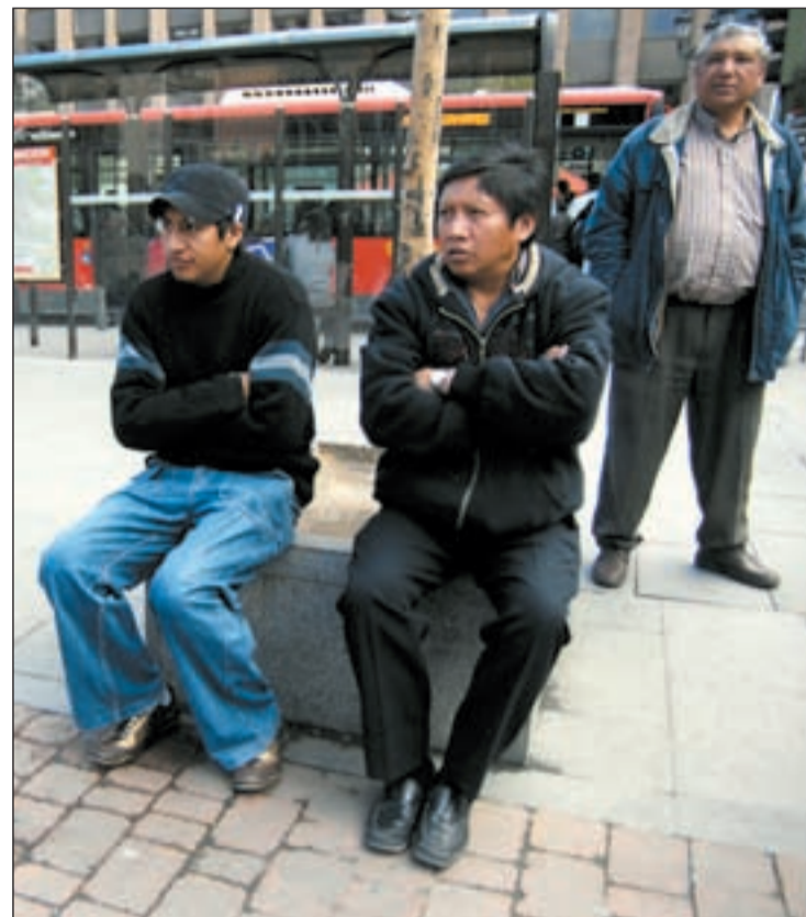
Inmigrantes latinoamericanos esperando el autobús

En cuanto a los menores, la principal reforma es la potestad que reconoce la Ley a las comunidades autónomas para transferir la custodia de niños a fundaciones privadas, ONG y gobiernos regionales. También hay novedades en las competencias autonómicas, puesto que la nueva Ley blindará las que ya tienen reconocidas regiones, Cataluña o Andalucía entre otras, que po-