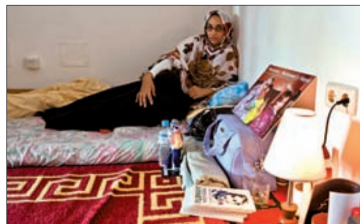
La activista saharauí, en Lanzarote, en la habitación donde duerme

ruecos que facilite el retorno de Haidar a El Aaiún. Además, han instado al Estado español que plantee al aliado marroquí medidas concretas y decisorias. Hasta hoy, todas las actuaciones han sido insuficientes, originando que el Ejecutivo español sea el centro de las críticas. Fernando Peraíta, de la Plataforma de Solidaridad con Haidar, dice que no entiende cómo Zapatero puede ocupar la Presidencia de la UE desde el uno de enero y presentarse de avalista de Marruecos con el cadáver de Aminetu Haidar encima de la mesa . Sin duda, para Pe-