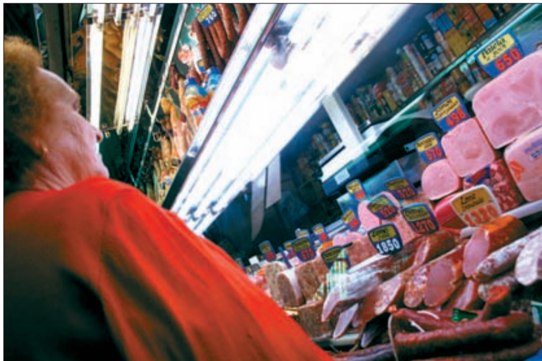
Las subidas de precios en los sectores básicos tienen efectos inmediatos sobre la cesta de la compra

Quizá sea una de las pocas subidas que no viene por la necesidad de hacer caja y sí por solventar el tan manido déficit tarifario, que supone unos 12.000 millones de euros en procesos de titulación.