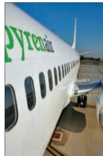
Avión de Pyrenair

La compañía aérea oscense Pyrenair inicia con toda la ilusión y buenas expectativas económicas la nueva temporada 2009/2010 con más puntos de salida para poder llegar a las estaciones de esquí de Aragón. Esta temporada los vuelos conectan las ciudades de Madrid, A Coruña, Valencia y Palma de Mallorca con Huesca a través de vuelos regulares con una doble frecuencia semanal, con salidas en viernes y domingos. Esto permite hacer viajes de fin de semana, 5 y 7 días a las estaciones del Pirineo Aragonés. Las Palmas de Gran Canaria y Tenerife también tienen conexión con Huesca-Pirineos a través de Madrid-Barajas.