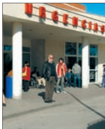
Urgencias del 12 de Octubre

tre los 15 y 62 años de edad y procedentes de diferentes Comunidades Autónomas. Estos pacientes presentaban previamente patologías crónicas pulmonares como fibrosis quística, enfermedad pulmonar obstructiva crónica (EPOC) y enfermedades intersticiales.