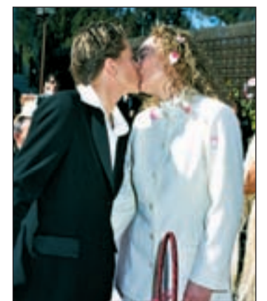
Enlace de una pareja homosexual

➤ CONSETA ESTA SEMANA EN LA WEB MÁS DATOS SOBRE ESTA TEMÁTICA