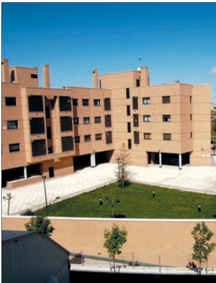
Menos intereses para las hipotecas de Vivienda de Protección Oficial

El Ejecutivo defiende que la rebaja de los tipos de interés de crédito ha beneficiado ya a un total de 600.000 ciudadanos, en la línea de la reducción re-