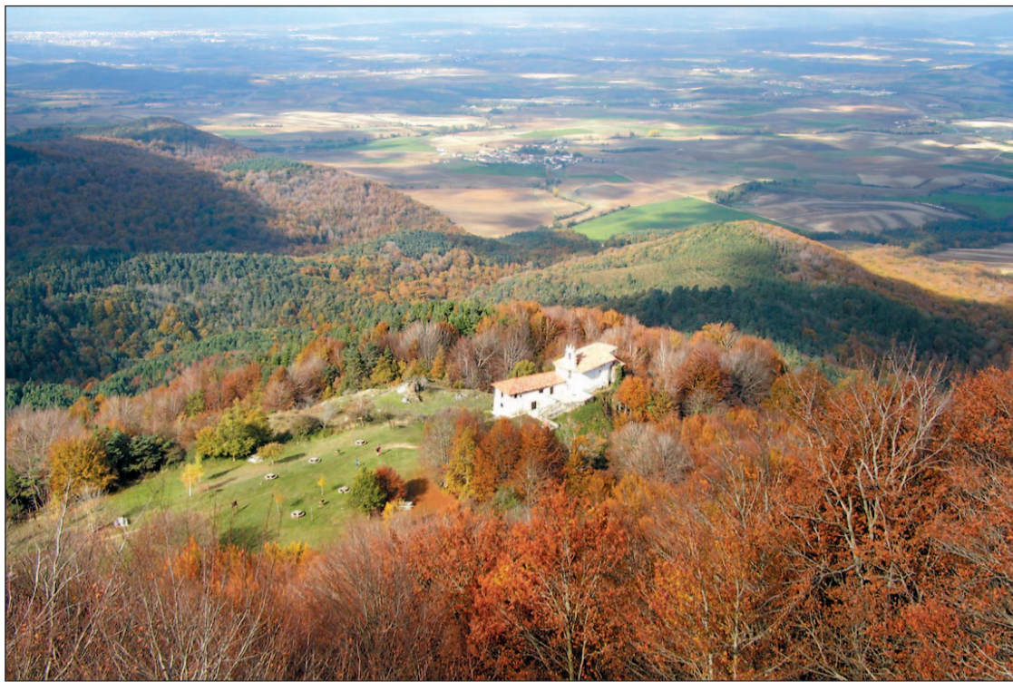
Vista de la Ermita de San Vitor y la Llanada alavesa desde la cima del monte Itxogana.

CONTRA LA AMENAZA DE CONSTRUIR EN LOS MONTES