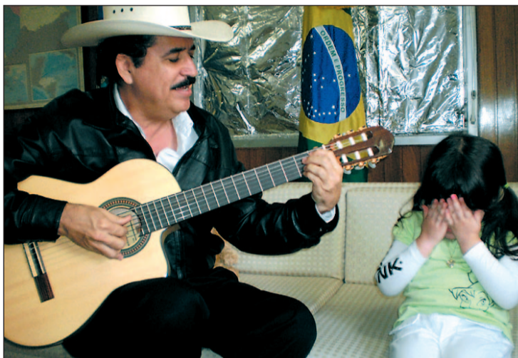
Zelaya toca la guitarra, ante su nieta, en la embajada de Brasil

Presionado por Estados Unidos y toda la comunidad internacional, representantes de Zelaya y Micheletti suscribían, el pasado viernes, el acuerdo en virtud del cual será el Congreso quien decidirá si restituyen o no en la Presidencia al legítimo mandatario que fue derrocado tras un