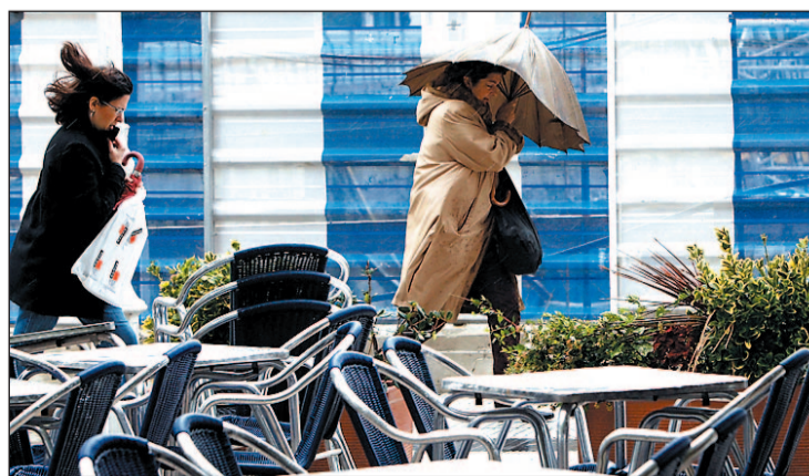
Lluvia y frío en el norte de la península

nidades han activado el nivel de alerta amarilla para prevenir incidencias por las inclemencias del tiempo. Lluvias, frío y viento son las tres consecuencias de este brusco cambio meteorológico del que sólo se libran las regiones más meridionales de España.