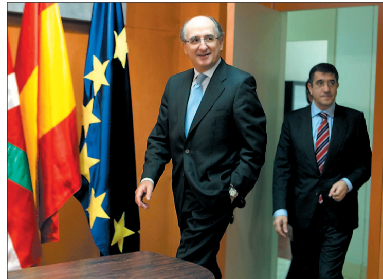
Tras el acuerdo del Lehendakari y Repsol

En este contexto, el Gobierno Vasco ha lanzado a la empresa automovilística Mercedes un mensaje abierto para convencerla de que Vitoria es un lugar idóneo para la fabricación de coches eléctricos. Por ahora Mercedes va a fabricar cien unidades de un modelo experimental de furgoneta eléctrica en la capital alavesa.