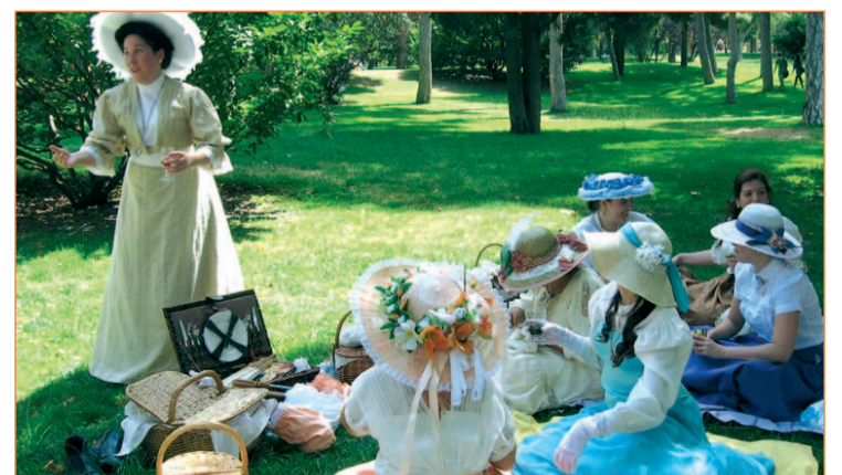
Miembros de Augusta celebrando un Picnic ambientado en 1900