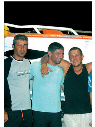
Algunos de los secuestrados

Por otro lado, la inclusión de armas y profesionales de seguridad privada en los barcos pesqueros en el Índico ya ha entrado en vigor, siendo Defensa e Interior los encargados de autorizar cada caso. El pasado fin de semana, el atunero 'Artza' logró rechazar el ataque de una embarcación en aguas interna-