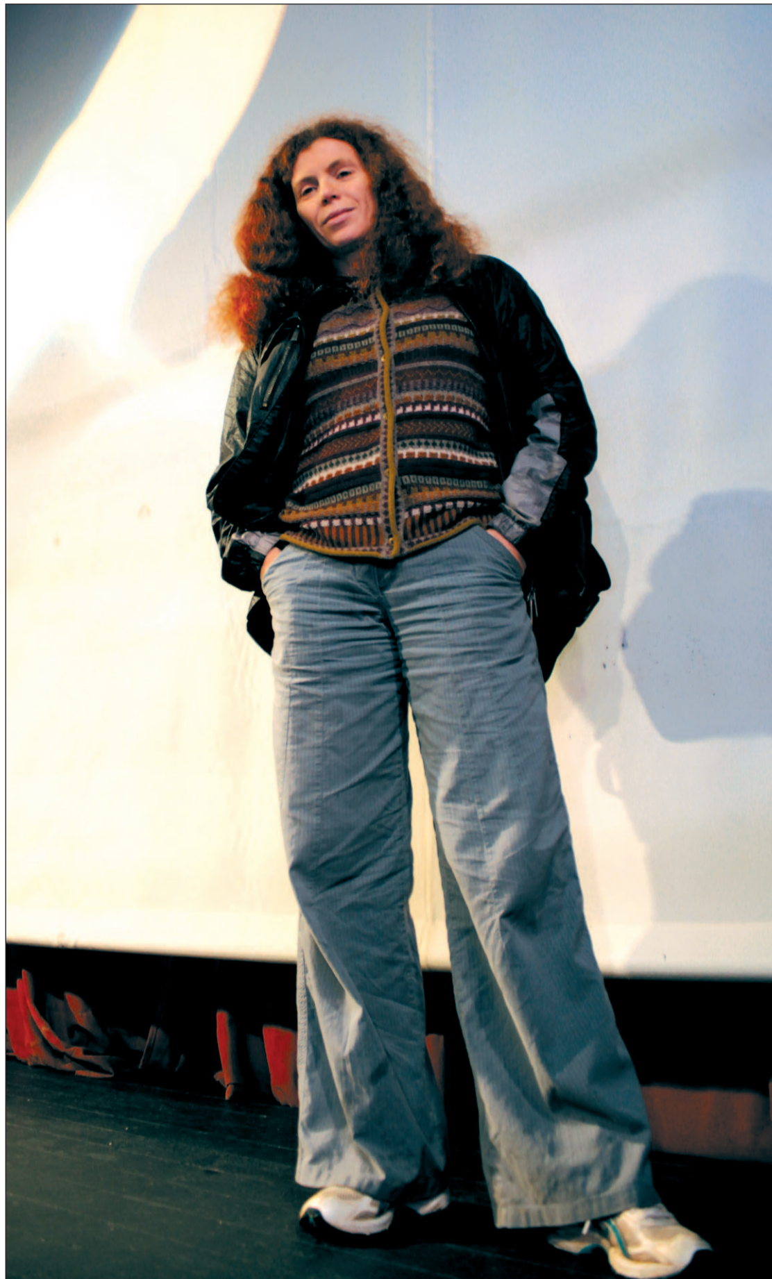
La periodista rusa Yulia Latinina en el Centro de Cultura de Getafe

Latinina se despide para irse al hotel. Acaba de llegar a Madrid, pero le quedan por delante cinco jornadas de frenéticas actividades. La mañana siguiente tiene un vuelo a primera hora hasta Barcelona, entrevistas en las Ciudad Condal y vuelta a Madrid, donde presentará el li-