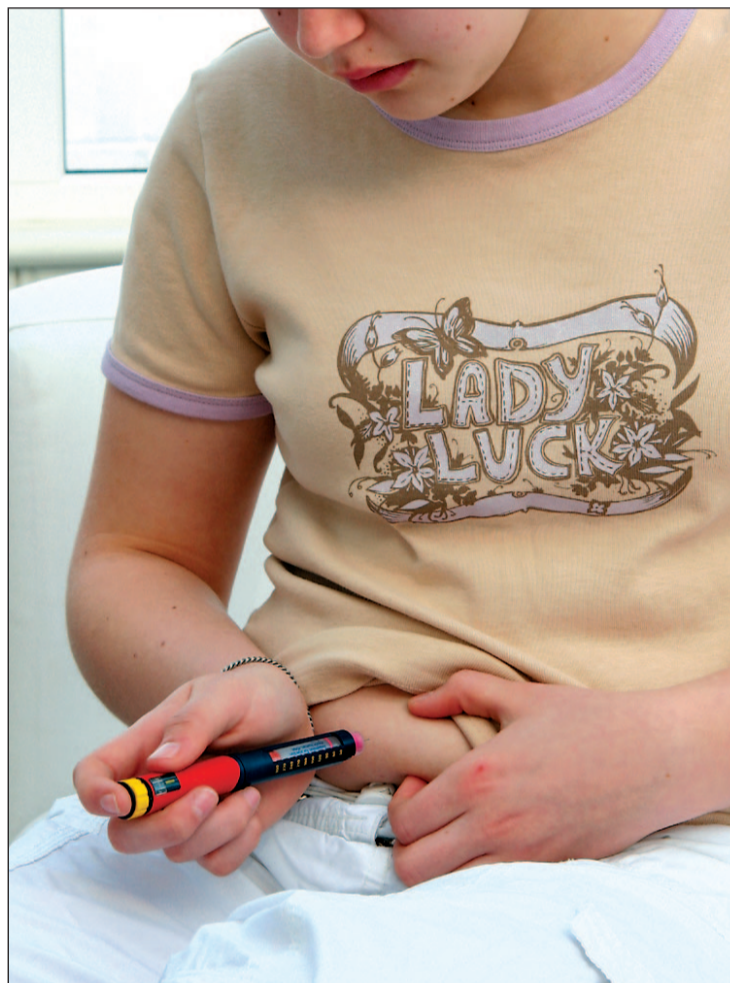
Una paciente pinchándose para detectar su grado de glucosa

Cual ponen de manifiesto, este páncreas artificial telemático es la tecnología más avanzada del control de diabetes. El Asistente Personal (PDA) que tiene el enfermo (sensor de glucosa que mide permanentemente el nivel de azúcar en sangre) transmite los datos a la bomba de infusión continua de insulina que programa automáticamente en tiempo real con algoritmos (la