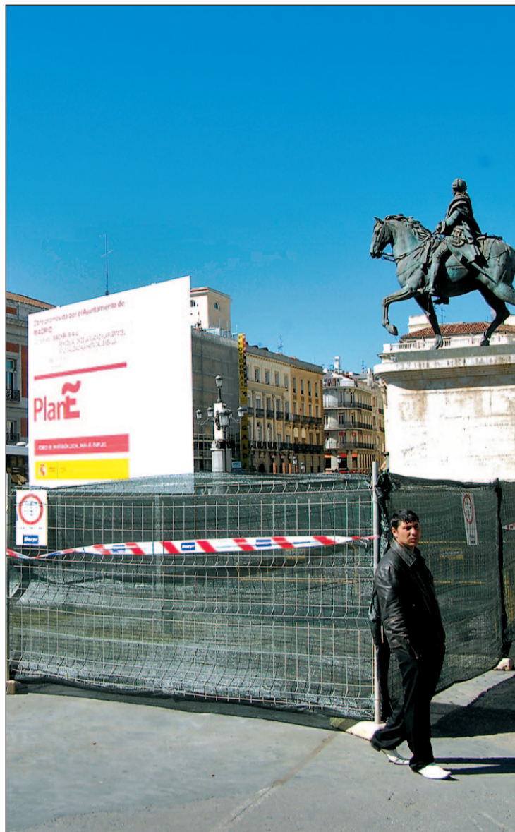
Cartel informativo sobre un proyecto enmarcado en el Plan E

Los parados inscritos como solicitantes de empleo serán los principales beneficiarios de las inversiones del nuevo fondo,