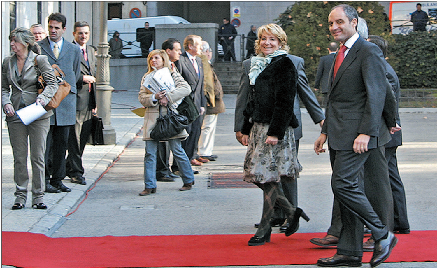
Esperanza Aguirre y Francisco Camps, dos de los presidentes autonómicos que cosechan más votos