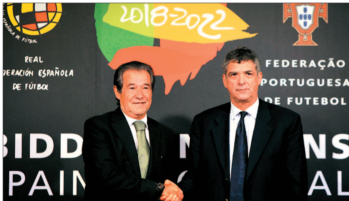
UNIDOS El presidente de la Federación Portuguesa, Gilberto Madail y su homólogo español, Ángel María Villar, presentaron el logotipo oficial de la candidatura ibérica, definido como "un símbolo que representa la fusión de dos países a través de la pasión por el fútbol". Dicho logo aúna las banderas de ambas naciones.

Los presidentes de la federación española y lusa, Ángel María Villar y Gilberto Madail, son las cabezas visibles de un proyecto que tiene como objetivo traer a nuestro país un evento deportivo de gran envergadura. La última vez que la RFEF presentó una candidatura fue para organizar la Eurocopa de 2004, pero finalmente Portugal fue la elegida, en una decisión algo polémica y que levantó sospechas en la delegación española.