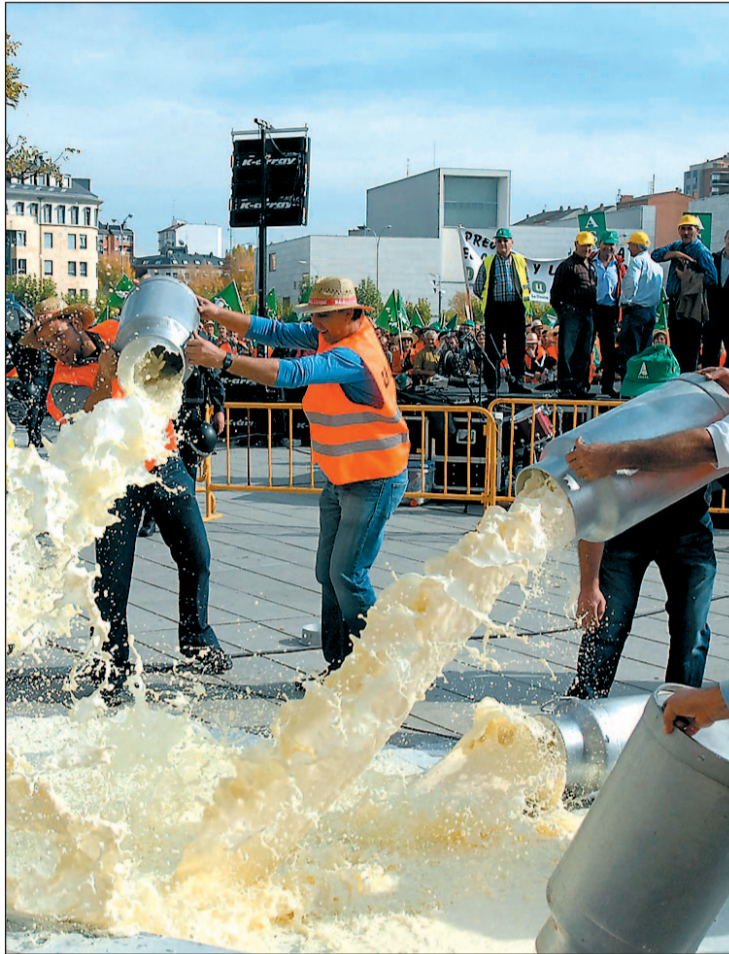
Protestas en León de agricultores y ganaderos