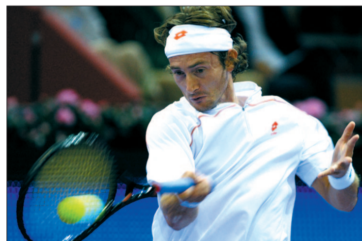
Ferrero, protagonista por partida doble

El torneo también ha servido para atraer la celebración de otros eventos. Así, Valencia acoge la XI edición del Congreso Mundial de la Sociedad de Medicina y Ciencias del Tenis, uno de los congresos médicos deportivos más importantes del mundo. En dicho congreso se