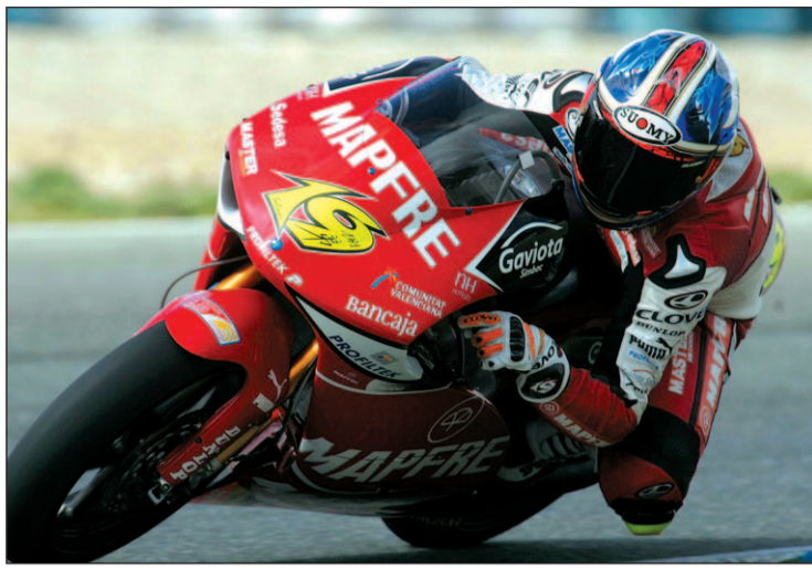
El talaverano ya no tiene opciones en el Mundial

250 C.C. EL NIPÓN SE JUEGA EL CAMPEONATO