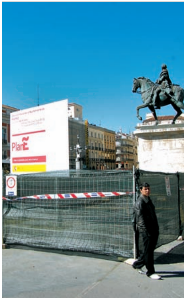
Cartel informativo sobre un proyecto enmarcado en el Plan E

Los parados inscritos como solicitantes de empleo serán los principales beneficiarios de las inversiones del nuevo fondo,