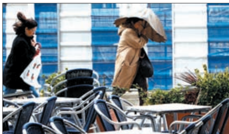
Lluvia y frío en el norte de la península

nidades han activado el nivel de alerta amarilla para prevenir incidencias por las inclemencias del tiempo. Lluvias, frío y viento son las tres consecuencias de este brusco cambio meteorológico del que sólo se libran las regiones más meridionales de España.