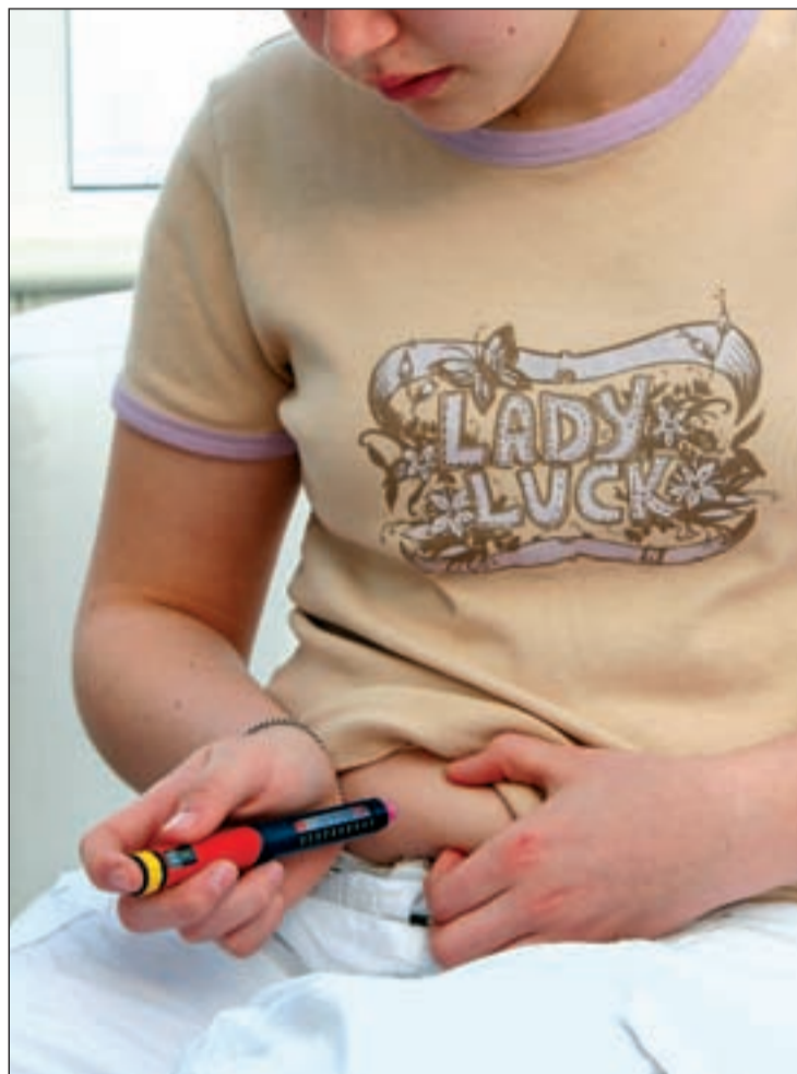
Una paciente pinchándose para detectar su grado de glucosa

Cual ponen de manifiesto, este páncreas artificial telemático es la tecnología más avanzada del control de diabetes. El Asistente Personal (PDA) que tiene el enfermo (sensor de glucosa que mide permanentemente el nivel de azúcar en sangre) transmite los datos a la bomba de infusión continua de insulina que programa automáticamente en tiempo real con algoritmos (la