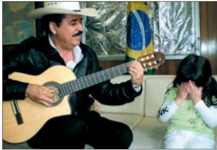
Zelaya toca la guitarra, ante su nieta, en la embajada de Brasil

Presionado por Estados Unidos y toda la comunidad internacional, representantes de Zelaya y Micheletti suscribían, el pasado viernes, el acuerdo en virtud del cual será el Congreso quien decidirá si restituyen o no en la Presidencia al legítimo mandatario que fue derrocado tras un