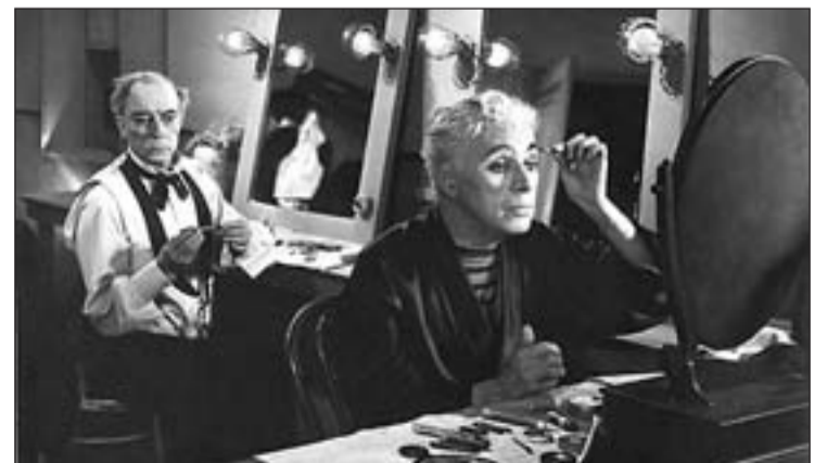
Una de las imágenes inéditas de la muestra

meses de cárcel por un delito de abandono de familia. Según la acusación, las pequeñas presentaban un estado de abandono "extremo". A este respecto, la mujer dijo que pasaron una época de "crisis total", en la que estuvieron 40 días sin luz y dos semanas sin gas.