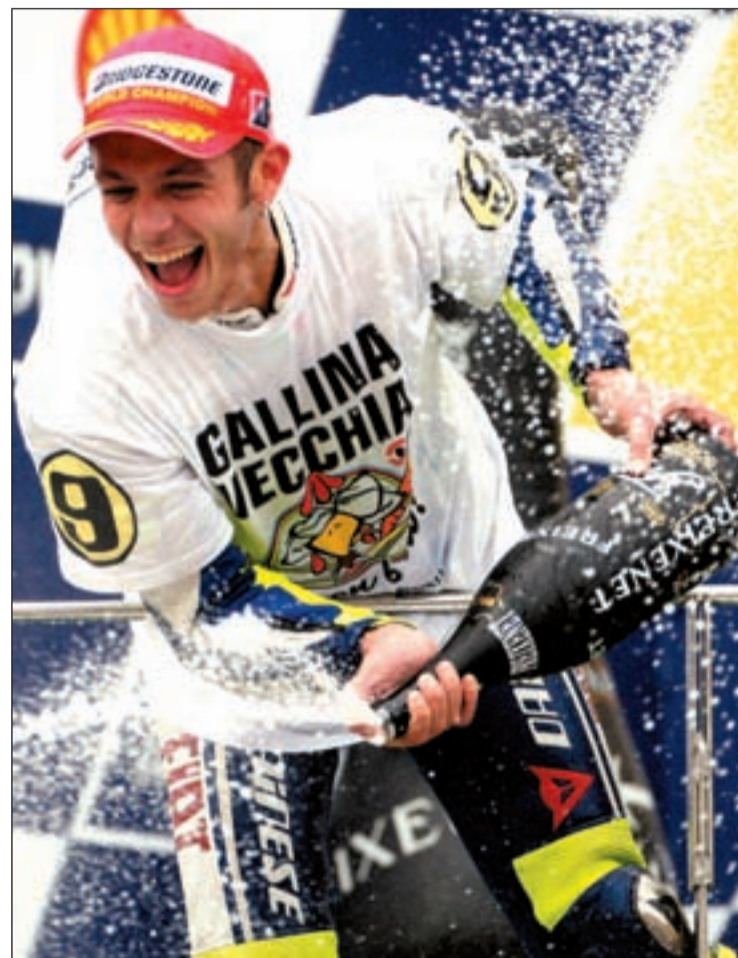
Rossi celebrando el campeonato del mundo en Malasia

La carrera disputada en Sepang hace quince días sirvió para que Valentino Rossi firmara su noveno campeonato del mundo y, de paso, restar emoción a la última cita del calendario. Pese a todo, Jorge Lorenzo buscará desquitarse con una victoria que sirva para cerrar de manera brillante una temporada en la que ha conseguido poner en apuros a todo un campeón como Valentino Rossi. El italiano ha tenido que recurrir a su mejor versión, con frenadas imposibles y adelantamientos inverosímiles para evitar que el mallorquín le arrebatara la corona mundial. Esa competitividad ha dejado momentos para el recuerdo a lo largo del año como el duelo que protagonizaron los dos pilotos de Yamaha en el circuito de Montmeló.