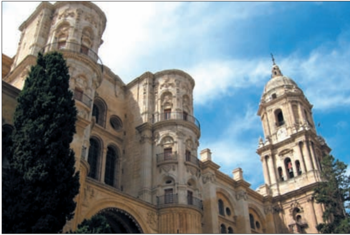
Vista de la catedral de Málaga, uno de los reclamos históricos y culturales de la capital

LE PERMITIRÍA UNA MAYOR FLEXIBILIZACIÓN DE LOS HORARIOS COMERCIALES