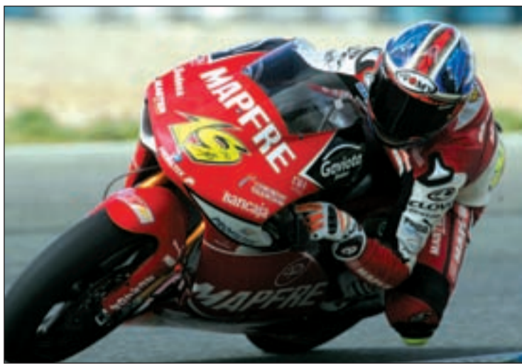
El talaverano ya no tiene opciones en el Mundial

250 C.C. EL NIPÓN SE JUEGA EL CAMPEONATO