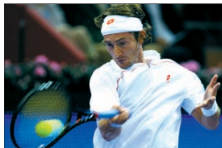
Ferrero, protagonista por partida doble

El torneo también ha servido para atraer la celebración de otros eventos. Así, Valencia acoge la XI edición del Congreso Mundial de la Sociedad de Medicina y Ciencias del Tenis, uno de los congresos médicos deportivos más importantes del mundo. En dicho congreso se