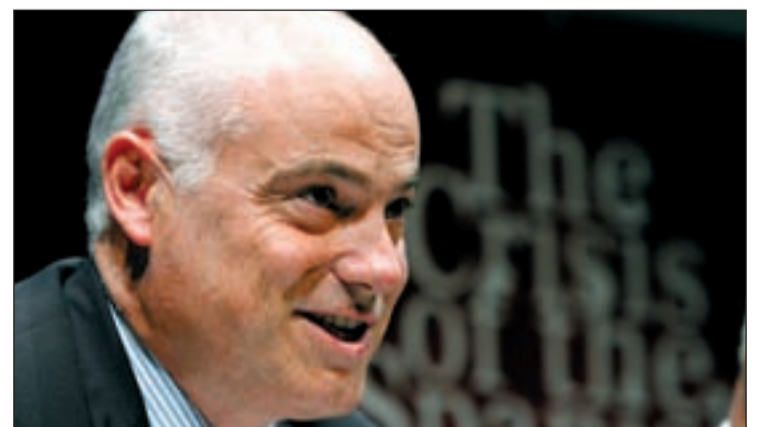
José Manuel Campa, Secretario de Estado de Economía

donde más subió fue en Andalucía y Castilla-La Mancha con 20.870 y 12.408 desempleados. Únicamente descendió en Canarias. El Secretario de Estado de Economía, José Manuel Campa, dice que España no comenzará a generar empleo neto hasta finales de 2010.