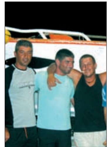
Algunos de los secuestrados

Por otro lado, la inclusión de armas y profesionales de seguridad privada en los barcos pesqueros en el Índico ya ha entrado en vigor, siendo Defensa e Interior los encargados de autorizar cada caso. El pasado fin de semana, el atunero 'Artza' logró rechazar el ataque de una embarcación en aguas interna-