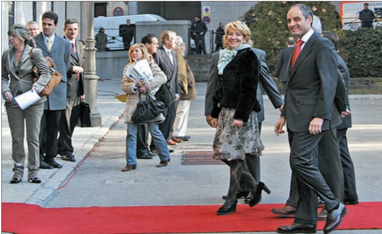
Esperanza Aguirre y Francisco Camps, dos de los presidentes autonómicos que cosechan más votos