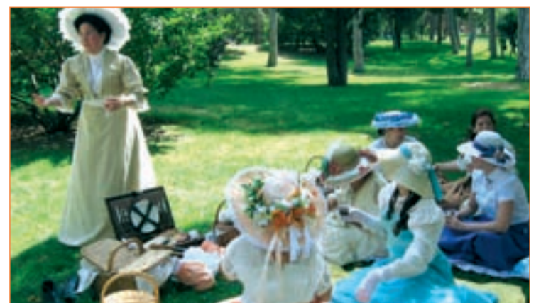
Miembros de Augusta celebrando un Picnic ambientado en 1900