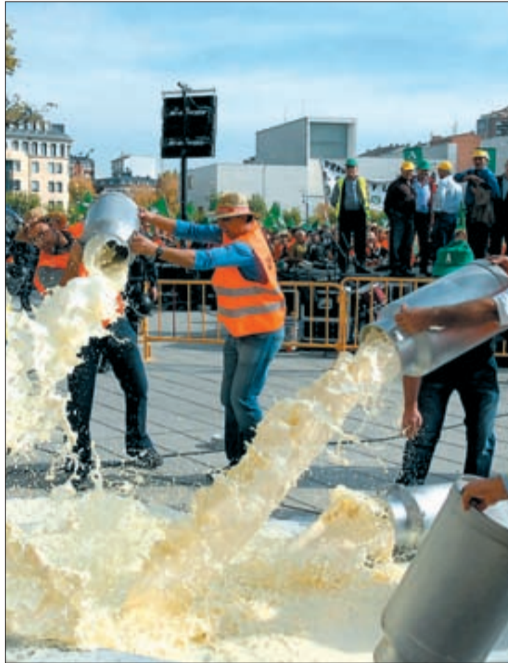
Protestas en León de agricultores y ganaderos