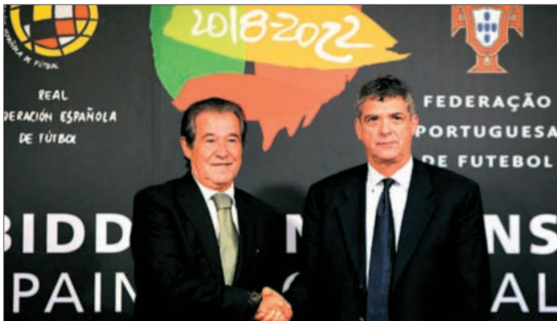
UNIDOS El presidente de la Federación Portuguesa, Gilberto Madail y su homólogo español, Ángel María Villar, presentaron el logotipo oficial de la candidatura ibérica, definido como "un símbolo que representa la fusión de dos países a través de la pasión por el fútbol". Dicho logo aúna las banderas de ambas naciones.

Los presidentes de la federación española y lusa, Ángel María Villar y Gilberto Madail, son las cabezas visibles de un proyecto que tiene como objetivo traer a nuestro país un evento deportivo de gran envergadura. La última vez que la RFEF presentó una candidatura fue para organizar la Eurocopa de 2004, pero finalmente Portugal fue la elegida, en una decisión algo polémica y que levantó sospechas en la delegación española.