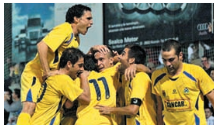
Los jugadores del Alcorcón celebran un gol contra el Real Madrid

En el bombo habrá once equipos de Primera, cuatro de Segunda y uno de Segunda 'B', el Alcorcón, que sueña con que le toque en suerte un equipo de prestigio para que su estadio registre una buena entrada y, por qué no, repetir la campaña de la goleada al Madrid.