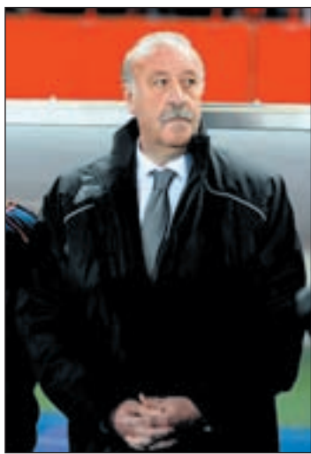
Vicente del Bosque