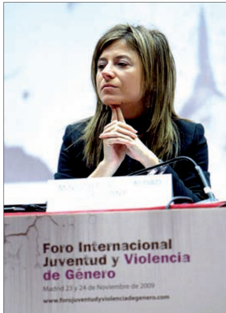
Bibiana Aído, ministra de Igualdad, en la primera sesión del Foro

Ante sus homólogas, durante el discurso de apertura del Foro, Bibiana Aído destacó que un 32,2 por ciento de las órdenes de protección en casos de Violencia de Género provenían de mujeres menores de 30 años. Aído explicó que el hecho de que los jóvenes asocien agresividad y atractivo "parecen pequeñas cosas, pero no lo son, porque son los síntomas de una relación basada en la desigualdad", por lo que instó a los jóvenes a "desenmascarar" estas realidades a tiempo colocando "el umbral de tolerancia de la violencia machista en el punto cero". Según dijo, los jóvenes están "llamados a acabar con los estereotipos", tienen el "poder de hacer de los cuidados una responsabilidad compartida" y son quienes "pueden hacer realidad que las mujeres vivan sin miedo" aunque "la mayoría cree que es un problema de gente mayor y no lo identifi-