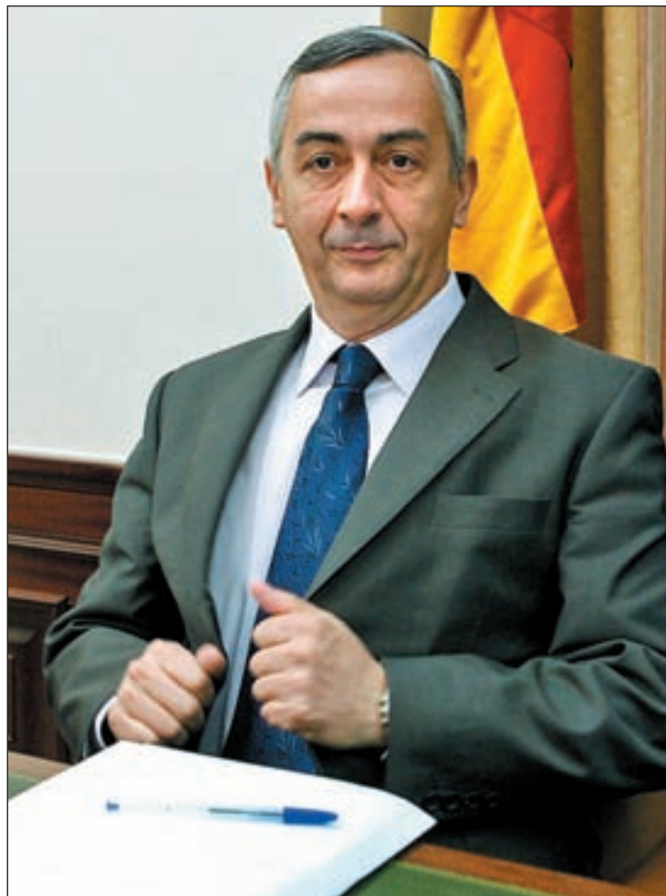
Carlos Ocaña, Secretario de Estado de Hacienda

En el capítulo de gastos, los más numerosos son por prestaciones económicas, en su mayor parte destinados a las pensiones y prestaciones contributivas, por valor de 77.932 millones de euros para pensiones de invalidez, jubilación, viudedad, orfandad y en favor de familiares. Para incapacidad laboral se destinaron 5.000 millones de euros y en pensiones no contributivas casi otros 3.000, con un crecimiento interanual del 4,9 por ciento. A la Ley de Dependencia el Gobierno ha destinado en esos diez primeros meses, 1.784 millones de euros, con un aumento del 149 por ciento. Los gastos corrientes y las inversiones disminuyen a un ritmo del diez por ciento.