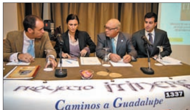
Subdirectora de Modernización del MMARM con directivos de Aprodervi

nómicamente los recursos culturales, medioambientales y turísticos de las rutas para además con ello superar el aislamiento de los pueblos de la comarca, frenar la despoblación de las zonas rurales fortaleciendo el tejido empresarial y rehabilitar su riquísimo patrimonio.