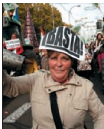
Una de las manifestantes

das las cooperativas agrarias, así como las empresas de fitosanitarios y semillas. En Aragón participaron en las protestas más de 10.000 labradores mientras en Castilla y León el seguimiento del paro rozó el 90% y se impidió la recogida de remolacha en la planta de la Bañeza.