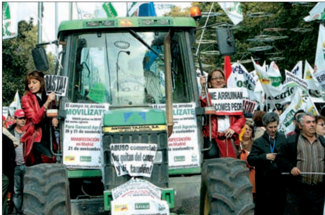
Varias agricultoras a bordo de un tractor durante la protesta del sábado en Madrid

El pasado sábado el campo se echó a la calle para protagonizar la mayor manifestación que el sector recuerda. Bajo el lema 'El campo se arruina, exigimos soluciones', los agricultores y ganaderos, unos 500.000, según las estimaciones de las organizaciones convocantes, es decir Asaja, UPA y COAG, reclamaron "precios justos" y denunciaron la "grave situación" por la que atraviesa el sector, cuya renta real total ha caído un 26% en los últimos cinco años, con la pérdida de 124.000 empleos, frente a un incremento de los costes de la producción agraria en 34,3%. Hagan cálculos y comprenderán que las vacas gordas de las subvenciones de la UE, y de las, a veces demasiado extendidas, 'triquiñuelas' para vivir de las ayudas en vez de