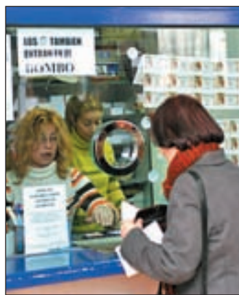
Una cliente comprando lotería

contrato mercantil y comercial que implica regirse por el derecho privado. Es decir, dejarían de operar por el régimen administrativo. Si prospera, las 4.030 administraciones y 6.000 puntos de ventas deberían renunciar a su exclusividad para la venta de Lotería Nacional.