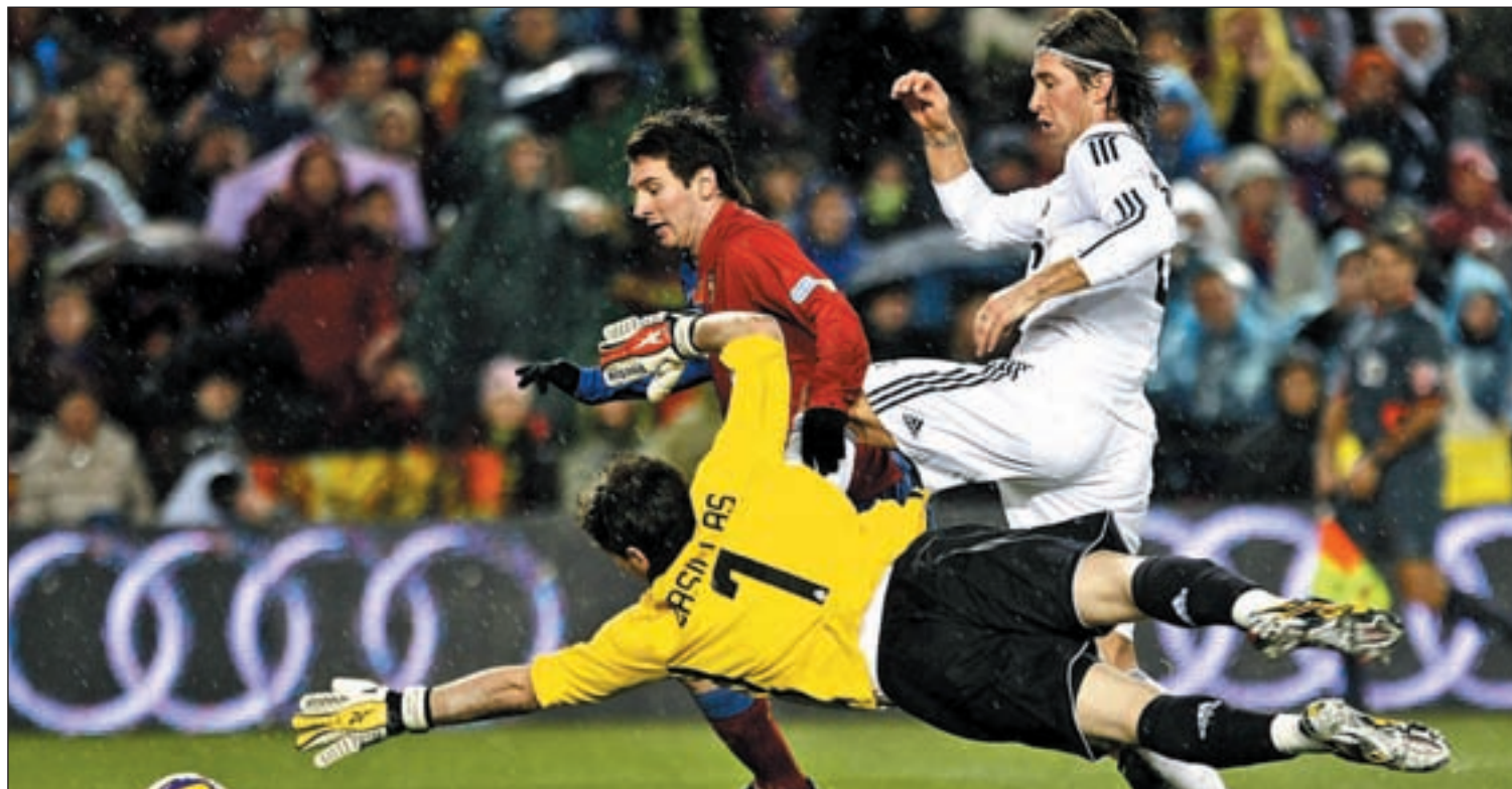
Messi marcó ante el Real Madrid en los dos partidos de Liga de la temporada pasada

EL BARCELONA PERDIÓ LA PRIMERA POSICIÓN TRAS SU EMPATE EN BILBAO LA PASADA JORNADA