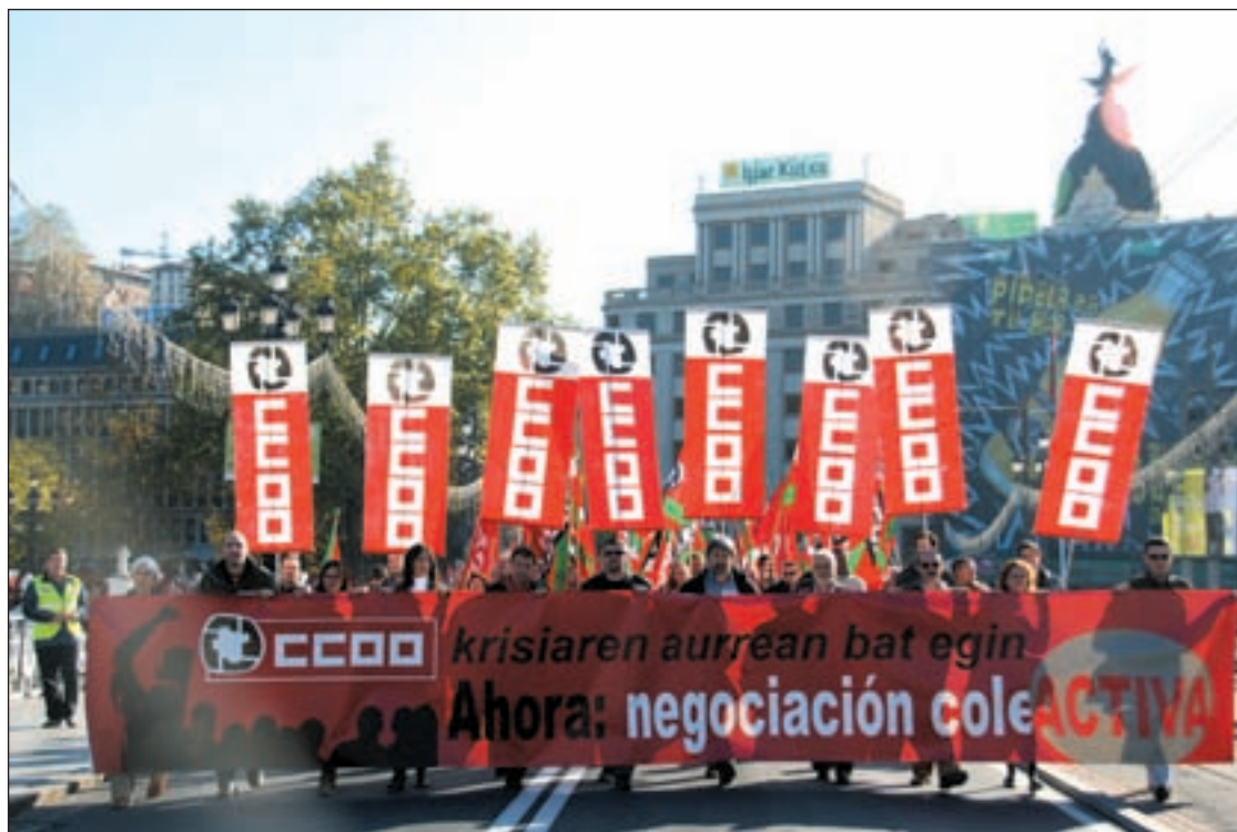
Manifestantes de CC OO durante su marcha reivindicativa el pasado martes por las calles de Bilbao

EL SECRETARIO GENERAL DEL SINDICATO VASCO CULPÓ A GOBIERNO, PATRONAL Y ELA