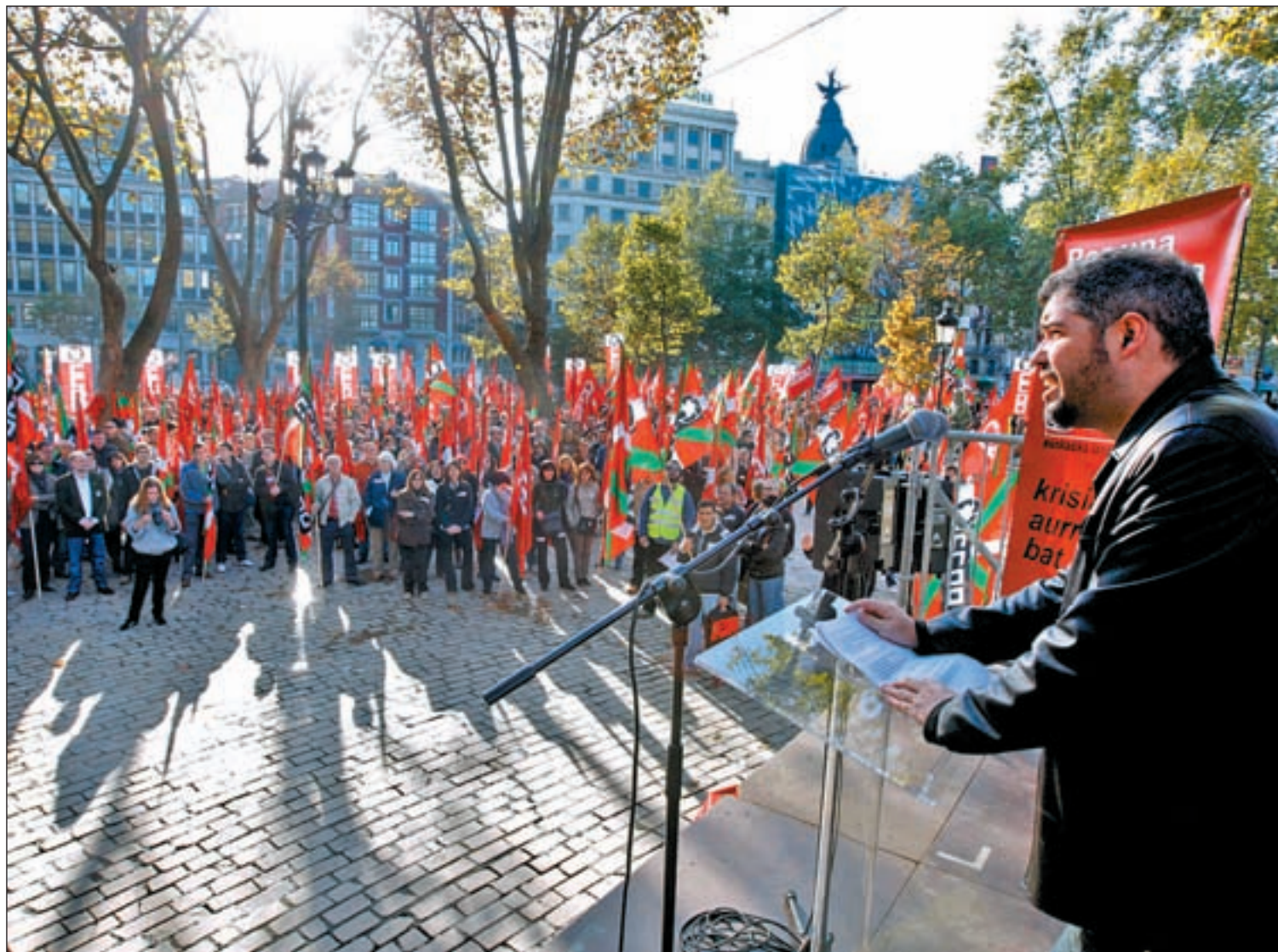
Unai Sordo, Secretario General de CC OO en Euskadi durante su mitin ante los delegados sindicales convocados

Los 2.500 delegados de CC OO en Euskadi se manifestaron en El Arenal bajo el lema 'Orain, negociación colACTIVA' • Culpan a Gobierno, patronal y ELA de la ruptura del diálogo social Pág. 4