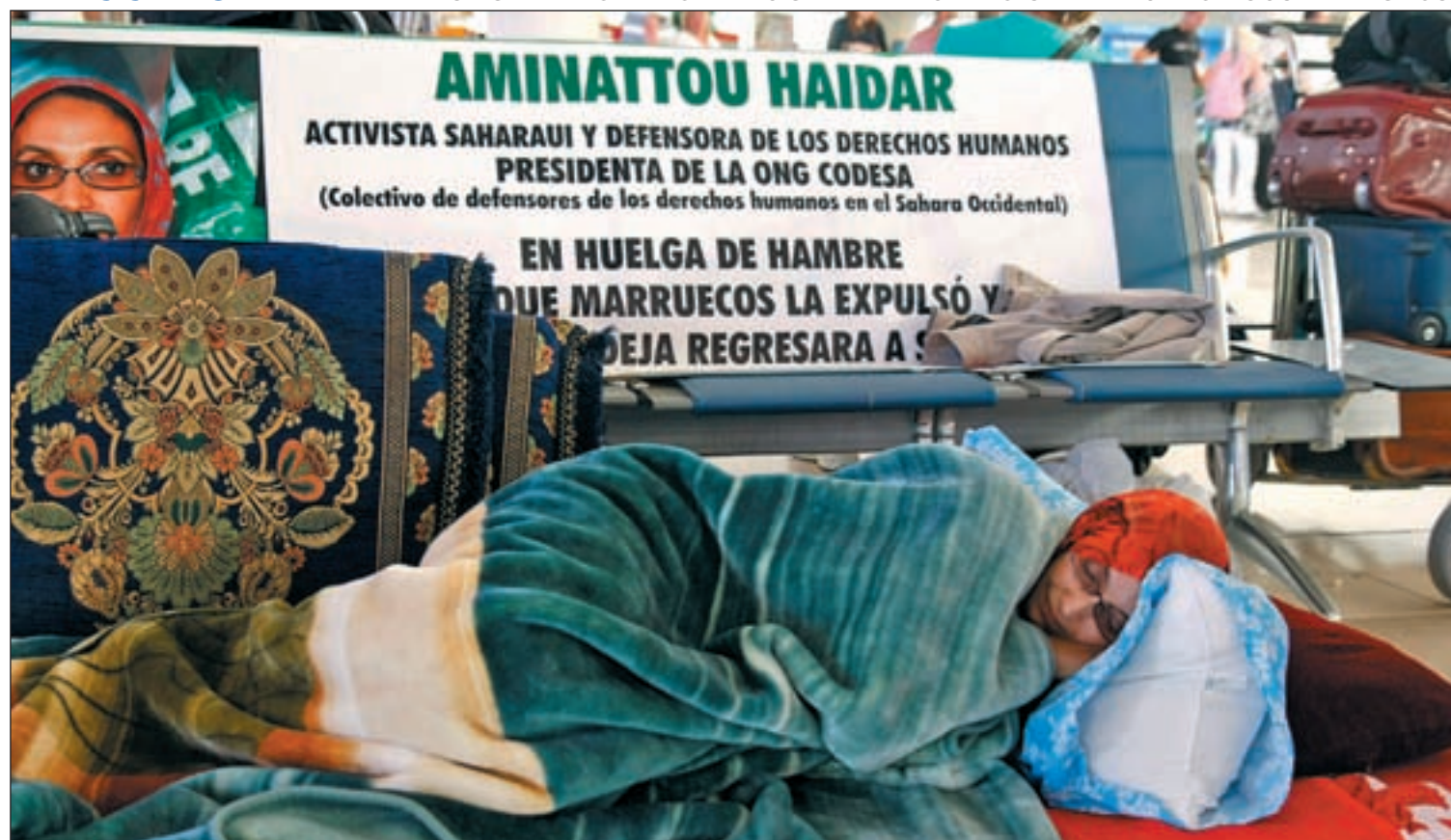
Aminatu Haidar en el aeropuerto de Lanzarote, donde ha iniciado una huelga de hambre

LA RESISTENCIA DE HAIDAR SACA DEL OLVIDO LA LUCHA DEL PUEBLO SAHARAUI POR SUS DERECHOS