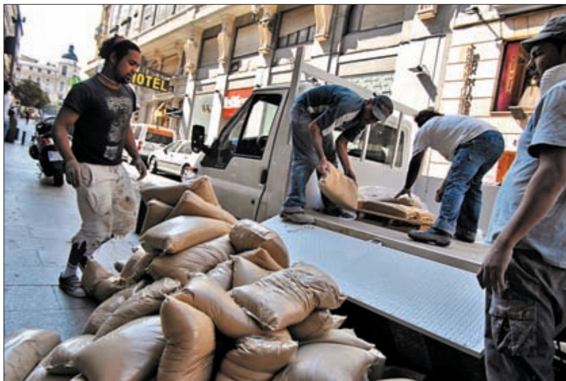
Los autónomos tienen que cotizar por accidentes y enfermedades para cobrar paro

La Organización pronostica que el mercado español puede registrar, a corto y medio plazo "un rebote cíclico", puesto que en España y otros países caso del Reunio Unido, Estados Unidos o Japón, las ventas de coches han caído muy por debajo de lo que sería su nivel normal. El informe augura un mantenimiento de la capacidad productiva para nuestro país de 2,4 millones de unidades anuales.