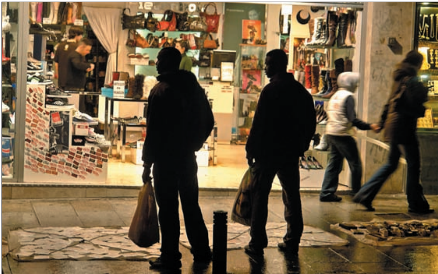
Dos personas trabajando en el 'top manta', una de sus pocas opciones de inserción en el mercado por no tener papeles