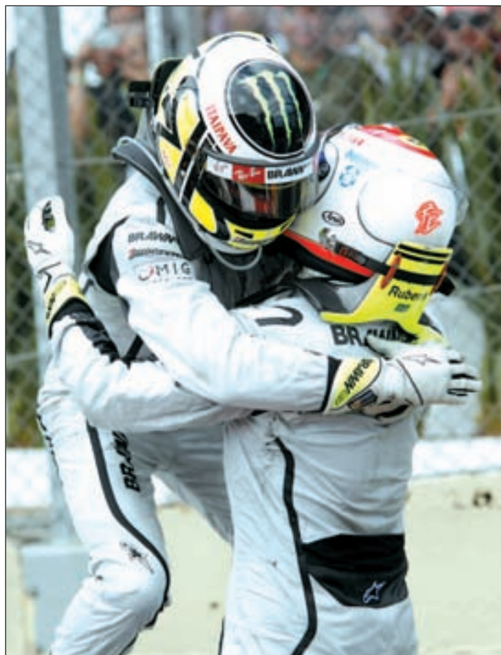
Button será el nuevo compañero de Hamilton

Pero todos estos fichajes no tapan uno de los principales problemas a los que se enfrenta el 'gran circo', la crisis económica. El mítico equipo Toyota