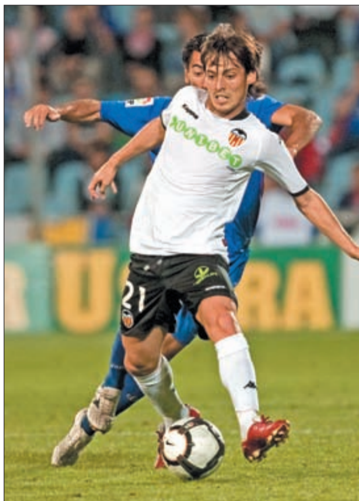
David Silva disputa el balón en el partido contra el Getafe

Pero sí la preocupación en Valencia es palpable, la situación no es mucho mejor en Santander. El equipo que dirige Juan Carlos Mandiá suma cinco puntos, a dos del descenso, todos ellos logrados lejos de El Sardinero. Se da la curiosa circunstancia de que, hasta la fecha, los partidos que ha jugado el Racing como local en esta temporada han acabado en goleada para el equipo visitante (1-4 ante Getafe y Barcelona). Buena