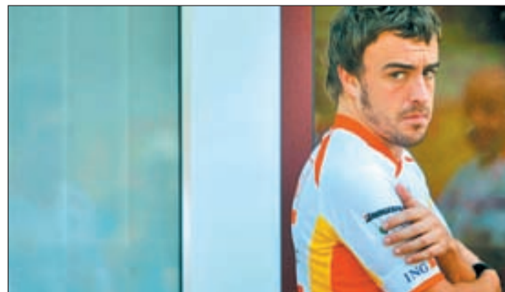
El piloto español vestirá de rojo la próxima temporada

En la terna de favoritos para la próxima carrera se encuentran Hamilton, que ya venció en Singapur la semana pasada y Alonso que llega con la intención de poner un broche de oro a su segunda etapa en Renault.