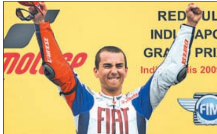
Jorge Lorenzo celebra su victoria en Indianapolis

La carrera de Estoril servirá para que Stoner reaparezca tras unos meses alejado de las pistas a causa de sus problemas físicos. El australiano se presenta como el principal oponente de Pedrosa para conquistar la tercera posición de la general. Para ello, les quedan cuatro carreras. Comienza la cuenta atrás.