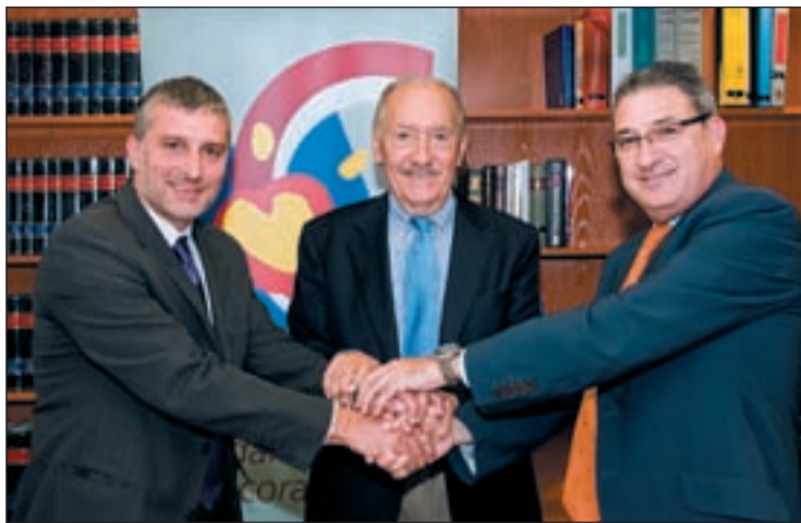
Cástel, de Adecco, Plaza, de Fundación del Corazón y Saénz, de Arc

FUNDACIÓN DEL CORAZÓN EN EL PROGRAMA VITALCOR