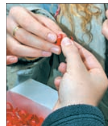
Lazos rojos solidarios

pas de país en país y según conductas de riesgo como contagio vía sexual homosexual o a través de jeringuillas en el caso de los drogodependientes también deja lagunas. Hasta ahora sería preciso crear una vacuna específica para cada una de ellas con la complejidad que su descubrimiento conlleva.