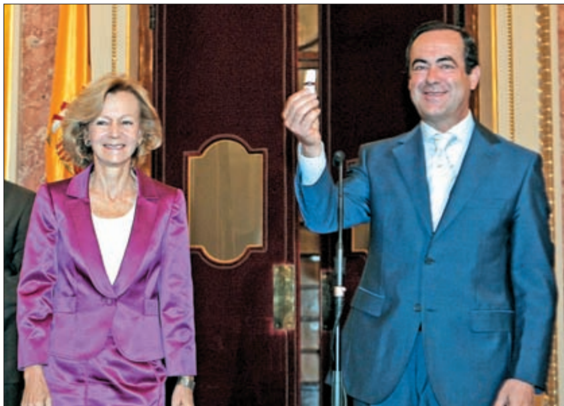
Elena Salgado en el Congreso, tras entregar a José Bono, su presidente, el proyecto de Presupuestos 2010

En la tramitación parlamentaria, el proyecto será modificado pero mantendrá subir impuestos a rentas de capital y al IVA, eliminando la deducción de cuatrocientos euros. El IVA su-