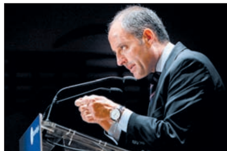
Francisco Camps, presidente de la Generalitat valenciana

Según Cospedal, "no deja de ser un informe policial" y no se está hablando ni de imputacio-