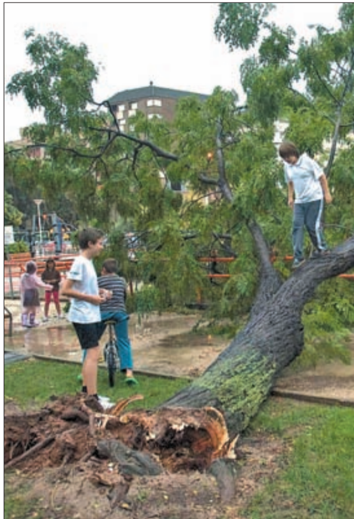
Unos niños juegan en uno de los árboles derribado por la tormenta

Especialmente prudentes deben ser los vecinos de los municipios de Vila-real, Moncofa,