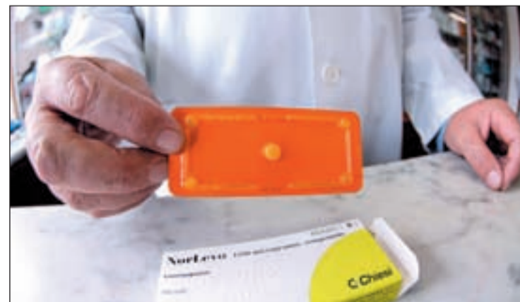
Un sanitario muestra la píldora postcoital, o 'del día después'

que los sanitarios vayan a objetar ante la píldora, mientras que organizaciones como El Foro de la Familia dice que esta medida es "vergonzosa y superficial" y Esperanza Aguirre considera que sólo debería permitirse "ese chute de hormonas" mediante receta médica.