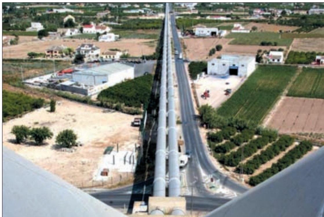
Imagen del trasvase Tajo-Segura a su paso por Toledo

EL TRASVASE TAJO-SEGURA, CLAVE EN EL ESTATUTO DE CASTILLA-LA MANCHA