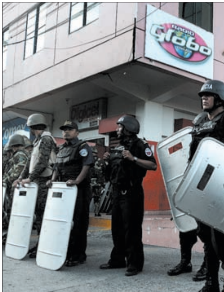
Policías custodiando la sede de Radio Globo, cerrada por el Gobierno