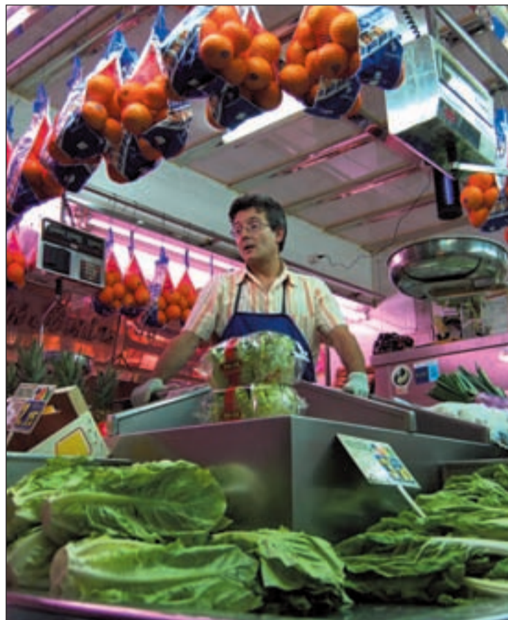
Comer frutas y hortalizas es prevenir enfermedades cardiovasculares

Entre estas frutas destacan, según han puesto de manifiesto los distintos expertos el aguacate: una fruta versátil que se puede usar tanto en platos dulces como en platos salados. Su alto contenido en vitamina E y ácido oleico es beneficioso para nuestro corazón. Pimientos, cítricos, kiwis: la vitamina C, con propiedades antioxidantes, hace a estas frutas y hortalizas especialmente indicadas para prevenir enfermedades cardiovasculares. Tomates, zanahorias, calabaza y, en general, todas las frutas y todas las hortalizas que contengan licopeno (la sustancia que da el color rojo a las frutas y las verduras) o betacarotenos (la sustancia que les aporta el color naranja), ya que ambos, además de aportar color a los productos, son altamente antioxidantes, ayudando a la buena salud de nuestro sistema circulatorio.