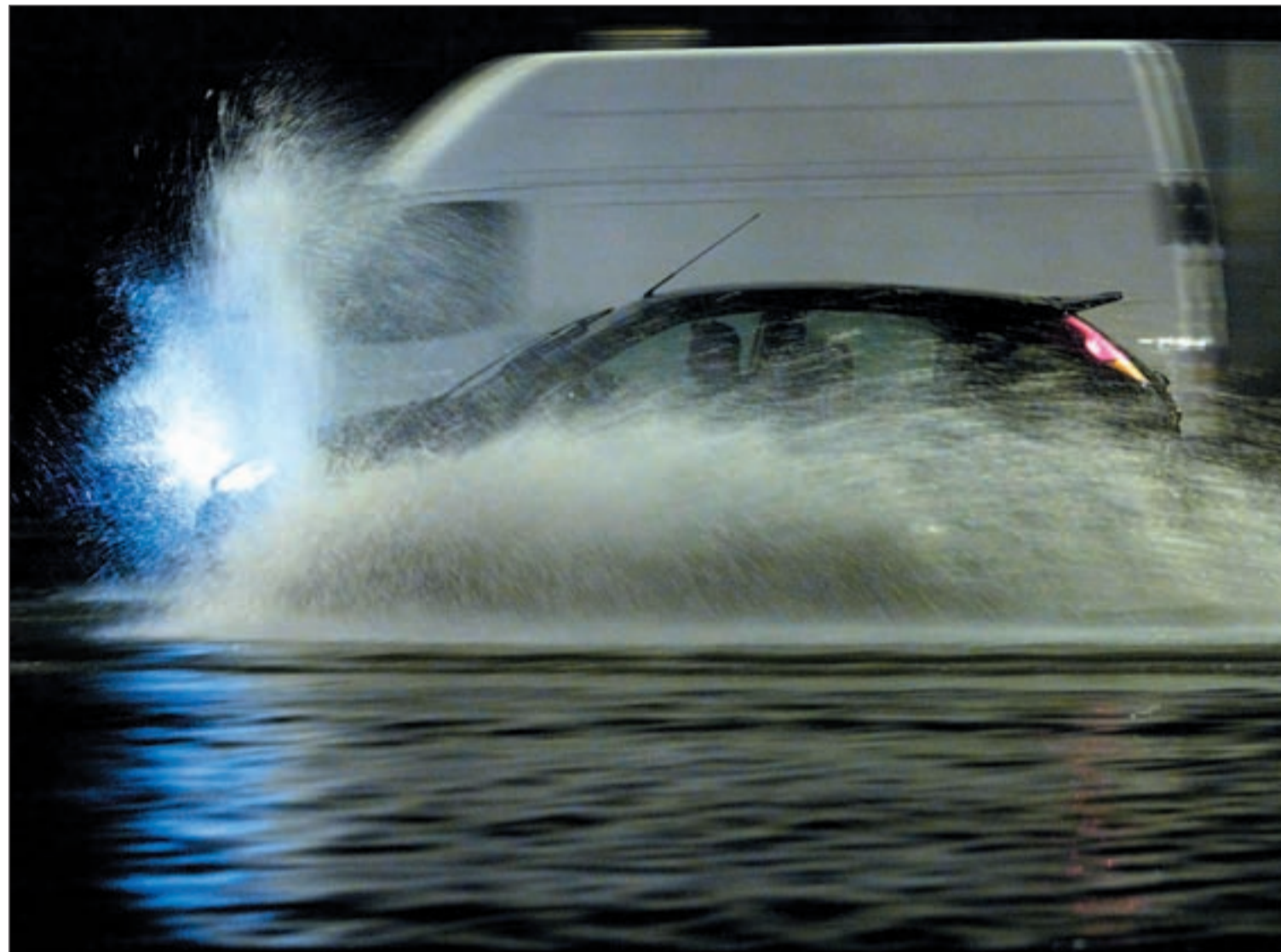
Un coche trata de avanzar en una calle de la capital valenciana completamente inundada

Los servicios de emergencia de la Comunitat realizaron cientos de salidas • Más de sesenta personas tuvieron que ser evacuadas • La zona costera sintió el terremoto de grado 3,2 registrado en el Golfo Pág. 4