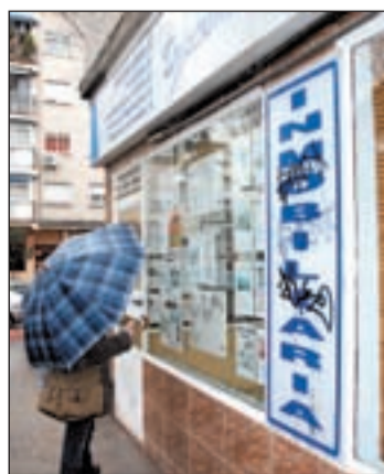
Dos años de suspensión

un plan de calendario de pago de deuda propuesto. Estos planes suponen pagar el 65 por ciento de las deudas en un plazo de ocho años. La propuesta ha sido aceptada por los acreedores en la Junta General, dos años después de haberse producido la suspensión de pagos.