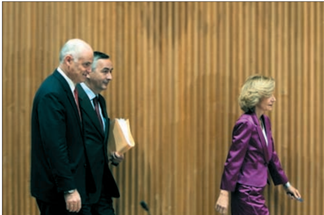
Elena Salgado, vicepresidenta segunda y ministra de Economía, dirigiéndose a la rueda de prensa

Los gastos financieros crecen y se elevan a 22.224 millones por las necesidades de la deuda, que supone el 6,6 por cien-