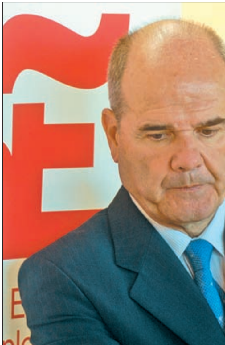
Chaves durante la inauguración de una de las obras del Plan E

Lo ha asegurado el vicepresidente tercero del Gobierno y ministro de Política Territorial, Manuel Chaves, quien señaló, el