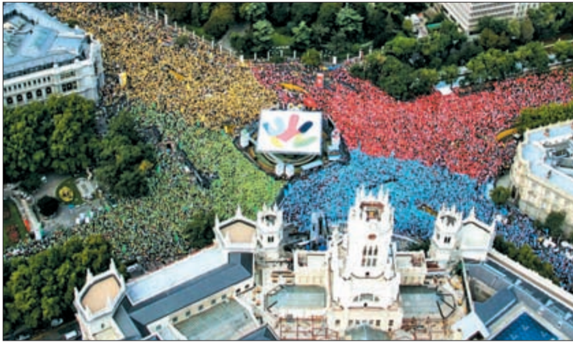
Miles de madrileños hicieron una mano gigante en la plaza de Cibeles

EL REY Y EL PRESIDENTE DEL GOBIERNO PRESIDEN LA DELEGACIÓN ESPAÑOLA