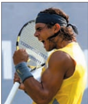
España busca su cuarta corona