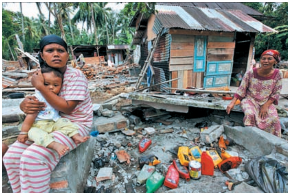
Supervivientes del terremoto junto a los escombros de su casa en Pariaman, al oeste de Sumatra

FUERTES LLUVIAS, UN TIFÓN Y UN TERREMOTO CAUSAN MÁS DE 1.500 MUERTES