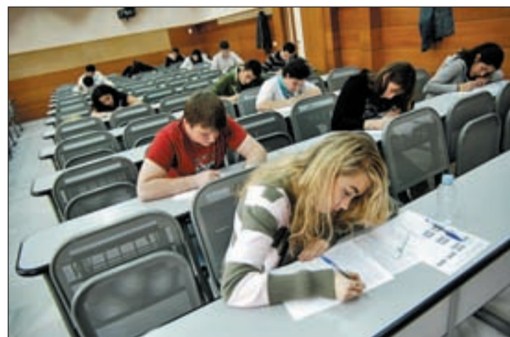
Estudiantes en el campus de la Autónoma de Madrid

Para añadir competitividad internacional al proyecto de CEI se ha propuesto la fusión de dos proyectos de dos universidades distintas, como ha sucedido con proyectos de la Universidad Politécnica de Catalu-