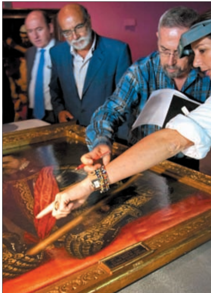
Preparación de 'Gran Duque de Alba', de Tiziano, para su montaje

Bueno acudió este martes a la supervisión del comienzo de las obras de desembalaje y montaje de los cuadros de la exposición, donde informó de que durante el desarrollo de los mismos "se ha colgado un cua-