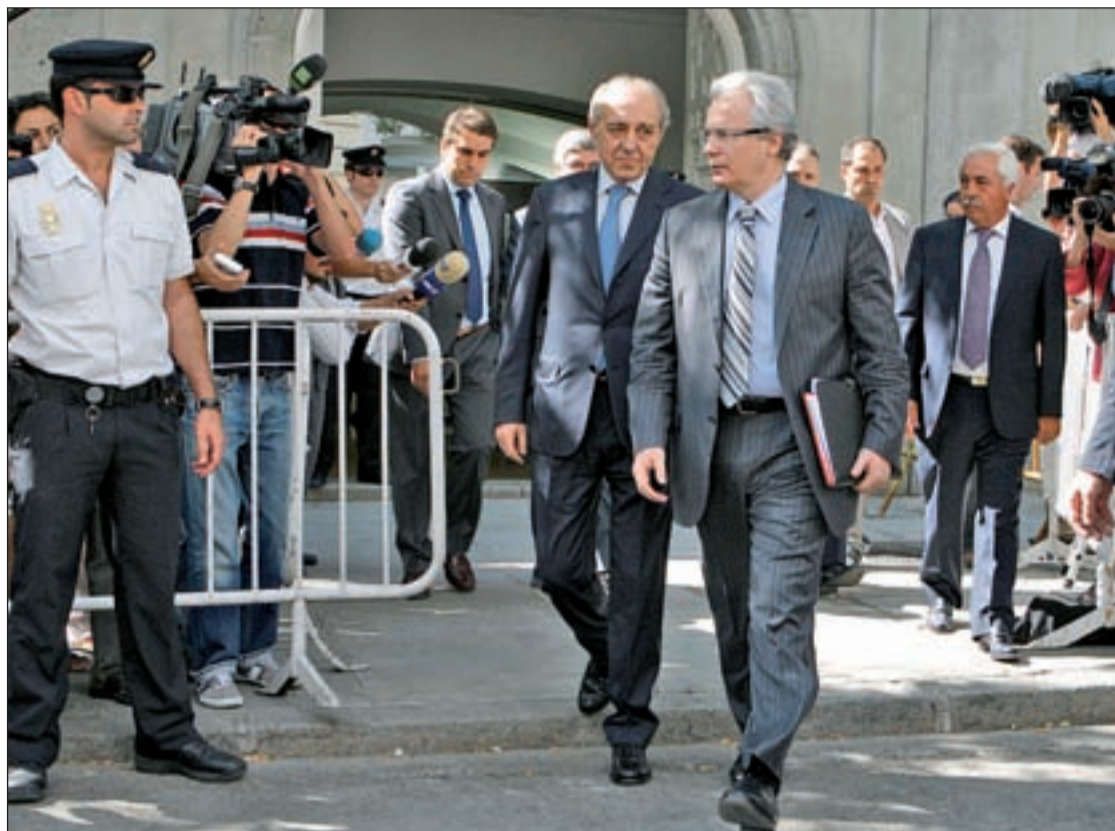
Baltasar Garzón y Gonzalo Martínez-Fresneda, su abogado defensor, dirigiéndose al Tribunal Supremo

Pero el que considerarían su definitivo error será procesar al franquismo y poner en evidencia carencias en la Ley de Memoria Histórica, que le resta los apoyos del Ejecutivo y Judicatura, le enfrenta a la Fiscalía y hace que la ultraderecha española inicie su campaña contra la Ley de Memoria Histórica. Además, instruir el Caso Gürtel acelerará las presiones de sañudas quejas