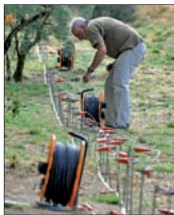
Búsqueda de los restos de Lorca

relleros y un maestro. En la alegación presentada a la apertura de la fosa ante la Consejería de Justicia de la Junta de Andalucía, los herederos expresan su deseo de que no se remuevan los restos de Lorca, si bien piden poder identificarlos si la exhumación se lleva a cabo.