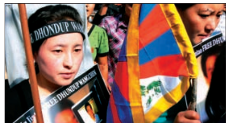
Protestas tibetanas contra la represión y por la independencia

recomiendan incluso que no hables de cosas así por teléfono porque lo controla el Estado”. La constante presencia policial en las calles de las principales ciudades es otra de las características de este régimen extraordinariamente autoritario que además censura todos los accesos a internet del país.