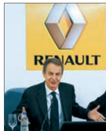
Zapatero en Renault