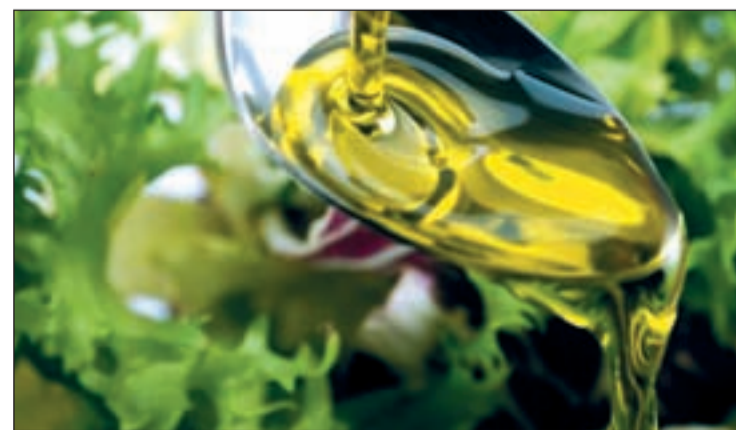
Consumir aceite de oliva ayuda a reducir el riesgo de depresión

teger de la depresión". Y podrán protegerse siguiendo una dieta rica en aceite de oliva, frutas, verduras, legumbres, cereales y pescado, pero baja en carnicos, y lácteos, con un consumo bajo/moderado de alcohol, entre medio vaso de vino o uno en las comidas.