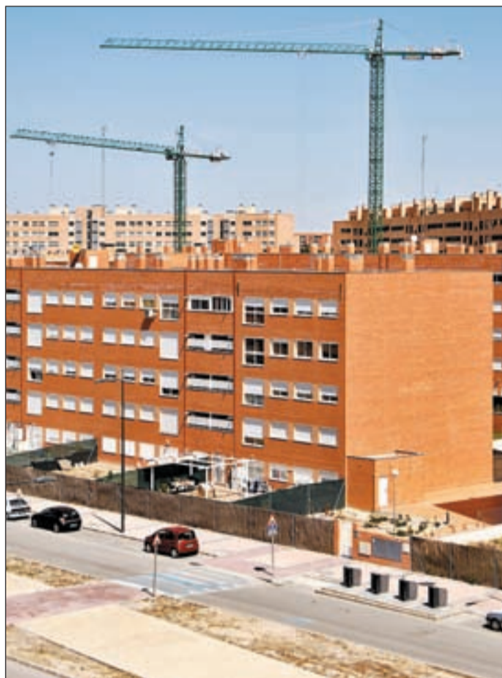
Las entidades financieras son las mejores inmobiliarias

El BBVA, Popular, Santander, Pastor, La Caixa, Caja Madrid y Caixa Cataluña son las entidades más agresivas en la venta de estos activos de su cartera, con descuentos de hasta el 50 por ciento. El Santander ha vendido 1.100 viviendas nuevas de 2.100 que ha puesto a la venta. Banesto tiene invertidos más de 4.100 millones. Las entidades ofrecen las viviendas a los morosos y cuando estos no aceptan extienden la oferta al público en general. En el caso de La Caixa, que contaba con 4.000 viviendas, ha logrado colocar 1.224. En el Salon Low Cost, de