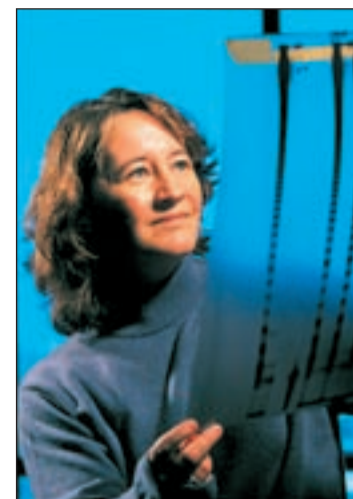
Carol Greider entre los premiados

Fundamentalmente sus estudios han descubierto como los telómeros son unas piezas clave del "rompecabezas" del enveje-