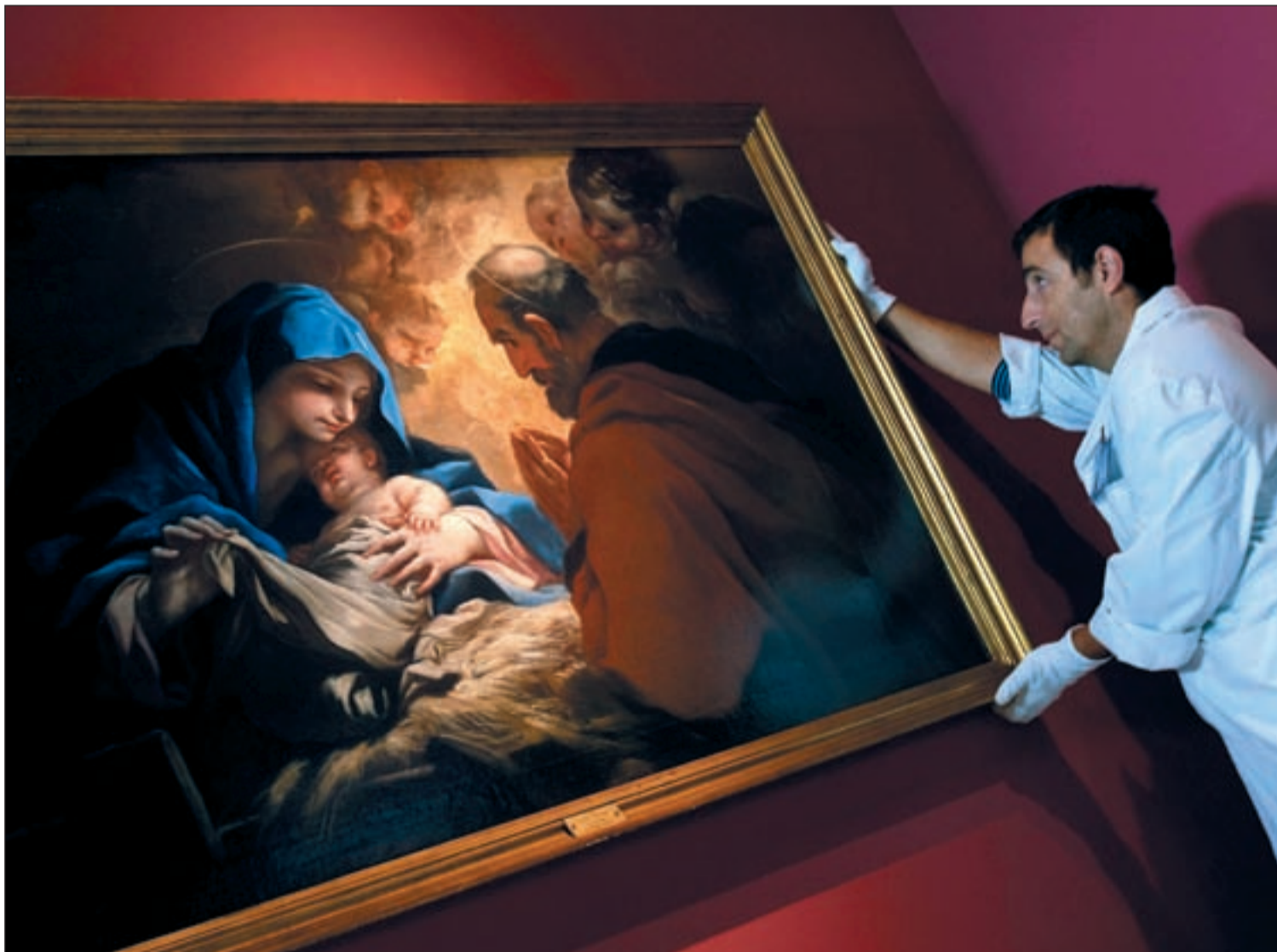
Un técnico del Museo monta 'La Natividad' de Luca Giordano en la exposición 'Colección Casa de Alba'

La exposición estará abierta al público en el museo de la ciudad hispalense desde el 12 de octubre hasta el 10 de enero • Pinturas de Zuloaga, Picasso, Tiziano o Sorolla, tapices y documentos