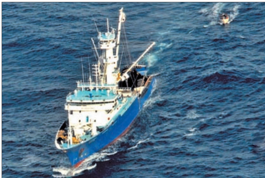
Foto del atunero vasco Alakrana; al fondo, el esquiife donde fueron detenidos dos de los secuestradores

ESTE AÑO HAY REGISTRADO 126 ATAQUES Y 44 SECUESTROS DE BUQUES