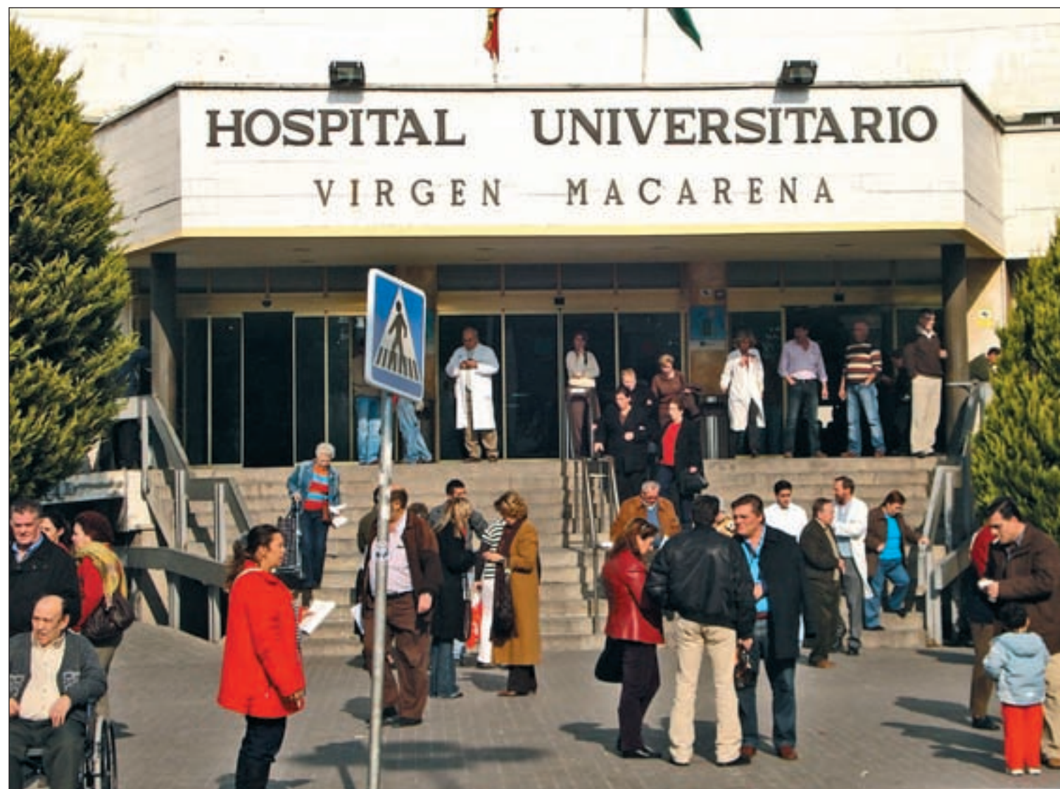
Trasiego de pacientes en la entrada del Hospital Universitario Virgen Macarena, donde se han producido los contagios

Hay ocho afectados en el Hospital Virgen Macarena • El Ayuntamiento ha revisado las torretas de refrigeración para evitar más contagios • Dos casos nuevos sin confirmar en el Virgen del Rocío Pág. 4