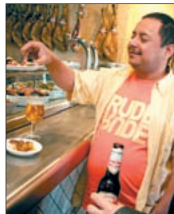
La cerveza es buena para la salud