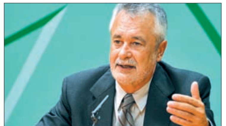
El presidente de la Junta de Andalucía, José Antonio Griñán

nómica, mientras asume el control de las cesiones de suelo municipal imponiendo su destino y limitando el patrimonio municipal de suelo." Por su parte, para IU el texto "supone un modelo cortísimo que no responde al objeto de considerar la vivienda como un derecho".