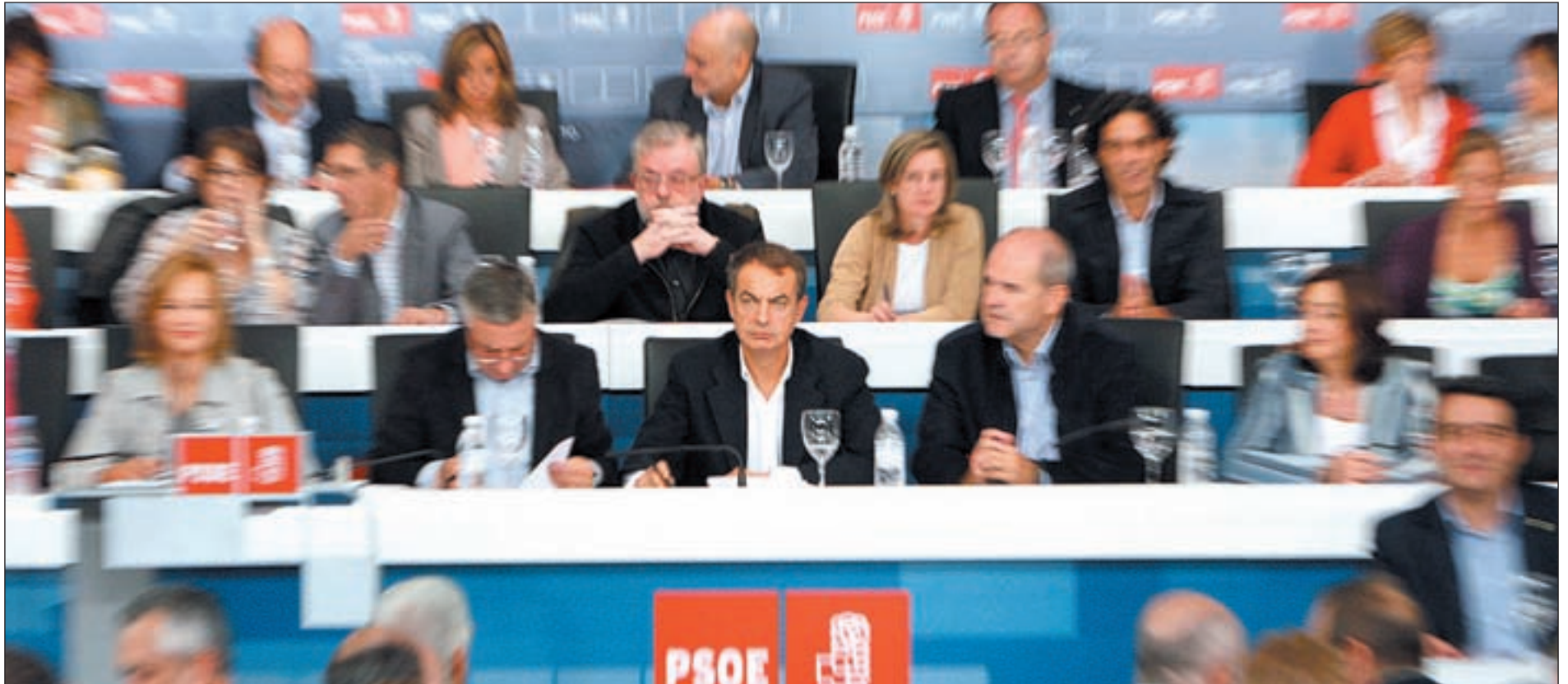
José Luis Rodríguez Zapatero, flanqueado por Manuel Chaves y José Blanco, en la última reunión de la Ejecutiva del Comité Federal del PSOE

"NUNCA EN LA HISTORIA RECIENTE HABÍAMOS ASISTIDO A UN LINCHAMIENTO TOTAL DEL PRESIDENTE"