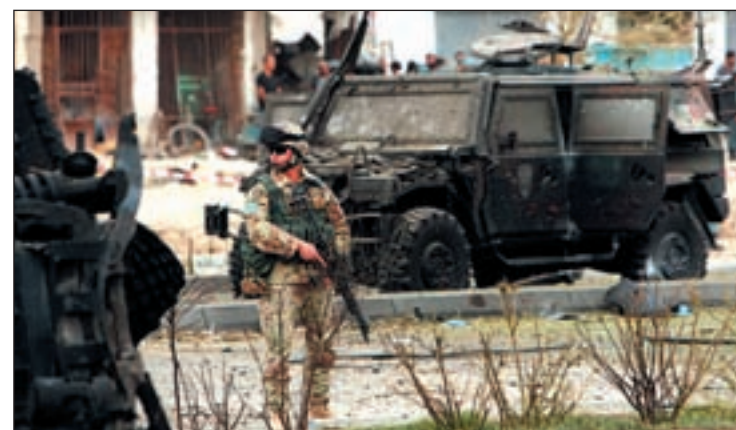
Un soldado italiano de la ISAF inspecciona un barrio de Kabul

ble contaminación de las pruebas. Sin embargo, el juez le concedió el arresto domiciliario al considerar que no existe riesgo de huida sino sólo de reincidencia. El empresario está en el centro de las investigaciones sobre la presunta explotación de la prostitución en las fiestas de Berlusconi y está acusado de tráfico de estupefacientes.