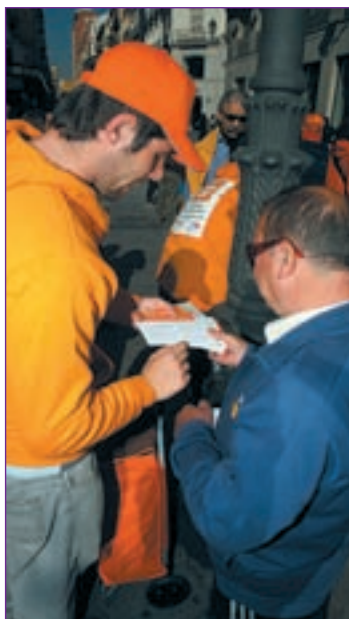
PROMOCIONES Captar a socios de ONG en la calle o quienes informan sobre campañas institucionales también permite sobrevivir

Quien dijo que la picaresca española ya no existe se equivocaba. El ingenio se dispara cuando de buscarse la vida se trata en nuestro país. Más aún si estamos en medio de una crisis económica y echar curriculum parece no reportar los éxitos deseados. Nada de trabajo de ocho a tres. Nada de nómina fija a final de cada mes. Hay mil y una formas de trabajar y mil y una maneras de ganarse un salario. Donar semen u óvulos. Acudir como público a un programa de televisión. Aparecer como extra en una serie o película. Ser azafata de congresos. Comercial en ferias. Ser testador de productos. Realizar encuestas de opinión. Incluso convertirse en 'conejillo de indias' para el ensayo clínico de medicamentos son sólo algunas