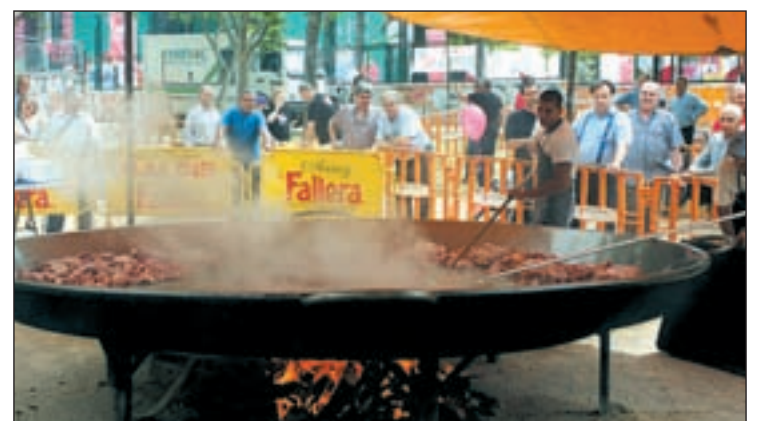
Paellada popular en la madrileña ciudad de Rivas

acerca de presentaciones, inauguraciones de infraestructuras y hasta ruedas de prensa y acude, espontánea y gratuitamente, como público. La recompensa, además de ser partícipe del acto, disfrutar del cóctel y canapés que suelen acompañar a este tipo de eventos. Una afición para gente con tiempo libre.