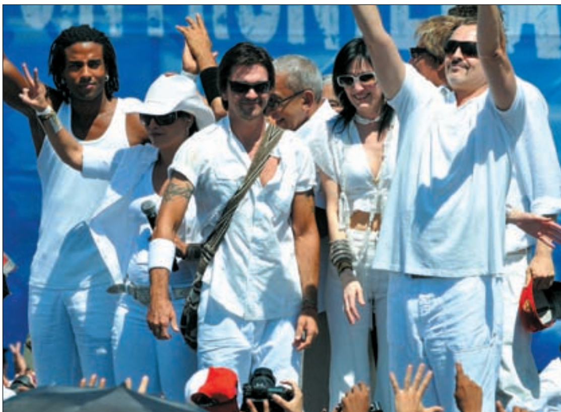
Los músicos Yotuel Romero, Olga Tañón, Juanes y Miguel Bosé saludan al público asistente al macroconcierto

Juanes y amigos demostraron en La Habana que la música no entiende de política • Más de un millón de cubanos fueron testigos de la revelación