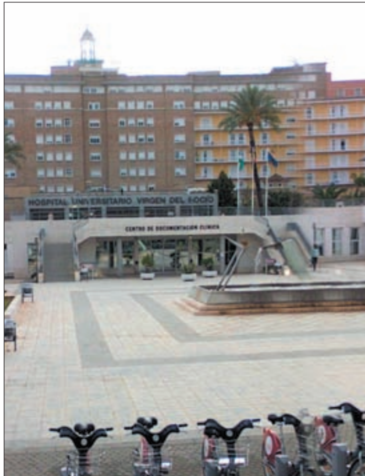
Hay dos nuevos enfermos ingresados en el hospital Virgen del Rocío