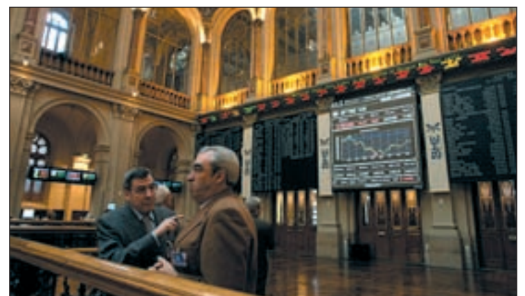
La Bolsa parece que empieza a notar una mejoría económica

primeras sesiones los Bancos también fueron animadores con subidas entre uno y dos puntos, Popular, BBV y Santander. Los expertos opinan que a ello ayuda el que no se contemplen cambios a corto plazo en la política monetaria de los doce en al menos en un año.