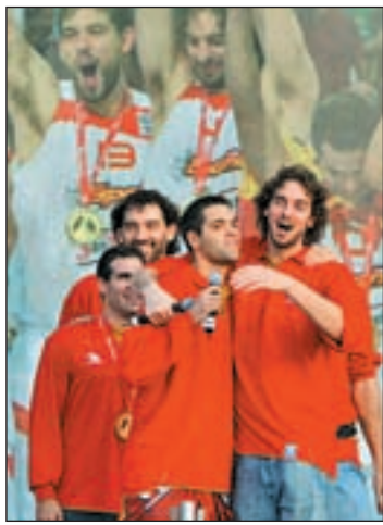
La 'Roja', en Cibeles