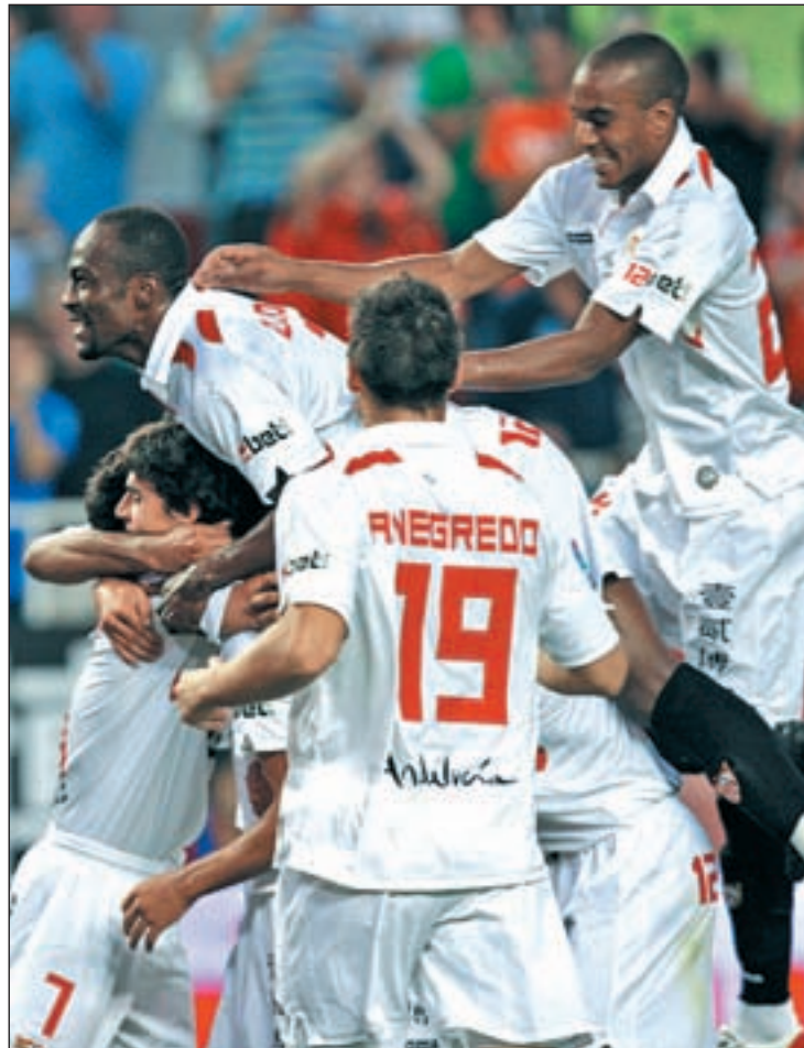
Los jugadores del Sevilla celebrando un gol esta temporada

Los dos equipos sevillanos juegan algunos de los partidos más importantes del fin de semana en sus respectivas categorías. El Sevilla se enfrentará al equipo de un entrenador muy querido por la afición de Nervión, Joaquín Caparrós, que dirigió a los hispalenses durante cinco temporadas. Pero habrá poco margen para el sentimentalismo. Los dos equipos han iniciado la temporada de manera fulgurante y se juegan este sábado permanecer en los puestos punteros de la tabla. Manolo Jiménez ya pudo contar con Konko y Luis Fabiano en el partido del martes ante el Mallorca y volverán a ser de la partida para el encuentro de San Mamés. Precisamente el último choque liguero dejó cierto enfado en el cuerpo técnico hispalense y Jiménez se quejó de la excesiva relajación de sus