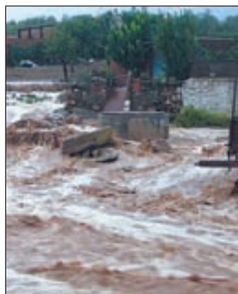
Tromba de agua en El Torrico

trasladaron a la localidad para limpiar y adecentar la zona afectada. Con motivo de una rueda de prensa, el presidente de la Diputación Provincial lamentó también el fallecimiento de un hombre al ahogarse cuando pretendía cruzar un puente del municipio.