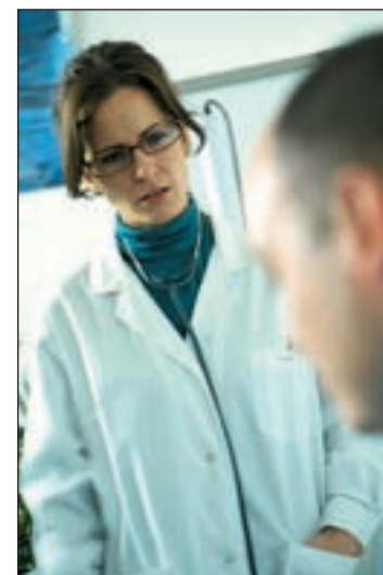
Médico y paciente en la consulta

El alzheimer, que figura entre las diez principales causas de muerte en nuestro país, afecta actualmente a más de tres millones y medio de personas, incluidas las personas diagnosticadas y sus cuida-