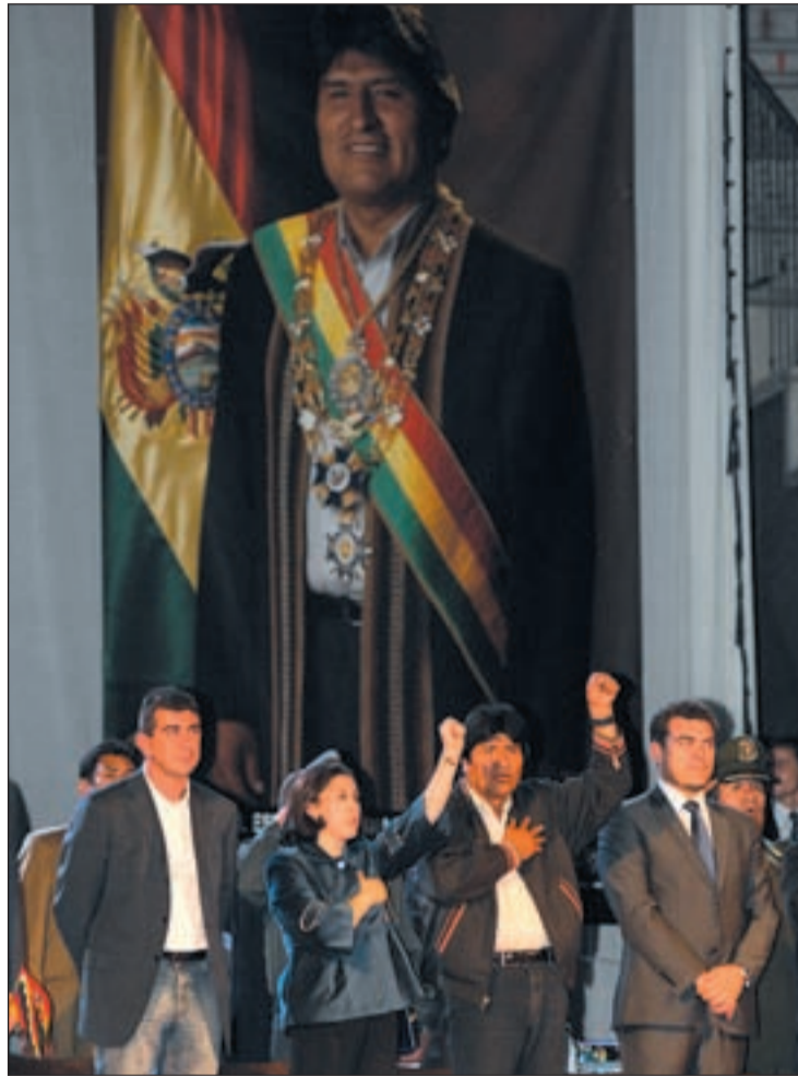
Evo Morales en la cubierta de Leganés, Madrid

Llegó tres horas después de lo anunciado, pero el público que le esperaba era fiel y aguantó el tirón agitando banderas y mirando al ruedo, donde una docena de grupos puso un granito de costumbres. Miles de bolivianos de Barcelona, Navarra, Valencia, Euskadi, Almería, Murcia o Madrid recibieron a Evo Morales en La Cubierta de Leganés, Madrid, el pasado domingo. El presidente de Bolivia traía algunas palabras de reproche. Reproches a la “mentalidad colonial”, al “saqueo” de recursos naturales, al “modelo neoliberal”. Uno de ellos iba directamente a la diana del Gobierno español y su Ley de Extranjería. “Quiero decirles especialmente a los europeos que cuando ellos llegaban a Bolivia nuestros abuelos nunca dijeron que fueran ilegales”, aseguró. Entre los asuntos pendientes había una propuesta que espera convertir en acuerdo: que los bolivianos residentes en España puedan votar en las elecciones municipales. Además, expresó su deseo de abrir más consulados en España y hacer válidas las licencias de conducir.