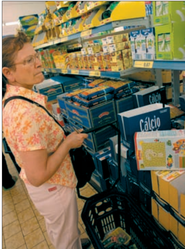
La subida repercutiría en los precios al consumidor

La subida de los impuestos tiene como objetivo "mantener y, si es posible, mejorar" las políticas sociales como las inversiones en Educación, Salud y Obras Públicas, según Manuel Chaves, vicepresidente tercero y ministro de Cooperación Territorial. Idea que comparte y defiende Elena Salgado, vicepresidenta segunda y ministra de Economía. Salgado afirmó la semana pasada, al término del Consejo de Ministros, que la subida de los impuestos indirectos "es lo que menos distorsiona la actividad económica". Sin embargo, tanto la oposición co-