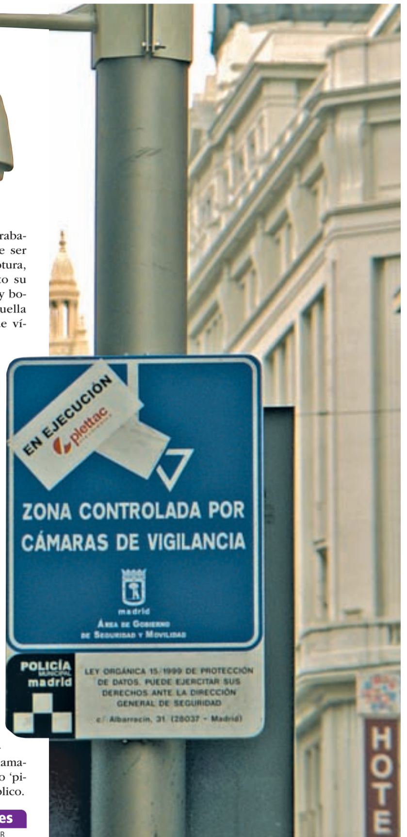
Cartel que avisa de la grabación de imágenes

✚ CONSULTA ESTA SEMANA EN LA WEB LOS COMENTARIOS SOBRE ESTE TEMA