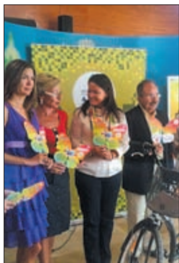
Presentación de la Semana

El año pasado, Murcia logró ser la primera ciudad española y la cuarta de toda Europa en el premio Semana Europea de la Movilidad 2008, que reconoce la labor en la puesta en marcha de medidas permanentes para conseguir un transporte urbano más sostenible.