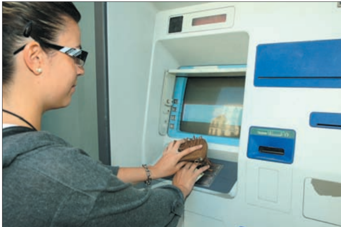
La crisis económica ha hecho que aumenten los robos en los cajeros

España cuenta con 62.121 cajeros y 1,5 millones de terminales punto de venta y hasta 75,12 millones de tarjetas en circulación, de las que 44 millones eran de crédito (-1,83%) y 31,13 millones de débito (-1,39). Una disminución que el sector achaca no sólo a la incertidumbre económica sino a la continua alza de las comisiones que la banca cobra a los clientes por su