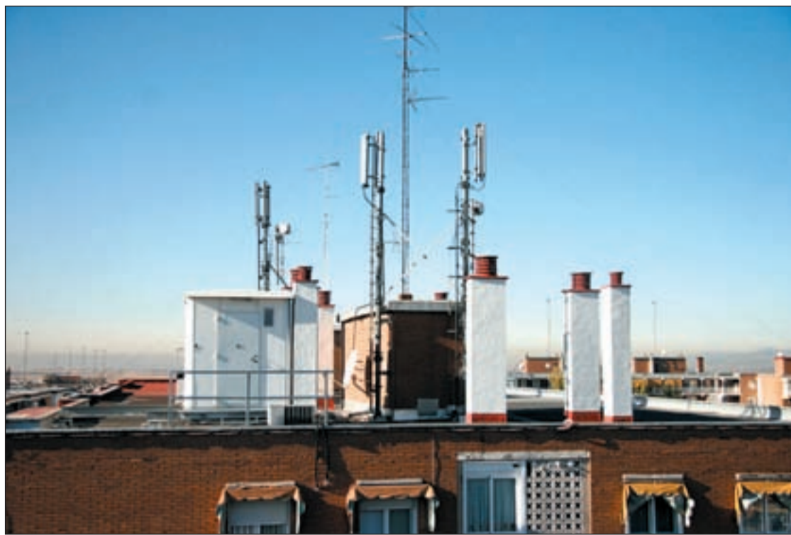
Las antenas de telefonía ya forman parte del paisaje urbano de la ciudad

EL CONSISTORIO INVERTIRÁ 21.000 EUROS EN EL PROYECTO