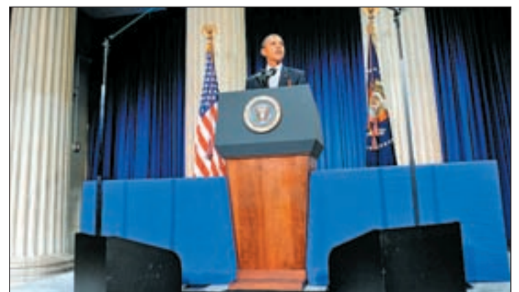
Barack Obama durante su discurso el pasado lunes en Nueva York

tadounidenses apoyan la ‘opción pública’, un seguro médico pagado por el Estado, del paquete de reforma sanitaria planteado por el presidente, Barack Obama, según un estudio publicado por el diario ‘The Washington Post’ y la televisión norteamericana ABC.