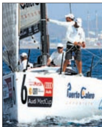
El barco 'Islas Canarias'

de cerrar el Circuito Audi MedCup 2009. El 'Bribón' fue el barco dominador en la regata de entrenamiento en la clase TP52, preámbulo del Trofeo Caja Mediterráneo Región de Murcia, correspondiente a la última prueba del Circuito Audi MedCup.