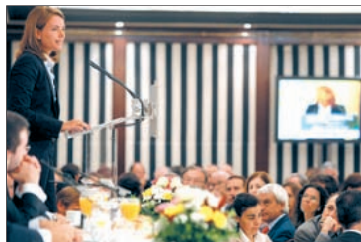
Arantza Quiroga, presidenta el parlamento vasco, durante su discurso

Arantza Quiroga indicó que, para ello, es importante el acuerdo entre todos, y que todas las instituciones vascas asuman una “significativa cuota de responsabilidad”. En el ámbito