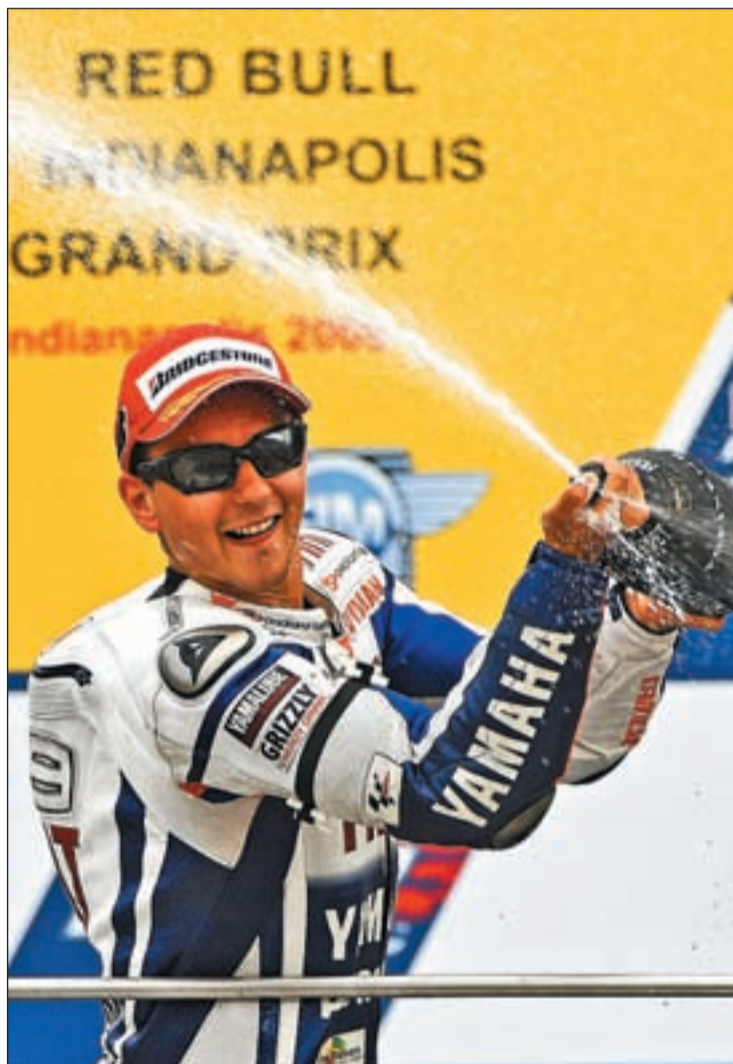
El piloto español celebra su victoria en Indianápolis

A la igualdad reinante en la clasificación general, hay que sumarle la proximidad del parón de varias semanas en la competición. La de San Marino será la única carrera este mes de septiembre del Mundial, que retomará su actividad el cuatro de octubre en Estoril. Por tanto, la próxima prueba puede ser un