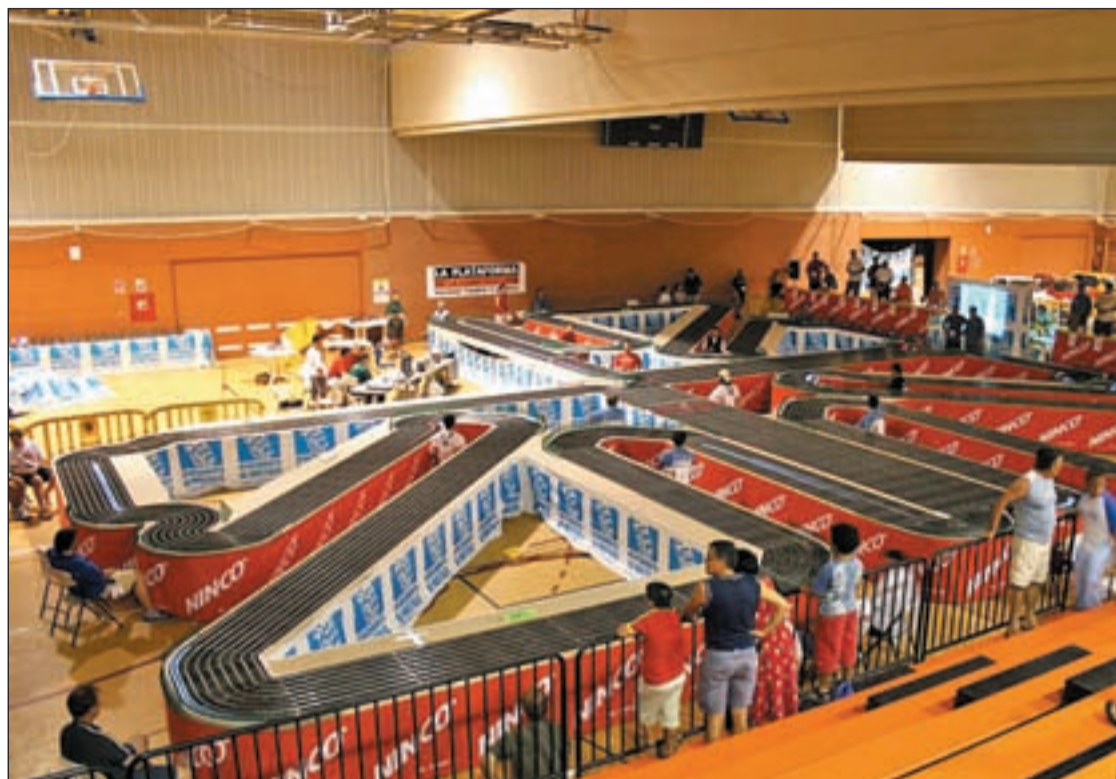
El Polideportivo Los Rosales fue el escenario de las 24 horas de Le Mans, versión Scalextric

cías de la ciudad en los Juegos Mundiales, celebrados en Vancouver (Canadá), durante la primera semana de agosto. Entre los metales cabe destacar, por ejemplo, el Oro por equipos, junto al Ayuntamiento de Madrid, y la Plata en equipo mixto en pruebas de fuerza. También consiguieron Oro, en categoría individual -con nuevo record del mundo incluido- en la 'Grouse Mountain', donde se celebró la prueba de ascenso de 900 metros. Los policías también lograron un oro en atletismo en los cuatrocientos metros valla, una prueba con un nivel altísimo puesto que los competidores de India y Sudáfrica son atletas profesionales. Las cuartas posiciones de los