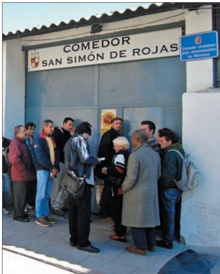
Parados esperan a la puerta del actual comedor social

La inauguración de este restaurante ciudadano permitirá ofrecer comidas elaboradas en el propio establecimiento por un cocinero profesional, contra-