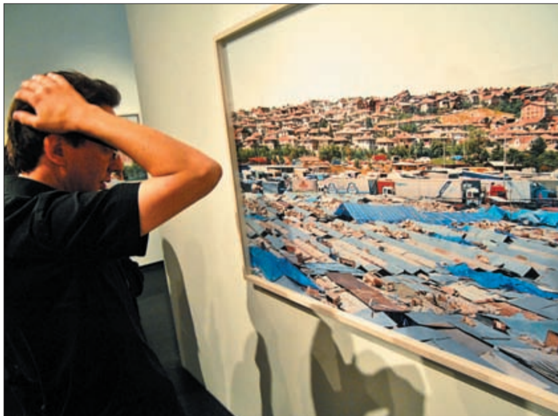
El director del centro observa una obra de 'Periferias', que continúa en el museo

La consejería de Cultura presenta el programa de su 'buque insignia' Pág. 3