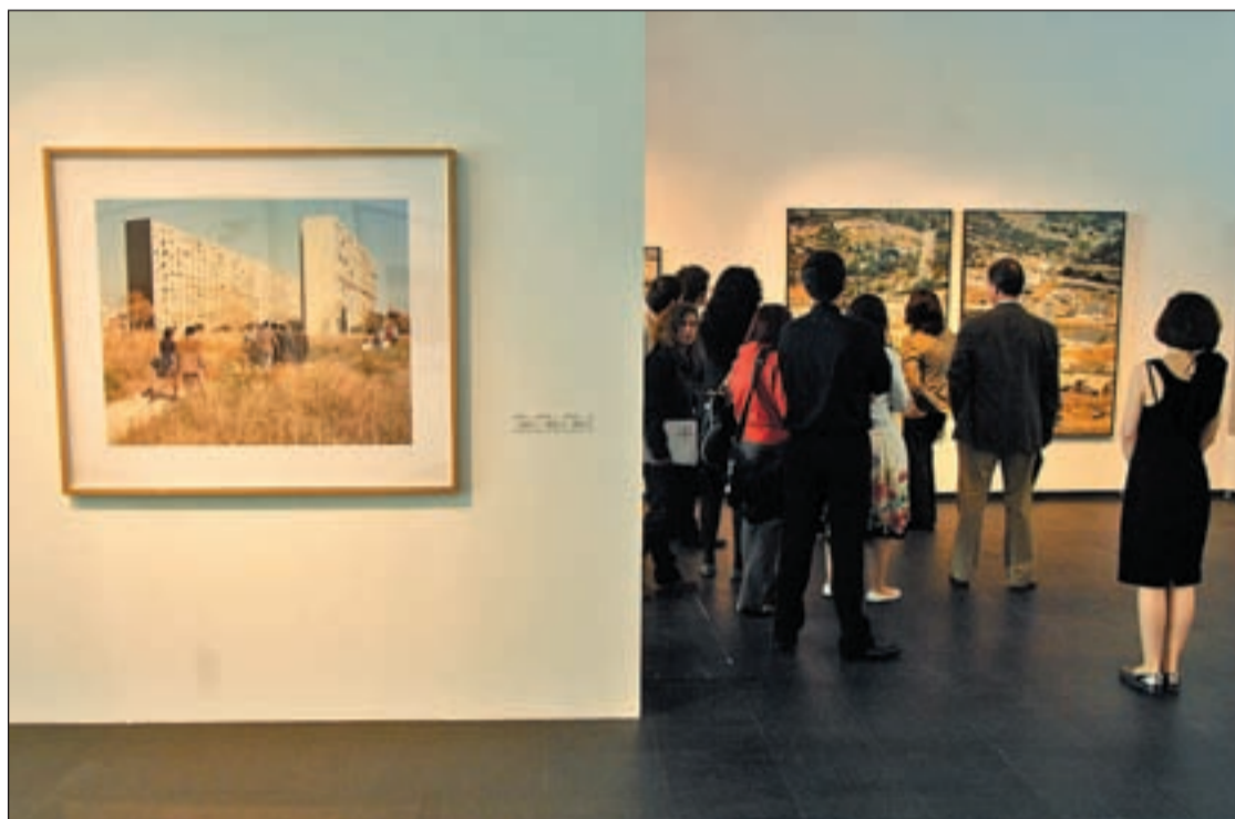
'Periferias' se queda en Móstoles hasta el próximo día 27