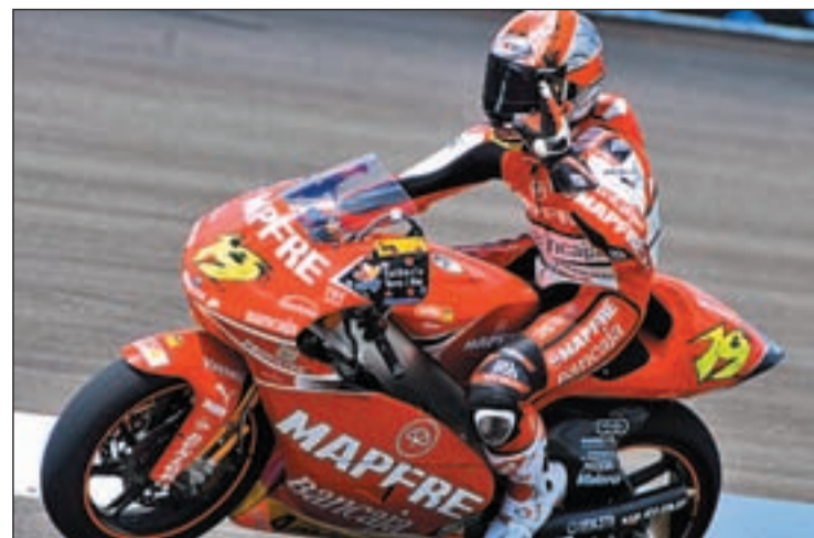
Bautista sólo pudo ser tercero en la última prueba del Mundial

canzar la tercera posición en la clasificación general, que en estos momentos ocupa el australiano Stoner, a pesar de que ha estado fuera de todo circuito en las últimas semanas. La emoción sigue estando presente.