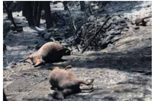
Cabras muertas en Mombeltrán por el incendio del Valle del Tiétar.

También, se solicitará la declaración de zona catastrófica para Navalunga, donde una fuerte tormenta ha generado importantes daños en la cuenca del río.