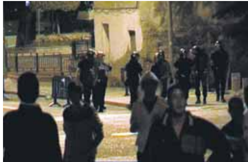
Imágenes del incidente de las Fiestas de Pozuelo de Alarcón.