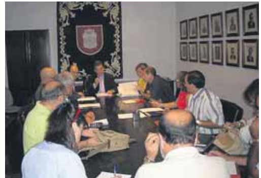
Reunión del Comité de Seguridad y Salud municipal.

vías de comunicación y puesta en conocimiento en caso de enfermedad o posible contagio, la vigilancia de la salud del personal municipal, con primordial atención a las embarazadas y otros trabajadores especialmente sensibles al respecto y vacunación a los sectores de riesgo que se determinen.