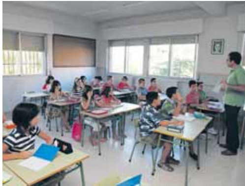
Inicio del curso escolar en el Colegio Diocesano.

El mayor incremento en el número de alumnos lo registra infantil, con 223 más, hasta alcanzar los 5.014 niños.