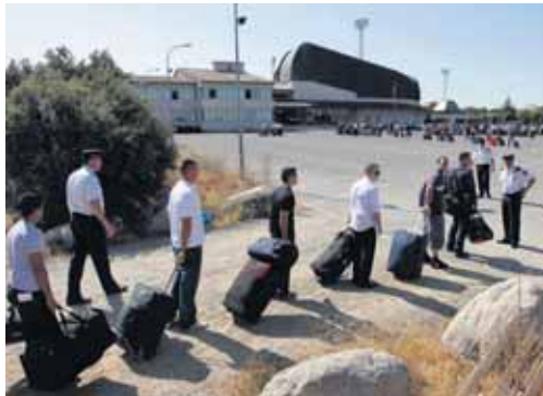
Incorporación de los alumnos de la promoción XXV-A de la Escala Básica.