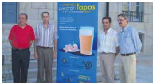
Presentación de la I edición de Piedrahitapas.

Los organizadores han establecido dos premios. Uno denominado 'La tapa más maja', que otorgará un jurado profesional, y el premio 'Tapa Valle del Corneja', que recibirá la tapa más votada por los clientes.