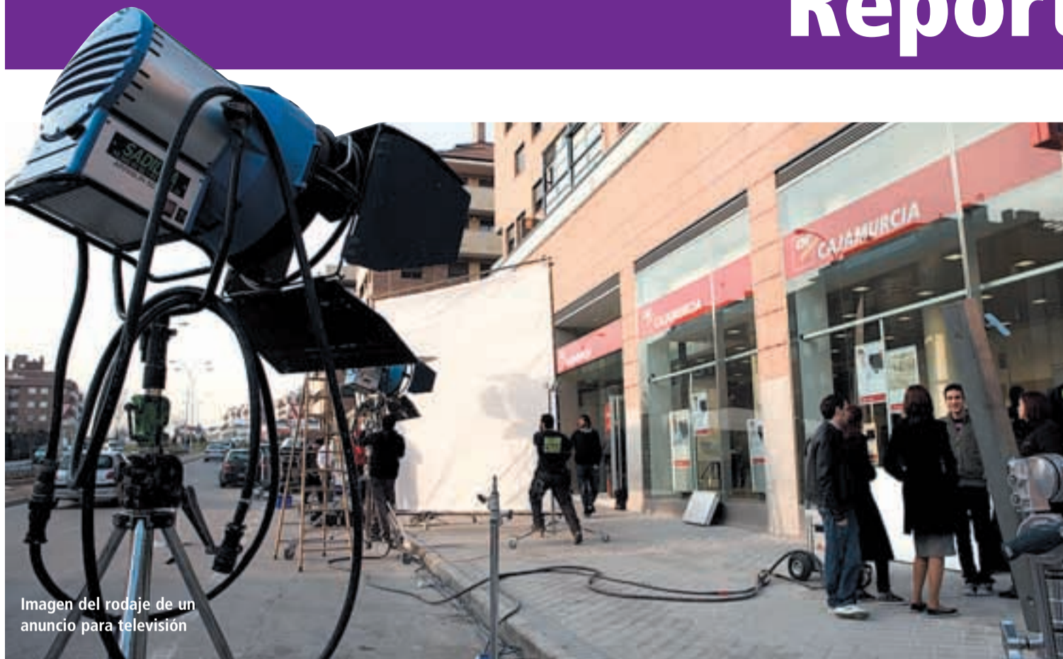
Imagen del rodaje de un anuncio para televisión