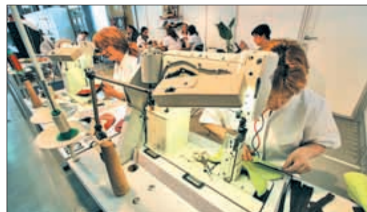
Un grupo de operarias desempeñando su labor en una factoría textil

inferior al de los hombres, ya que mientras las primeras se embolsan 16.943 euros al año, los segundos ganan 22.780. En casi todas las comunidades, el salario medio de las mujeres es entre veinte y treinta por ciento menos de la ganancia media de los hombres trabajadores.