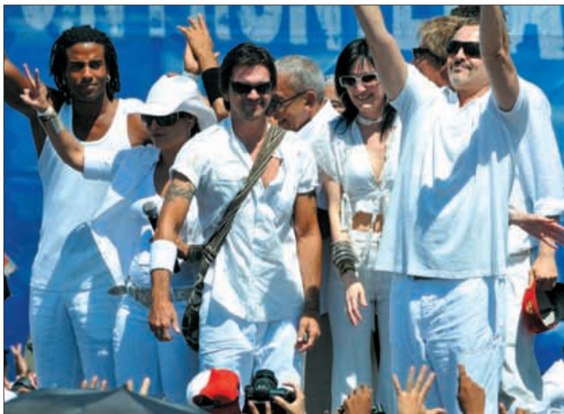
Los músicos Yotuel Romero, Olga Tañón, Juanes y Miguel Bosé saludan al público asistente al macroconcierto

Juanes y amigos demostraron en La Habana que la música no entiende de política • Más de un millón de cubanos fueron testigos de la revelación