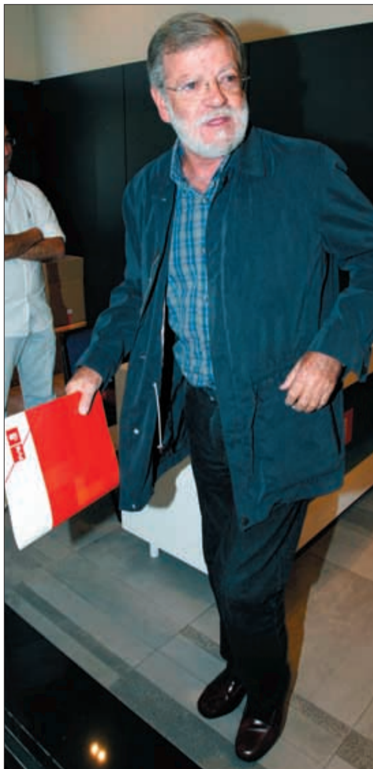
Rodríguez Ibarra quiere una sanidad española para evitar fraudes

Añadió que además hay convenios con otros países, que permiten repercutir el coste de la intervenciones hechas aquí a ciudadanos de otras nacionalidades. La ministra, Trinidad Jiménez, hizo estas declaraciones tras su encuentro con el consejero de Sanidad de Vitoria Rafael Bengoa, para coordinar actuaciones de futuro frente a la gripe A.