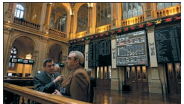
La Bolsa parece que empieza a notar una mejoría económica

primeras sesiones los Bancos también fueron animadores con subidas entre uno y dos puntos, Popular, BBV y Santander. Los expertos opinan que a ello ayuda el que no se contemplen cambios a corto plazo en la política monetaria de los doce en al menos en un año.