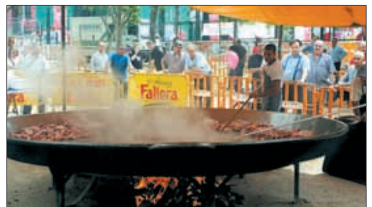
Paellada popular en la madrileña ciudad de Rivas

acerca de presentaciones, inauguraciones de infraestructuras y hasta ruedas de prensa y acude, espontánea y gratuitamente, como público. La recompensa, además de ser partícipe del acto, disfrutar del cóctel y canapés que suelen acompañar a este tipo de eventos. Una afición para gente con tiempo libre.