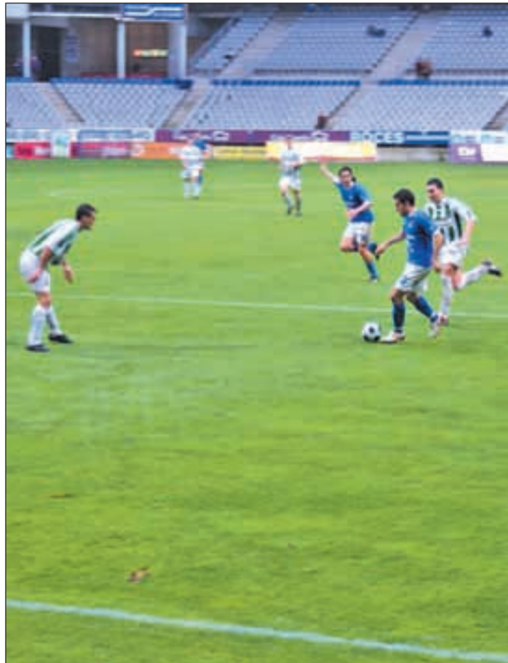
Jugadores del Avilés Industrial

Prudencia y más prudencia parece intuirse en las palabras del entrenador del Real Avilés Industrial, ya que su filosofía en animarle a no emocionarse con el éxito e ir disputando encuentro tras encuentro con las miras bien puestas en ganar la mejor posición posible dentro de esta Liga en la que participa. Una postura que quizá contras-