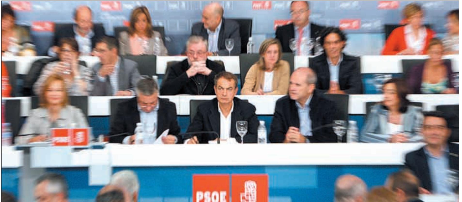
José Luis Rodríguez Zapatero, flanqueado por Manuel Chaves y José Blanco, en la última reunión de la Ejecutiva del Comité Federal del PSOE

"NUNCA EN LA HISTORIA RECIENTE HABÍAMOS ASISTIDO A UN LINCHAMIENTO TOTAL DEL PRESIDENTE"