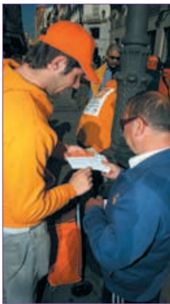
PROMOCIONES Captar a socios de ONG en la calle o quienes informan sobre campañas institucionales también permite sobrevivir

Quien dijo que la picaresca española ya no existe se equivocaba. El ingenio se dispara cuando de buscarse la vida se trata en nuestro país. Más aún si estamos en medio de una crisis económica y echar curriculum parece no reportar los éxitos deseados. Nada de trabajo de ocho a tres. Nada de nómina fija a final de cada mes. Hay mil y una formas de trabajar y mil y una maneras de ganarse un salario. Donar semen u óvulos. Acudir como público a un programa de televisión. Aparecer como extra en una serie o película. Ser azafata de congresos. Comercial en ferias. Ser testador de productos. Realizar encuestas de opinión. Incluso convertirse en 'conejillo de indias' para el ensayo clínico de medicamentos son sólo algunas