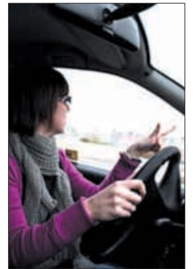
Una conductora al volante

Frente a ese número de condenas, según la Secretaría General de Instituciones Penitenciarias, en enero de 2009 había un total de 11.404 plazas ofertadas para realizar trabajos en beneficio