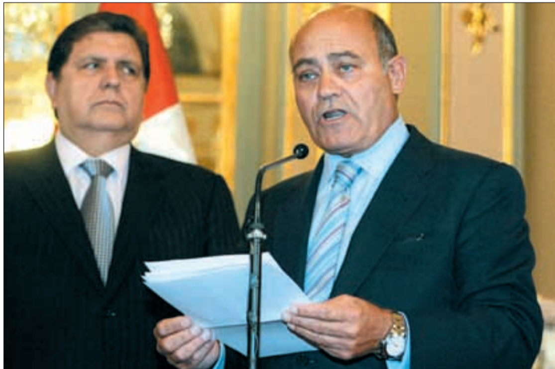
Díaz Ferrán, convencido de que si los Presupuestos fueran más austeros no habría que subir los impuestos

El presidente se muestra muy crítico con la subida de impuestos. En su opinión "aumentar la presión fiscal", especialmente en lo que se refiere al IVA, tendrá un efecto "preocupante", sobre el consumo y la competitividad. Díaz Ferrán ha reclamado reformas estructurales y políticas activas en pro del empleo y pide que al igual que los empresarios y trabajadores se están "apretando el cinturón" el Gobierno haga lo mismo, algo que, en su opinión, no ocurre.