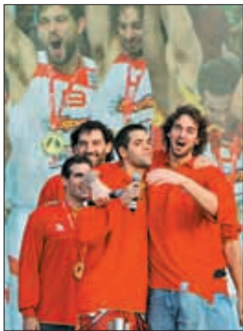
La 'Roja' en La Cibeles