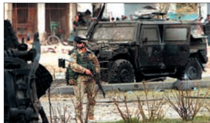
Un soldado italiano de la ISAF inspecciona un barrio de Kabul

bert Gates, quien a su vez lo remitió al presidente Barack Obama. A pesar de la gravedad de la situación, McChrystal concluye que "aunque la situación es seria, todavía se puede alcanzar el éxito", para lo que necesitan más soldados y una estrategia contrainsurgente.