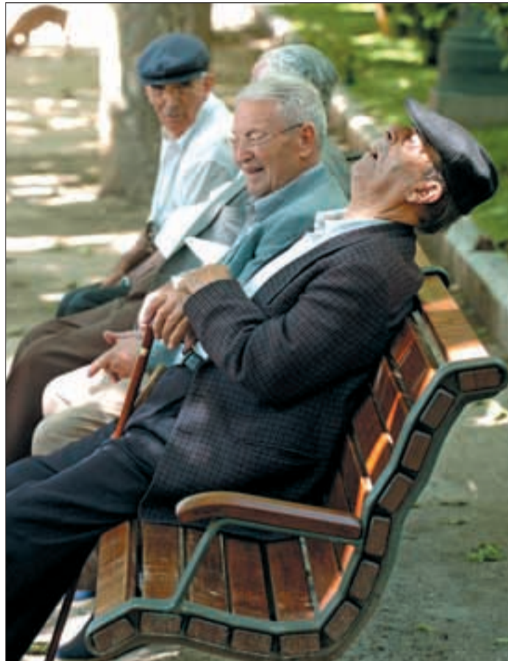
Los pensionistas todavía desconocen el incremento de sus pagas

Por comunidades autónomas, Cataluña y Madrid, por este orden, concentraron cuatro de cada diez extranjeros afiliados a la Seguridad Social en Agosto, al sumar entre ambas el 44,09 por ciento del total de inmigrantes ocupados. La menor cantidad de inmigrantes en alta en la Seguridad Social al finalizar el mes de agosto correspon-