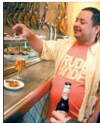
La cerveza es buena para la salud