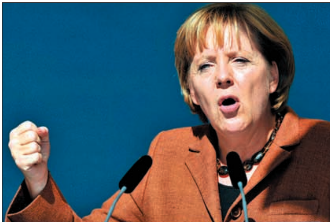
Angela Merkel durante un discurso en plena campaña política en la localidad germana de Brunswick

ELECCIONES ALEMANAS EL DOMINGO 27 DE SEPTIEMBRE