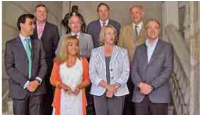
Los presidentes de las diputaciones de Castilla y León posaron en la escalinata del Palacio de los Guzmanes.

Por otra parte, también mostraron su preocupación por temas como la financiación local o las competencias impropias.