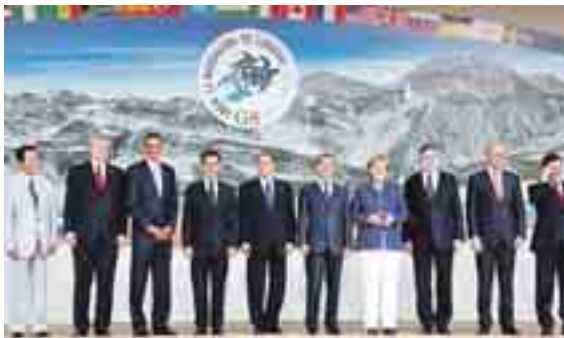
Encuentro de líderes mundiales en la cumbre del G-8.

España entra en la cumbre de los grandes, pero como invitada. Y participa en los encuentros, aunque no en todos. Por primera vez, España acude como país, y con el único antecedente de las asistencias del ex presidente José María Aznar, que fue invitado cuando España ostentaba la presidencia de la Unión Europea. El presidente del Gobierno, José Luis Rodríguez Zapatero, llevaba esta semana al encuentro de los ocho países más industrializados del mundo dos ideas, como anunció antes de desplazarse hasta L'Aquila, en Italia. Instar a la cooperación y apostar por las energías renovables. El presidente tenía va-