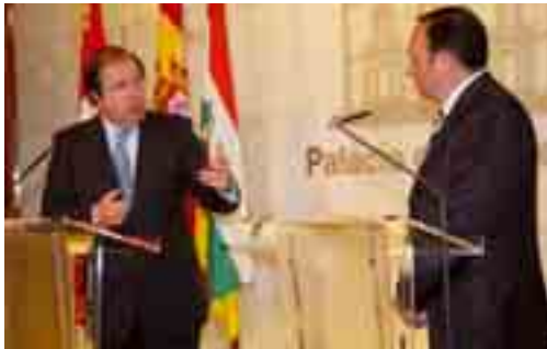
Juan Vicente Herrera y Pedro Sanz durante la rueda de prensa conjunta.

El lunes fue el turno para Galicia. Alberto Núñez Feijóo visitó Valladolid para reclamar un modelo de financiación "sin privilegios" y "basado en el coste real de los servicios y no en el censo de población". Herrera y Feijóo fijaron 18