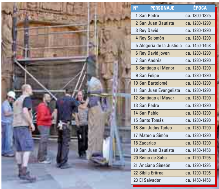
Las 23 imágenes del Pórtico Occidental están siendo desmontadas para su restauración y nueva exhibición turística.

Para efectuar el desmontaje y traslado de las esculturas con las máximas garantías de seguridad, la Junta ha llevado a cabo previamente diversos estudios y trabajos de restauración como la limpieza superficial y de depósitos, la sujeción de zonas sueltas y con riesgo de pérdida, la preconsolidación y sentado de levantamientos del soporte pétreo, el microsellado de grietas y fisuras y la fijación de monocromías y policromías. Estos estudios previos han constatado la presencia de una policromía original y dos repolicromados, a los que se superponen dos estratos monocromos que imitan el color de la piedra. Dentro de las actuaciones del proyecto de intervención planificado para proteger las esculturas, destaca el estudio climático comparado que se está lle-