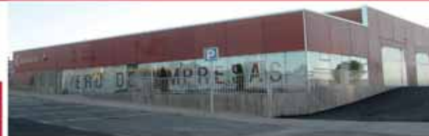
VIVERO INDUSTRIAL DE EMPRESAS DE ÁVILA, Calle Río Con, Parcela E1, Polígono Industrial Las Hervencias