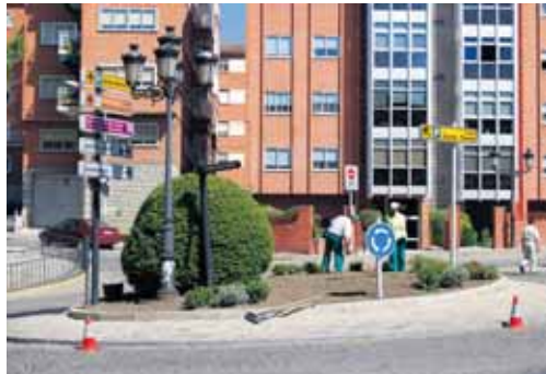
La tasa de paro descendió un 2,66 por ciento en junio.

En el sector Servicios el paro disminuyó en 227 personas, 121 en Construcción, en Industria 46 y 30 en Agricultura.