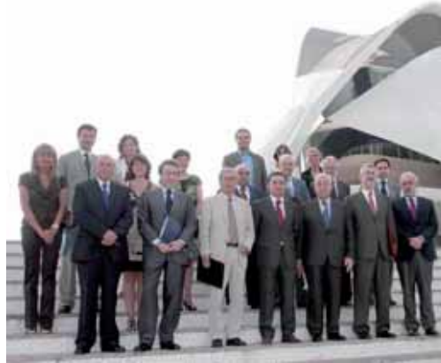
Los integrantes en el IV Encuentro en la Ciudad de la Ciencia (Valencia).

En este mismo sentido, el consejero de la Presidencia ha insistido en que "mientras nadie diga lo contrario, el Gobierno de la Nación tiene que conseguir no sólo una financiación suficiente y solidaria que permita el ejercicio de las competencias de manera adecuada y con calidad sino también promover adecuadamente los criterios que cada norma autonómica recoge en