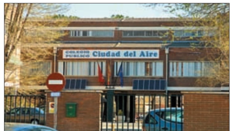
Colegio Público Ciudad del Aire