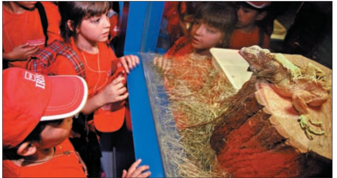
Los niños visitaron los animales del Exotarium

La Escuela quiere prolongar las actuaciones de socialización