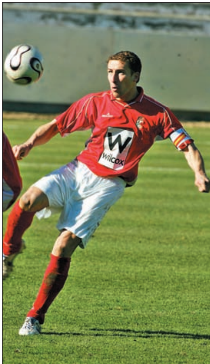
El Alcalá ha firmado una temporada extraordinaria