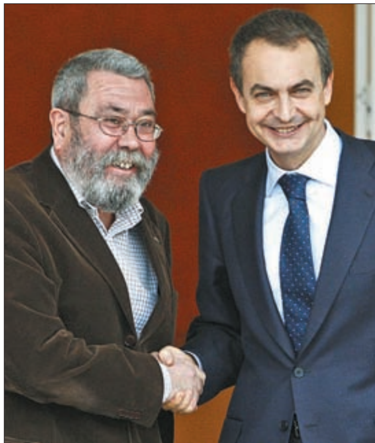
Zapatero y Méndez en una imagen de archivo que puede repetirse