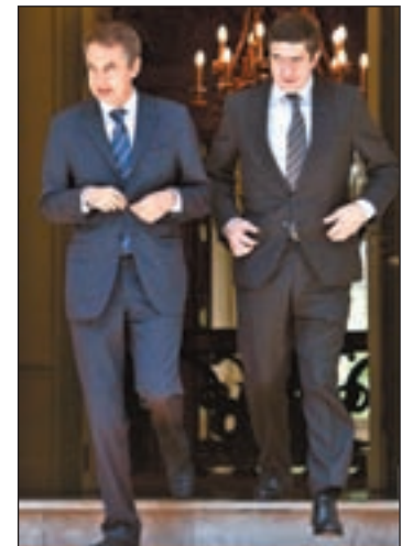
Zapatero y López en Moncloa

Hubo otros temas en la reunión celebrada en Moncloa. La crisis económica y sus posibles