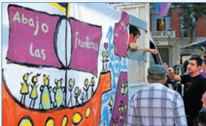
La asamblea se manifestó el pasado fin de semana

Sin embargo, este año la reivindicación del colectivo gay ha pasado a un segundo plano tras el anuncio, y la posterior rectificación, de que las fiestas se celebrarían fuera de Chueca el