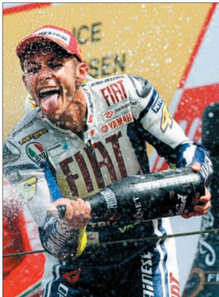
Valentino Rossi, en el podio del circuito de Assen

De este modo llega el Mundial de Moto GP al circuito norteamericano de Laguna Seca, uno de los trazados más particulares de todo el campeonato. El famoso 'sacacorchos' es uno de los puntos que más gustan a los aficionados al motociclismo, que todavía recuerdan el espectacular adelantamiento que realizó Valentino Rossi ante el australiano Casey Stoner. El italiano llegó a salirse fuera del asfalto con su Yamaha para consolidar una maniobra que dejó muy tocado mentalmente a Stoner. Rossi acabó ganando esa carrera y se lanzó de manera fulgurante hacia su octavo campeonato del mundo.