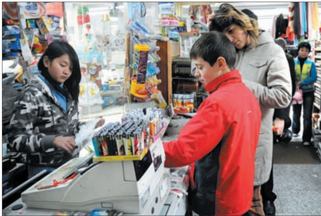
Personas comprando en un bazar chino

Esta iniciativa pretende reorganizar y ampliar las líneas de autobuses alcalaínas para que los vecinos no paguen dos veces y para que se aumente la frecuencia de las más demandadas. IU pide consenso entre el Equipo de Gobierno y el PP de la Comunidad para que se solucione esta "demanda vecinal avalada por miles de firmas".