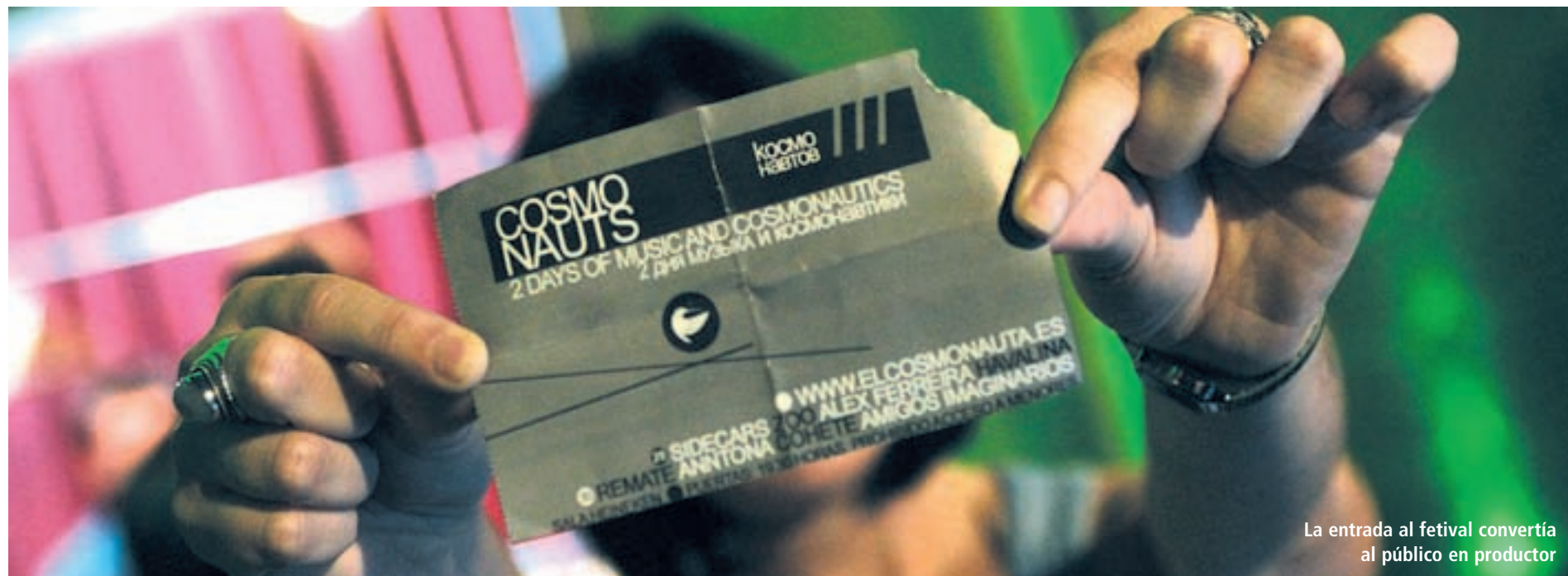
La entrada al festival convertía al público en productor