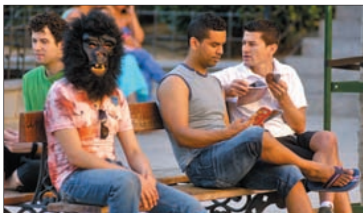
Uno de las personas disfrazada con careta de gorila

Cuarenta años después, un ejército de gorilas intentó rendir un homenaje a la fuerza y valentía de homosexuales y transexuales en la revuelta de Stonewall. Ataviados con caretas, asaltaron el centro de Madrid con una escenificación de la coexistencia del colectivo con la falsa moral.