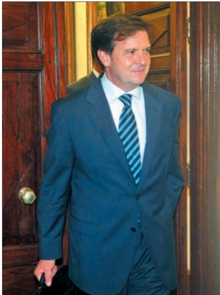
Alberto Saiz, tras su comparecencia en una Comisión en el Congreso

Alberto Saiz ha dimitido como director del CNI. Tras las polémicas suscitadas por presuntas malas praxis en el cargo, Saiz ha afirmado que "tras un proceso de reflexión serena y profunda" ha presentado su cese ante el presidente Zapatero ya que de continuar podría acabar perjudicando la imagen del Gobierno de España "al que he servido lealmente". Del mismo modo, Alberto Saiz argumenta en un comunicado remitido a la prensa, que su salida del CNI ayudará a evitar un posible deterioro del funcionamiento del centro, "una cuestión que por responsabilidad con la institución y sus trabajadores y por su compromiso con la seguridad de los españoles no puede permitirse". En el mismo escrito el ya ex director del CNI afirma haber sufrido un "desgaste personal debido a la campaña mediática dirigida contra su honor y prestigio personal y profesional", al tiempo que insiste en reiterar "la falsedad de las acusaciones de las que ha sido objeto en los últimos meses".