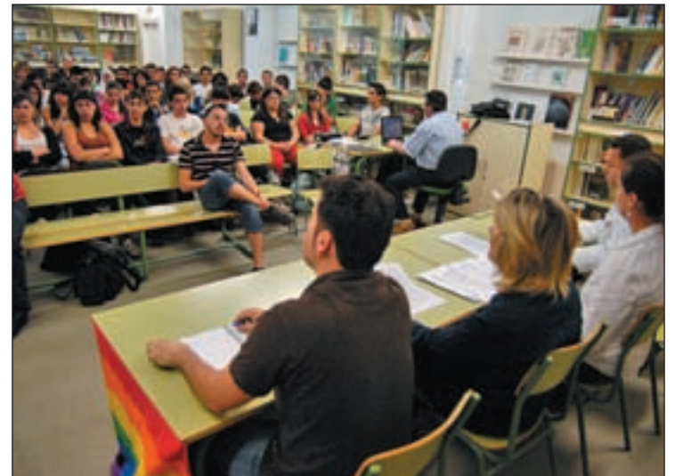
Alumnos del IES Duque de Rivas en una de las jornadas OLMO GONZÁLEZ