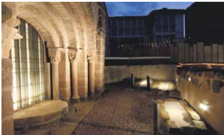
Iglesia románica Santa María la Mayor en Cillamayor, Palencia.

Aguilar de Campoó La Fundación Santa María la Real tiene su centro de estudios del Románico en la localidad palentina de Aguilar de Campoó. El monasterio que el rey Alfonso VIII entregó en 1169 se restauró y en la actualidad es el centro de documentación del Románico más importante de España.