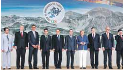
Encuentro de líderes mundiales en la cumbre del G-8.

España entra en la cumbre de los grandes, pero como invitada. Y participa en los encuentros, aunque no en todos. Por primera vez, España acude como país, y con el único antecedente de las asistencias del ex presidente José María Aznar, que fue invitado cuando España ostentaba la presidencia de la Unión Europea. El presidente del Gobierno, José Luis Rodríguez Zapatero, llevaba esta semana al encuentro de los ocho países más industrializados del mundo dos ideas, como anunció antes de desplazarse hasta L'Aquila, en Italia. Instar a la cooperación y apostar por las energías renovables. El presidente tenía varias ocasiones para expo-