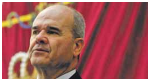
Manuel Chaves, en un acto el jueves en Leganés.

Consejo de Política Fiscal y Financiera en lo que se cierran los acuerdos. Chaves reconoció que "la tensión en el proceso de negociación" se incrementa conforme se acerca el consejo, porque "hay que integrar muchos intereses".