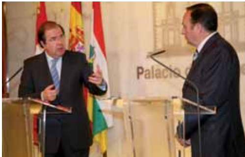
Juan Vicente Herrera y Pedro Sanz durante la rueda de prensa conjunta.

El lunes fue el turno para Galicia. Alberto Núñez Feijóo visitó Valladolid para reclamar un modelo de financiación "sin privilegios" y "basado en el coste real de los servicios y no en el censo de población". Herrera y Feijóo fijaron 18