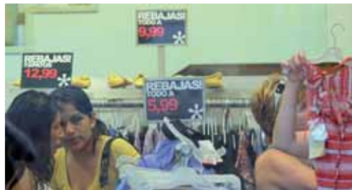
Consumidores en un establecimiento en rebajas de la capital palentina.

Desde la UCE de Palencia recuerdan a los comerciantes que la duración de la temporada de promoción de ventas debe exhibirse en lugar visible, que es preciso señalar claramente el precio habitual junto al reducido y que cuando se aplique la misma reducción porcentual a un conjunto de artículos podrá realizarse con el anuncio genérico de la misma sin necesidad de que conste individualmente en cada artículo. Respecto a la hora de fijar los periodos de rebajas, que pueden ser elegidos libremente por los comerciantes según la Ley de Comercio de Castilla y León, 74 de los 187 establecimientos estudiados lo han fijado desde el 1 de