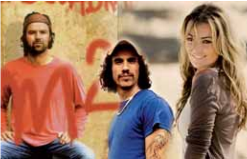
Este año habrá menos conciertos por la reducción del presupuesto.

Las fiestas comenzarán el 27 de agosto con el Pregón Literario y concluirán el 5 de septiembre con el Día del Palentino Ausente