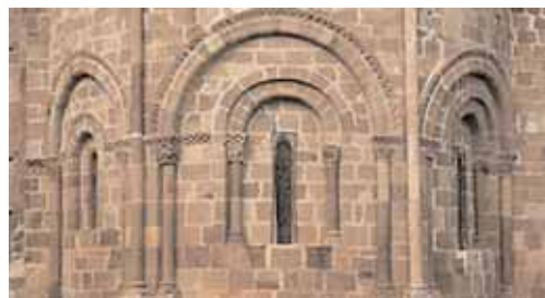
Colegiata de San Martín de Elines, Cantabria.

con fuerza. En España lugares de culto y catedrales serán durante los siglos XI, XII, XIII y hasta el XVI únicas en el mundo. Hay una fidelidad a la ejecución de figuras, animales... de tamaño real o gigantes. Bóvedas de medio cañón en los templos, volúmenes contundentes y sobrios. En Burgos, Palencia y al sur de Cantabria hay templos que merecen un Sello de Patrimonio Europeo.