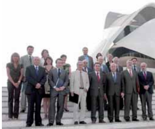
Los integrantes en el IV Encuentro en la Ciudad de la Ciencia (Valencia).

En este mismo sentido, el consejero de la Presidencia ha insistido en que "mientras nadie diga lo contrario, el Gobierno de la Nación tiene que conseguir no sólo una financiación suficiente y solidaria que permita el ejercicio de las competencias de manera adecuada y con calidad sino también promover adecuadamente los criterios que cada norma autonómica recoge en