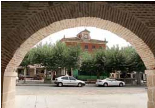
Imagen de archivo del municipio palentino de Herrera de Pisuerga.

Dos Ferias que sin duda empezarán abrir boca a los visitantes de cara a la llegada del Festival de Exaltación del Cangrejo de Río de Herrera de Pisuerga, declarado de Interés Turístico Regional.