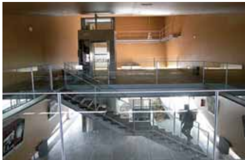
Imagen del interior del nuevo centro construido en Revilla de Pomar.

ha sido realizado en acero corten. Un material que se adecua a las condiciones cromáticas ocres dominantes de la zona.