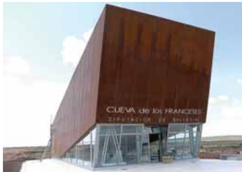
Imagen del exterior del Centro de Recepción de Visitantes de la Cueva.

Otro detalle sobre esta infraestructura es que el revestimiento