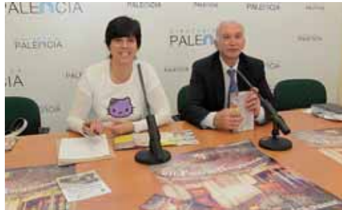
Momento de la presentación de la Feria de Antigüedades de Carrión.

Por otro lado, y debido a la amplia demanda existente, que ha obligado en ediciones precedentes a rechazar más de una veintena de solicitudes, ha llevado al Consistorio carrionés a buscar alguna fórmula que permita incrementar el número de exposi-