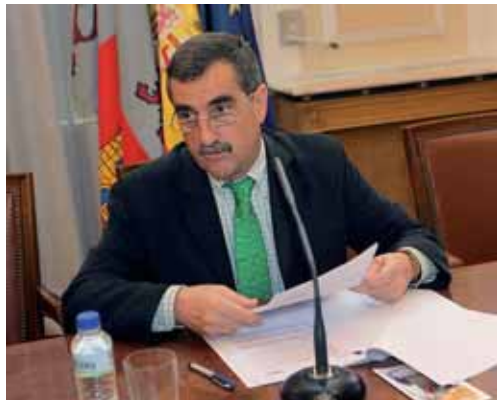
El subdelegado del Gobierno en Palencia, Raúl Ruiz Cortes.

Ya en Aguilar de Campoo, el Plan de actuación se llevará a cabo en el casco urbano, el polígono industrial así como en la zona de industrias y establecimientos ubicados en las inmediaciones de la carretera de Villallano y la zona del pantano.