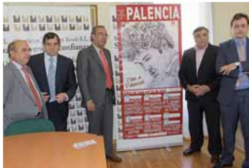
Un momento de la presentación del cartel taurino de San Antolín 2009.