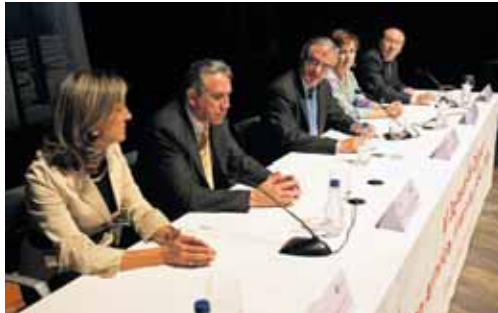
El consejero de Sanidad, en la inauguración de las Jornadas.

En el transcurso de estas jornadas se entregan el Sello Excelencia Europea 400+ al centro de salud 'Soria norte' y el Sello Calidad Euro-