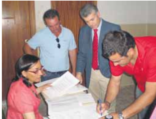
Firma en Fontiveros del Plan de Convergencia Interior de La Moraña.

A lo largo de la semana, se firmaron igualmente los convenios con todos los ayuntamientos de la Sierra de Ávila y también de la