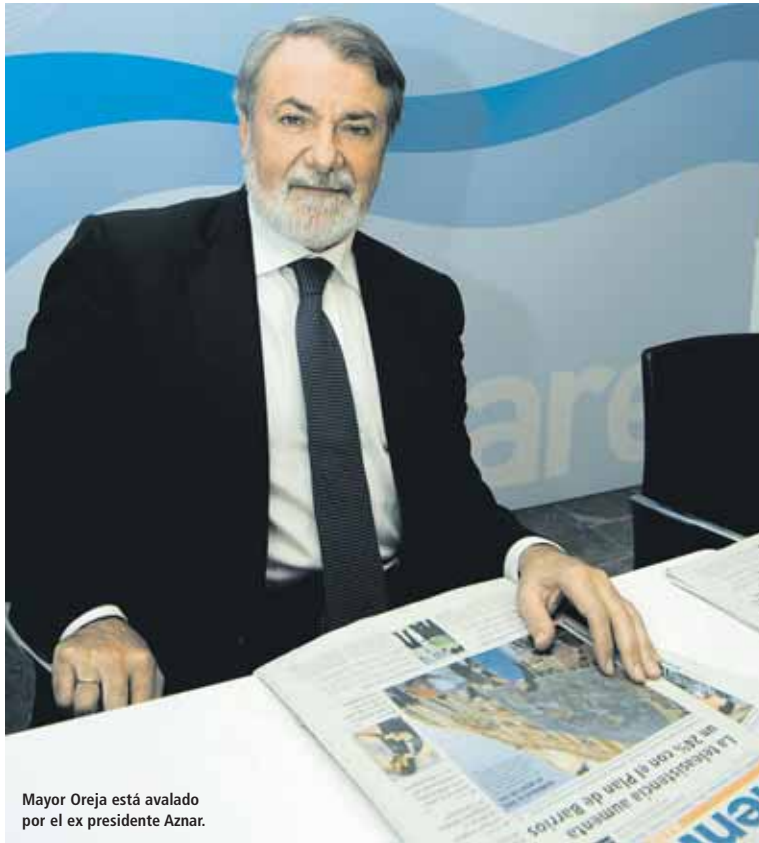
Mayor Oreja está avalado por el ex presidente Aznar.

“Nosotros apostamos por las familias, por la Educación, por políticas que no se instalen en la crisis económica como ha hecho Rodríguez Zapatero”