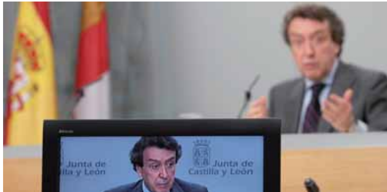
José Antonio de Santiago-Juárez durante una rueda de prensa posterior al Consejo de Gobierno de la Junta.

La ayuda se reparte de la siguiente manera: 82,84 millones de euros irán destinados al área de servicios sociales básicos; al área de actuaciones destinadas a personas dependientes, la Junta dedicará 3.089 millones de euros y, por último, la ayuda destinada a la inclusión social alcanza los 3,8 millones de euros. Finalmente, el área de acción social, recibirá 1,24 millones y la financiación del área de personas con discapacidad alcanzará los 2,03 millones de euros.