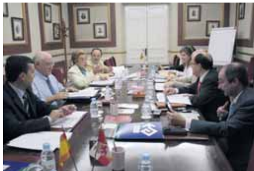
Comisión de Seguimiento de la Ventanilla Única Empresarial.

Desde su puesta en marcha en 2002, la VUE, ubicada en la Cámara Oficial de Comercio e Industria de Ávila, ha ayudado a crear un total de 1.217 empresas.