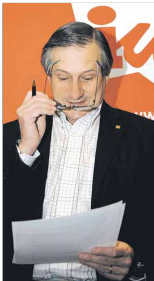
Willy Meyer, candidato de Izquierda Unida al Europarlamento.

Existe un cierto desconocimiento de lo que se decide en la UE, se percibe como algo lejano. Hay que explicar que este hecho es buscado. El Consejo aprueba muchas veces con noc-