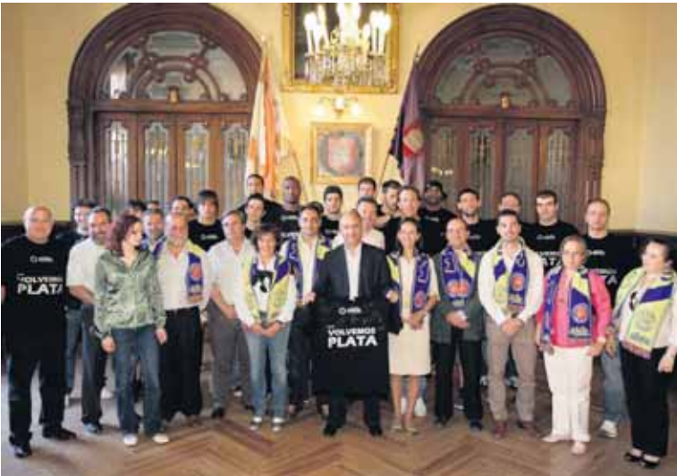
Jugadores y equipo técnico del Matchmind posan en el salón de plenos con miembros de la corporación municipal.

EL MATCHMIND CARREFOUR EL BULEVAR CELEBRA SU ASCENSO A LA LEB PLATA