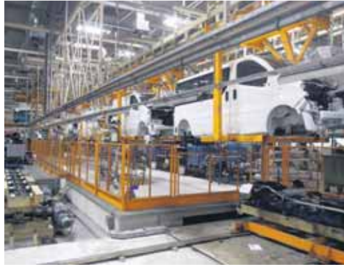
Las nuevas tecnologías de seguridad en automoción son el eje del Foro.

Con este objetivo, los responsables del I Foro Ávila han elaborado