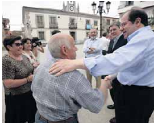
Juan Vicente Herrera saluda a los vecinos de Navalperal de Pinares.

Un día antes del cierre de campaña, Ávila acogió, como en días anteriores, diversos actos electorales. El presidente del PP de Castilla y León, Juan Vicente Herrera, aseguró en un mitin en Sotillo de la Adrada tras advertir de la "falta de coraje" del PSOE para negociar en Europa los intereses de los agricultores