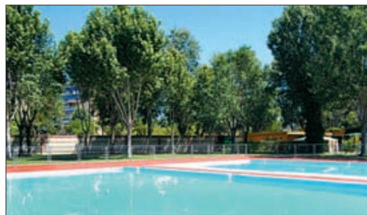
Una de las piscinas municipales

Las tres instalaciones con piscinas de verano registraron 79.262 usuarios el año pasado.