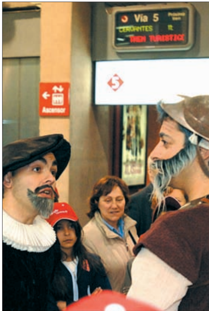
‘Don Quijote’, dispuesto a viajar hasta Alcalá