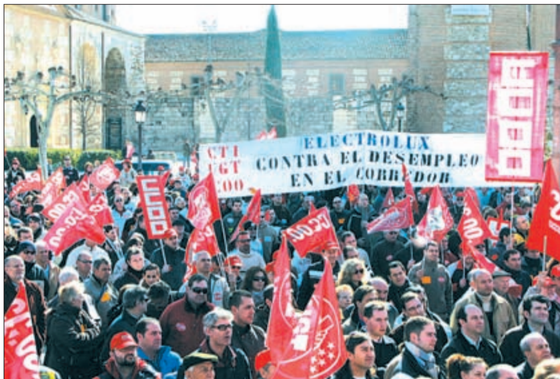
Manifestación de los trabajadores de Electrolux en febrero del presente año

EN LA FÁBRICA DE ALCALÁ TRABAJAN MÁS DE CUATROCIENTOS EMPLEADOS