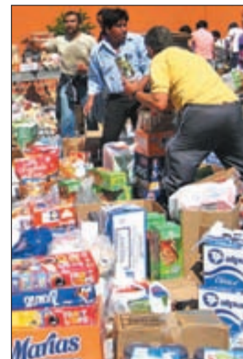
Voluntarios repartiendo alimentos