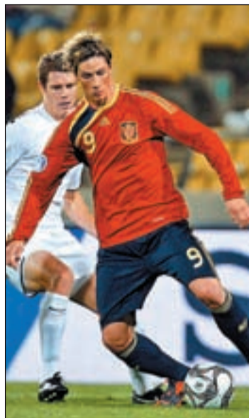
España continúa enrachada

España lidera su grupo de clasificación para el Mundial con autoridad ya que suma seis