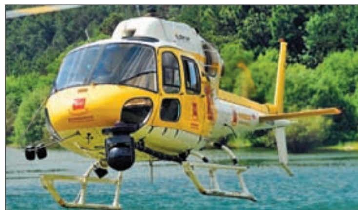
Helicóptero del programa para prevenir incendios

ción de incendios y el dispositivo contará con 2.589 profesionales, 659 vehículos y diez helicópteros. El nuevo helicóptero vigía podrá posicionarse en unos minutos en la zona del incendio y obtener imágenes que sirvan para tomar decisiones en la gestión del suceso.