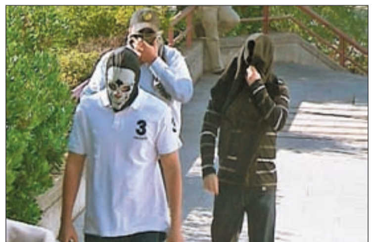
Tres de los quince acusados entrando en la Audiencia

El fiscal solicita para los 15 procesados penas de entre seis y tres años de prisión por tenencia ilícita de armas y asociación ilícita, mientras que el Movimiento contra la Intolerancia pide entre cinco y seis años de cárcel. A los acusados se les detuvo en 2004 en la denominada ‘Operación Puñal’, que se basó en los datos obtenidos en las escuchas telefónicas, en los registros de las viviendas y en la información aportada por el