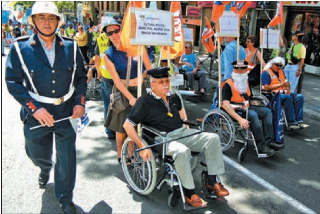
Algunos agentes participaron en la protesta disfrazándose de ancianos

En un ambiente festivo en el que destacaban policías disfrazados de ancianos y grupos de go-gós, más de siete mil agentes, según los organizadores, y dos mil quinientos, según fuentes policiales, tomaron las calles entre la Glorieta de Carlos V y la Plaza Mayor convocados por una veintena de sindicatos agrupados en la Confederación de Seguridad Local (CSL) y la Coordinadora de Policías (COP) para reclamar una rebaja de cinco años en la jubilación.