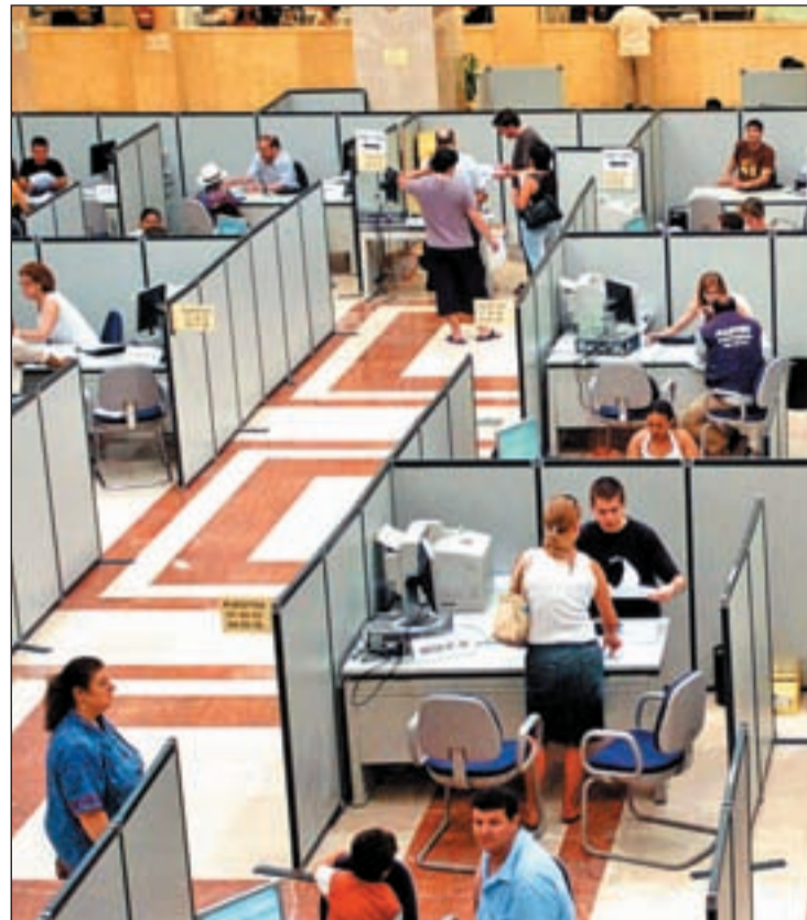
Oficina de Hacienda habilitada para la Declaración de la Renta