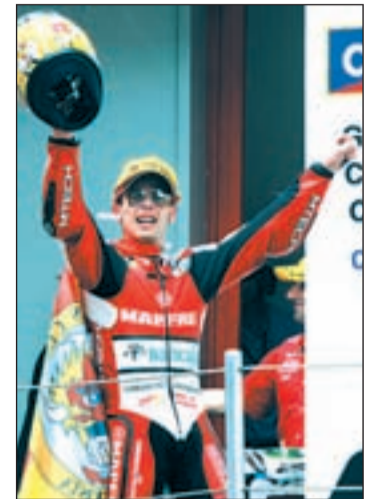
Bautista en el podio

Peor suerte corrió el actual campeón del mundo, el italiano Marco Simoncelli, quien sufrió una caída cuando apenas se habían completado tres vueltas del circuito catalán. Simoncelli volvió a la pista tras su paso por boxes, pero su moto no ter-