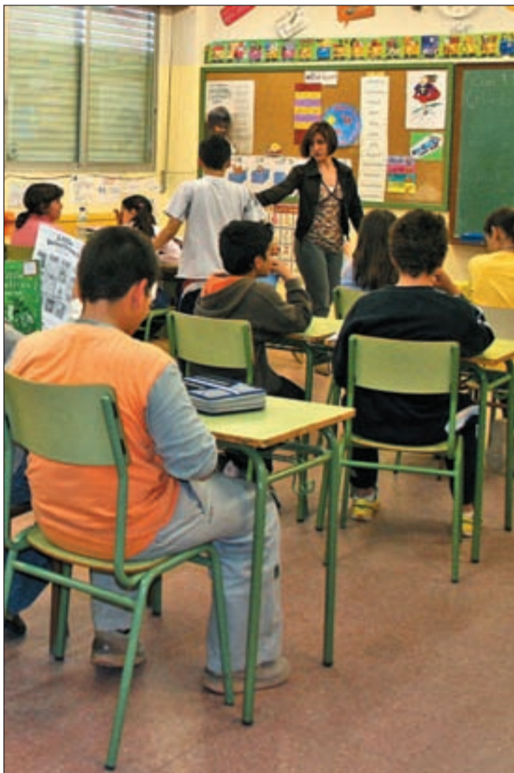
Aula de Educación Primaria

En general, los padres explican que en mayo no se había cumplido ni un tercio del temario y, cuando piden explicacio-