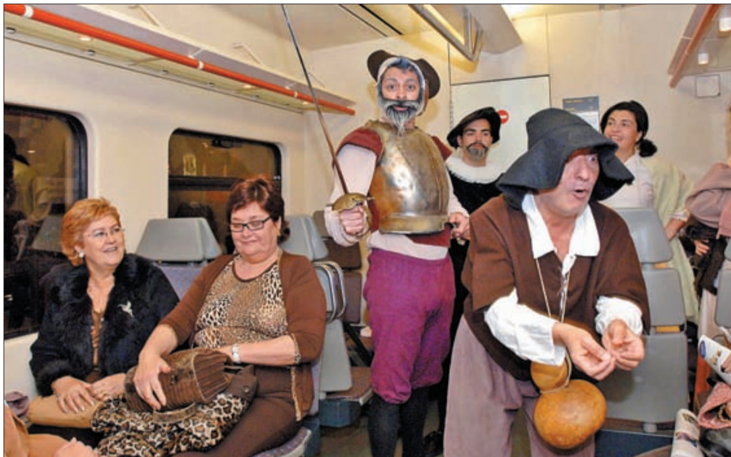
Varios actores durante la interpretación quijotesca en el Cercanías Turístico 'El Tren de Cervantes'