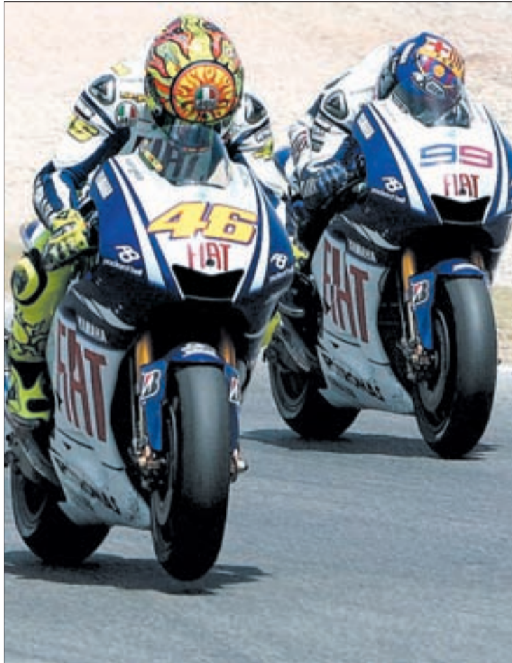
Valentino y Jorge lucharon codo con codo por la victoria final

La pole lograda por Lorenzo el día anterior le otorgaba, teóricamente, cierta ventaja sobre Rossi. De hecho, el piloto mallorquín dominó la carrera desde el principio, pero no logró despegarse de Valentino en ningún momento. Así se llegó a la última vuelta de la carrera en la que, ambos pilotos, protagonizaron un momento que pasará a la historia del motociclismo. Rossi adelantó a Lorenzo en la recta principal, pero éste